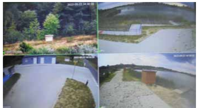
Przykładowy widok z kamer nad zbiornikiem w Lipowicy

- Po analizie monitoringu i wnikliwych czynnościach operacyjnych namierzyliśmy dwóch mieszkańców gminy Chęciny. W miejscu ich zamieszka-