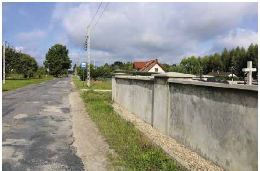
Już niebawem rozpocznie się przebudowa drogi Siedlce-Łukowa