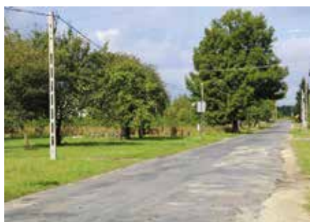
Jest pozwolenie na przebudowę najdroższej inwestycji drogowej Siedlce-Łukowa