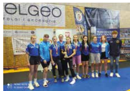
Zapaśnicy LKS Znicz Chęciny znowu górą