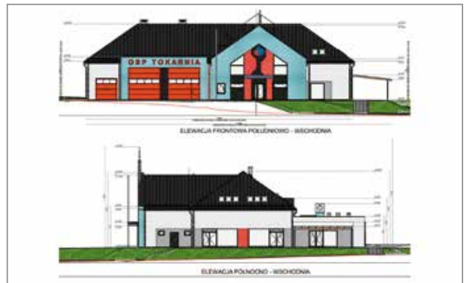
Projekt budynku nowej remizy i świetlicy w Tokarni

Dobiegło końca projektowanie obiektu. I tak, remiza ma mieć dwa garaże na wozy strażackie oraz pomieszczenia funkcjonalne takie jak: dyżurka, szatnie dla druhów, toalety i prysznice. Druhowie będą też mieć swoją salę spotkań. Obok będzie mieścić się świetlica wiejska wraz z zapleczem sanitarnym, aneksem kuchennym oraz trzema salami przeznaczonymi na różnego rodzaju zajęcia. Planowany budynek będzie spełniał obowiązujące przepisy pod względem oszczędności energii oraz wyposażony będzie w odna-