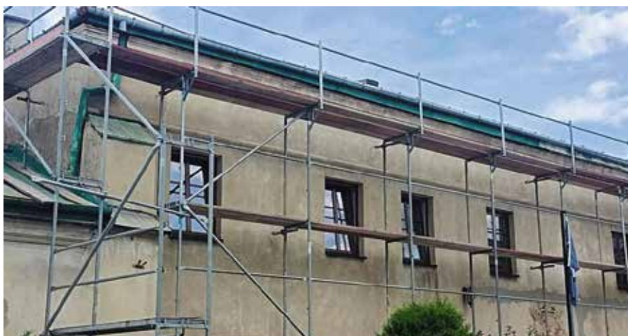
Prace przy wymianie dachu już ruszyły