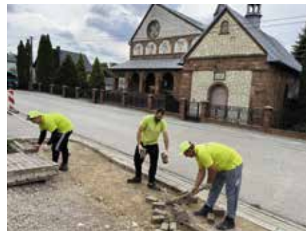
Trwają prace przy budowie bezpiecznego przejścia w Polichnie