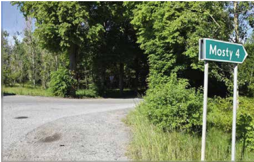
Rusza inwestycja w Mostach

N a tą inwestycję mieszkańcy Mostów długo czekali. Droga wjazdowa do miejscowości przejdzie kapitalny remont. Prace mają ruszyć dosłownie lada dzień. To inwestycja z wysokim rządowym dofinansowaniem.