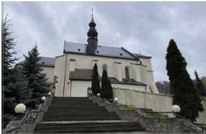
W kościele parafialnym będą nowe okna

Na tym jednak nie koniec. Dzięki wsparciu merytorycznym lokalnego samorządu parafia właśnie pozyskała kolejne środki unijne w kwocie blisko 312 tysięcy złotych, które tym razem przeznaczone zostaną na wymianę wszystkich okien w kościele, a także na budowę toalet. - Okna są w bardzo złym stanie i nie spełniają obecnych wymagań technicznych stawianych