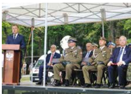
W Chęcinach uroczystość obchodząca Święto Wojska Polskiego