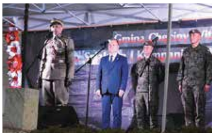
Uroczystość powitania Kadrówki na chęcińskim rynku

Kadrówka wyruszyła 6 sierpnia z krakowskich Oleandrów już po raz 57. (42. po wojnie). To właśnie tego dnia 108 lat temu rozkaz wymarszu wydany przez marszałka Józefa Piłsudskiego był symbolicznym momentem odrodzenia się Wojska Polskiego i wolnej Polski. Piechurzy rokrocznie pokonują trasę Kraków – Kielce przez Michałowice, Słomniki, Miechów, Wodzisław, Jędrzejów, Chojny nad Nidą, Chęciny i Szewce. Tegoroczny marsz pod hasłem „Bez 6 sierp-