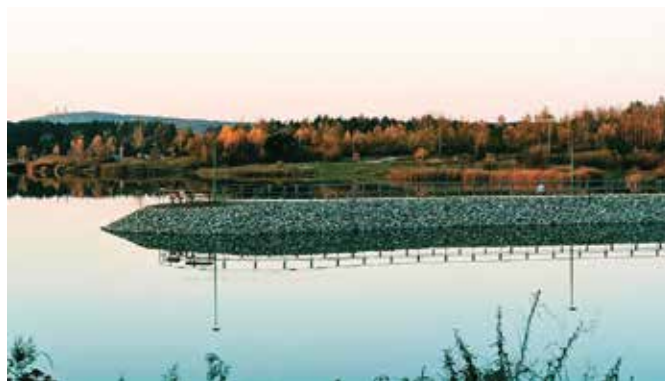
Zagospodarowanie zbiornika wodnego w Lipowicy