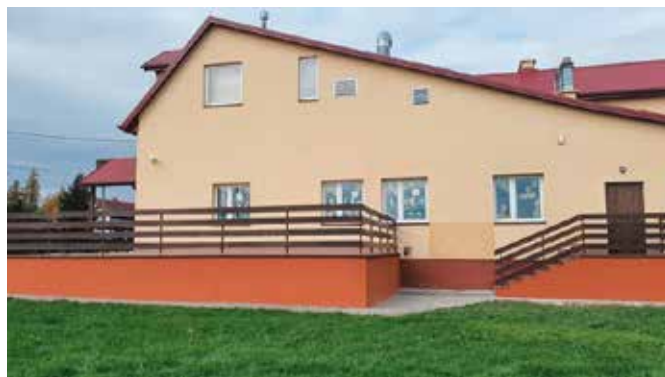
Na cokole przy budynku świetlicy położono nową strukturę i wykonano remont balustrady

Po zakończonych pracach remontowych w świetlicach w Miedziance, Wolicy, Czerwonej Górze i Tokarni przyszedł czas na remont cokołu i tarasu przy budynku świetlicy w Łukowej. W pierwszej kolejności skuto płytki elewacyjne z cokołów i wykonano nową wyprawę elewacyjną. W ramach prac wymieniono obróbkę blacharską i częściowo wymieniono płytki gresowe. Przy balustradzie wykonane zostały nowe uchwyty mocujące oraz zaimpregnowano deski. Ponadto naprawiono i zaimpregnowano trybuny przy boisku. Konieczność napraw wynikała z częstych aktów wandalizmu podczas, których łamane były deski i tłuczone płytki. Naprawione elementy są teraz estetyczne i bezpieczne w użytkowaniu. Wierzymy, że taki stan obiektu i otoczenia będzie już wspólnie poszanowany. Prace zostały