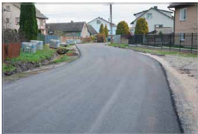
Budowa drogi w Łukowej w kierunku Wierzbicy