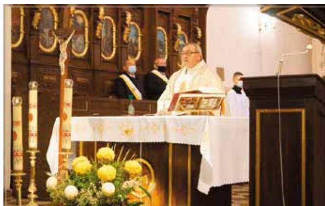
Msza Święta za Ojczyznę w Kościele Parafialnym w Chęcinach