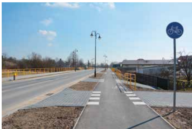
Aleja Marszałka Józefa Piłsudskiego w Chęcinach