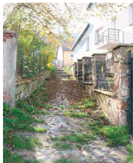
Niezagospodarowane skwery i uliczki w Chęcinach czeka kompleksowa rewitalizacja