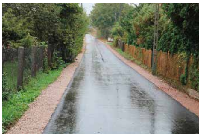
Droga w Siedlcach