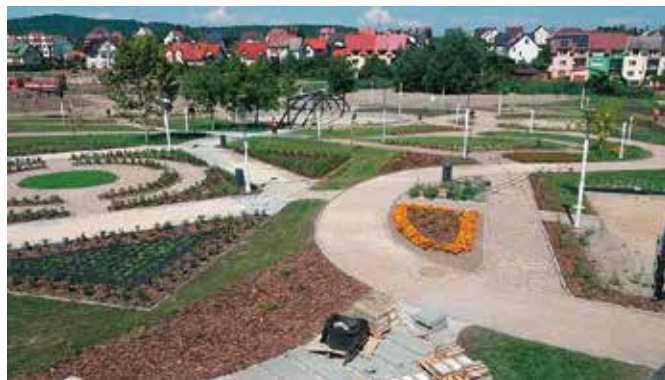
Budowa Parku Miejskiego