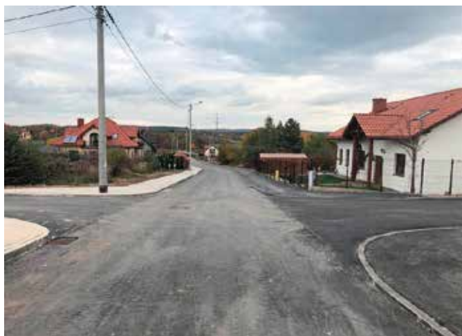
Budowa uliczek na Osiedlu w Chęcinach