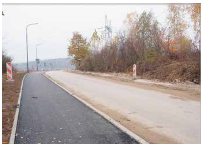
Budowa ścieżek rowerowych

Faktem jest, że prawie wszystkie zaplanowane w tym roku inwestycje doszły do skutku. Wiele z nich ruszyło już w ubiegłym roku, a ich realizacja jest kontynuowana w tym, jak chociażby budowa parku miejskiego w Chęcinach oraz dróg i ścieżek rowerowych. Na te inwestycje otrzymaliśmy znaczne środki zewnętrzne. Dużo realizowanych inwestycji dotyczy działań drogowych. - W tym roku ruszyła prawdziwa drogowa rewolucja na terenie naszej gminy, która będzie też kontynuowana w latach kolejnych. Na ten cel przeznaczaliśmy z budżetu w 2020 roku blisko 10 milionów złotych. Warto tu zaznaczyć, że koszty większości z realizowanych inwestycji drogowych pokrywa rządowe dofinansowanie pozyskane w ramach funduszu dróg samorządowych. Priorytetem jest również rozbudowa sieci wodociągowej i kanalizacyjnej – mówi Burmistrz, Robert Jaworski.