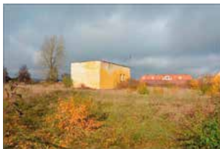
Ujęcie wody w Tokarni zostanie przebudowane

Stacja uzdatniania wody stanie w Tokarni, gdzie znajduje się ujęcie wody z ogromnym potencjałem. W latach 90-tych w wodzie z tego ujęcia zaobserwowano podwyższone stężenie azotanów. W ocenie wyda-