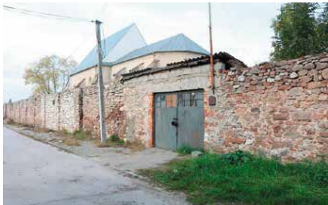
Udało się pozyskać środki na remont muru

Warto podkreślić, że Klasztor Franciszkanów wpisuje się w całą historię i tradycję miasta Chęciny od XIV wieku. - Zespół Klasztorny Franciszkanów, w tym Kościół Podwyższenia Krzyża Świętego ma bogatą i burzliwą historię, która jest znana całej lokalnej społeczności identyfikującej się z tym