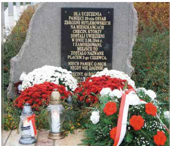
102. rocznica odzyskania przez Polskę niepodległości

Nie było jak zazwyczaj tłumów mieszkańców, zabrakło też wspólnego śpiewania pieśni patriotycznych i tradycyjnego koncertu, ale nie zabrakło ducha patriotyzmu przywołującego pamięć o bohaterach polskiej niepodległości. W tym roku Narodowe Święto Niepodległości w Chęcinach uczczono wyjątkowo skromnie i symbolicznie.