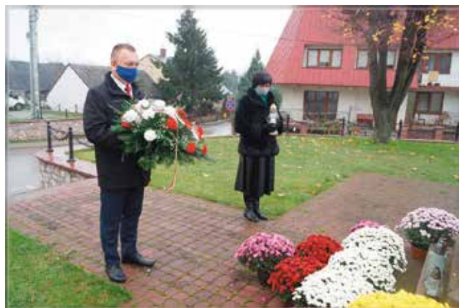
Złożenie wiązanki pod pomnikiem przy ul. Małogoskiej w Chęcinach

- Choć składając kwiaty przy pomnikach i oddając cześć pamięci bohaterów byliśmy dziś sami, to jestem przekonany, że nie samotni. Mieszkańcy oddali hołd tym, którzy za naszą wolność przelali krew składając na ołtarzu historii swoje życie poprzez wywieszenie biało-czerwonych flag, za co wszystkim serdecznie dziękuję. W dobie panującej epidemii wyrazem patriotyzmu i odpowiedzialności za drugiego człowieka jest pozostanie w domach. I tak jak w najtrudniejszych czasach naszej historii nasz naród jednoczył się i wierzył w zwycięstwo, w wolność i niepodległość, tak i dziś jednocząc się duchem wierzymy, że ta wolność w końcu nadejdzie i wygramy walkę z niewidzialnym wrogiem. Wierzę, że przyjdzie w końcu dzień, kiedy znów będzie-