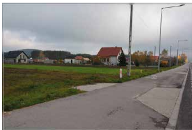
W Korzecku będzie rozbudowywana sieć wodociągowa

Do ogłoszonego przez gminę przetargu na wykonanie wykonawcy inwestycji zgłosiło się pięć