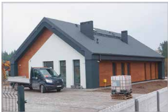
Budowa świetlicy w Lipowicy