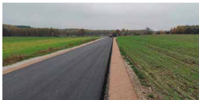
Budowa drogi Łukowa-Gajówka

westycji, które przecież muszą być dopilnowane. Na tym jednak nie koniec. Cały czas intensywnie pracujemy nad rozliczaniem unijnych projektów i pozyskiwaniem kolejnych środków zewnętrznych. Wciąż piszemy nowe wnioski, dzięki którym możemy aplikować o pozyskanie środków rządowych i unijnych. Do tego dochodzą bieżące sprawy, których rozwiązywanie niejednokrotnie trzeba bardzo szybko dostosować do nieustannie wprowadzanych zmian. Musimy przecież nadal zapewniać mieszkańcom podstawowe, a w normalnych okolicznościach wydawałoby się nawet prozaiczne potrzeby, jak odbiór śmieci, dostęp do bieżącej wody, sprawność systemów wodno-kanalizacyjnych, systemów