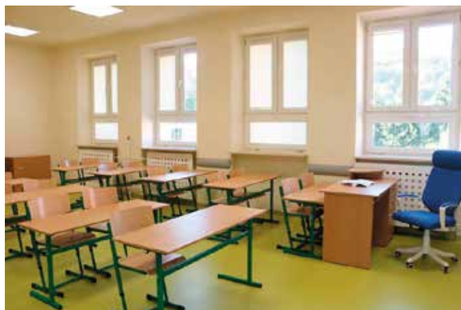
I etap remontu SP w Chęcinach