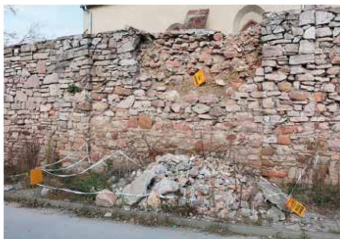
Mur przy Klasztorze Franciszkanów wymaga szybkiego remontu

Mur otaczający Klasztor Franciszkanów od strony ul. Floriańskiej jest już w bardzo złym stanie. Obecnie nie tylko wpływa na zły wizerunek mia-