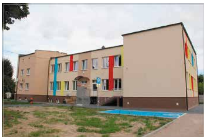
Kompleksowy remont SP w Wolicy