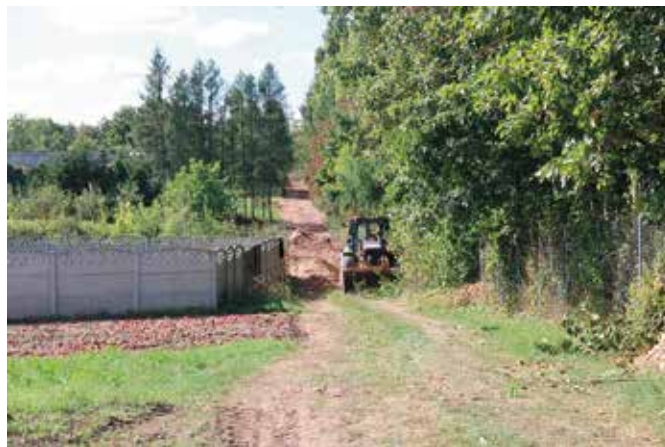
Rozbudowa sieci wodociągowej w Tokarni

Intensywnie trwają prace projektowe budowy przedszkola i żłobka w Siedlcach oraz hali sportowej w Bolminie. Na tym jednak nie koniec. Trwa rozbudowa sieci kanalizacyjnej na Osiedlu Zelejowa oraz sieci wodociągowej w Tokarni, Korzecku, Polichnie i Łukowej. Kolejne projektowane są w Ostrowie i Ostrowie Wymysłowie. Projektowana jest także dalsza rozbudowa sieci kanalizacyjnej