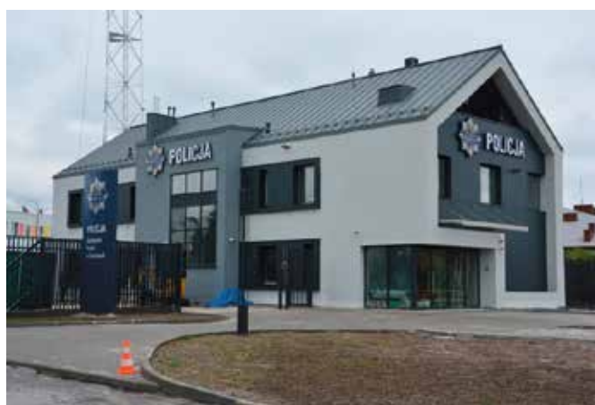
Budowa nowego komisariatu policji