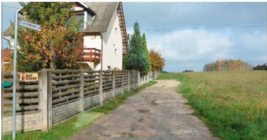
Jest już wykonawca budowy drogi na ul. Chęcińskiej

To już pewne. Zapowiadana budowa ulicy Chęcińskiej w Wolicy nareszcie stanie się faktem. Właśnie wyłoniono wykonawcę zadania i podpisano z nim umowę, zgodnie z którą nowa droga powstanie tu do końca lipca 2021 roku. Inwestycja pozwoli na uruchomienie kolejnych pięknych terenów inwestycyjnych, a co za tym idzie na dalszy rozwój miejscowości.