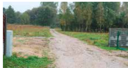
Niebawem rozpoczną się prace przy budowie wodociągu w Łukowej

Na tym jednak nie koniec prac związanych z rozbudową sieci wodociągowej na terenie Gminy i Miasta Chęciny. Mieszkańcy Łukowej, Korzecka i Polichna już wkrótce mogą również spodziewać się rozpoczęcia robót budowlanych w swojej okolicy. W miejscowości Łukowa zaplanowano budowę nowego wodociągu w drodze 340 na długości 700 metrów. Prace mają ruszyć tu lada dzień, a przeprowadzi je Zakład Gospodarki Komunalnej w Chęcinach, który w pierwszym etapie wybuduje około 100 metrów nowego wodociągu. Niebawem ruszy też budowa połączenia istniejącej sieci wodociągowej w miejscowości Korzecko wzdłuż drogi wojewódzkiej. Gmina już ogłosiła przetarg na realizację zadania i właśnie jest na etapie wyłonienia wykonawcy. W tym roku będzie również budowa wodociągu w Polichnie w dwóch miejscach. Staramy