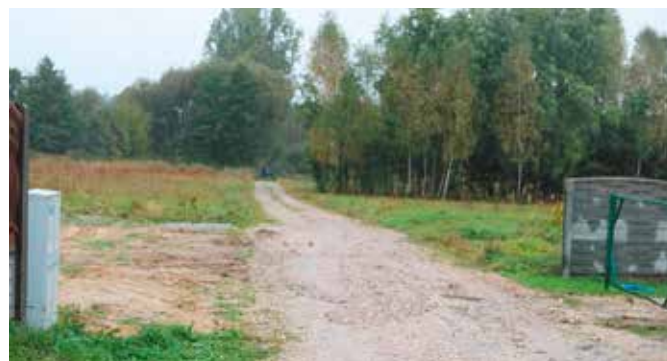
Rozbudowa sieci wodociągowej

Trwa budowa sieci wodociągowej w Tokarni. Tutaj prace mają zakończyć się już w listopadzie, a znaczną część ich kosztów pokryje pozyskane przez władze gminy unijne dofinansowanie. Na tym jednak nie koniec. Jeszcze w tym roku ruszy budowa nowych wodociągów w Łukowej, Korzecku i Polichnie.