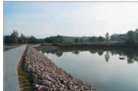
Zalew w Lipowicy będzie ciekawym miejscem dydaktyczno-rekreacyjnym