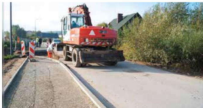
Ścieżki rowerowe cieszą się ogromną popularnością wśród amatorów jednośladow