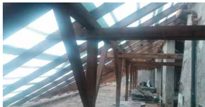
Do końca br. ma potrwać wymiana dachu na tzw. "Hotelowcu"