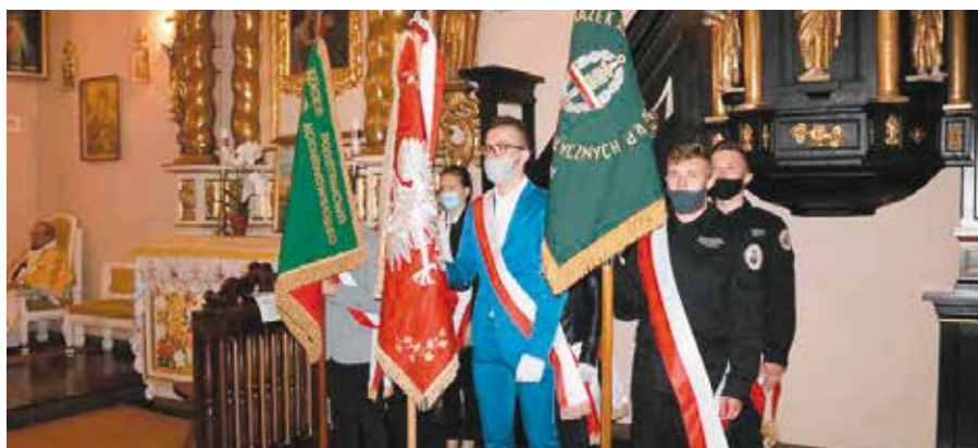
W uroczystościach religijno-patriotycznych wzięli udział samorządowcy, dyrektorzy szkół i uczniowie