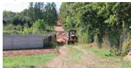
Budowa wodociągu w Tokarni

Warto dodać, że budowa wodociągu w Tokarni jest jedną z dwóch części dużego projektu, na który władze gminy Chęciny pozyskały unijne dofinansowanie w ramach Programu Rozwoju Obszarów Wiejskich na lata 2014-2020. – Blisko dwa