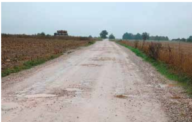
Droga Łukowa-Gajówka niebawem zostanie przebudowana

Wszystko wskazuje na to, że droga na odcinku Łukowa-Gajówka zostanie dokończona jeszcze w tym roku. Gmina jest obecnie na etapie wylaniania wykonawcy. Będzie to ostatni etap drogi budowy tej drogi.