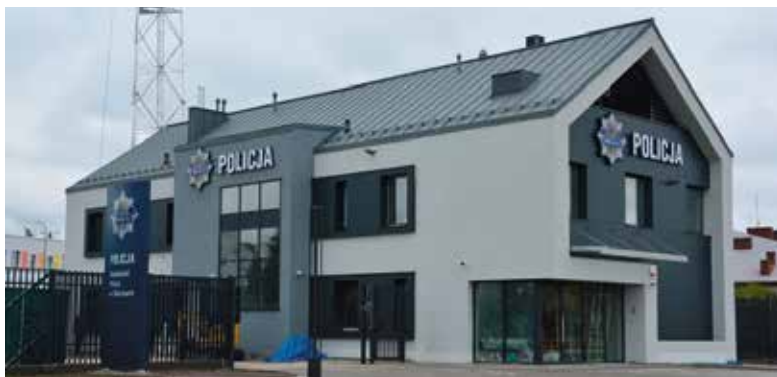
Nowa siedziba policji już prawie gotowa