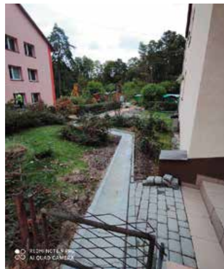
Nowy ciąg pieszy. Wykonany chodnik w Czerwonej Górze.