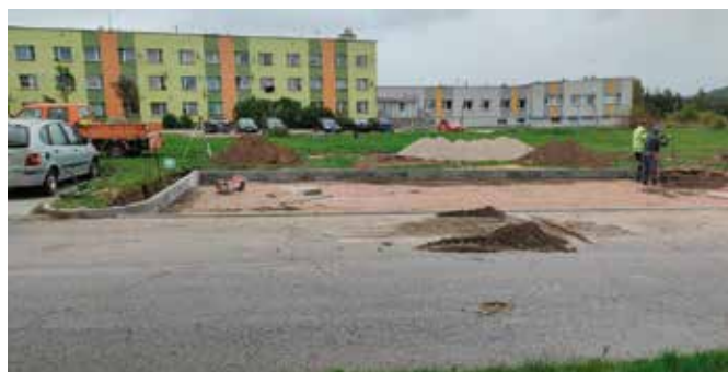
Trwa budowa miejsc postojowych