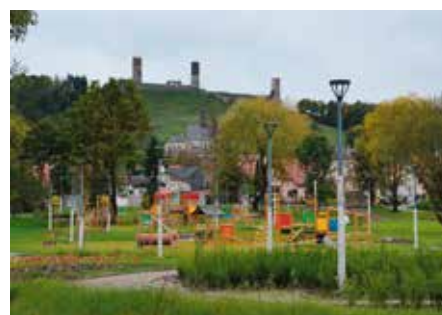
Kolorowy i bezpieczny plac zabaw będzie cieszył najmłodszych