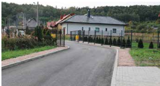
Ulica Wołodyjowskiego już gotowa

A te powoli dobiegają końca. Jako pierwsza do użytku została oddana ulica Wołodyjowskiego. Wybudowano tu nową nawierzchnię asfaltową o długości 228 metrów wraz z chodnikiem o tej samej długości. Inwestycja była zadaniem własnym gminy, a jej koszt opiewał na kwotę blisko 348 tysięcy złotych. Wszystkie prace przeprowadziła firma Trasbud Budownictwo ze Strawczyzna. - Ulica Wołodyjowskiego stanowi dopełnienie dużej inwestycji infrastrukturalnej, jaką w tym samym czasie prowadzimy na tym samym osiedlu przy ulicach Branickiego i Kazimierza Wielkiego w ramach pozyskanego rządowego i unijnego dofinansowania. Niestety, nie mogliśmy pozyskać dofinansowania również na ulicę Wołodyjowskiego ze względu na jej parametry, które nie mieściły się w kryteriach ogłoszonych konkursów rządowych. Niemniej jednak, podjęliśmy decyzję o wykonaniu również tej ulicy, tyle że ze środków gminnych. Zależało nam, aby cała infrastruktura drogowa na wszystkich osiedlowych ulicach w tej części gminy została zakończona jednocześnie – mówi burmistrz Gminy i Miasta Chęciny, Robert Jaworski.