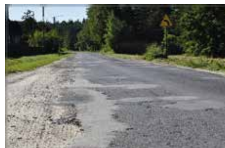
Nowa nawierzchnia poprawi nie tylko bezpieczeństwo, ale także estetykę miejscowości

Droga wjazdowa w Mostach nie była remontowana od lat. Teraz przejdzie całkowitą przemianę na długości nieco ponad 3,5 km. Wykonawcą generalnym inwestycji jest wyłoniona w drodze przetargu firma KOWEX. Koszt zadania opiewa na kwotę blisko 2,3 mln złotych, z czego prawie 1,4 mln złotych pokryje rządowe dofinansowanie z Rządowego