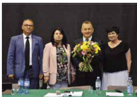
Burmistrz z jednoślonym wotum zaufania i absolutorium