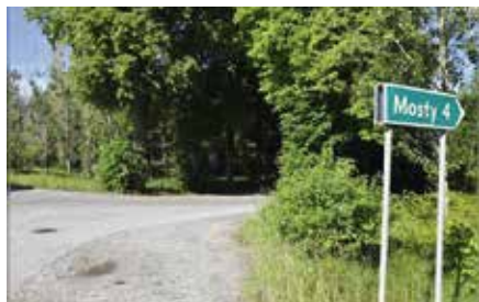
Droga w Mostach niebawem przejdzie gruntowy remont

Powiat Kielecki już wyłonił wykonawcę inwestycji, z którym umowa zostanie podpisana do słownie lada dzień. - Ze wstępnych rozmów wynika, że pierwsze prace ruszą jeszcze w te wakacje. Cieszę się, że wspólnie z gminą Chęciny