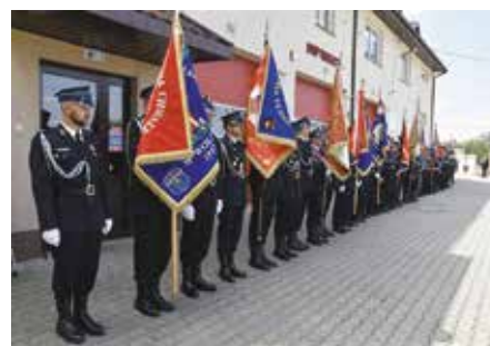
100-lecie OSP w Wolicy i gminne obchody Święta Strażaka