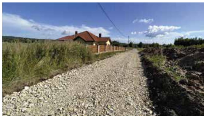
Powstaje nowa droga w Tokarni