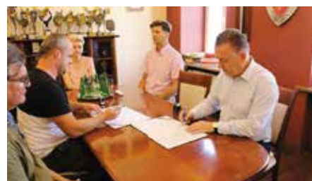
Porozumienie jest początkiem wspólnych projektów i inicjatyw