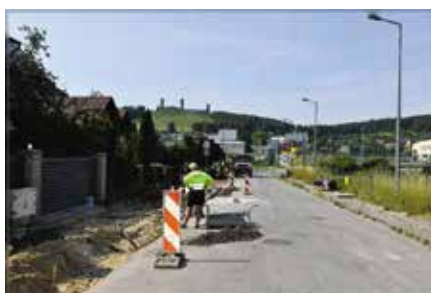
W Chęcinach coraz więcej ścieżek dla miłośników jednośladow

Sieć ścieżek na Osiedlu Północ została zaprojektowana tak, aby jak najmniej ingerowała w istniejące już ulice i drogi osiedlowe. Trakt ścieżek poprowadzono mało używanymi ciągami pieszymi na terenie Gminy Chęciny. Tym sposobem usystematyzowany zostanie ruch rowerowy w dużej mierze odseparowany od ruchu kołowego. To wpłynie na bezpieczeństwo przemieszczających się osób. Przypomnijmy, że w ramach tej dużej inwestycji powstały już ścieżki przy ulicach Branickiego i Kazimierza Wielkiego w Chęcinach. Przedsięwzięcie to jest możliwe, ponieważ gmina na realizację