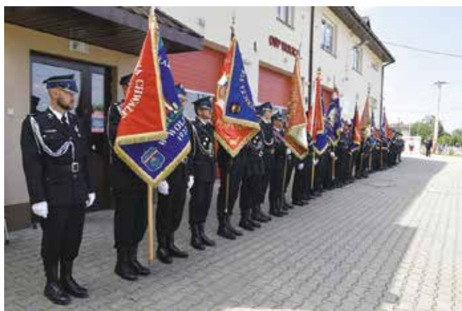
Obchody Święta Strażaka i 100-lecia OSP w W Wolicy