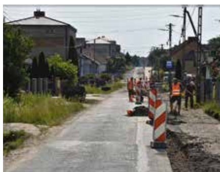
Prace przy budowie drogi

Na wykonanie inwestycji udało się pozyskać rządowe dofinansowanie w ramach Funduszu Dróg Samorządowych, które stanowi połowę kosztów całej inwestycji, po-