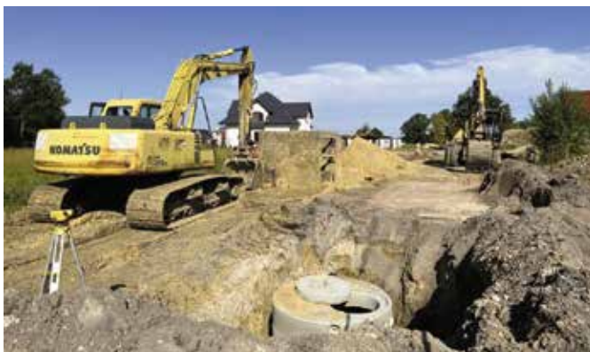
Trwa budowa drogi

sko 0,5 km, chodnik, ścieżka rowerowa oraz zjazdy do posesji. Projekt przewiduje także budowę energooszczędnego oświetlenia ulicznego typu LED. Planowane zakończenie prac to połowa listopada bieżącego roku.