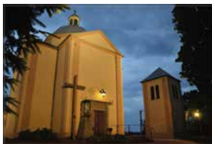
Iluminacja kościoła podkreśliła jego wyjątkowy charakter

Samorząd Gminy i Miasta Chęciny od lat angażuje się w odnowę zabytków, również tych sakralnych. Pomaga parafiom w przygotowaniu niezbędnej dokumentacji i pozyskiwaniu funduszy. Na ten cel, za pośrednictwem Lokalnej Grupy Dzia-