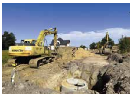
Zaawansowane prace przy budowie drogi na Osiedlu Skiby