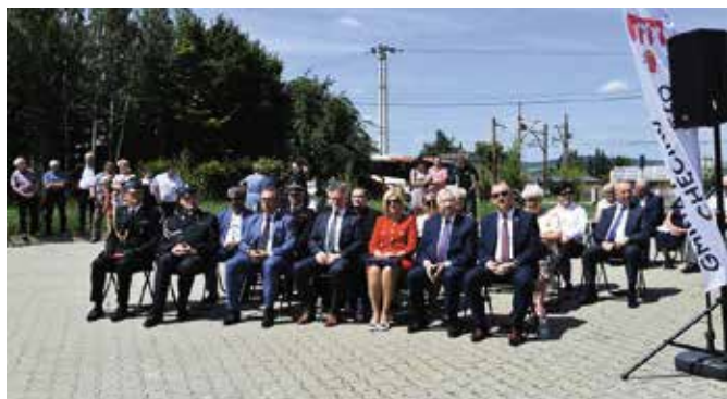
Wielu gości wzięło udział w uroczystości