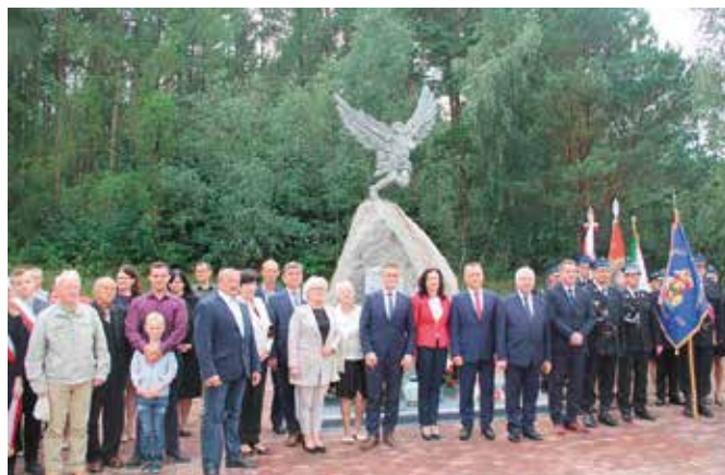
Uroczystości Pod Pomnikiem Lotników w Chęcinach

Wartę honorową obok monumentu pełniły poczty sztandarowe jednostek Ochotniczych Straży Pożarnych z Gminy Chęciny oraz uczniowie SP w Polichnie im. gen. Stanisława Skalskiego oraz SP w Chęcinach im. Jana Kochanowskiego. Patronat wielkiego bohatera nadano pla-