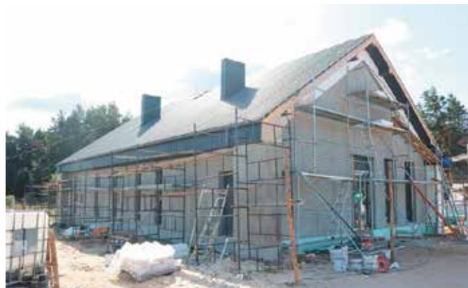
Coraz bliżej zakończenia prac przy budowie świetlicy w Lipowicy

Budynek ma być ogrzewany ekologicznym kondensacyjnym kotłem gazowym. Standard energetyczny obiektu będzie spełniał bardzo rygorystyczne normy, które mają