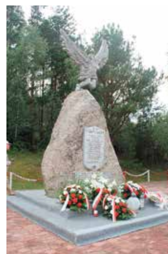
Pod Pomnikiem Lotników w Gościńcu zostały złożone wieńce i zapalono znicze

Choć w tym roku ze względu na panującą w kraju sytuację epidemiologiczną skromny, to mimo wszystko jak zawsze bardzo uroczysty charakter miały obchody związane z odbywającym się tu tradycyjnie Świętem Lotnictwa. Pod Pomnikiem Lotników w Gościńcu oddano hołd poległym polskim lotnikom. Wydarzenie zostało połączone z obchodami 81. rocznicy wybuchu II wojny światowej.