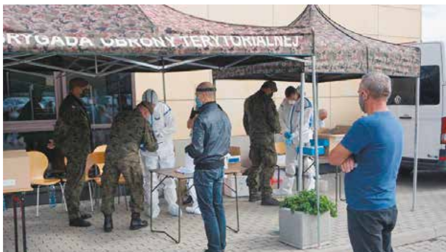
Przed rozpoczęciem nowego roku szkolnego nauczyciele i pracownicy oświaty przeszli testy na COVID

Ta informacja z całą pewnością ucieszy wszystkich zaniepokojonych funkcjonowaniem w nowym reżimie sanitarnym rodziców uczniów chęcińskich szkół i przedszkoli. Dosłownie dzień przed rozpoczęciem roku szkolnego pobrano wymazy w kierunku SARS-CoV-2 od wszystkich nauczycieli i obsługi placówek oświatowych z terenu Gminy i Miasta Chęciny. Już w nocy było wiadomo, że wszyscy są zdrowi. Akcja została przeprowadzona w ramach unijnego projektu „Stop wirusowi! Zapobieganie rozprzestrzeniania się COVID-19 w województwie świętokrzyskim”.