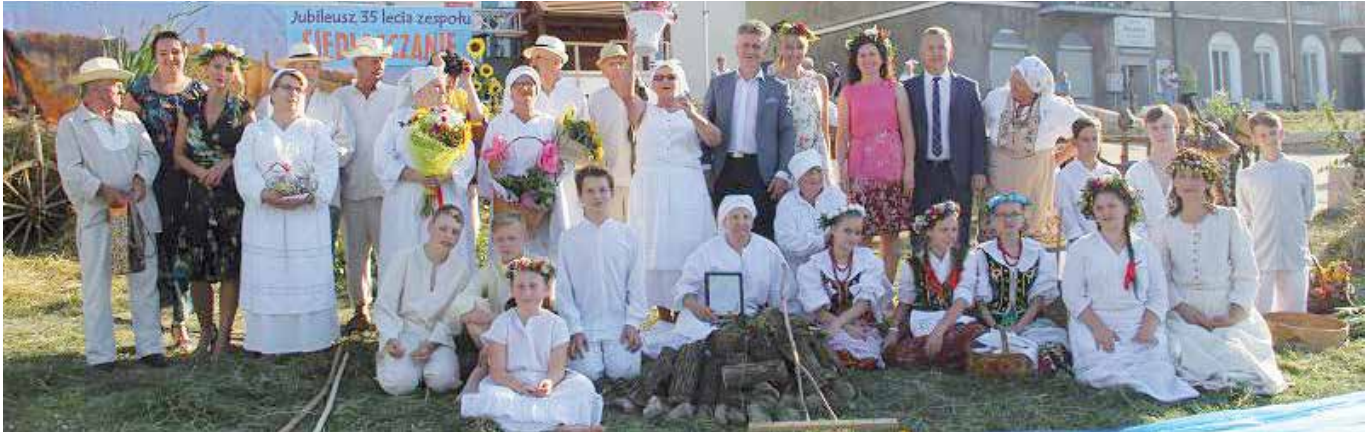
Pamiątkowe zdjęcie z okazji 35-lecia zespołu „Siedlecczanie”

Zespół folklorystyczny „Siedlecczanie” hucznie świętował jubileusz 35-lecia swojej działalności. Z tej okazji artyści nie tylko zaśpiewali, ale wystawili też widowisko pod nazwą „Wilyjo Świętego Jana”. Na scenie stanęli już po raz 976.