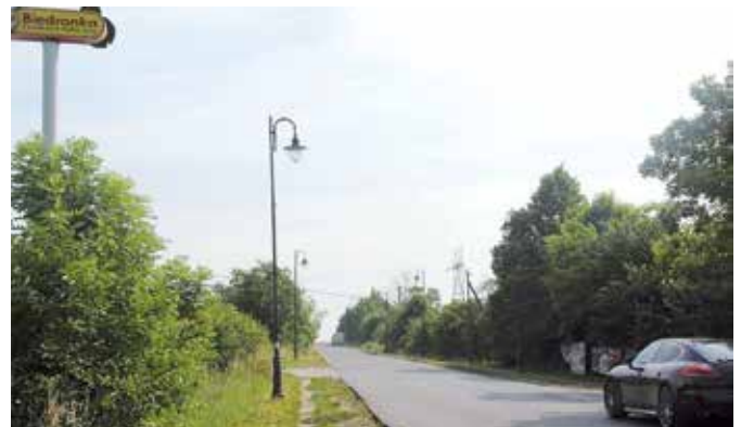
Chodnik do sklepu Biedronka zdecydowanie poprawi bezpieczeństwo