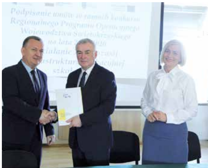
Burmistrz, Robert Jaworski odebrał z rąk Marszałka, Andrzeja Bętkowskiego i Wicemarszałek, Renaty Janik umowę na dofinansowanie remontu SP w Chęcinach

Władze Gminy i Miasta Chęciny pozyskały 500 tysięcy złotych unijnego dofinansowania do pierwszego etapu kompleksowego remontu i rozbudowy Szkoły Podstawowej w Chęcinach. Trwa opracowanie dokumentacji technicznej. Po jej zakończeniu zostanie ogłoszony przetarg na wyłonienie wykonawcy inwestycji. Szkoła w Chęcinach przejdzie nie tylko kompleksowy remont, ale zostanie też rozbudowana o dodatkowe skrzydło łączące salę sportową ze skrzydłem klas 1-3.