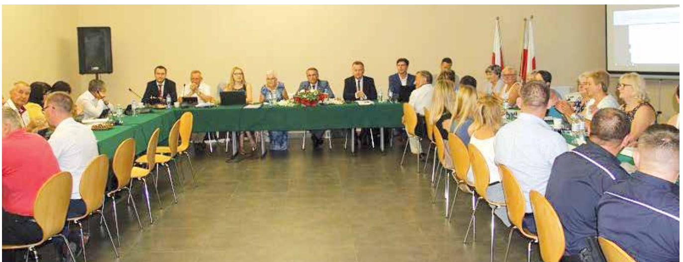
W jednej z najważniejszych sesji w samorządzie wzięli udział radni, władze i kierownicy urzędu; sołtysi i przewodniczący rad osiedlowych oraz dyrektorzy szkół i jednostek organizacyjnych