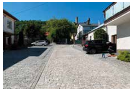
Plac targowy i przejście do ul. Radkowskiej wybrukowane

łych uliczek popękanym asfalcie już niebawem będzie można całkowicie zapomnieć. Część z tych urokliwych zakamarków właściwie już jest gotowa, jednak całość zadania zostanie odebrana dopiero jesienią bieżącego roku. Prace miały zakończyć się wcześniej, ale już teraz wiadomo, że się przesuną ze względu na brak materiałów do ich wykonania i konieczność dłuższe-