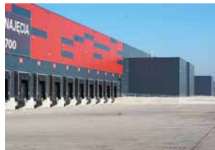
Ruszyła rozbudowa Centrum Logistycznego 7R Park Kielce