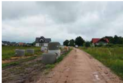
Budowa drogi wraz z infrastrukturą

Osiedle Skiby to jedno z najchętniej wybieranych do zamieszkania miejsc na terenie gminy Chęciny. Powstaje tu coraz więcej domów, a lokalny samorząd sukcesywnie stara się wprowadzać tu kolejne udogodnienia dla mieszkańców. Jeszcze w tym roku Osiedle Skiby zyska nową drogą asfaltową o długości 450 metrów. Dodatkowo wybudowany zostanie chodnik i ścieżka rowerowa z uwzględnieniem oczywiście indywidualnych zjazdów do posesji. Na całej długości drogi wybudowane będzie także energooszczędne oświetlenie uliczne typu LED.