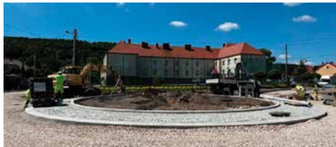
Kolejne rondo powstanie do końca lipca.

Drugie w centrum miasta rondo powstaje w ramach przebudowy skrzyżowania ulic Kieleckiej i Szkolnej. Ma to przede wszystkim usprawnić ruch i poprawić bezpieczeństwo w okolicy szkoły. Rondo, choć jeszcze niegotowe, już nabiera docelowego kształtu.