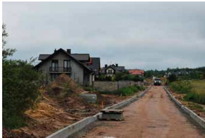
Budowa dróg na Osiedlu Zelejowa