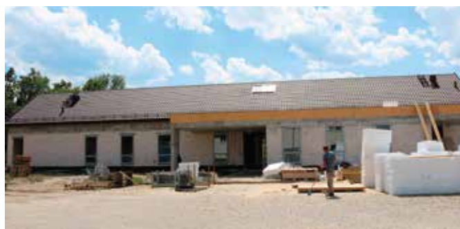
Budynek przychodni zostanie oddany do końca roku

Obiekt będzie nowoczesny i funkcjonalny, z gabinetami dla internistów, pediatrów i stomatologów. W przychodni będą przyjmowani zarówno dorośli, jak i dzieci. Osobne wejścia będą dla dzieci zdrowych i dla dzieci chorych. Budynek zostanie wyposażony w odnawialne źródła energii, co oznacza, że będzie też jak najbardziej ekologiczny i ekonomiczny. Kolejnym udogodnieniem będzie duży i bezpieczny parking dla pacjentów.