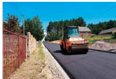
Intensywne prace przy budowie drogi

wybuduj”, a także zdobyć wszelkie niezbędne pozwolenia na budowę. W ramach zaplanowanych prac położony tu będzie asfalt o długości 1,5 kilometra na odcinku od skrzyżowania na granicy Polichno – Gościnięc przez drogę gruntową, przy której obecnie powstaje nowa zabudowa domów jednorodzinnych, następnie drogę przy szkole do skrzyżowania z drogą powiatową