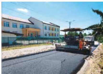
Trwają prace przy budowie drogi Polichno – Gościniec