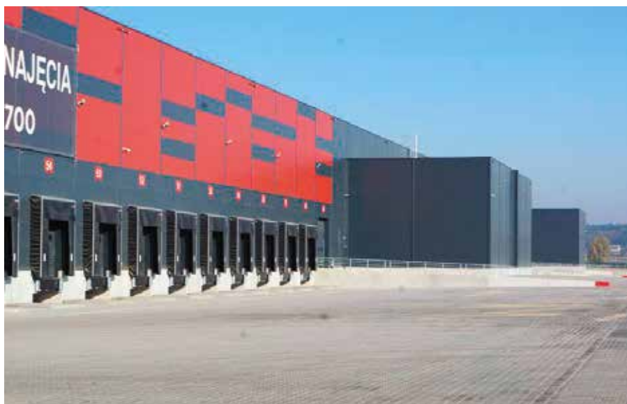
Hale Centrum Logistycznego będą rozbudowane

Firma od samego początku planowała sukcesywny rozwój. Właśnie ruszyła rozbudowa jednej z hal magazynowych. - Halę o powierzchni 15 tysięcy metrów kwadratowych rozbudujemy o ko-