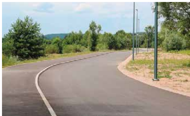
Przejażdżki rowerami, na rolkach i deskorolce będą tu prawdziwą przyjemnością