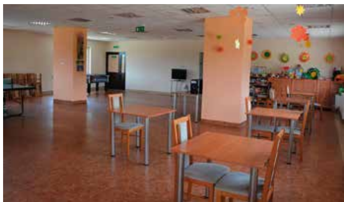
Świetlica w Wolicy