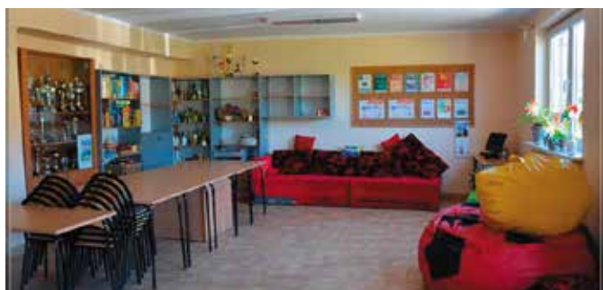
Świetlica w Tokarni