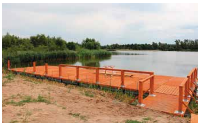
Teren wokół zbiornika w Lipowicy z pewnością będzie cieszył się dużym zainteresowaniem mieszkańców, a w szczególności miłośników wędkarstwa