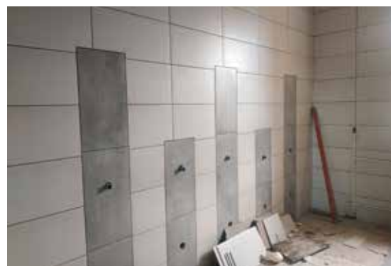
Szkoła w Chęcinach od dawna czekała na tak kompleksowy remont.

tyczna dla zerówki, sale dydaktyczne dla klas 4-8 i sanitariaty. Wejście do budynku zostanie przystosowane dla osób niepełnosprawnych. Modernizację przejdzie również kotłownia.