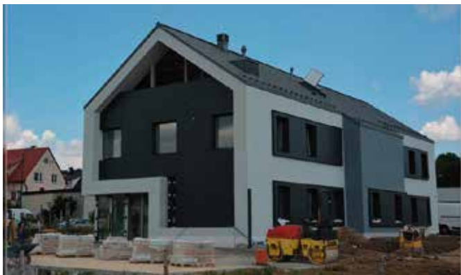
Nowy Komisariat prezentuje się bardzo nowocześnie