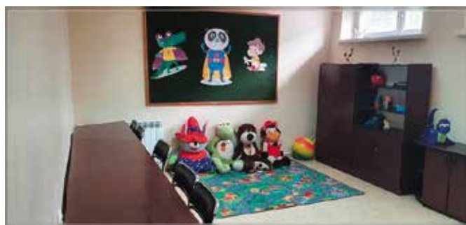
Świetlica w Czerwonej Górze

Nowy wygląd zyskało także pomieszczenie Koła Gospodyń Wiejskich w Ostrowie, gdzie zakupiono nowe meble.