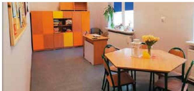
Świetlica w Miedziance

W świetlicy w Tokarni zostały pomalowane dwa pomieszczenia. Wymieniono lampy, a także zabudowano wnękę nad szafą. Z odnowionych sal mogą również korzystać mieszkańcy Wolicy i Czerwonej Górze. Sale zostały pomalowane, zamontowano rolety w oknach, a w świetlicy w Czerwonej Górze zostały wymienione trzy okna.