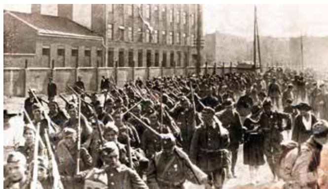
Piechota polska w marszu na front przed Bitwą Warszawską

My wszyscy, urodzeni w wolnej Polsce, jesteśmy winni pamięć tym, którzy obronili w 1920 roku dopiero co odzyskaną niepodległość. Było to możliwe dzięki ich bohaterkiej postawie, strategicznemu zmysłowi i wierze w opiekę Bożą. Kto mógł, chwycił za broń i walczył. Po-