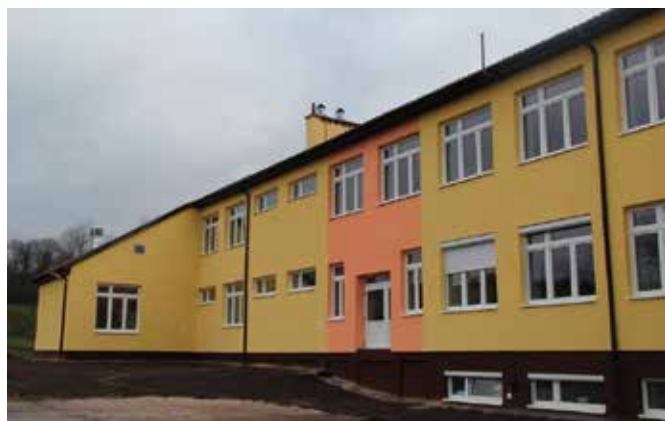
Szkoła w Bolminie to prężnie działająca placówka oświatowa. Niebawem powstanie tu nowa hala sportowa.

Na tym jednak nie koniec inwestycji przy Szkole Podstawowej w Bolminie. - Brakowało tu od zawsze zaplecza sportowego. Salka gimnastyczna jest tu naprawdę mała. Ciężko prowadzić zajęcia sportowe. Do bolmińskiej szkoły uczęszcza bardzo dużo dzieci, uznaliśmy zatem, że hala jest konieczna. Kiedy budowano tę placówkę prze-