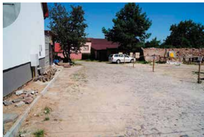
Te zakątki historycznego miasteczka zostaną zrewitalizowane