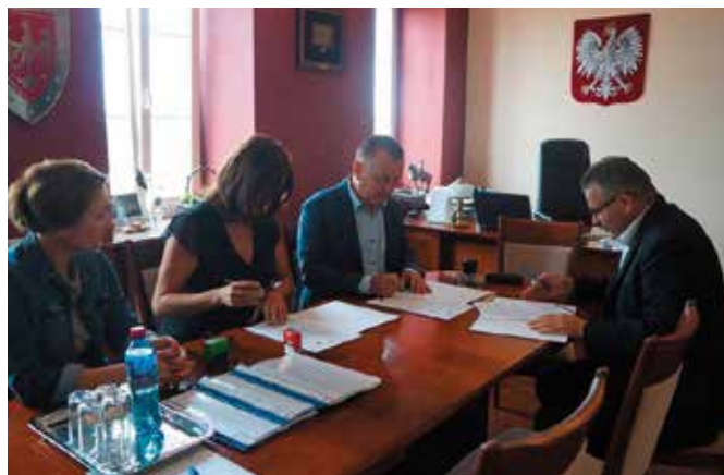
Rozbudowa sieci kanalizacyjnej to jedno z priorytetowych zadań naszej gminy.

Blisko dwa miliony złotych unijnego dofinansowania władze Gminy i Miasta Chęciny pozyskały na budowę sieci kanalizacyjnej przy ulicy Zelejowa wraz z terenami przyległymi i wodociągu w Tokarni. Już podpisano umowę z wyłonionym w drodze przetargu wykonawcą budowy kanalizacji sanitarnej w miejscowości Chęciny od ulicy Kieleckiej do ulicy Zelejowej wraz z przyległym terenem, a został nim Zakład Robót Inżynieryjno