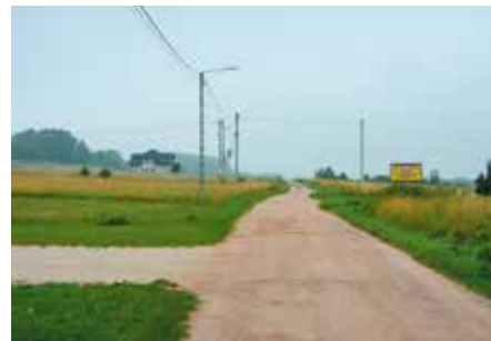
Trwa opracowanie dokumentacji na drogę w Polichnie

wykonawca generalnym inwestycji została firma DUKT. Zrealizuje ona zadanie zgodnie z Dokumentacją Projektową, którą opracuje na podstawie Programu Funkcjonalno-Użytkowego i pozyskanej decyzji o zezwoleniu na realizację inwestycji drogowej (ZRID). - Przetarg został ogłoszony w systemie “zaprojektuj i wybuduj”. W związku z tym, wykonawca w pierwszej kolejności musi wykonać projekt tej drogi i uzyskać pozwolenie na budowę, co właśnie jest w trakcie realizacji. Dopiero potem będzie można przystąpić do prac ziemnych, które jak szacują drogowcy rozpoczną się z począt-