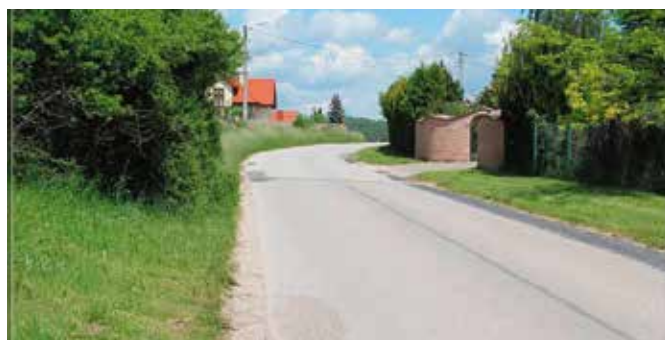
Nasza gmina cieszy się dużą popularnością wśród amatorów rowerów

Koszt tej inwestycji w dużej mierze pokryje pozyskane przez władze gminy unijne dofinansowanie ze środków Regionalnego Programu Operacyjnego na lata 2014-2020 w ramach Zintegrowanych Inwestycji Terytorialnych Kieleckiego Obszaru Funkcjonalnego. Nowe ścieżki rowerowe to idealna alternatywa dla ruchu samochodowego, a przede wszystkim ekologiczny model komunikacji.