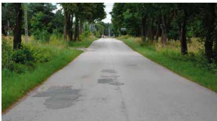
Przebudowa drogi powiatowej Starochęciny-Przymiarki-Lipowica