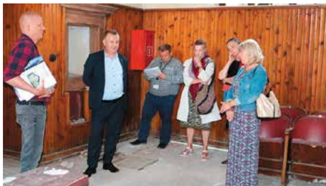
Trwają uzgodnienia z Konserwatorem Zabytków

Odrestaurowana synagoga wraz z Centrum Pamięci Kultury Żydowskiej ma stać się miejscem uczącym tolerancji oraz szacunku do innych religii i kultur.