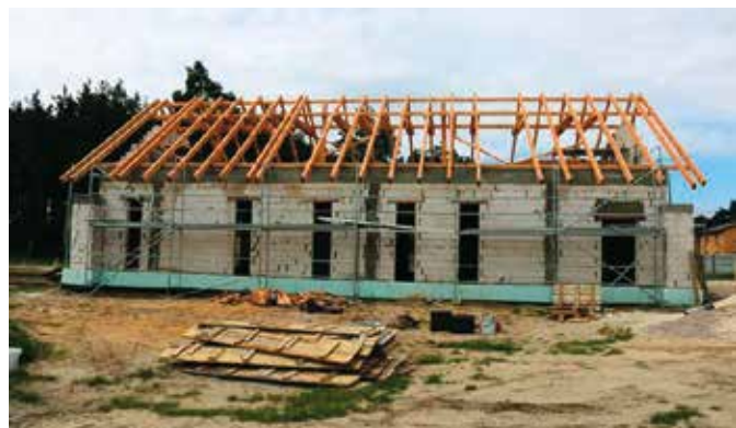
Świetlice to doskonałe miejsce spotkań integracji i podejmowania lokalnych inicjatyw.

obowiązywać od 2021 roku. Ocieplenie ścian zewnętrznych, podłogi, stropu i właściwości okien i drzwi będą energooszczędne. Zagospodarowany zostanie też teren wokół obiektu. Zgodnie z umową nowa świetlica w Lipowicy ma być gotowa do końca listopada bieżącego roku.