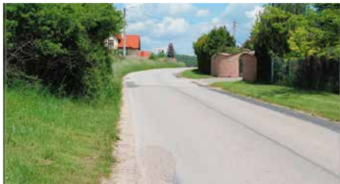
W Gminie Chęciny powstaje coraz więcej ścieżek rowerowych