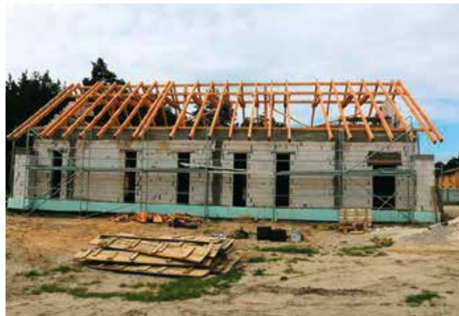
Mieszkańcy Lipowicy i okolic będą niebawem cieszyć się nową świetlicą