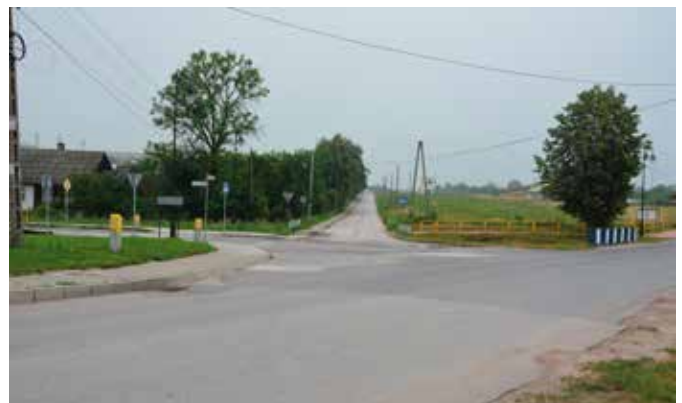
Ruch kołowy z pewnością zwiększy bezpieczeństwo na skrzyżowaniach.