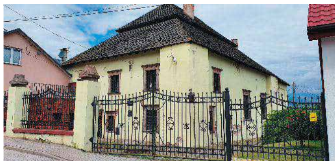
Synagoga czeka na kompleksowy remont

- Wszelkie decyzje i prace są konsultowane ze Świętokrzyskim Konserwatorem Zabytków, który czuwa nad pra-