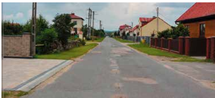
Droga w Przymiarkach wymaga remontu

Przebudowa drogi powiatowej Lipowica-Przymiarki-Starochęciny była długo wyczekiwana przez mieszkańców. - To bardzo kosztowna inwestycja. Sami nie zdołalibyśmy jej udźwignąć. Stąd też wspólnie z powiatem kieleckim wnioskowaliśmy o rządowe wsparcie zadania w ramach Funduszu Dróg Samorządowych. Dzięki małym nakładom finansowym ze strony gminy przebudujemy ponad dwa kilometry drogi. Istotną kwestią