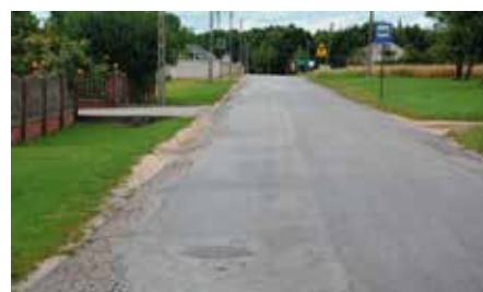
Droga Siedlce-Łukowa czeka na remont