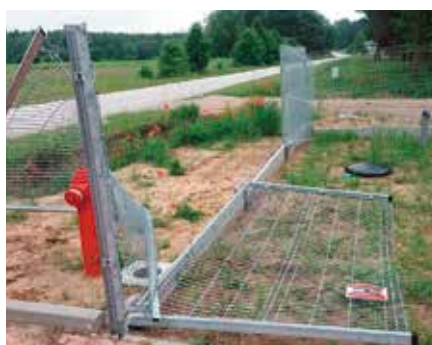
Wandalizm na pompowni w Miedziance. Zniszczone ogrodzenie.

Mowa o pompowni, jaka powstaje przy drodze Polichno – Miedzianka. Stanowi ona jeden z elementów budowanej właśnie nowej sieci wodociągowej, która ma połączyć Podpolichno z Miedzianką. Dzięki niej