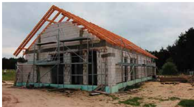
Budowa świetlicy potrwa do końca roku.

Budynek ma być ogrzewany ekologicznym kondensacyjnym kotłem gazowym. Standard energetyczny obiektu będzie spełniał bardzo rygorystyczne normy, które mają