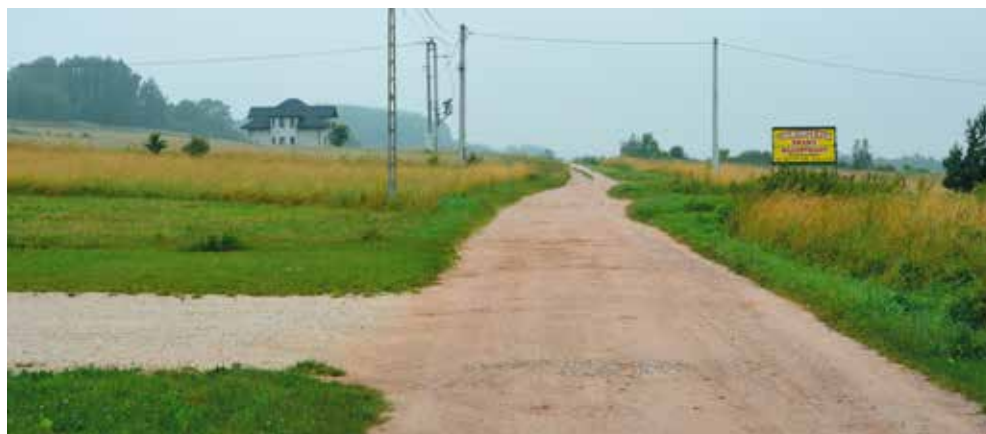
Trwa opracowanie dokumentacji na drogę w Polichnie