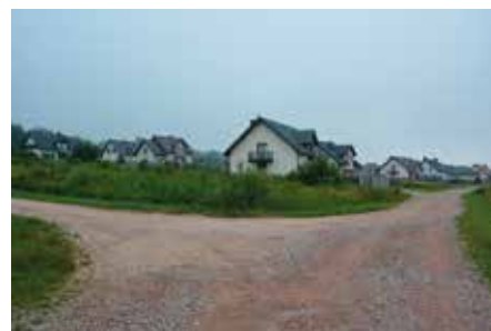
Na nowym osiedlu powstaną drogi.

Nadal trwa opracowanie dokumentacji technicznej projektu sieci dróg na terenie osiedla Skiby o łącznej długości ponad dwóch kilometrów. Powstaną tu także obustronne chodniki, wybudowane będą też jazdy do posesji, kanalizacja desz-