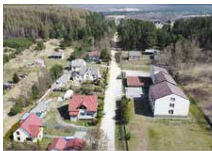
Rozpoczęła się budowa drogi w Polichnie