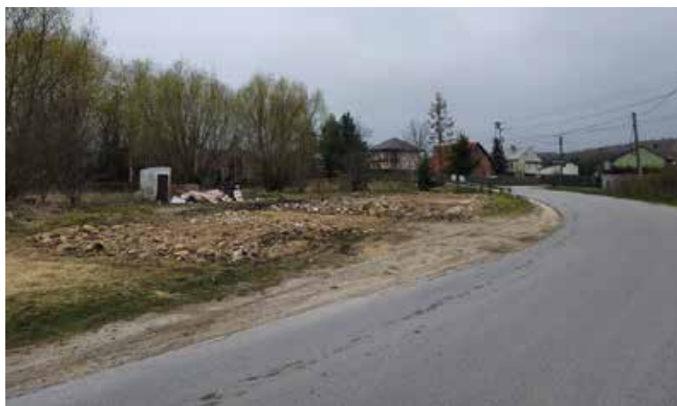
Szpecący budynek, ograniczający widoczność na drodze został wyburzony.

Zakończyła się rozbiórka opuszczonego budynku w Siedlcach. Teraz trwają prace porządkowe, które mają zakończyć się do końca czerwca.