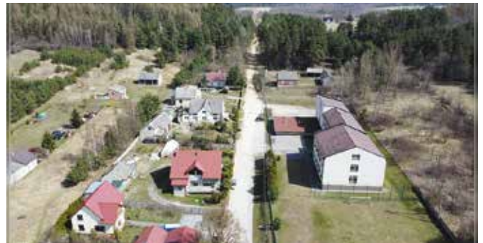
Kolejna droga budowana z rządowym dofinansowaniem