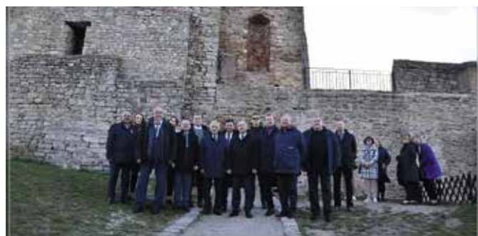
Zamek Królewski w Chęcinach jednym z głównych punktów wizyty