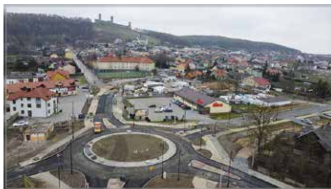
Nowe drogi i ronda zdecydowanie poprawią bezpieczeństwo w tej okolicy

W ramach rozbudowy ulicy Kieleckiej i ulicy Białego Zagłębia od drogi wojewódzkiej nr 762 do skrzyżowania z ulicą Szkolną mają docelowo powstać dwa ronda. Jedno z nich jest już prawie gotowe. Dzięki tym działaniom zdecydo-