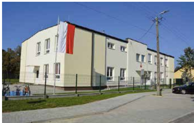
Przy SP w Starochęcinach powstanie plac zabaw

W ostatnim czasie nowe miejsca zabaw dla dzieci powstały między innymi w Bolminie i Podpolichnie.