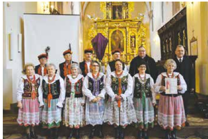
Zespół KGW Siedlecczanie