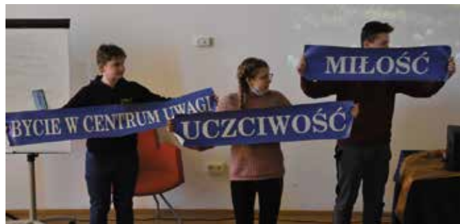
Nauka tolerancji, uczciwości i "odnalezienia własnego ja" podczas warsztatów dla młodzieży