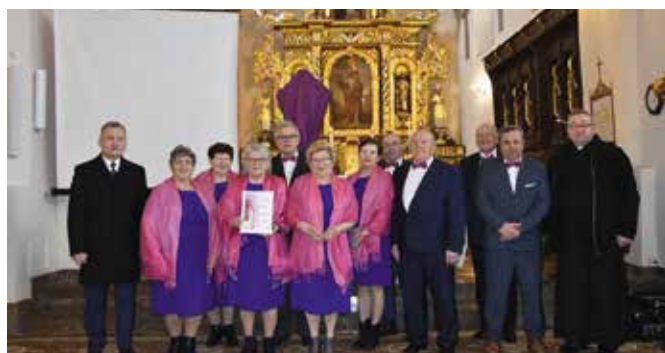
Zespół KGW Zelejewianie