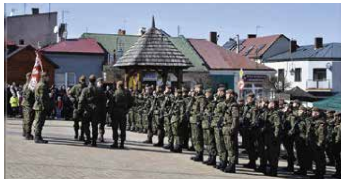
Żołnierze na Rynku w Chęcinach złożyli przysięgę

gę wierności Ojczyźnie, konstytucji i Bogu. Bądźcie dzielni – powiedział.