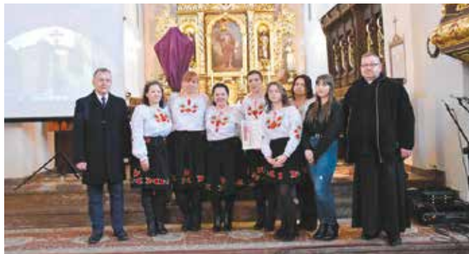
Zespół KGW Miedzianeczki

kreślił w swoim powitaniu gospodarz Gminy. - Stało się już tradycją w naszej gminie, że przed tak ważnymi dla każdego katolika Świątami Wielkiej Nocy spotykamy się na Koncercie Pieśni Wiekopostnych. To pieśni, które w naszej kulturze rozbrzmiewają już od XV wieku. Cieszę się, że jest u nas tylu artystów, którzy kultywują tę tradycję. Kościół Parafialny to