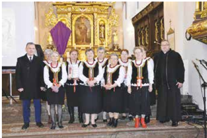
Zespół KGW Radkowiczanie