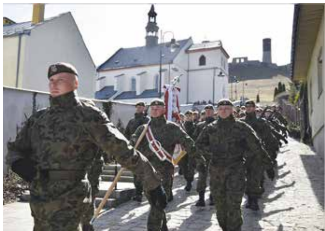
Przed złożeniem przysięgi żołnierze wzięli udział w Mszy Św.

- Przysięga wojskowa wieńczy trud szkolenia i potwierdza gotowość do pełnienia służby. Przysięga to akt ważnego ślubowania, a zarazem publiczne i osobiste zobowiązanie wobec Ojczyzny i Polaków. Jesz-