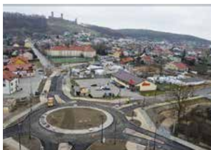
Trwają prace przy budowie dwóch rond na trasie wjazdowej do Chęcin

Od najmłodszych lat z ekologią za pan brat! czytaj na str. 21