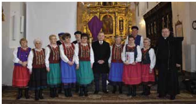
Zespół KGW Lipowiczanie