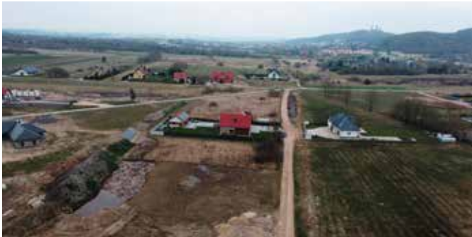
Trwają prace przy budowie drogi

W ramach zadania wykonana zostanie droga o długości blisko 450 m, chodnik, ścieżka rowerowa, zjazd