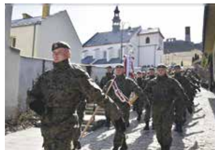
„Ja żołnierz Wojska Polskiego przysięgam...”