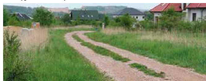
Pozyskane dofinansowanie na budowę sieci kanalizacyjnej na Os. Zelejowa oraz wodociąg w Tokarni.

Blisko dwa miliony złotych unijnego dofinansowania władze Gminy i Miasta Chęciny pozyskały na budowę sieci kanalizacyjnej w nowej części osiedla Zelejowa i wodociągu w Tokarni. Lada dzień zostanie ogłoszony przetarg na wyłonienie wykonawcy obu zadań, a prace ruszą jeszcze w tym roku.