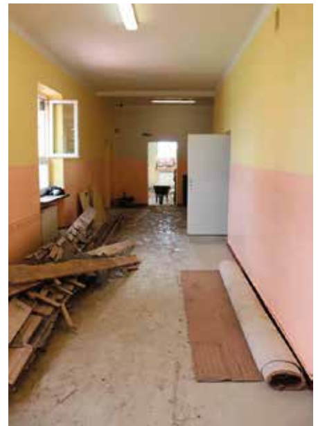
Szkoła przejdzie kompleksowy remont

Wykonawcą generalnym pierwszego etapu inwestycji związanej z remontem i rozbudową budynku szkoły w Chęcinach w ramach projektu „Poprawa infrastruktury edukacyjnej SP w Chęcinach” została wyłoniona w drodze przetargu firma Usługi Remontowo-Budowlane Kmieciak Paweł. Przewidziany zakres inwestycji będzie kosztował 1 milion 102 tysiące złotych. Budowlańcy już ruszyli z pracami, których zakończenie zaplanowano na początek września bieżącego roku.