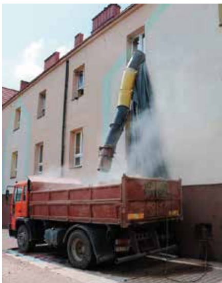
Remont szkoły w Chęcinach to jedna z najbardziej wyczekiwanych inwestycji.

Na tym jednak nie koniec. W ramach kolejnych dwóch etapów zaplanowaną rozbudowę budynku o dodatkowe skrzydło łączące salę sportową ze skrzydłem dla klas 1-3 oraz modernizację kotłowni. Tu będzie mieścić się m.in. stołówka, biblioteka z czytelnią, sala informatyczna, sala dydaktyczna dla zerówki, sale dydaktyczne dla klas 4-8 i sanitariaty. Wejście do budynku zostanie przystosowane dla osób niepełnosprawnych. Remont przejdzie też sala sportowa i łącznik sali sportowej. W ramach prac zagospodarowany będzie teren wokół szkoły wraz z wykonaniem między innymi, placu zabaw i siłowni plenerowej. W trzecim etapie przebudowany i wyremontowany zostanie parter wysoki i niski części dla klas 4-8 oraz budynek klas 1-3. Powstaną zupełnie nowe pomieszczenia dydaktyczne, a wewnątrz tej części