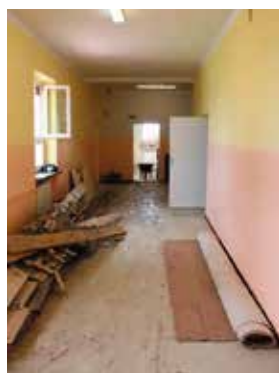
Rozpoczął się remont szkoły w Chęcinach

Szkoła Podstawowa w Chęcinach już niebawem nabierze zupełnie innego wyglądu. Właśnie ruszył pierwszy etap dużej inwestycji związanej z remontem i rozbudową obiektu. Na jego realizację władze Gminy i Miasta Chęciny pozyskały pół miliona złotych dofinansowania, a zakończenie inwestycji ma nastąpić do początku września bieżącego roku.