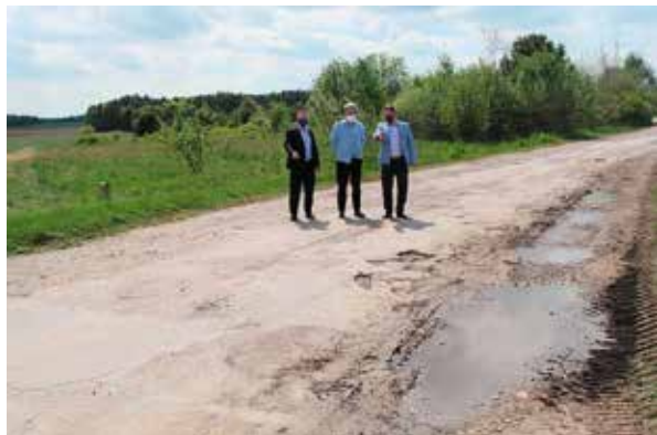
Kolejna droga w Łukowej zostanie wyremontowana

Ta wiadomość z całą pewnością ucieszy mieszkańców tej części gminy. W Łukowej całkowite przeobrazenie przejdzie kolejna droga. Tym razem chodzi o odcinek od skrzyżowania do granicy gminy Chęciny w kierunku gminy Sobków. Zostaną tu wyremontowane i utwardzone kruszywem