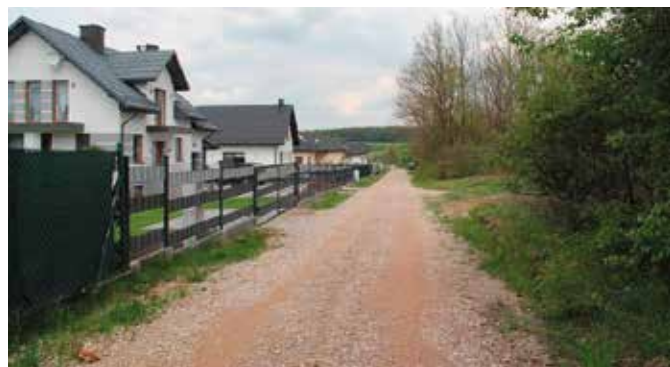
Bliskość dużych ośrodków miejskich i atrakcyjność miejsca wpływa na rozwój mieszkalnictwa

Biorąc pod uwagę statystyki na przestrzeni ostatnich dziesięciu lat najwięcej decyzji o warunkach zabudowy wydano w 2011 roku, kiedy to było ich aż 307. Najmniej decyzji wydano w roku 2013, kiedy to o dokumenty niezbędne