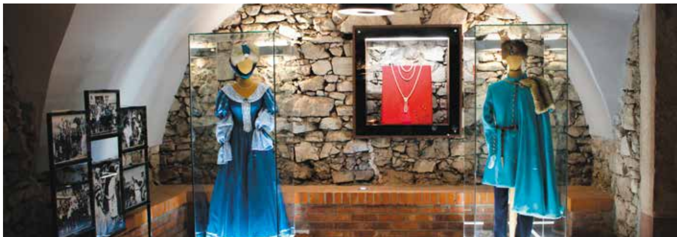
W "Niemczówce" można już zwiedzać nowo powstałą Izbę "Pana Wołodyjowskiego".

Odciski i odlewy dłoni aktorów, którzy zagrali w „Panu Wołodyjowskim”, zdjęcia z planu filmowego i repliki strojów głównych bohaterów – te i wiele innych pamiątek już niebawem będzie można zobaczyć w Izbie Pamięci filmu, jaka właśnie powstała w Chęcinach.