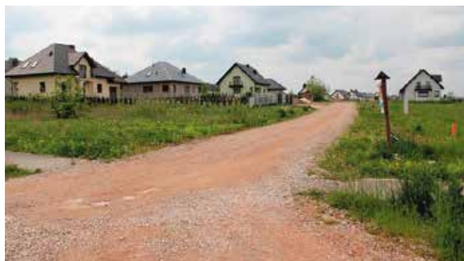
Powstaje coraz więcej domów i nowych osiedli

do pozwolenia budowania domu starało się 135 prywatnych inwestorów. Od tego roku liczby te systematycznie rosły. W 2014 roku wydano 137 decyzji budowlanych. Rok później było ich już 150. W 2016 roku wydano ich 174, w 2017 – 166, w 2018 – 186, a już w 2019 roku było aż 208 decyzji o ustaleniu warunków zabudowy. Zgodnie z danymi, do 6 maja 2020 roku Urząd Gminy i Miasta Chęciny wydał 55 decyzji o warunkach zabudowy.