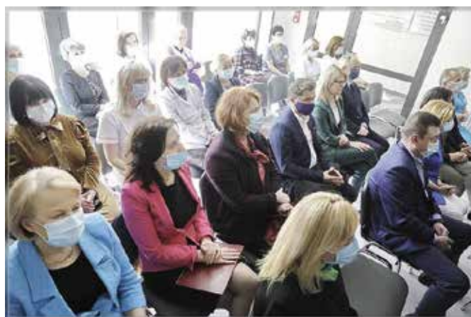
W otwarciu wzięli udział zaproszeni goście oraz pracownicy szpitala