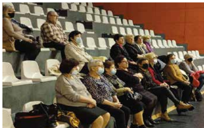
Seniorzy chętnie uczestniczą w szerokiej gamie wykładów.