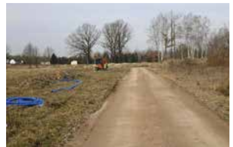
Na Osiedlu w Skibach powstanie nie tylko droga, ale także chodnik i ścieżka rowerowa