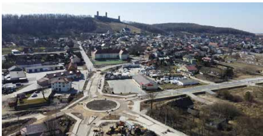
Zakończenie budowy obu rond planowane jest na koniec lipca br.