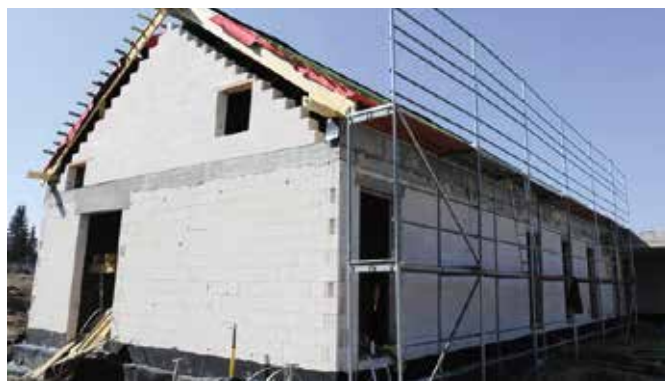
Budowa przychodni w Wolicy zakończy się w tym roku