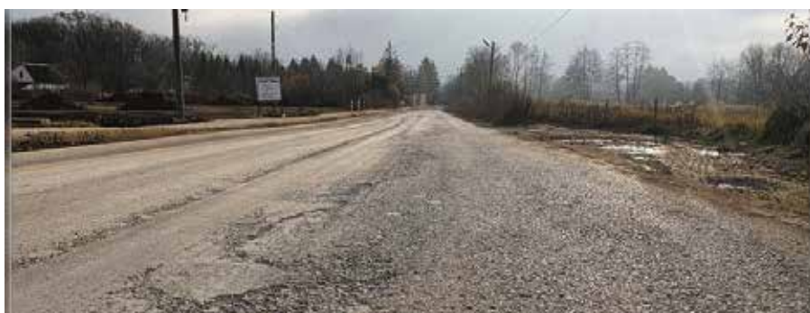
Droga w Sitkówce przejdzie kompleksową przebudowę

A gdzie w związku z przyznanymi dotacjami będzie można spodziewać się kolejnych inwestycji drogowych w najbliższym czasie? Remont przejdzie droga gminna w miejscowości Chęciny, ul. Małogoska od skrzyżowania z drogą wojewódzką 762 do skrzyżowania z drogą gminną ul. Franciszkańską na długości 871 metrów. Nowe nawierzchnie zyskają jeszcze trzy chęcińskie ulice – ul. Sitkówka, ul. Dobrzączka i ul. Długa.