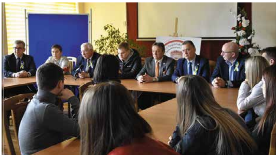
Uczniowie ZS NR2 w Chęcinach z Ukrainy otrzymują stypendia

- Robimy wszystko, aby pomóc Wam tutaj, ale również Waszym bliskim, którzy przybywają jako uchodźcy do naszego kraju, w tym do naszej gminy. Chcę Wam także podziękować za zaangażowanie i pomoc w przygotowaniu różnego rodzaju dialogów polsko-ukraińskich. Chcę Was zapewnić, że obywatele tej gminy są zatroskani i co chwilę spontanicznie organizują liczne zbiórki, czy to w kościołach, szkołach, czy w Miejsko-Gminnym Ośrodku Pomocy Społecznej. Niemal wszyscy są zaangażowani