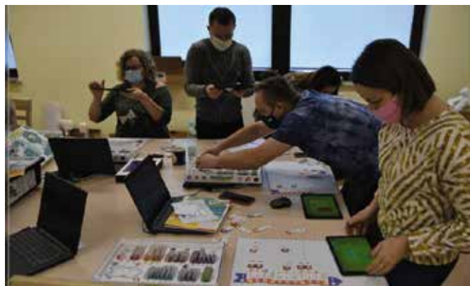
Zajęcia z programowania będą odbywać się w świetlicach

Instruktorzy pracujący na co dzień w świetlicach na terenie Gminy Chęciny rozpoczęli szkolenie w obszarze tematycznym „Programowanie w różnych językach”. Szkolenie pozwoli na podniesienie kompetencji instruktorów, którzy przekazaną wiedzę będą wprowadzać na zajęciach z dziećmi i młodzieżą. Programowanie z klockami LEGO mindstorms oraz grą scottiego zwiększy ofertę zajęć w świetlicach oraz poszerzy wiedzę młodzieży z zakresu nowych technologii.