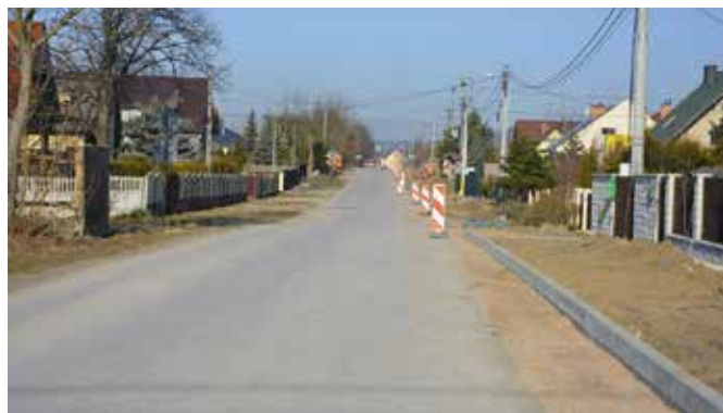
Intensywne prace przy przebudowie drogi Starochęciny-Przymiarki-Lipowica

Inwestycja realizowana jest w systemie „zaprojektuj i wybuduj”. Jej koszt to blisko 7 milionów złotych. Na ten cel udało się pozyskać rządowe dofinansowanie w ramach Funduszu Dróg Samorządowych, które