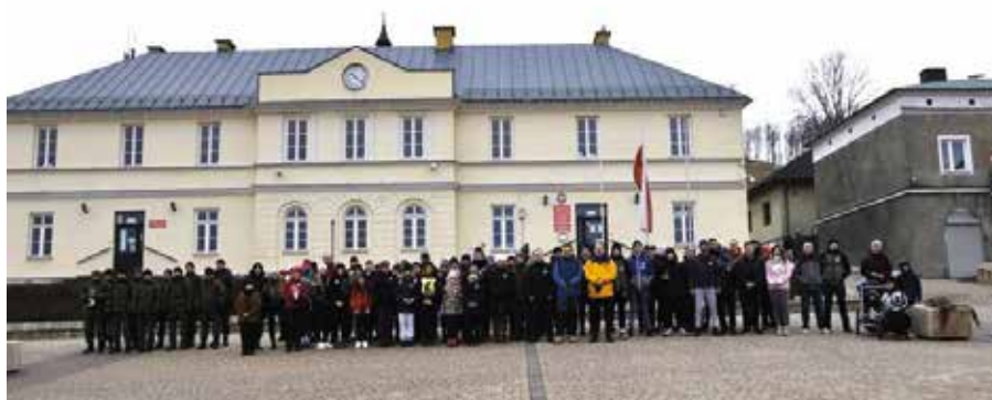
Ponad dziewięćdziesiąt osób wzięło udział w Rajdzie