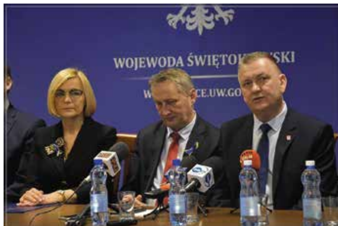
Nowy portal Radia Kielce pomoże w kompleksowym poszukiwaniu pracy dla obywateli Ukrainy

- Uchodźcy z Ukrainy, którzy przybyli do naszego regionu, to osoby, które są wdzięczne za okazaną pomoc, ale z rozmów jakie odbyliśmy mamy wiedzę,