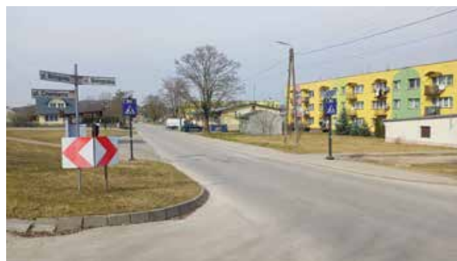
Nowe oznakowanie poprawi bezpieczeństwo uczestników drogi.