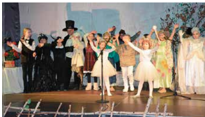
Spektakl "Królowa Śniegu" to przykład integracji pokoleniowej w gminie Chęciny