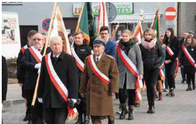
Przemarsz pod Pomnik przy ul. Małogoskiej

Narodowy Dzień Pamięci Żołnierzy Wyklętych został ustanowiony 1 marca, ponieważ dokładnie 1 marca 1951 roku w areszcie śledczym Warszawa Mokotów wykonano wyrok śmierci na siedmiu członkach IV Zarządu Głównego Zrzeszenia „Wolność i Niezawisłość”: Łukaszu Cieplińskim, Mieczysławie Kawalcu, Józefie Batorym, Adamie Lazarowiczu, Franciszku Błażeju, Karolu Chmielu i Józefie Rzepce. To oni byli ostatnimi ogólnopolskimi koordynatorami „Walki o Wolność i Niezawisłość Polski z nową sowiecką okupacją”.