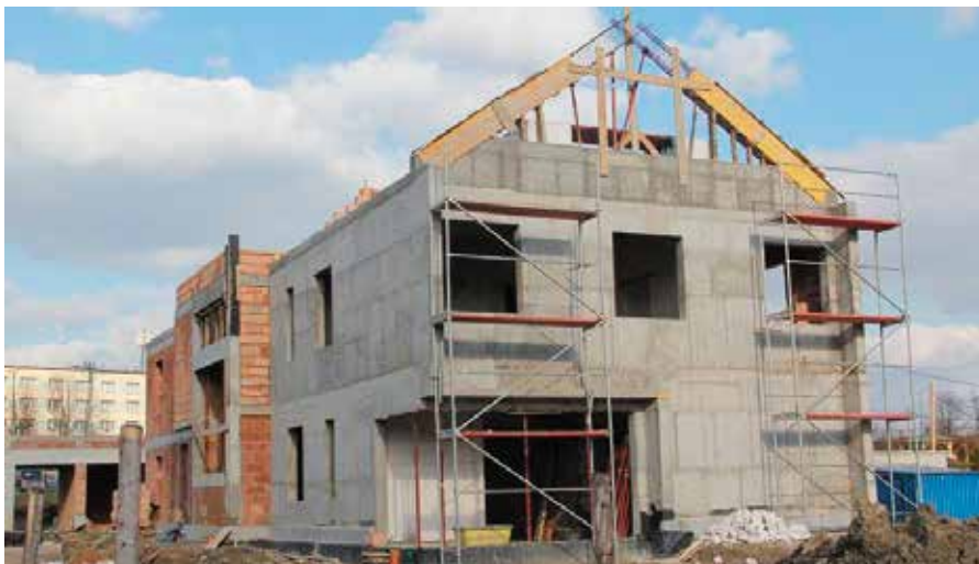
Budynek nowego komisariatu rośnie w oczach