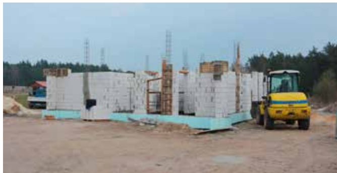
Postęp prac przy budowie świetlicy w Lipowicy