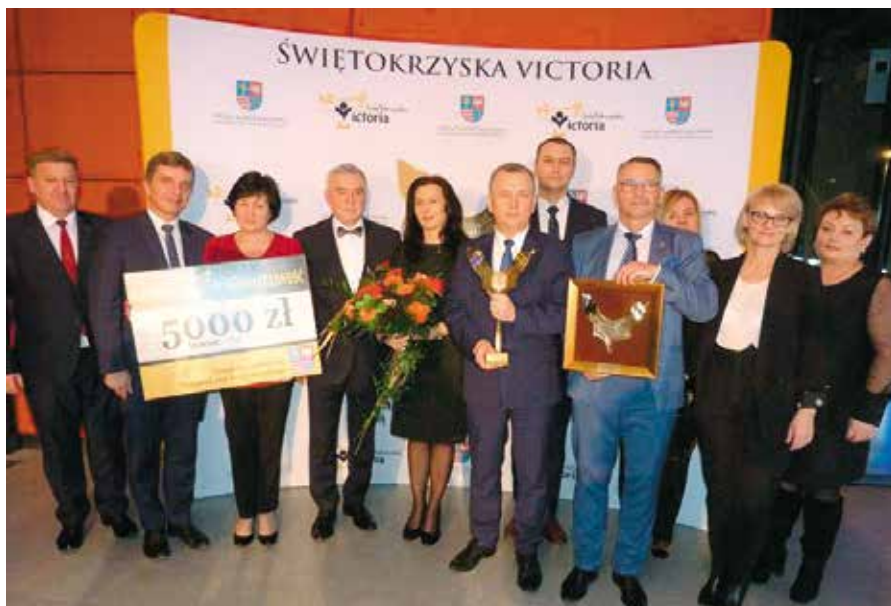
Gmina Chęciny nagrodzona w kategorii samorządność