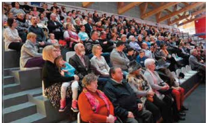
Teatr Grodzki "Pod Basztami" ma już swoich fanów, a na spektaklach gromadzi się liczna publiczność.

Tego samego zdania byli także i ci nieco starsi aktorzy. Ich kreacje aktorskie wywołały podczas premiery spek-