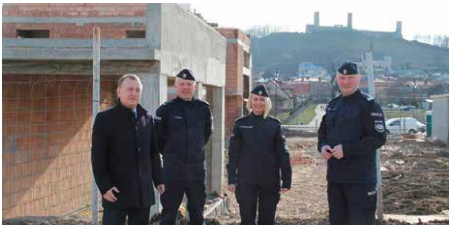
Burmistrz z Komendantami z Kielc podczas wizytacji prac na budowie