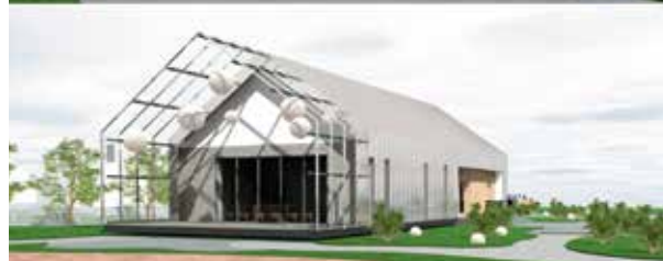
Wizualizacja budynku świetlicy