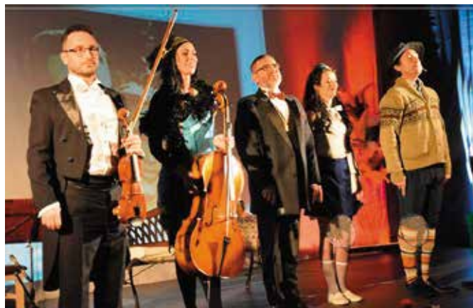
Zespół Artes Ensemble zachwycił publiczność