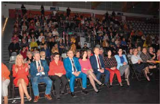
Publiczność licznie zgromadziła się na obchodach "Dnia Kobiet"