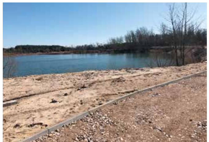
Trwają prace przy zbiorniku w Lipowicy