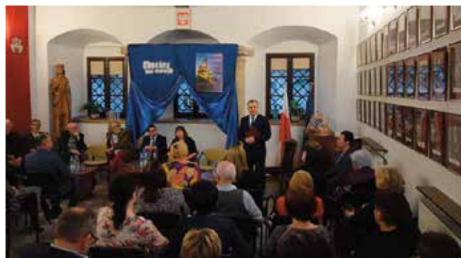
W promocji nowej publikacji o Chęcinach wzięło udział wielu naukowców i mieszkańców.

Warto podkreślić, że w najnowszej monografii Chęcin badacze dotykają istotnych aspektów historii regionu, pisząc o najstarszych dziejach Zamku i powstałego u jego podnóża ośrodka miejskiego. - Zanim rozpoczęliśmy w 2013 roku badania archeologiczne myśleliśmy, że o Chęcinach wiemy już wszystko. Oka-