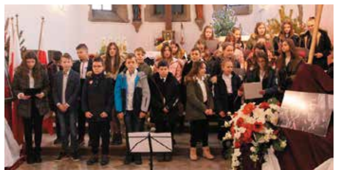
Program słowno-muzyczny zaprezentowali uczniowie ze SP w Bolminie pod okiem nauczycieli