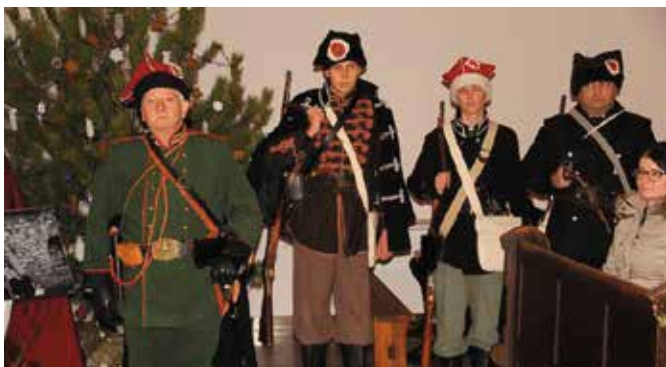
Uroczystość uświetniła grupa rekonstrukcyjna z I LO w Kielcach pod kierunkiem Zbigniewa Kowalskiego.