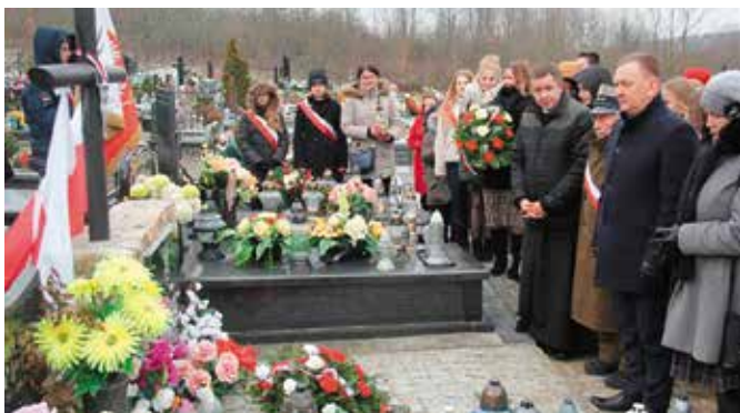
Na mogile Powstańców Styczniowych znajdującej się na cmentarzu parafialnym złożono wiązanki i znicze.