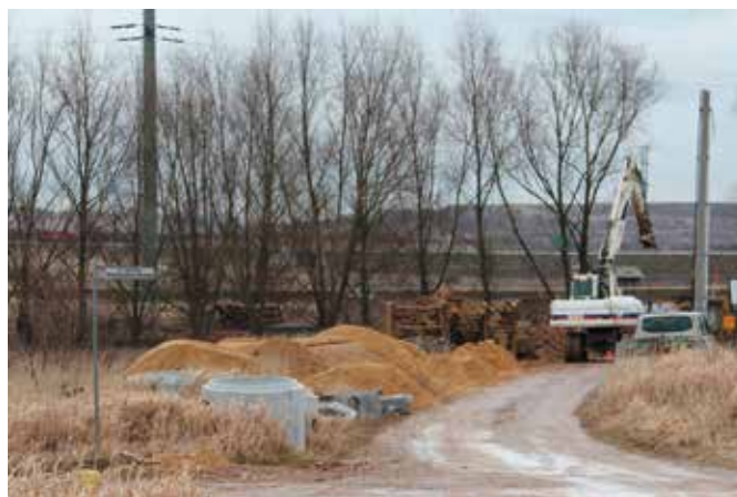
Kompleksowa budowa drogi przy ulicy Branickiego wraz z siecią wodociągową, kanalizacyjną, chodnikami i ścieżką rowerową.

Budowa ulicy Branickiego i Kazimierza Wielkiego w Chęcinach wraz z chodnikami, ścieżką rowerową i uzupełnieniem sieci wodno-kanalizacyjnej to kolejna duża inwestycja drogowa na terenie Gminy i Miasta Chęciny, która już się rozpoczęła. Nowy asfalt wraz z infrastrukturą towarzyszącą łącznie powstanie tu na długości 1 kilometra i 100 metrów. Całość zadania będzie kosztować ponad 4 miliony złotych. Połowę środków budowy obu ulic pokryje rządowe dofinansowanie pozyskane w ramach Funduszu Dróg Samorządowych. W tym koszt budowy ścieżki rowerowej przy ulicy Branickiego, Kazimierza Wielkiego, a także ulicy Wołodyjowskiego opiewa na kwotę 294 tysięcy złotych, z czego aż 95 procent pokryje unijne dofinansowanie. Wyłonionym w drodze