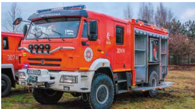
Nowy samochód ratowniczo-gaśniczy dla OSP w Tokarni