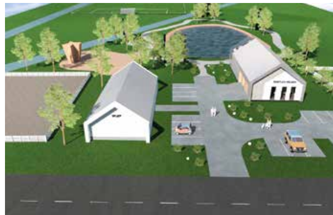
Wizualizacja budowanej świetlicy w Lipowicy