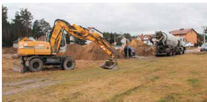
Trwają pierwsze prace