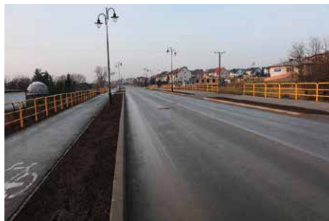
Aleja Marszałka Józefa Piłsudskiego zmieniła całkowicie tę część miasta