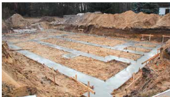
Fundamenty pod świetlicę już zalane