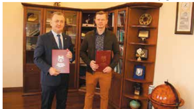
Podpisana umowa na budowę ulicy Dąbrowskiego w Chęcinach