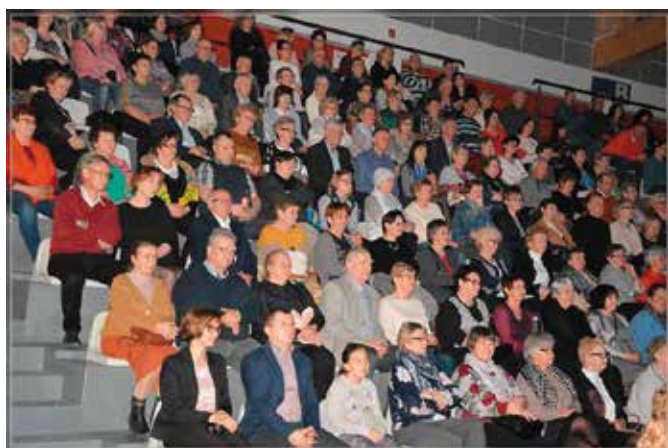
Muzyka Filmowa zgromadziła liczną publiczność w hali "Pod Basztami"