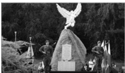
Uroczystości z okazji Święta Lotników w Gościńcu