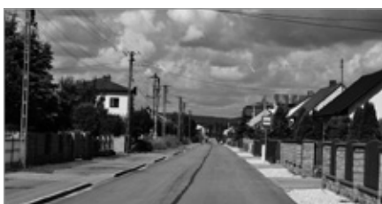
Rozbudowa drogi Starościny-Przymiarki-Lipowica