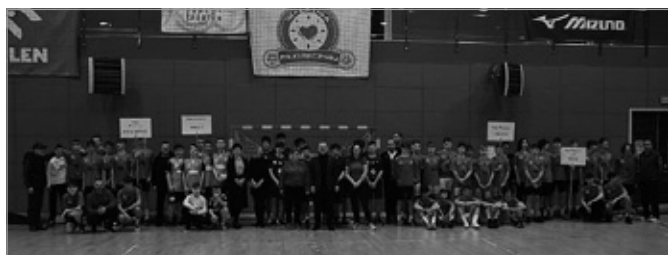
Mała Liga Piłki Ręcznej szkół podstawowych klas 7-8