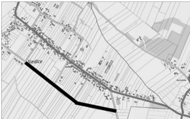
Droga w Siedlcach w trakcie realizacji

W Siedlcach rozpoczęła się zapowiadana rozbudowa drogi gminnej na działce nr 247. Na ten cel Gmina Chęciny pozyskała wysokie dofinansowanie z Rządowego Funduszu Rozwoju Dróg. Inwestycja poprawi jakość życia mieszkańców, a także zwiększy atrakcyjność inwestycyjną miejscowości Siedlce i całej gminy.