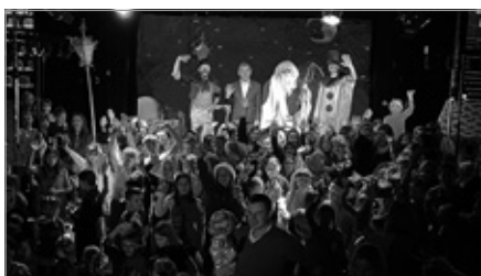
Mikotajki w hali „Pod Basztami”