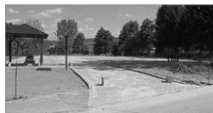
Budowa parkingu przy kościele w Łukowej