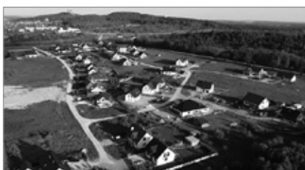
Pozyskane środki na budowę dróg na Osiedlu w Skibach