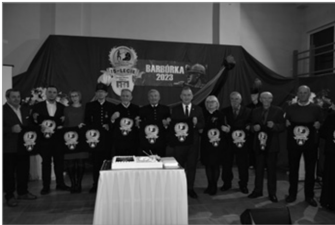
Burmistrz złożył życzenia z okazji Barbórki górnikom oraz osobom pracującym w sektorze wydobywczym

W niedzielę, 3 grudnia w Miedziance świętowano uroczystości barbórkowe oraz jubileusz 15-lecia Muzealnej Izby Górnictwa Kruszcowego w Miedziance.