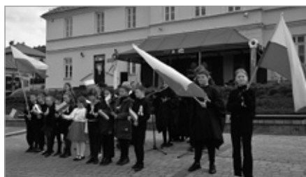
Obchody 3go Maja