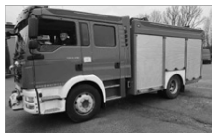
Nowy samochód dla OSP Ostrów