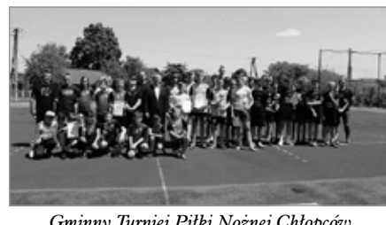
Gminny Turniej Piłki Nożnej Chłopców rocznik 2008-2009 o Puchar Burmistrza Gminy i Miasta Chęciny