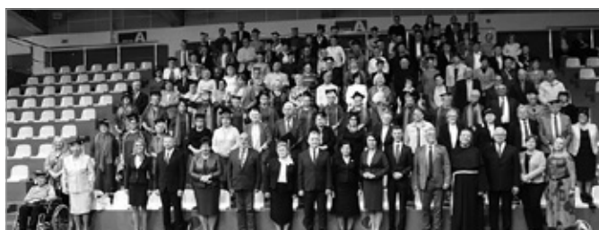
Inauguracja Roku Akademickiego CHUTW