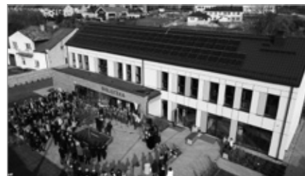
Uroczyste otwarcie biblioteki wraz z miejscem dla seniorów w Chęcinach