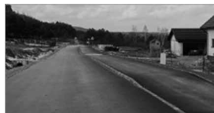
Projektowanie II etapu drogi w Polichnie (tzw. małej obwodnicy)