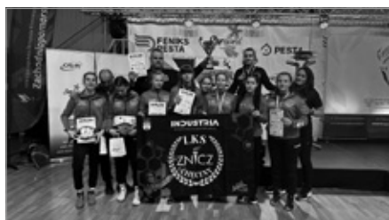
Sukcesy Industria Znicz Chęciny