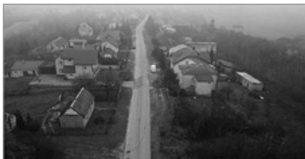
Dokonano zgłoszenia budowy kanalizacji na ul. Panek w Starostwie Powiatowym i trwają przygotowania do przetargu