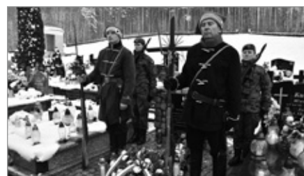
Obchody rocznicy Powstania Styczniowego