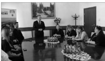
Wizyta delegacji z Izraela