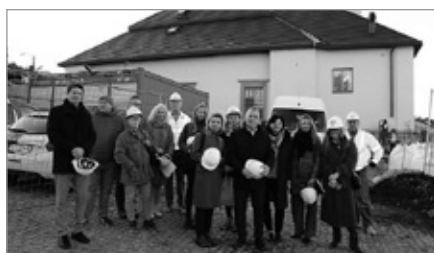
Wizyta delegacji z Muzeum Historii Żydów Polskich POLIN