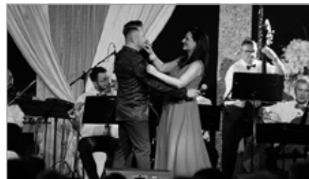
Zamkowe Spotkania z Muzyką