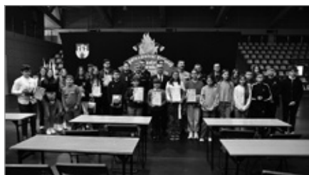
Turniej Wiedzy Pozarniczej „Młodzież Zapobiega Pożarom”