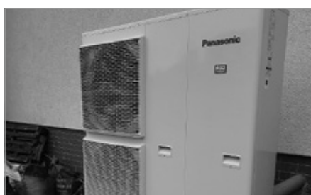
Pompa ciepła w Świetlicy i OSP Łukowa