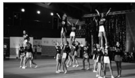
W Chęcinach odbył się Puchar Polski w Cheerleadingu Sportowym