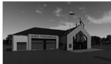
Gmina Chęciny pozyskała prawie 8 milionów złotych na budowę świetlicy i remizy w Tokarni