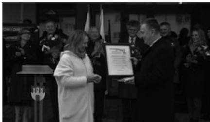
Otwarcie nowo wybudowanego Ośrodka Zdrowia w Wólce