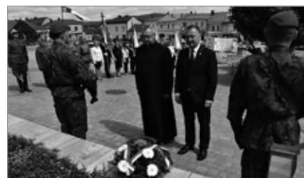
Rocznica Pacyfikacji Chęciny