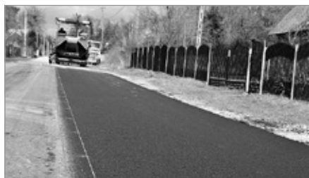
Remont drogi w Mostach