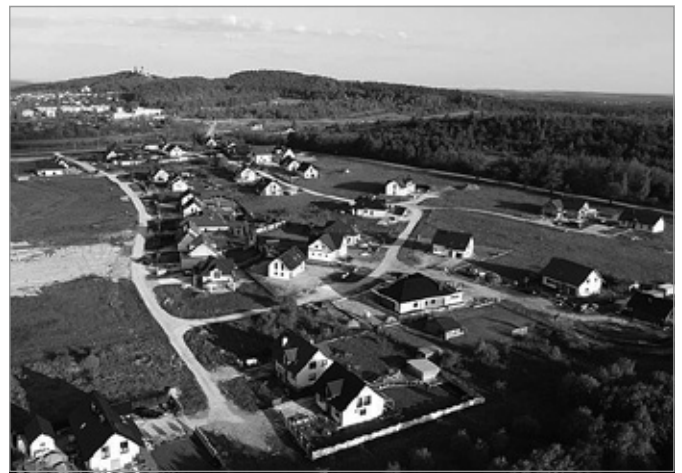
Na osiedlu w Skibach powstaną nowe drogi

Dzięki milionowemu dofinansowaniu już niebawem ruszą prace związane z drugim etapem kosztownych prac na Osiedlu Skiby. A w ich ramach wybudowane zostaną