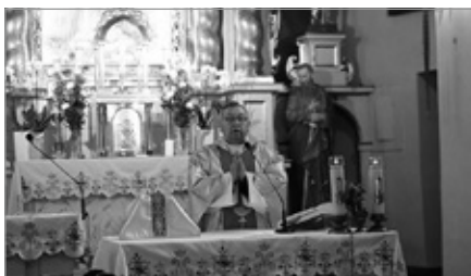
Rocznica Agresji Rosji na Polskę