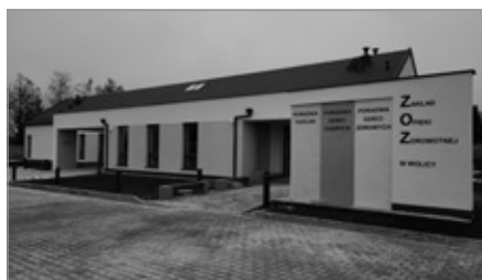
Nowo wybudowany Ośrodek Zdrowia w Wolicy