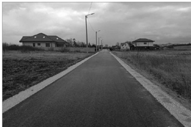
ul. Słoneczna w Wolicy z nową nawierzchnią

Zakończyły się prace przy przebudowie ul. Słonecznej w Wolicy. Inwestycja została dofinansowana z budżetu województwa świętokrzyskiego w ramach działań związanych z budową lub modernizacją dróg dojazdowych do gruntów rolnych.