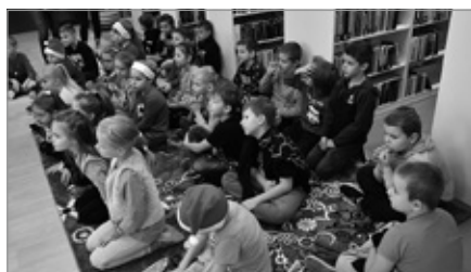
Mikotajki w Bibliotece