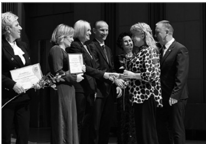
MGOPS w Chęcinach nominowany do nagrody „Świętokrzyski Anioł Dobroci”