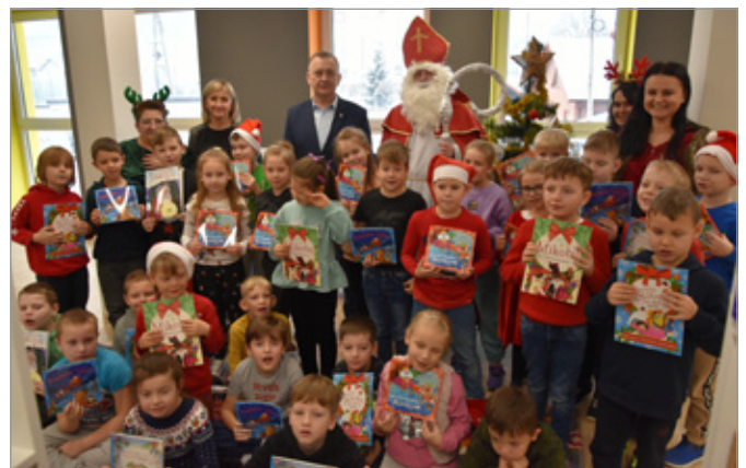
Pamiątkowe zdjęcie z Mikołajek w Bibliotece