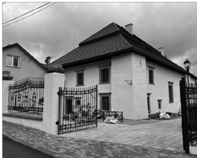
Zabytkowa Synagoga odzyskuje dawny blask

Dobiegają końca prace przy renowacji checińskiej Synagogi. Na realizację inwestycji pozyskano łącznie aż 7 mln 363 tysięcy złotych. W odnowionej Synagodze powstanie Centrum Pamięci Kultury Żydowskiej, które będzie służyć jako miejsce spotkań, konferencji, wystaw i wydarzeń edukacyjnych, promując tym samym dialog międzykulturowy i wzajemne zrozumienie.