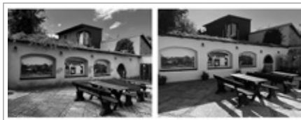
Dzielnica zabytkowej kamienicy Niemczówka po remoncie