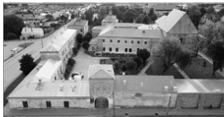
Gmina Chęciny pozyskała blisko pół miliona złotych rządowego dofinansowania na kolejny etap prac konserwatorskich w Klasztorze Ojców Franciszkanów