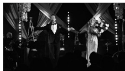
Koncert „Od operetki do Sinatry”