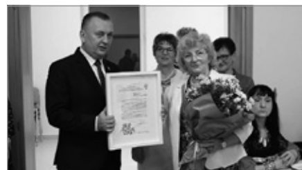
60 lat Kola Gospodyń Wiejskich w Siedlcach