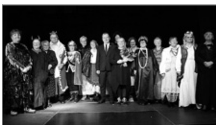
Niedziela z Kulturą