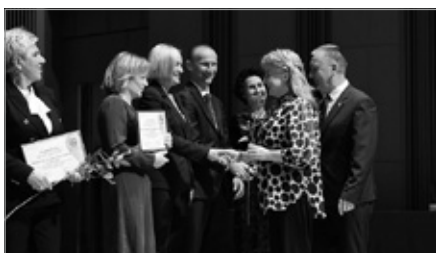
Nominacja MGOPS do nagrody Świętokrzyski Anioł Dobroci