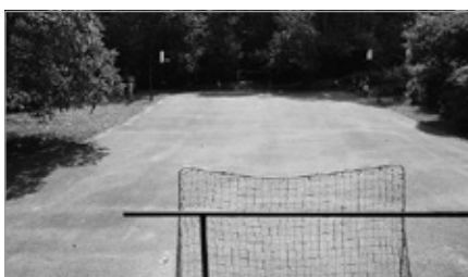
Pozyskano środki na budowę boiska w Czerwonej Górze