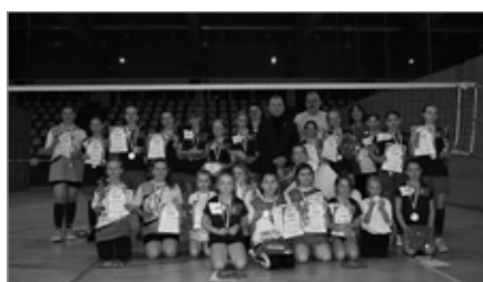
Podsumowanie projektu piłki siatkowej w Gminie Chęciny