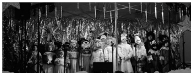
Kiermasz Świąteczny i wspólne kolędowanie na Rynku w Chęcinach