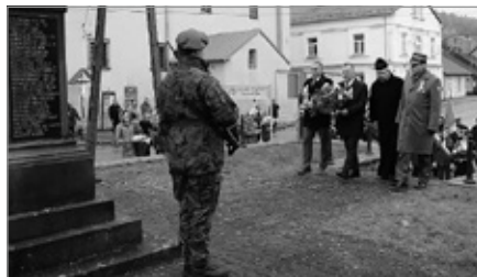
Obchody Narodowego Święta Niepodległości