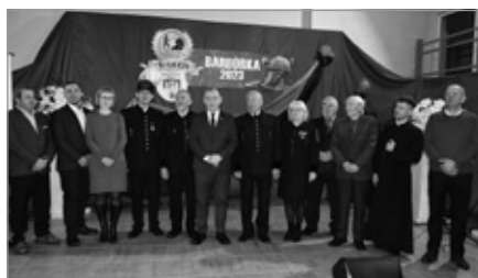
Barbórka w Miedziance