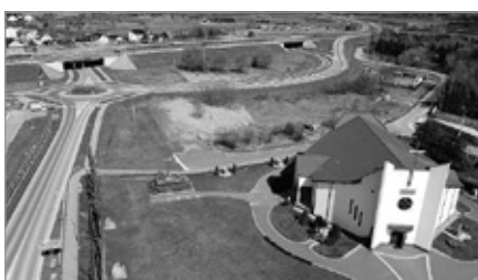
Trwa projektowanie parkingu przy Sanktuarium w Wolicy