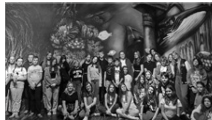
Realizacja projektu BMK