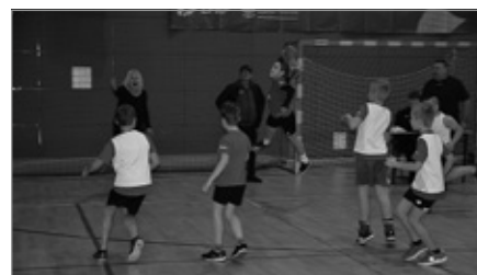
Gramy w ręczną