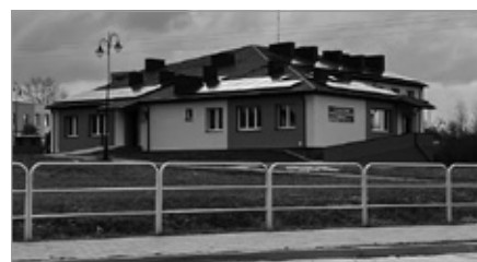
Termomodernizacja Przychodni Zdrowia w Chęcinach