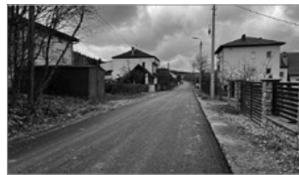
Odtworzenie nawierzchni drogi w Zelejewie