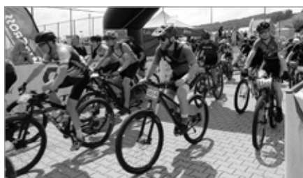
MTB Cross Maraton