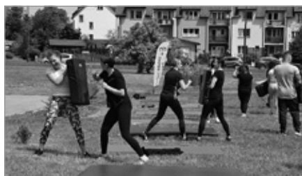
Bezpłatne treningi w ramach projektu „Samoobrona kobiet-zaufaj wojsku”