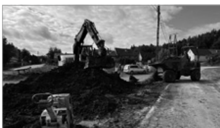
Budowa kanalizacji na rdzennej ul. Zelejowa