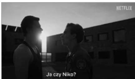
Nowy serialowy hit Netflix „Dziewczyna i kosmonauta” nagrywano w Chęcinach