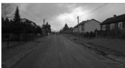
Remont drogi powiatowej w Siedlcah