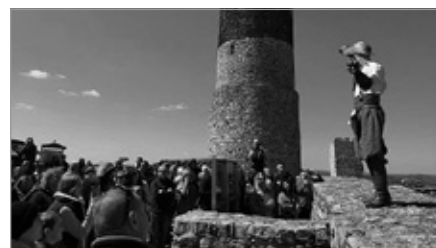
Wydarzenia artystyczne na Zamku