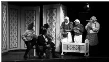
Festiwal OTE Senior