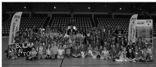
V Chęcińskie Igrzyska Gier i Zabaw Ruchowych