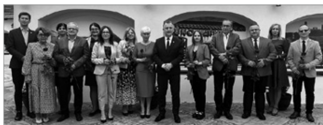
Dzień Edukacji Narodowej