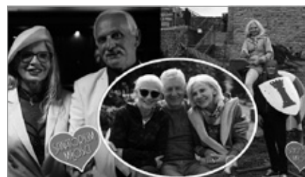
Nagrywanie odcinka „Sanatorium Miłości” na Zamku w Chęcinach