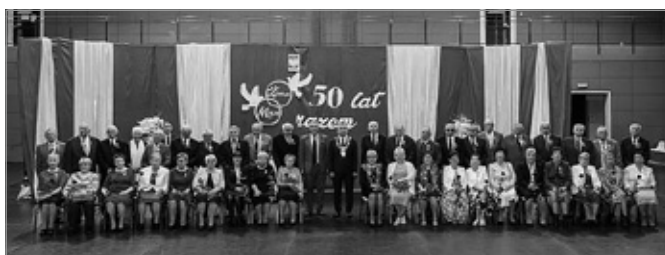
50-lecie pożycia małżeńskiego