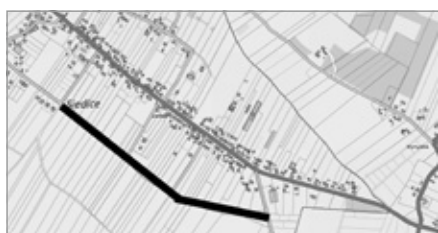
Rozbudowa drogi w Siedlcah (II-ga linia zabudowy)