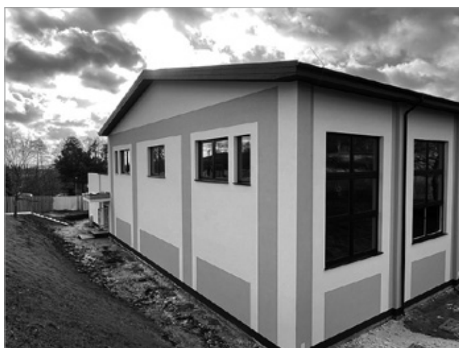
Hala sportowa przy SP w Bolminie w trakcie budowy

Trwa budowa hali sportowej przy Szkole Podstawowej w Bolminie. W ramach inwestycji wybudowana zostanie sala gimnastyczna z boiskiem. Powstanie tu także zaplecze socjalne, szatnie i natryski. Całość zostanie połączona z budynkiem szkoły łącznikiem. W ramach inwestycji zostanie także istniejące przy szkole trawiaste boisko sportowe, które zyska nową murawę. Rozbudowane będą trybuny, stany wiaty stadionowe dla drużyn, piłkochwyty oraz ogrodzenie i nowe bramki piłkarskie. Dodatkowo przebudowane będą schody. Umocniona i obsiana będzie też skarpa, a całość zyska energooszczędne oświetlenie.