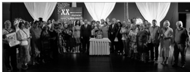
Jubileuszowy Wernisaż Poplenerowy