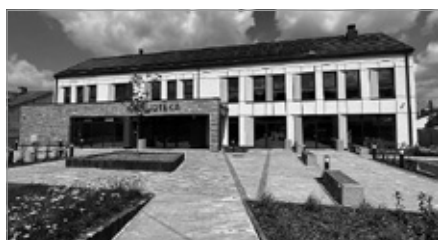
Budowa biblioteki wraz z miejscem dla seniorów