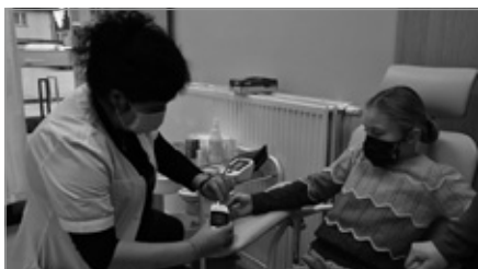
Akcja „Biała Niedziela” w Ośrodku Zdrowia w Wólce