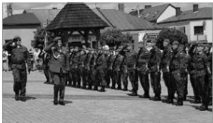
Przysięga Wojskowa na Rynku w Chęcinach