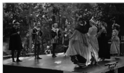
Występ Cracovia Danza