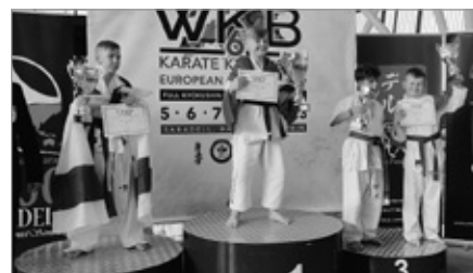
Mistrzostwa Europy Karate Kyokushin w Barcelonie i podwójne podium dla Klubu Karate Shiro