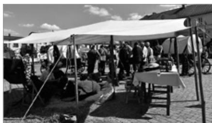
Rekonstrukcja historyczna - obchody Powstania Styczniowego