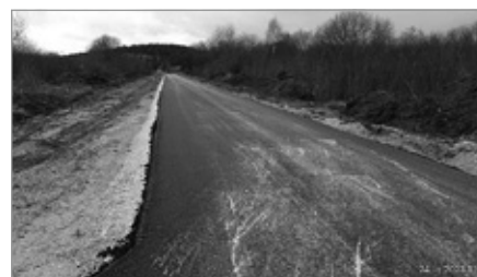
Rozbudowa drogi na Osiedlu Zelejowa dz. 604