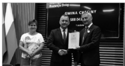
Pozyskanie środków na dalszy remont ul. Małogoskiej