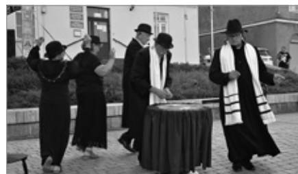
Festiwal Kultury Żydowskiej