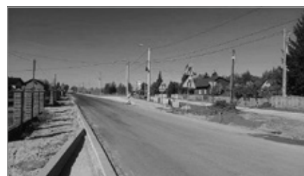
Rozbudowa drogi Siedlce-Łukowa