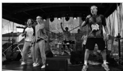
Koncert Youtuberów Trzech Króli w Chęcinach