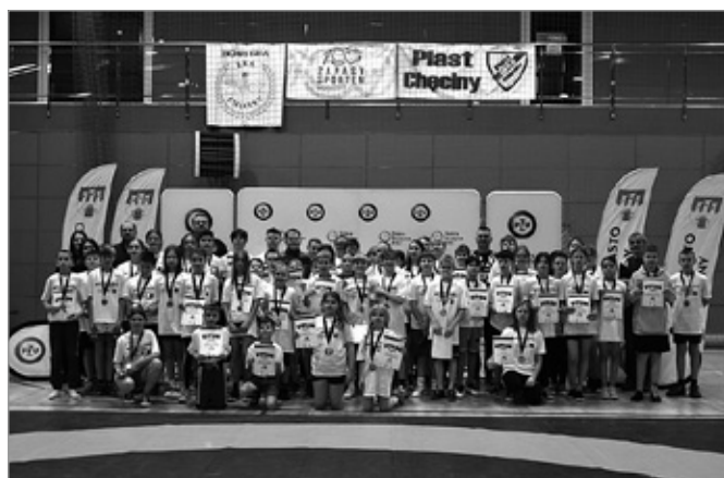
Szkoła Podstawowa w Radkowicach będzie reprezentować Gminę Chęciny na arenie województwa