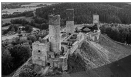
Gmina pozyskała środki na kontynuowanie prac budowlano-remontowych – remontowych zabezpieczających istniejącą strukturę murów Zamku Królewskiego w Chęcinach