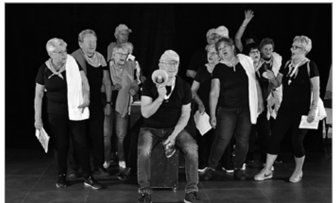
Realizacja projektu wyzwoliła w seniorach niezwykle pokłady energii

Dofinansowanie uzyskane od Samorządu Województwa Świętokrzyskiego pozwoliło na zakup strojów, które dodat-