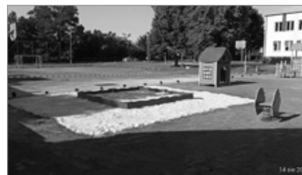
Nowy plac zabaw w Wolicy