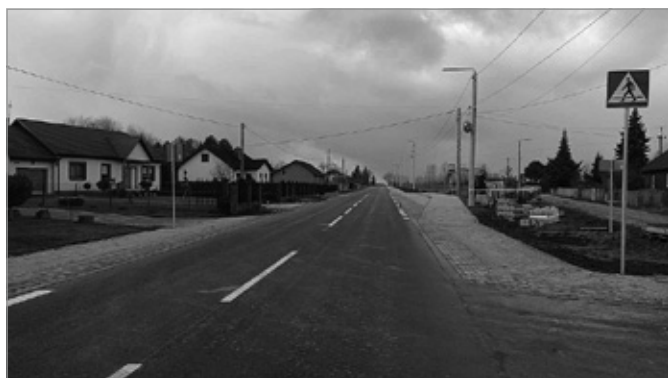
Remont drogi Siedlce-Łukowa

Dobiega końca rozbudowa drogi Siedlce-Łukowa. W ramach prac wykonano m.in. chodnik, zatoczki autobusowe, parking przy cmentarzu w Łukowej oraz bezpieczne skrzyżowania z przejściami dla pieszych.