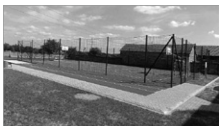
Budowa boiska wielofunkcyjnego i siłowni zewnętrznej w Radkowicach