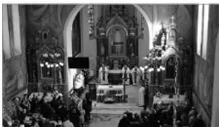
Gmina pozyskała środki na renowację zabytkowych dwóch ołtarzy znajdujących się w Kościele Parafialnym pw. NMP Królowej w Łukowej