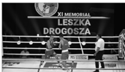
Międzynarodowa Gala Boksu