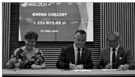
Gmina Chęciny pozyskała wysokie dofinansowanie z Rządowego Programu „Maluch+” na budowę żłobka w Siedlcach