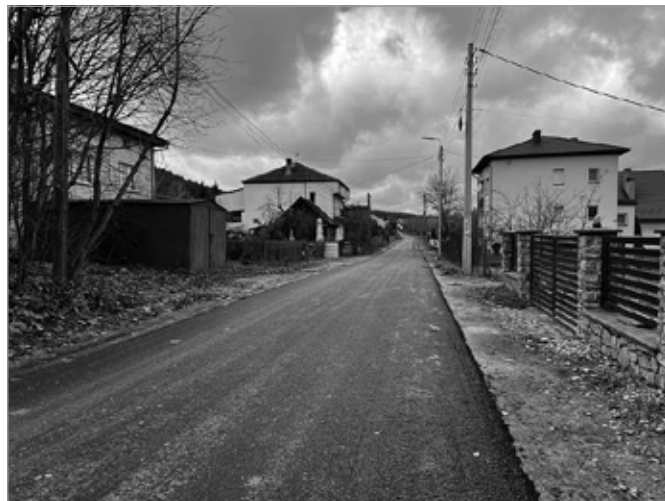
Ulica Zelejowa doczekała się remontu

Trwają prace związane z odtworzeniem nawierzchni drogi na ul. Zelejowa. Prace obejmują m.in. frezowanie nawierzchni, roboty brukarskie, układanie warstw bitumicznych. Wcześniej wykonano tu prace związane z budową kanalizacji.