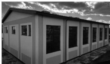
Budowa hali sportowej przy SP w Bolminie