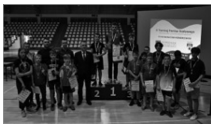
Turniej Tenisa Stołowego