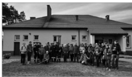
Rajd z kajakami