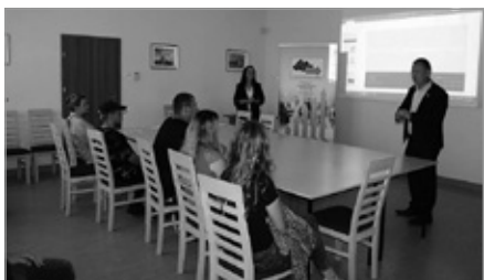
„Aktywizacja zawodowa osób bezrobotnych i poszukujących pracy”