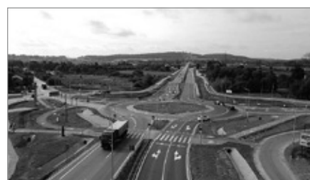
Budowa ważnego ronda turbinowego z wjazdem na Czerwoną Górę