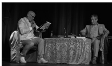
Spotkanie z aktorem Jerzym Zelnikiem