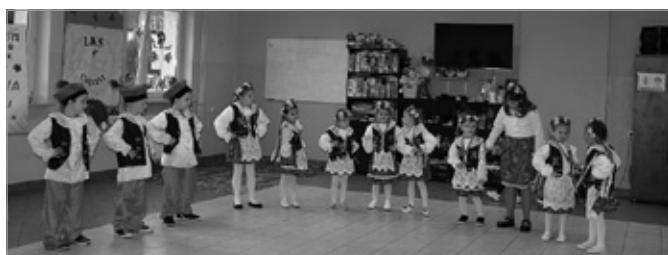
Utworzenie Małej Akademii Folkloru w Łukowej