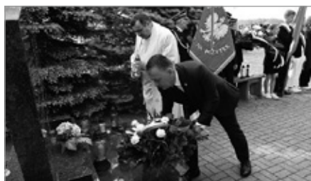
Rocznica Pacyfikacji Wolicy