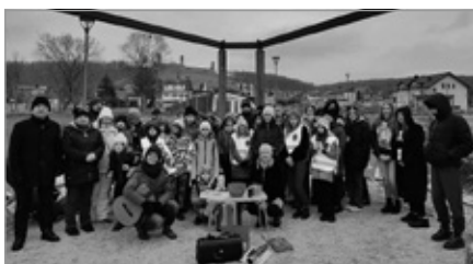
Radosne śpiewogranie w Parku Miejskim