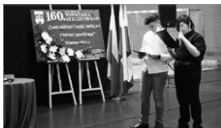
Symposium historyczne dla uczniów – Powstanie Styczniowie