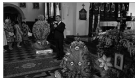
Msza Dożynkowa w Kościele Parafialnym w Chęcinach