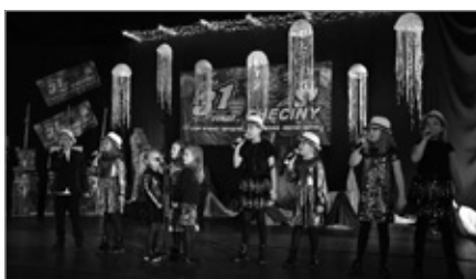
Wielka Orkiestra Świątecznej Pomocy