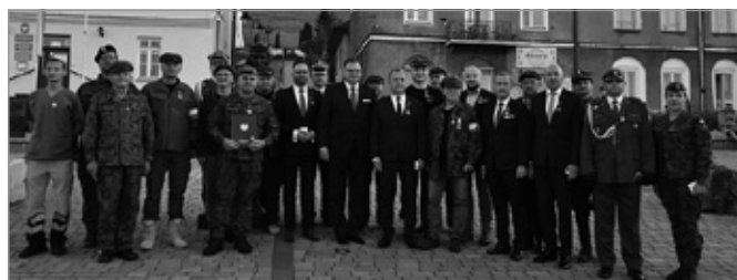
Marsz Szlakiem I Kompanii Kadrowej