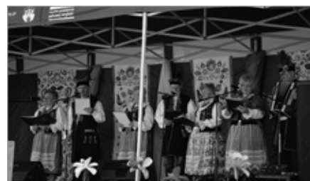
Majówka w Chęcinach