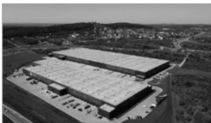
Rozbudowa Centrum Logistycznego - 7R