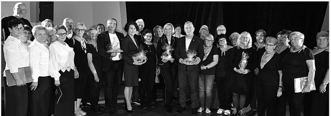
Chęciński Uniwersytet Trzeciego Wieku realizował projektu „Poznajemy środowisko – jesteśmy zdrowi”, który był dofinansowany ze środków Samorządu Województwa Świętokrzyskiego.