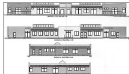
Pozyskanie dodatkowej działki pod budowę żłobka w Siedlcach