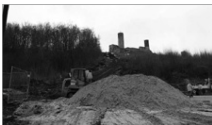
Budowa kanalizacji i wodociągu do Zamku