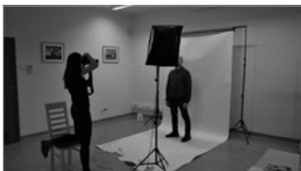
Casting do filmu fabularnego – prequel „Sami Swoi”