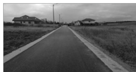
Rozbudowa części drogi ul. Słoneczna w Wolicy