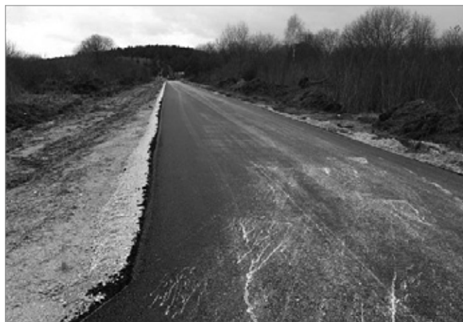
Powstaje nowa droga na osiedlu Zelejowa

Rozbudowa drogi na os. Zelejowa dz. 604 oraz częściowo na dz. nr 637/6 (obręb 1 od ulicy Zelejowa do ul. Dąbrowskiego) obejmie również budowę ciągu pieszo-rowerowego, który umożliwi bezpieczne poruszanie się zarówno pieszych, jak i rowerzystów.