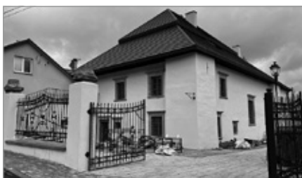
Odrestaurowanie zabytkowej synagogi