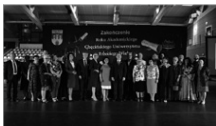
Zakończenie Roku Akademickiego CHUTW