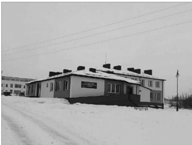
Termomodernizacja przychodni w Chęcinach

Budynek przychodni w Chęcinach zmienia swoje oblicze. Oprócz docieplenia ścian i stropów w ramach prac wykonano wymianę dachu, okien i drzwi. Na dachu zostały zamontowane panele fotowoltaiczne, dzięki czemu przychodnia nie tylko zmieni swoje oblicze, ale stanie się energooszczędna.