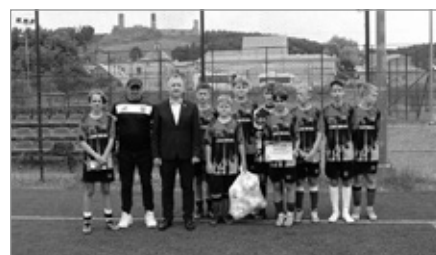
Piłkarska Kadra Czeka