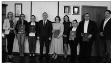
Wręczenie aktów nadania stopnia awansu zawodowego