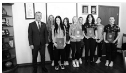
Przyznanie stypendiów sportowych