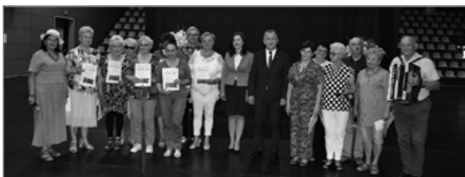
Zakończenie projektu CHUTW