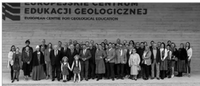
Inauguracja Sezonu Turystycznego