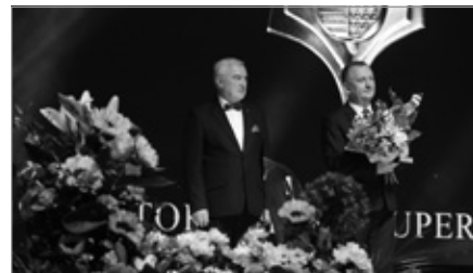
Świętokrzyska Victoria – nagroda Marszałka dla Gminy i Miasta Chęciny