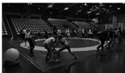
Gala Sportów Walk