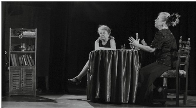
Teatr „Parabuch” z Warszawy