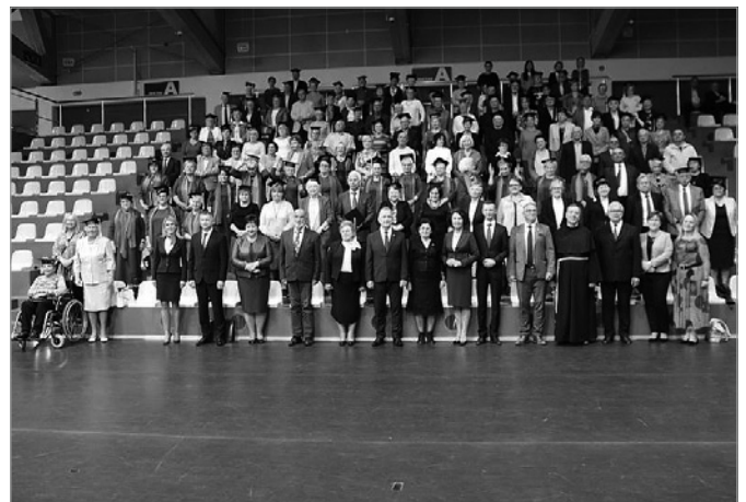
Chęciński uniwersytet Trzeciego Wieku liczy ponad 160 słuchaczy