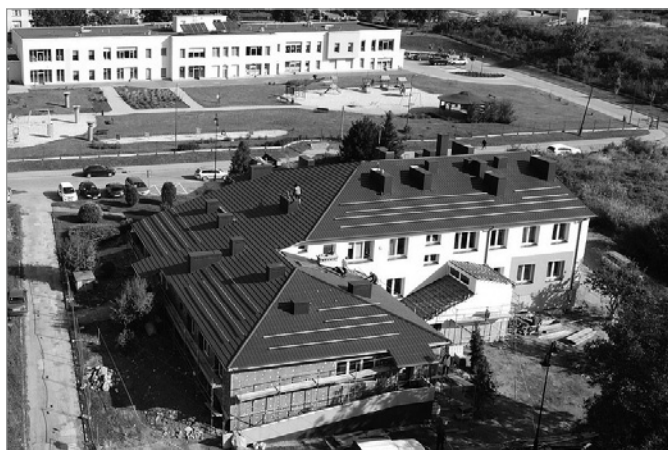
Przychodnia nie tylko zyska na wyglądzie i funkcjonalności, ale stanie się dużo bardziej oszczędna w użytkowaniu

P elną parą idą prace związane z kompleksową termomodernizacją Samorządowego Zakładu Podstawowej Opieki Zdrowotnej w Chęcinach. Jeszcze w tym roku budynek chęcińskiej przychodni nie tylko zyska całkowicie nowy wygląd, ale stanie się też budynkiem energooszczędnym i ekologicznym. Jak podkreśla burmistrz Gminy