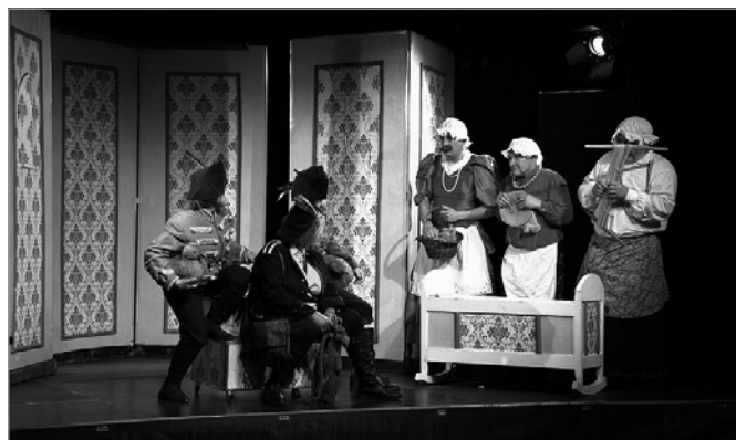
Teatr Ludowy „Tradycja” z Alwerni