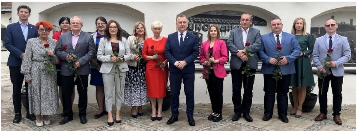
Podziękowano dyrektorom, nauczycielom i pracownikom oświaty za całoroczny trud pracy.