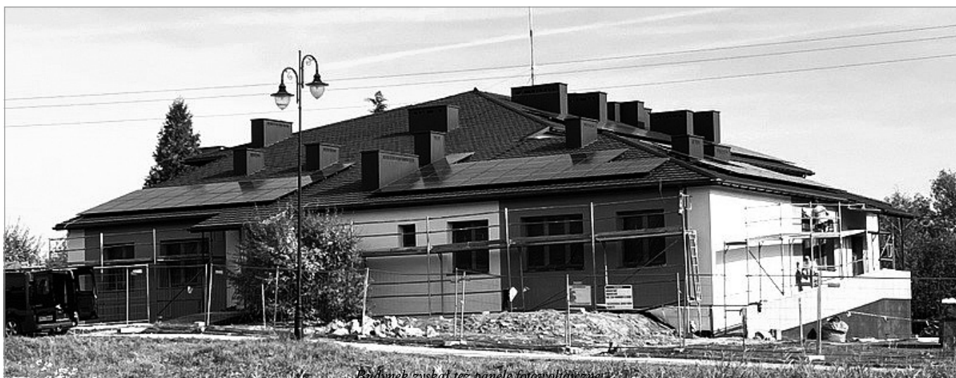
Budynek zyskał też panele fotowoltaiczne

Już niebawem przychodnia w Chęcinach całkowicie zmieni swój wygląd, a to za sprawą kompleksowej termomodernizacji, która już tu trwa. Na realizację kosztownej inwestycji władze Gminy i Miasta Chęciny właśnie pozyskały dodatkowe dofinansowanie unijne. Inwestycja ma być gotowa do końca listopada bieżącego roku. Po jej zakończeniu budynek nie tylko zyska na wyglądzie i funkcjonalności, ale stanie się też dużo bardziej oszczędny w użytkowaniu.