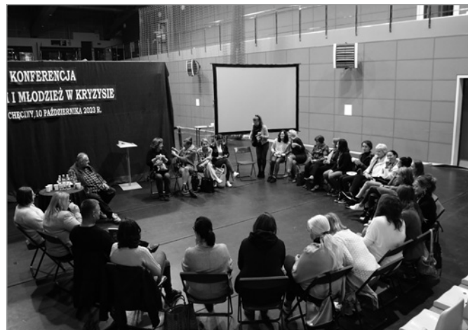
Spotkaniu towarzyszyły warsztaty dla pedagogów