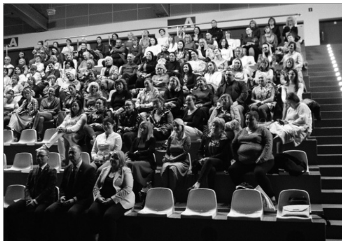
Konferencja cieszyła się wyjątkową frekwencją