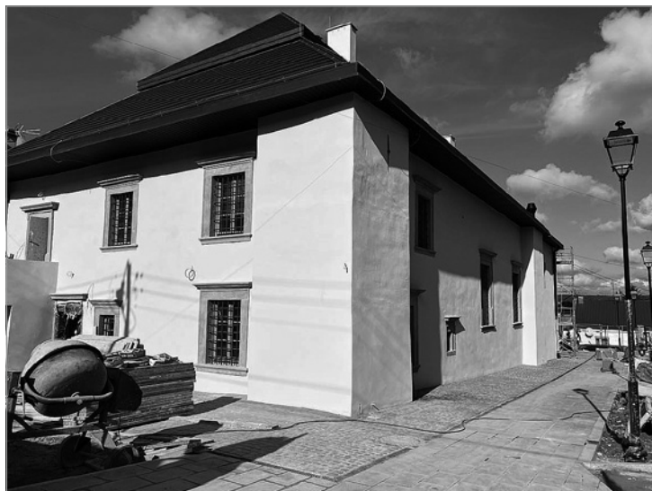
Nowa elewacja na obiekcie Synagogi

Synagoga zyskała już nowe pokrycie dachowe oraz nową elewację. Praca wchodzi także wewnątrz budynku. We wszystkich łazienkach, korytarzach i kotłowni jest już gotowa glazura, a w pozostałych pomieszczeniach trwają zaawansowane prace tynkarskie. Teren wokół synagogi zyskał nawierzchnię z kamienia. Warto podkreślić, że wszystkie prace od samego początku prowadzone są pod ścisłym nadzorem konserwatora zabytków, aby zachować autentyczność i charakter tego miejsca.