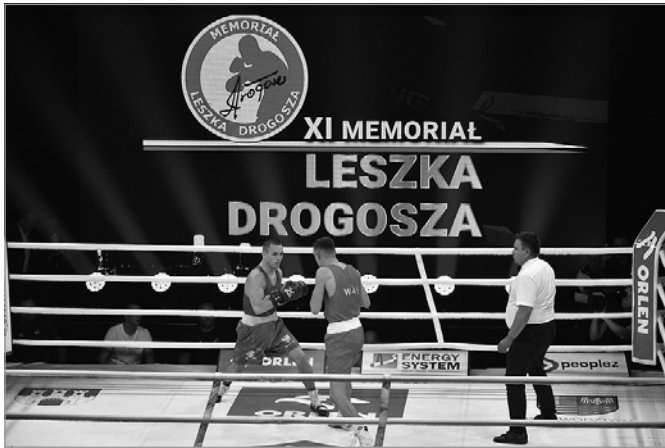
Turniej przyciągnął blisko stu pięściarzy z dwunastu państw

szczególne charakteru. Dla wielu uczestników i kibiców była to szansa na bliższe poznanie osoby, która stała za tym wielkim sportowcem. - Bardzo się cieszę, że są ludzie, którzy zorganizowali jedenastą edycję memoriału, że jest kul-