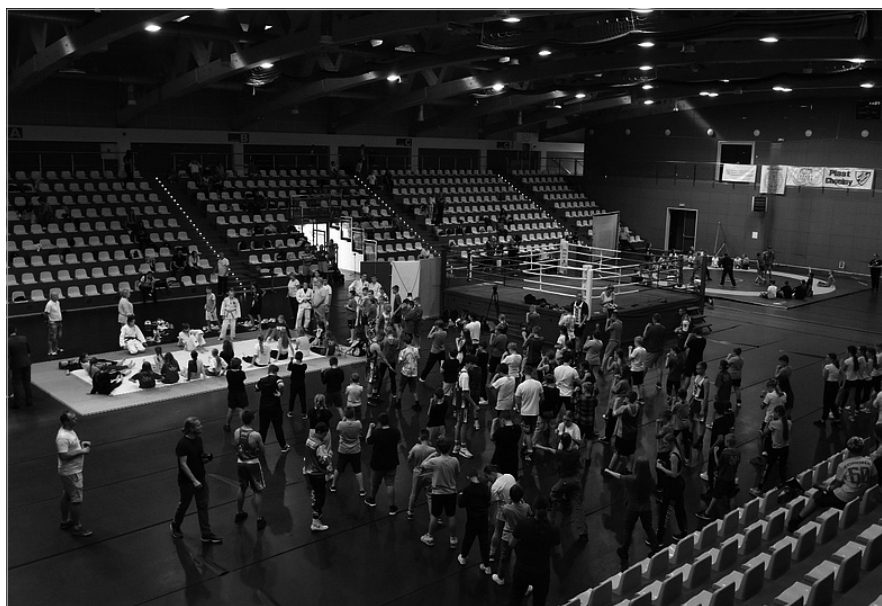
Wydarzenie stanowiło doskonałą okazję do zapoznania się z tajnikami boksu, zapasów i judo

- Cieszę się, że pierwsza edycja Świątokrzyskiej Gali Sportów Walki odbywa się w naszym pięknym mieście, w Chęcinach. Jestem przekonany, że to wydarzenie będzie nie tylko aktywnym spędzeniem czasu, ale także nauką, rozwijaniem umiejętności i kształtowaniem wartości, takich jak szacunek, dyscyplina i dążenie do celu. Dlatego cieszę się, że uczestnicy będą mieli okazję brać