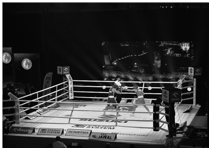
Chęciny stały się prawdziwą stolicą boksu