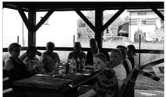
Spotkanie z mieszkańcami Wojkowca