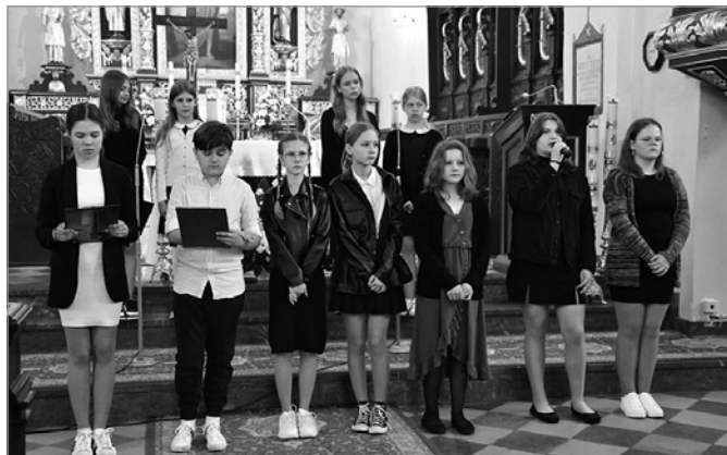
Program słowno-muzyczny w wykonaniu uczniów z SP Chęciny pod opieką nauczycieli

O tych tragicznych wydarzeniach nie sposób zapomnieć. Mieszkańcy Chęcin każdego roku oddają hołd pomordowanym. Uroczyste obchody rozpoczęły się w kościele parafialnym p.w. Św. Bartłomieja w Chęcinach od występu uczniów ze Szkoły Podstawowej im. Jana Kochanowskiego w Chęcinach. W patriotycznym programie słowno-muzycznym nie brako-