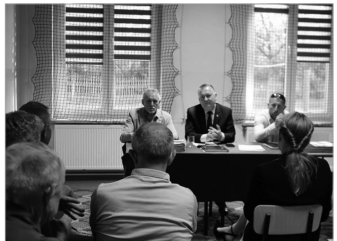
Spotkanie z mieszkańcami Ostrowa