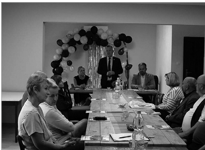
Spotkanie z mieszkańcami Gościńca