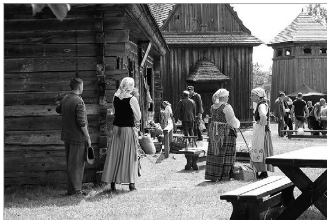
Nagrywanie scen do filmu prequel komedii „Sami Swoi”