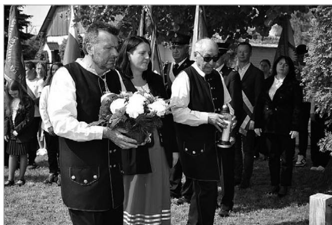
W uroczystości wzięło również udział KGiGW z Wolicy