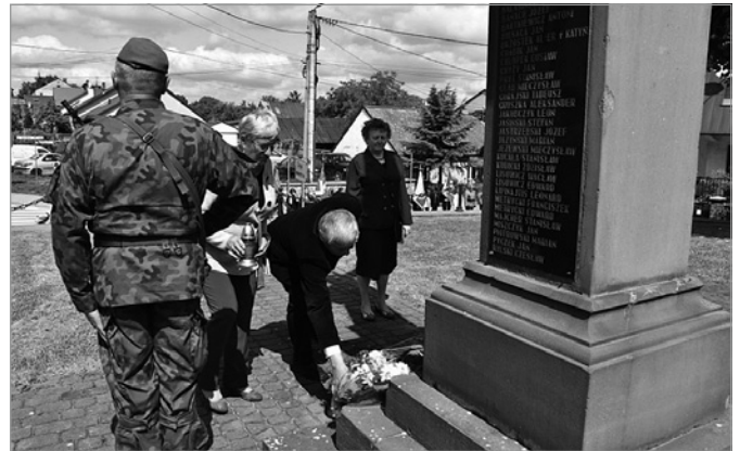
Wieniec pod pomnikiem złożyli również przedstawiciele Klubu Seniora