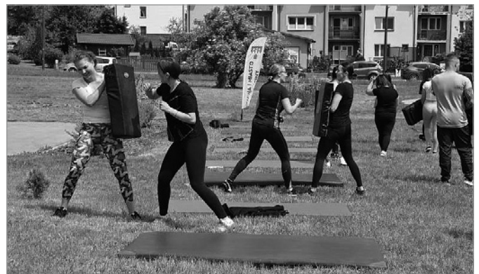
Uczestniczki wydarzenia poznały techniki walk i samoobrony