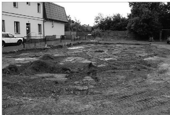
Za budynkiem szkoły w Radkowicach powstanie boisko

Wszystko wskazuje na to, że już niebawem spełni się jedno z większych marzeń uczniów Szkoły Podstawowej w Radkowicach. W końcu doczekają się nowoczesnego boiska wielofunkcyjnego. 9 czerwca podpisano umowę na długo wyczekiwaną przez lokalną społeczność inwestycję. - Teren za budynkiem szkoły już niebawem całkowicie zmieni swój wygląd. Powstanie tu nowoczesny obiekt sportowy, w ramach którego wybudujemy boisko z nawierzchnią poliuretanową o wymiarach 18×30 m. Będzie można na nim grać w siatkówkę, koszykówkę i piłkę ręczną. Całość będzie ogrodzona, pojawią się też piłkochwyty o wysokości około 4 metrów. Będzie też bieżnia i skocznia do skoku w dal – wymienia burmistrz Gminy i Miasta Chęciny Robert Jaworski.