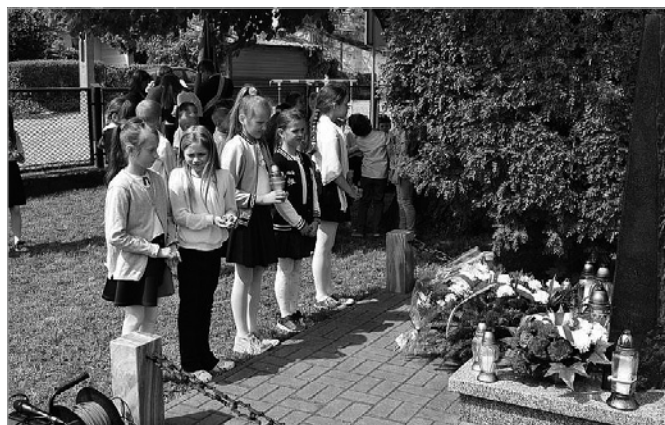
Hołd pomordowanym oddali także najmłodszy uczestnicy uroczystości