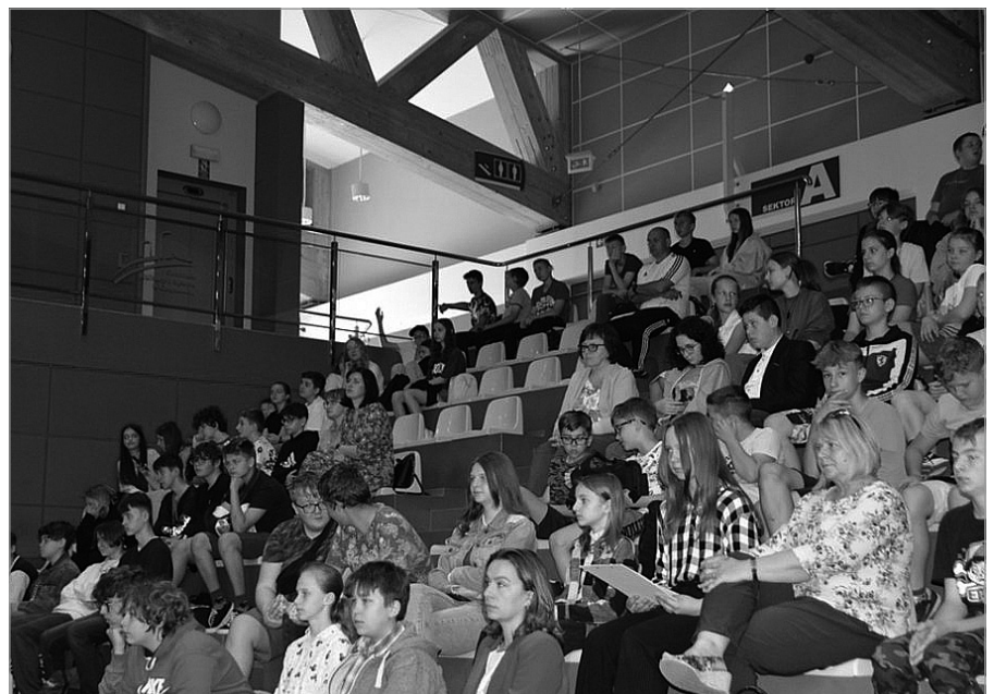
Seminarium skierowane było do młodzieży z klas 7-8