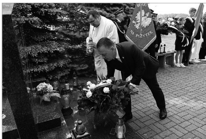
Władze samorządowe złożyły wieńce pod pomnikami upamiętniającymi tragedię z 1944 r.

darzeniach, o tych którzy walczyli o wolną Ojczyznę. - 26 maja to szczególny dzień w historii naszej gminy i w historii Wolicy. Każdy, kto bierze udział w tych uroczystościach pochyla się nad bolesnymi kartami historii. Jesteśmy tu po to, aby o wydarzeniach, które miały miejsce na tym terenie nie zapomnieli młodzi ludzie. Żeby pamiętali o bohaterach tych znanych i tych nieznanymi, którym zawdzięczamy wolność. Dzięki kulturowaniu i przekazywaniu historii kolejnemu pokoleniu dbamy o naszą tożsamość. Cytując poetę Cypriana Kamila Norwida „Ojczyzna to wielki zbiorowy obowiązek”. Znaczący to nic innego jak to, że patriotyzm powinien stanowić dla nas jedną z najwyższych wartości. Oddajmy dziś hołd i cześć tym, którzy 79 lat temu stanęli z bronią w rękę i oddali za nas swoje życie – mówił burmistrz, który złożył wszystkim serdeczne podziękowania za obecność na uroczystości.