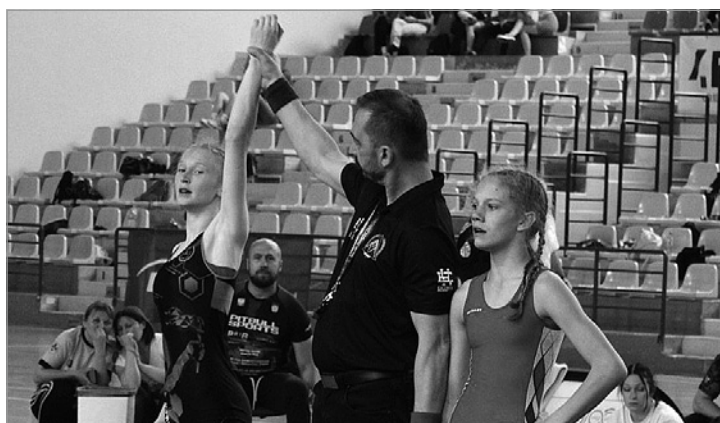
Wielka radość zawodników Industrii Znicz Chęciny z sukcesu

Industria LKS Znicz Chęciny