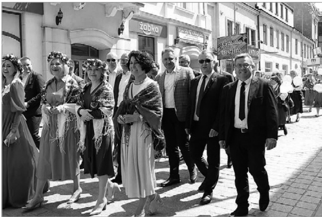
W korowodzie przeszły również KGW z terenu Gminy i Miasta Chęciny