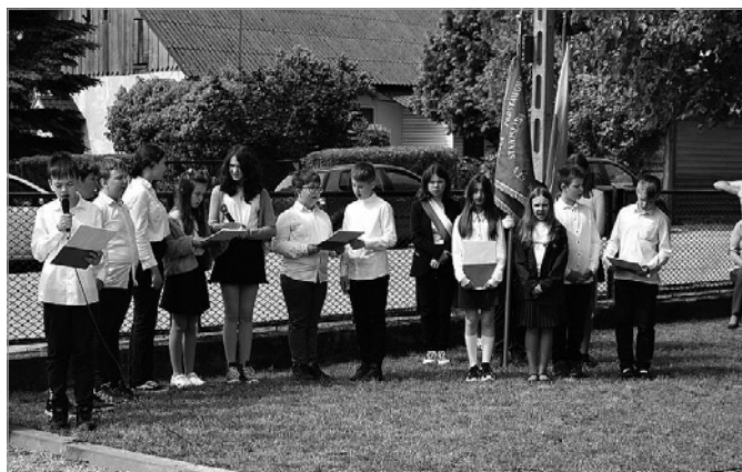
Uczniowie, pod opieką nauczycieli, przedstawili program słowno-muzyczny