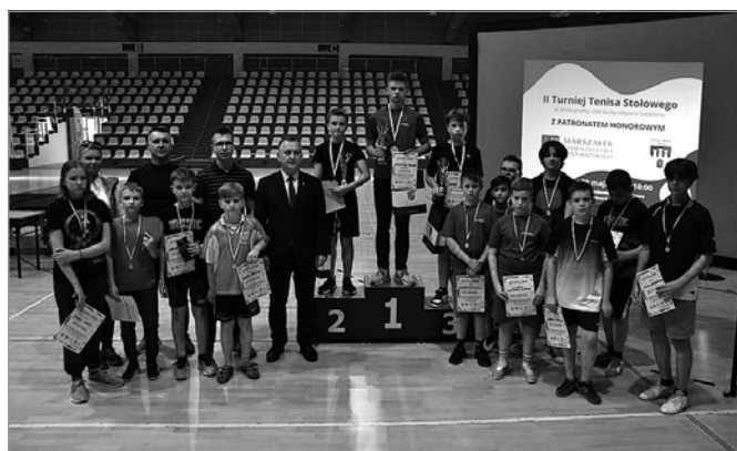
Radość i dobra atmosfera towarzyszyła podczas wydarzenia

Gratulujemy wszystkim zwycięzcom i życzymy dalszych sukcesów na kolejnych turniejach!