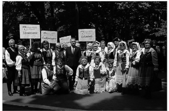
Miła atmosfera sprzyjała pamiątkowym zdjęciom

K orowód przeszedł sprzed pomnika Henryka Sienkiewicza do parku miejskiego, gdzie Koła Gospodyń Wiejskich zaprezentowały swoją twórczość, mogły się zintegrować i wymienić doświadczeniami. Na scenie swoją twórczość zaprezentowali także nagrodzeni owacjami Lipowiczanie, Siedlecczanie i Łukowianki.