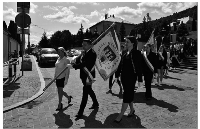
Wydarzenie uświetniły poczty sztandarowe Gminy i Miasta Chęciny, Stowarzyszenia Rekonstrukcji Historycznych „Jodła” oraz szkół