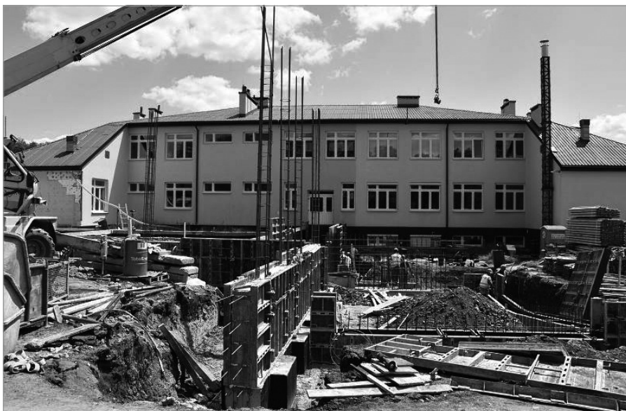
Przy szkole w Bolminie powstanie hala sportowa

ną część pokryje pozyskane przez władze gminy rządowe dofinansowanie w ramach Polskiego Ładu. - Jestem przekonany, że nowoczesna baza sportowa bez wątpienia będzie zachęcać do aktywnego spędzania wolnego czasu.