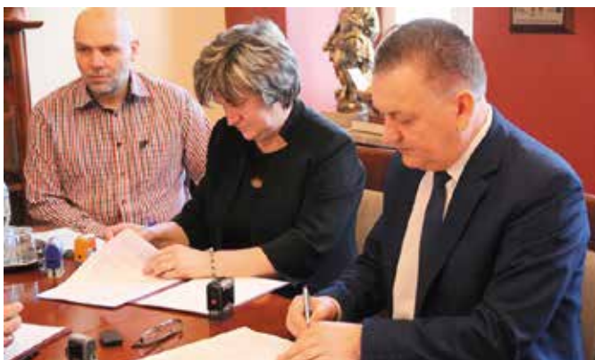
Mieszkańcy Polichna będą niebawem cieszyć się nową drogą