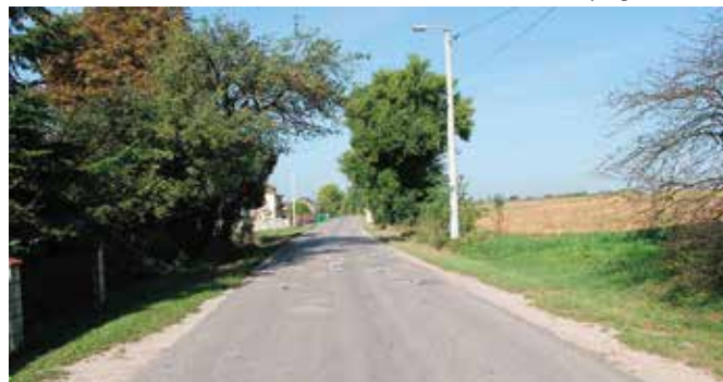
Droga Siedlce - Łukowa zostanie zrealizowana dzięki pozyskanemu przez Powiat i Gminę rządowemu dofinansowaniu