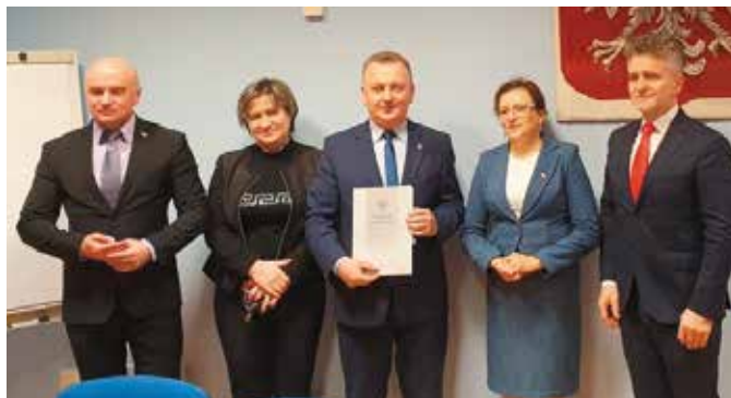
Mieszkańcy Ostrowa z pewnością ucieszą się z kursów autobusowych

23 grudnia 2019 r. w Urzędzie Wojewódzkim w Kielcach umowę w ramach Funduszu rozwoju przewozów autobusowych