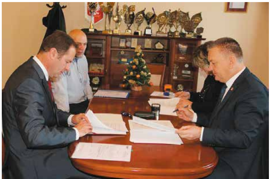
Na Osiedlu Zelejowa powstaną dwie nowe drogi

Niezwłocznie po otrzymaniu informacji o przyznaniu rządowego dofinansowania gmina ogłosiła przetargi na wyłonienie wykonawców zaplanowanych inwestycji. Jeśli chodzi o zadanie pod nazwą: „Projekt i budowa ulicy H. Sienkiewicza i ulicy T. Kościuszki wraz z odwodnieniem i oświetleniem w miejscowości Chęciny, gmina Chęciny”, to najniższą ofertę cenową złożyła firma TRAKT S. A. z siedzibą w Górkach Szczukowskich. Jedno z największych drogowych zadań zostanie wykonane za kwotę 6 milionów 462 tysięcy złotych. Połowę tych kosztów pokryje rządowe dofinansowanie. - Budowa tych dróg jest niezwykle istotna. Do tego powstaną też tutaj chodniki i oświetlenie. Ciężko byłoby wykonać tak dużą inwestycję tylko i wyłącznie z własnych środków. Rządowe dofinansowanie, jakie pozyskaliśmy na jej realizację, jest dla nas bardzo dużym wsparciem.