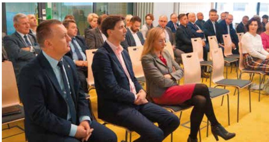
Gmina Chęciny jest modelowym przykładem zarządzania i wprowadzania nowatorskich metod w oświacie

Lunch edukacyjny w Chęcinach stał się doskonałą okazją do zainicjowania dyskusji na temat zarządzania jakością samorządowej edukacji oraz projektowania efektywnych zmian. Poruszone zostały istotne dla wszystkich samorządowców tematy. Mówiono o dobrych doświadczeniach dotyczących zarządzania lokalną oświatą i sposobach pozyskiwania wsparcia. Dyskutowano także o realnej zmianie postaw i kompetencji nauczycieli, a także o najbardziej efektywnym wykorzystywaniu środków z subwencji oświatowej na rzecz ukierunkowanego rozwoju lokalnej oświaty.