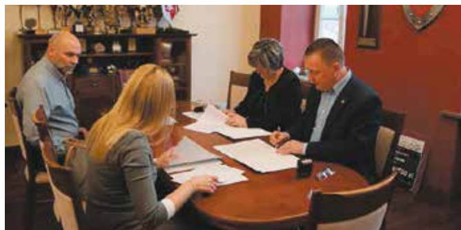
Woda i kanalizacja niebawem będzie w Murowańcu