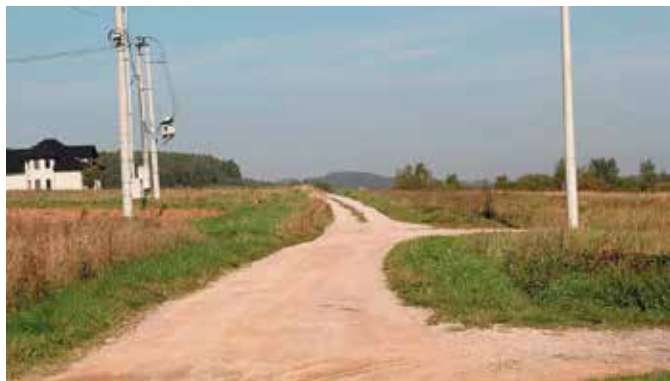
Ta droga otworzy nową strefę pod budownictwo mieszkaniowe.