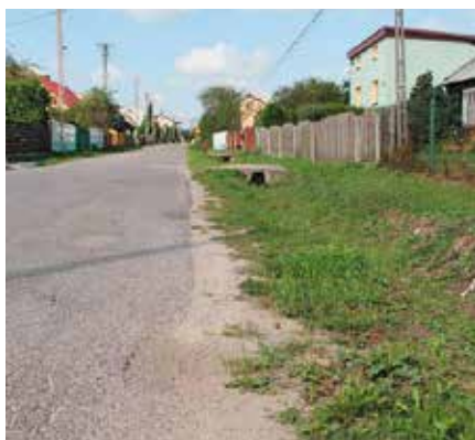
Droga Lipowica-Przymiarki-Starochęciny zostanie przebudowana na długości dwóch kilometrów i 150 metrów.

Warto dodać, że na przebudowę drogi Lipowica-Przymiarki-Starochęciny samorząd Powiatu Kieleckiego złożył wspólnie z Gminą i Miastem Chęciny wniosek o dofinansowanie w ramach