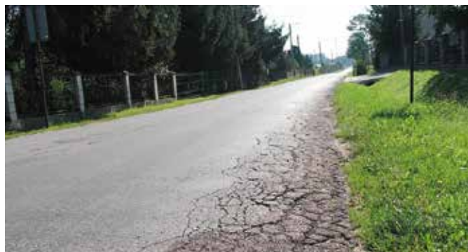
Droga Siedlce - Łukowa zostanie zrealizowana dzięki pozyskanemu przez Powiat i Gminę rządowemu dofinansowaniu