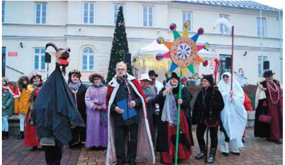
W klimat Świąt wprowadził nas orszak kołędniczy, który poprowadzili seniorzy z Chęcińskiego Uniwersytetu Trzeciego Wieku

A na pięknie i klimatycznie przygotowanej scenie kolejno śpiewali przedstawiciele różnych grup społecznych i zawodowych, między innymi dzieci, młodzież, seniorzy, pracownicy Szpitala w Czerwonej Górze, koła gospodyń wiejskich, samorządowcy, dyrektorzy szkół i nauczyciele, strażacy i członkowie stowarzyszeń. Zanim to jednak nastąpiło