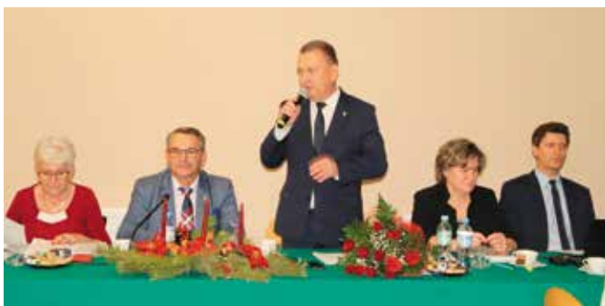
Budżet na 2020 rok jest rozwojowy i inwestycyjny