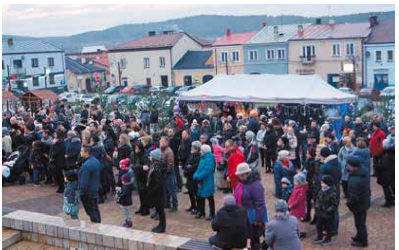
Tegoroczny Kiermasz Bożonarodzeniowy cieszył się dużym zainteresowaniem ze strony mieszkańców