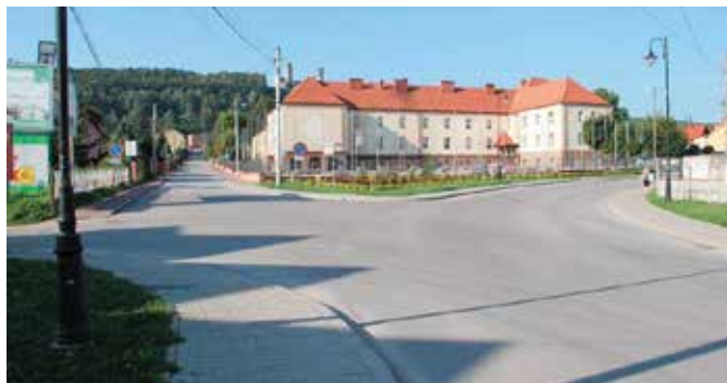
Nowe skrzyżowania zwiększą bezpieczeństwo w Chęcínach