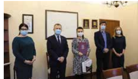
Uroczyste mianowanie nauczyciela