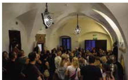
Nocne Zwiedzanie Zabytków Chęciny