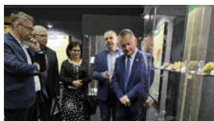
Minerały i skały ozdobne Polski. Nowa wystawa w Miedziance