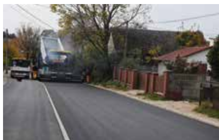
Budowa drogi w Polichmie przy szkole