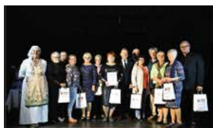
VII Ogólnopolski Festiwal Teatralny OTE-senior 2022