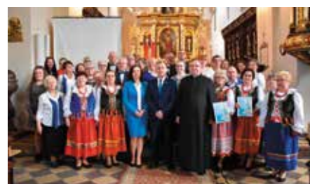
Koncert Pieśni Maryjnych