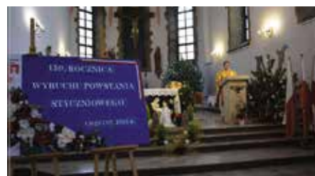
W Chęcinach uczczono 159 rocznicę wybuchu Powstania Styczniowego