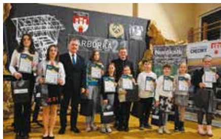
Barbórka 2022 w Miedziance