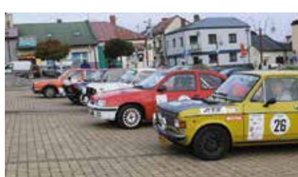
Zabytkowe auta w Chęcinach