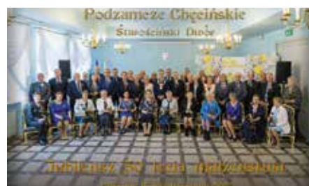
Medale za jubileusz 50-lecia małżeństwa