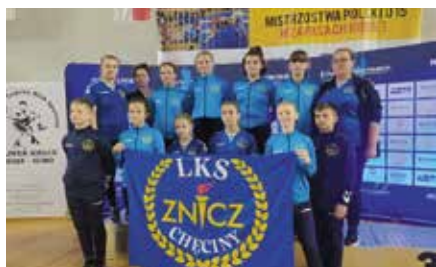
Sukcesy sportowe ZNICZ Chęciny