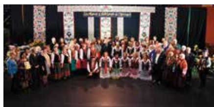
Spotkanie z Folklorem