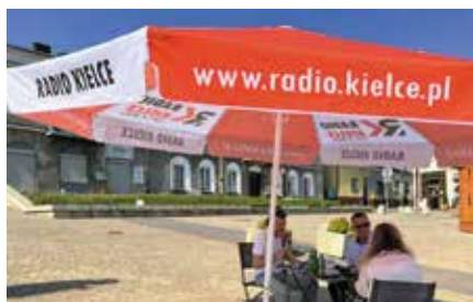
Radio Kielce w Chęcinach