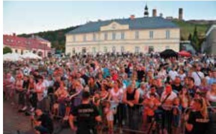
Chęciny dla Ukrainy