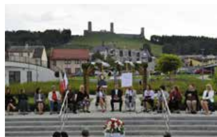
Ballady i romanse - Narodowe czytanie