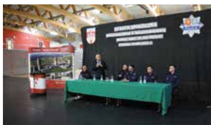
Debata społeczna poświęcona bezpieczeństwu