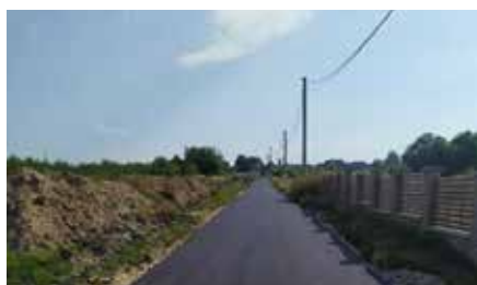
Nowa droga w Tokarni