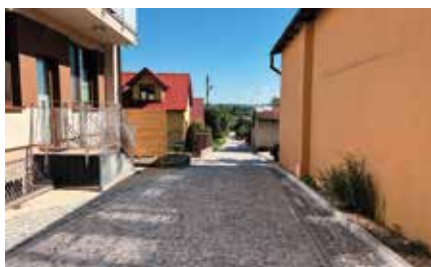
Rewitalizacja chęcinińskich uliczek