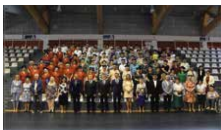
Uroczyste zakończenie roku akademickiego CHUTW