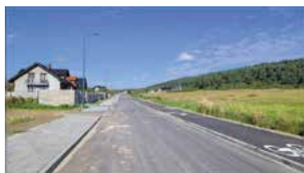
Zakończyły się prace przy budowie drogi, chodnika, ścieżki rowerowej ul. Kościuszki Os. Zelejowa