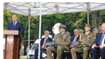
W Chęcinach uroczystość obchodzona Święto Wojska Polskiego