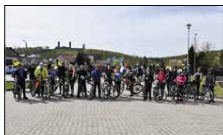
Udany rajd rowerowy do Miedzianki