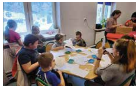
Ferie w Gminie Chęciny