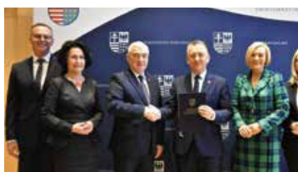
Gmina Chęciny w pilotażowym projekcie wspierającym seniorów