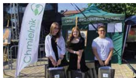
Kolejny sukces uczniów SP w Chęcinach w konkursie Nasi sąsiedzi- Zydzi