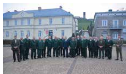
Uroczyste powołanie Oddziału Chęcińskiego Klubu Kolekcjonera i Kultury Łowieckiej PZŁ