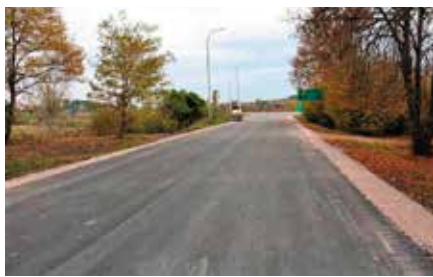
Remont drogi ul. Dobrzączka