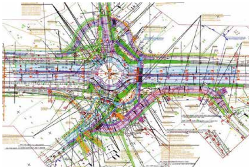
Projekt przebudowy skrzyżowania DW nr 762 Kielce - Chęciny z drogą powiatową koło Czerwonej Góry.