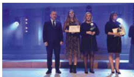
Stowarzyszenie Asumpt z nominacją do statuetki „Świętokrzyskiego Anioła Dobroci”