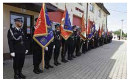
100-lecie OSP Wolica