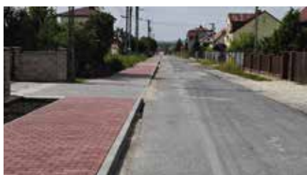
Trwa budowa chodników na odcinku drogi Lipowica- Przymiarki-Starochęciny