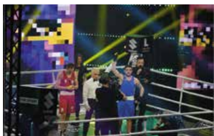
Suzuki Boxing Night - Gala Boksu w Chęcinach