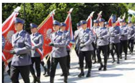
Wojewódzkie obchody Święta Policji w Chęcinach