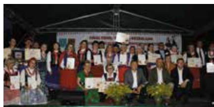
Finał XXII Powiatowego Przeglądu Zespołów Folklorystycznych. Laureatami artyści z gminy Chęciny