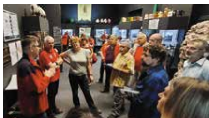
Muzealna Izba w Miedziance z rekordową liczbą turystów