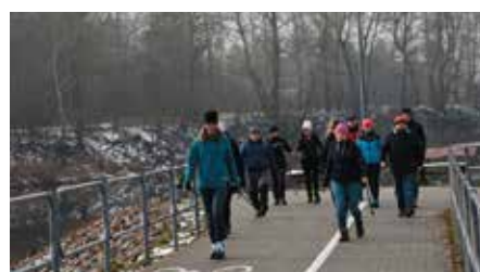
Cykl rajdów z kijkami