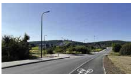
Końca dobiegły prace przy budowie drogi, chodnika, ścieżki rowerowej ul. Sienkiewicza