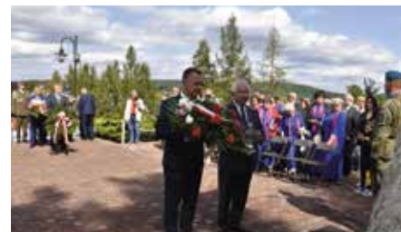
Święto Lotników w Gościńcu