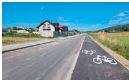
Budowa drogi Polichno-Gościmiec