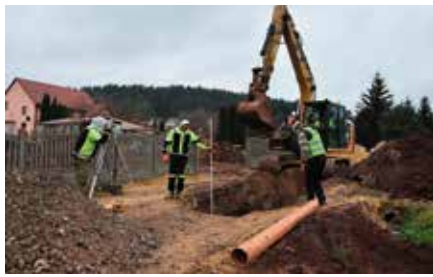
Budowa kanalizacji – rdzenna ul. Zelejowa