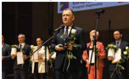
Gmina Chęciny Liderem Ekonomii Społecznej