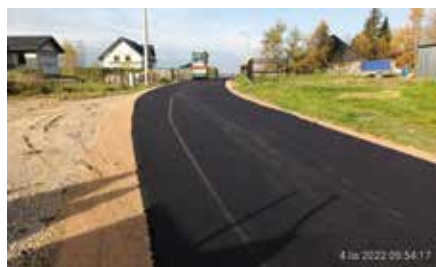
Remont drogi w Wolicy - ul. Słoneczna