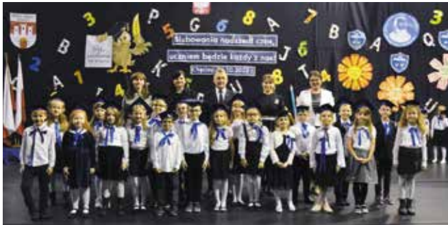
SP Chęciny - klasa Ia