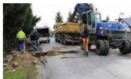
Przebudowa Siedlce- Łukowa