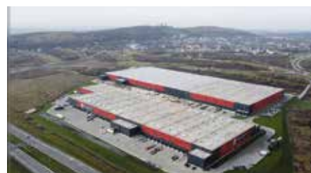
Końca dobiega rozbudowa Centrum Logistycznego 7R Park Kielce