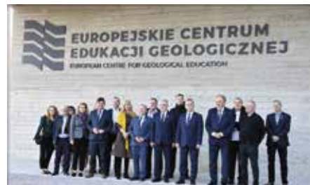
Marszałkowie z całej Polski z wizytą w Chęcinach