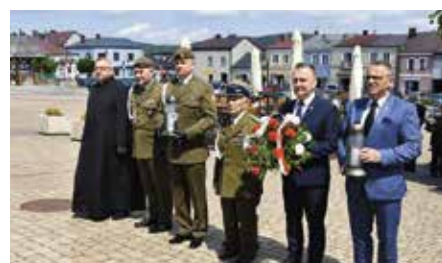
Obchody 78 rocznicy pacyfikacji Chęciny