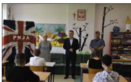
PNJA Gminny Konkurs Języka Angielskiego