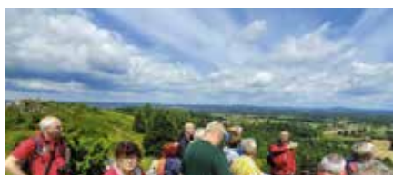
Uroki Góry Miedzianki. Szkolenie przewodników świątokrzańskich