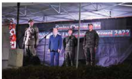
Marsz Szlakiem I Kompanii Kadrowej