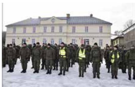
WOT w Chęcinach