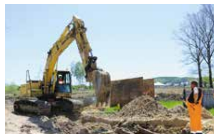
Kanalizacja deszczowa na Os. Skiby