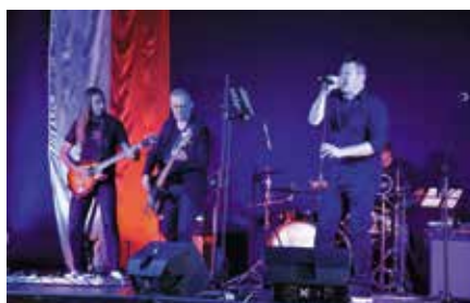
Koncert Patriotyczny w Chęcinach