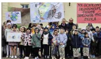
Projekt dla szkół „Od najmłodszych lat z ekologią za pan brat”