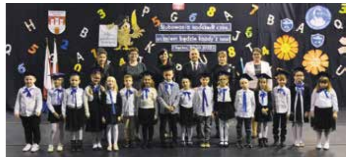
SP Chęciny - klasa Ib