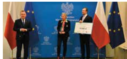
Gmina Chęciny nagrodzona przez Ministerstwo Klimatu i Środowiska tytułem "Miasto z klimatem" za realizację Parku Miejskiego w Chęcinach