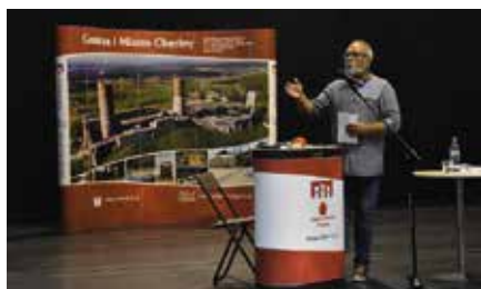
XXVII Międzynarodowe Spotkanie Integracyjne