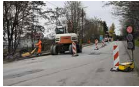
Remont ul. Małogoskiej w Chęcinach