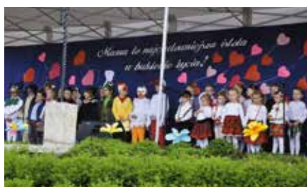
Pelen radości Dzień Matki w Chęcinach