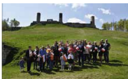
W Chęcinach uczczono Dzień Flagi Narodowej