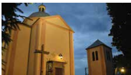
Zabytkowy kościół w Starochęcinach zyskał oprawę świetlną