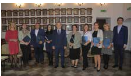
Burmistrz GiM Chęciny wręczył akty nadania stopnia nauczyciela mianowanego pedagogom