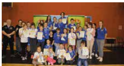
Otwarte Mistrzostwa Wój. Świętokrzyskiego LZS Młodzików i Dzieci w zapasach kobiet i w stylu wolnym