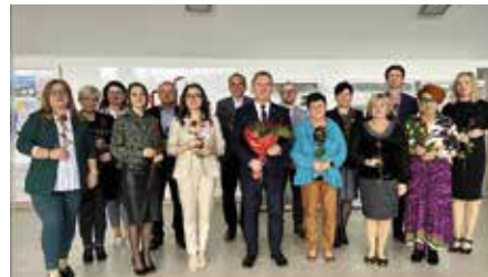
Dzień Edukacji Narodowej