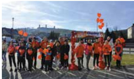
Bieg z serca z okazji Walentynek