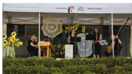
Zamkowe spotkania z muzyką