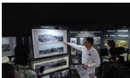
TVP 3 z wizytą w Miedziance