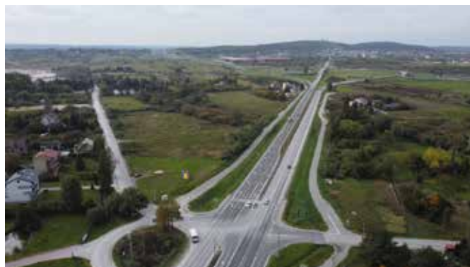
Na tym skrzyżowaniu powstanie rondo turbinowe