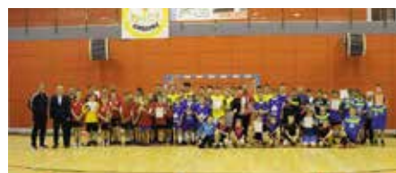
Gminne turnieje Piłki Nożnej SP o Puchar Burmistrza GiM Chęciny