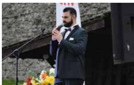
Koncert Wiktora Kowalskiego