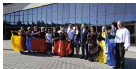
Tanecznym krokiem- zakończenie projektu CHUTW