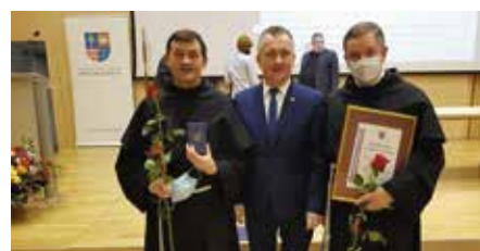
Klasztor Ojców Franciszkanów i Szpital w Czerwonej Górze wyróżnione Honorową Odznaką Województwa Świętokrzyskiego