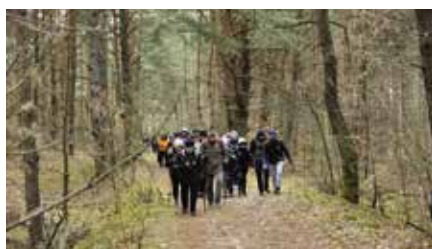
Rajd pamięci żołnierzy wyklętych z Chęciny do Bolmina