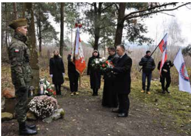
Złożenie wianek pod pomnikiem powstańców

- Zawsze w naszym mieście staramy się głęboko przeżywać i pielęgnować kolejne rocznice związane ze zrywami narodowymi, kiedy nasi przodkowie usilnie dążyli do tego, abyśmy mogli dziś żyć w wolnej i niepodległej Polsce. Na wschodnim zboczu Góry Zelejowej od 192 lat mieści się obelisk. Dzięki pracy sympatyków historii i ludzi, którzy kochają ją odkrywać, dziś wiadomo, że ten pomnik symbolizuje groby powstańców listopadowych. Dla nas to bardzo ważny fakt świadczący o tym, że historyczna ziemia chęcińska jest związana z powstaniem listopadowym. Znajdujemy się także w miejscu szczególnym i niezwykle ważnym. To tu, w Klasztorze Ojców Franciszkanów mieściło się niegdyś więzienie, gdzie torturowani byli nasi rodacy, którzy nie godzili się na niewolę i na to, że nasi przodkowie nie mogli mówić w języku ojczystym oraz pielęgnować tradycji i kultury naszego narodu. Bardzo się cieszę, że tak licznie przybyli Państwo na te ważne obchody 192. rocznicy wybuchu powstania listopadowego. Są wśród nas mieszkańcy, reprezentanci różnych przybyłych środowisk – naukowych, samorządowych, oświatowych, uczniowie. To znak, że dzisiaj wszyscy wspólnie chcemy przeżywać te wydarzenia i wspominać je, oddając tym samym hołd poległym. Dziękuję także wszystkim artystom, którzy wprowadzili nas w podniosły i patriotyczny nastrój pełen refleksji i zadumy – powiedział burmistrz Gminy i Miasta Chęciny, Robert Jaworski.