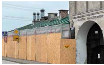
Remont dachu Klasztoru Ojców Franciszkanów