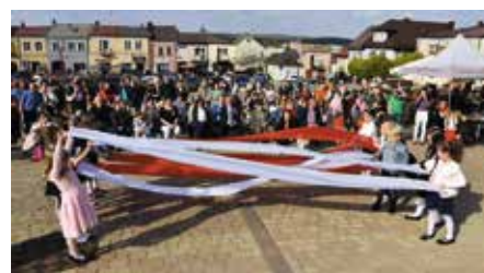
Patriotycznie i klimatycznie podczas majówki w Chęcinach