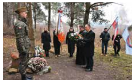
Obchody rocznicy Powstania Listopadowego