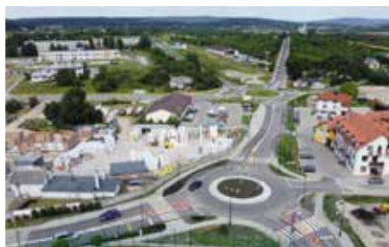
Budowa dwóch rond w Chęcinach