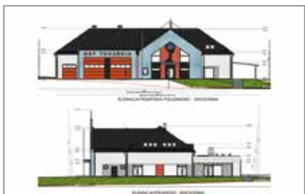
Zakończono projektowanie świetlicy w Tokarni