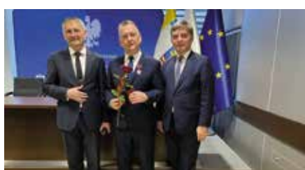
Prezydenckie wyróżnienie Burmistrz uhonorowany Srebrnym Krzyżem Zasługi