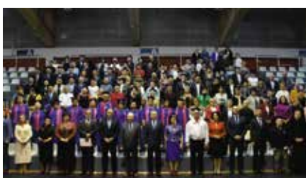
Uroczyste rozpoczęcie roku akademickiego CHUTW