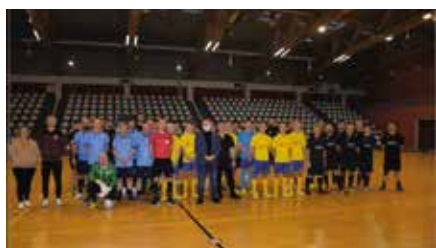
Norwocyczny Turniej Futsalu - zwycięzcą FC United