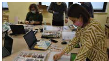
CKiS bierze udział w projekcie TIK w instytucji kultury