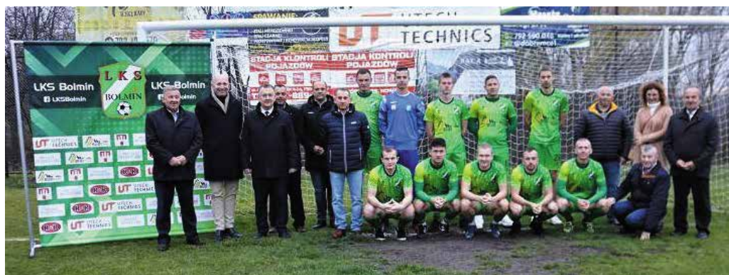
Podsumowanie sezonu piłkarskiego LKS Bolmin