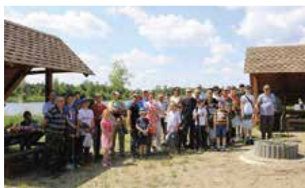
Zawody wędkarskie dla dzieci