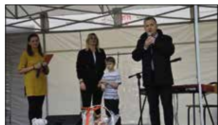
Piknik Charytatywny w Tokarni