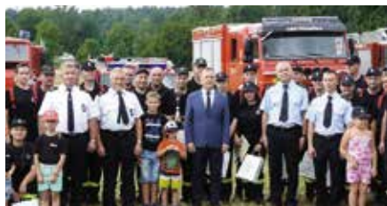
Druhowie z Bolmina zwycięzcami gminnych zawodów sportowo-pożarniczych w Podzamczu