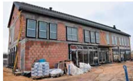
Budowa biblioteki wraz z siedzibą dla seniorów