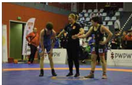
Puchar Polski kadetów w zapasach w stylu wolnym