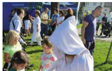
W Krainie Legend Chęcińskich