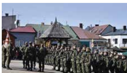
Przysięga wojskowa żołnierzy 10 Świętokrzyskiej Brygady Obrony Terytorialnej