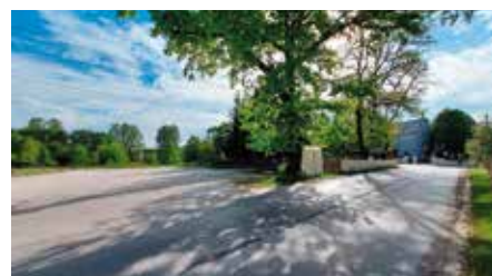
Pozyskane środki na budowę parkingu przy kościele w Łukowej