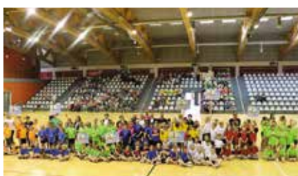
IV Igrzyska gier i zabaw ruchowych