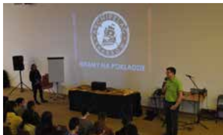
Warsztaty dla młodzieży Archipelag Skarbów