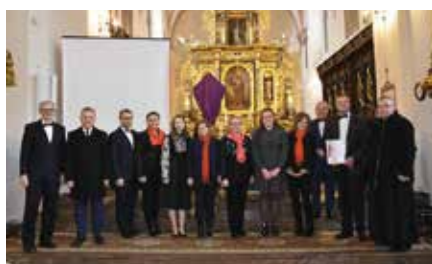
Koncert Pieśni Wielkopostnych