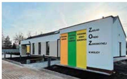
Nowo wybudowany Ośrodek Zdrowia w Wolicy