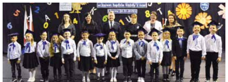
SP Chęciny - klasa Ic