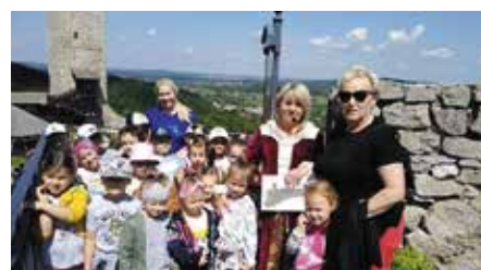
Bajkowy tydzień wrażeń oraz nocne zwiedzanie Zamku Królewskiego