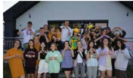
Bohaterowie o wielkich sercach. Podsumowanie wolontariatu