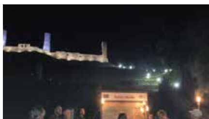
Magiczne zakończenie wakacji