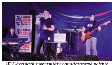
W Chęcinach wybrzmiały ponadczasowe polskie przeboje