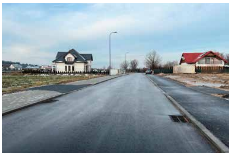
Nowo wybudowana droga w Skibach

Zakończone właśnie ważne dla mieszkańców zadanie z zakresu budowy infrastruktury drogowej jest pierwszym etapem zaplanowanych tu prac. Łącznie na Osiedlu Skiby planuje się wybudować około dwóch kilometrów dróg wraz z chodnikami, ścieżkami rowerowymi, odwodnieniem i energooszczędnym oświetleniem. - Całościowo to duże i bardzo