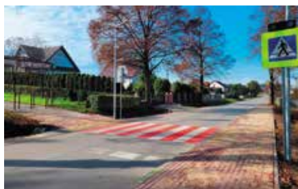
Bezpieczne przejście w Gościmcu