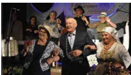
Chęcińskie spotkania z teatrem zakończone sukcesem