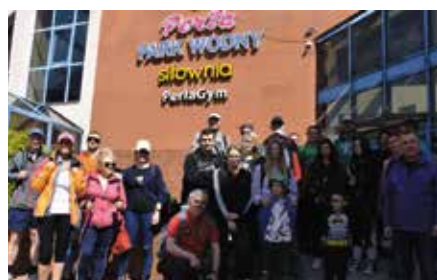
I rajd przyrodniczy Natura Nowiny - Chęciny