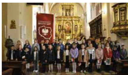
Narodowy Dzień Niepodległości