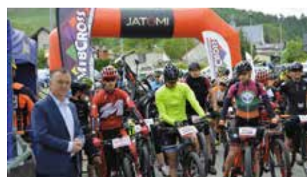
MTB Cross Maraton w Chęcinach