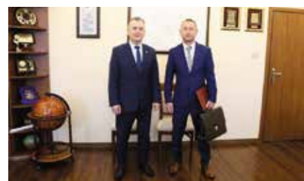
Nowy sołtys Ostrowa oficjalnie powołany