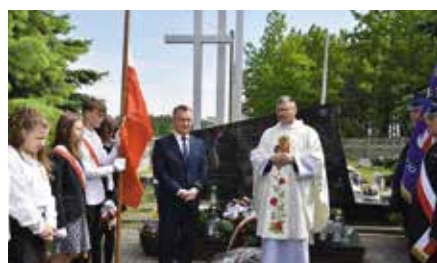
Rocznica pacyfikacji Wolicy