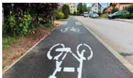
Budowa ścieżek rowerowych - Os. Północ