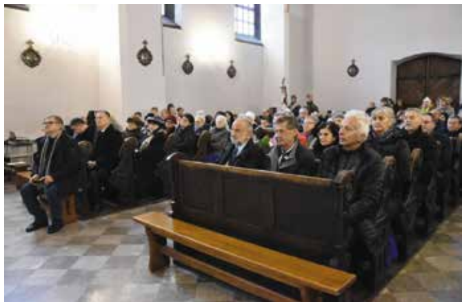
W uroczystości wzięło udział wielu uczestników