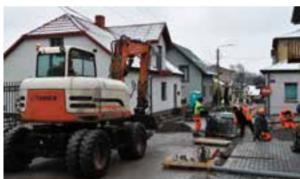
Remont ul. Długiej w Chęcinach