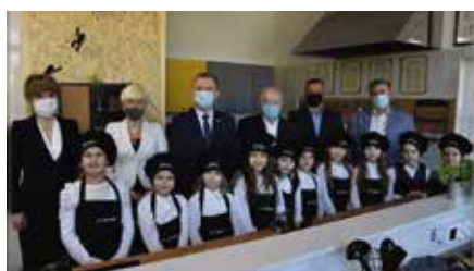
Otwarcie Kuchennego Laboratorium w SP w Bolminie