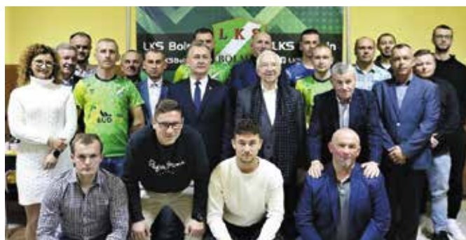
W wydarzeniu wzięło udział wielu gości

Zakończenie rundy jesiennej na 4. pozycji, to niewątpliwym sukces i zasługa zawodników, trenerów, Zarządu Klubu, kibiców oraz wszystkich osób, które wspierają działania sportowców z Bolmina. Uroczyste podsumowanie rundy, podczas którego nie szczędzono słów uznania odbyło się 12 listopada.