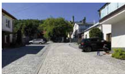
Nowo wybrukowany plac przy ul. Długiej w Chęcinach