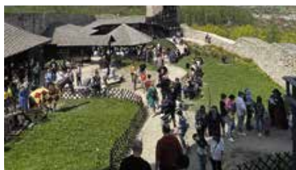
Ponad 12 tys. turystów na Zamku w długi weekend majowy