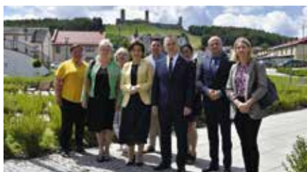
Minister Polityki Społecznej Marlena Małag z wizytą w Chęcinach