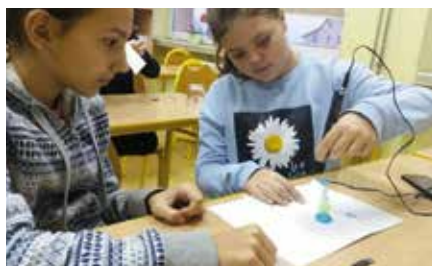
Projekt dla szkół „Matematyczny labirynt”