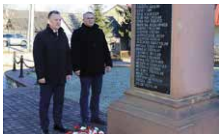
Władze Gminy oddały hołd Żołnierzom Wyklętym