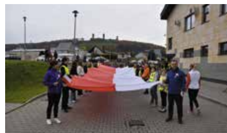
I Bieg Niepodległości