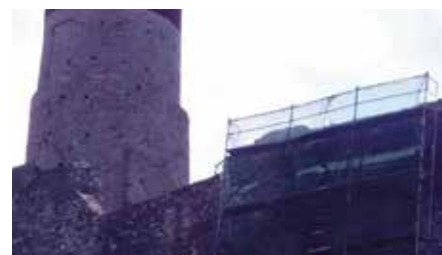
Remont średniowiecznych murów chęcińskiego zamku