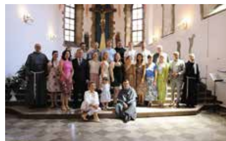
18-te urodziny San Damiano