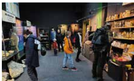
Pierwsze nocne zwiedzanie w Miedziance