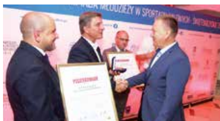
Gmina Chęciny wyróżniona za dokonania sportowe