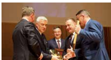
Nominacja Gminy Chęciny do Victorii Świętokrzyskiej