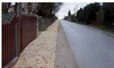
Chodnik w Korzecku