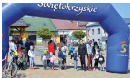
Bieg charytatywny na Rynku w Chęcinach