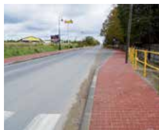
Chodnik w kierunku Biedronki