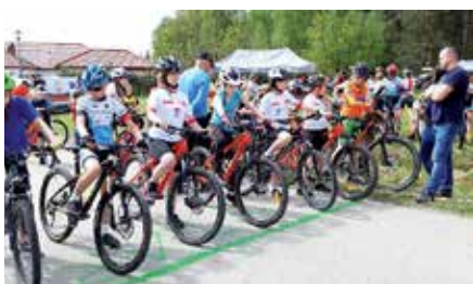
Sukcesy Chęcińskiej Szkoły Kolarskiej