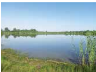
Trwa zagospodarowanie zbiornika wodnego w Lipowicy