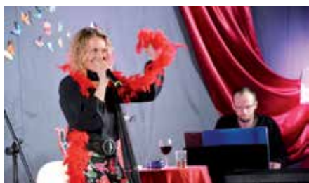
Dzień Kobiet w Chęcinach