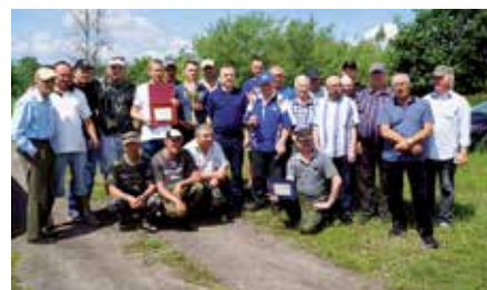
Jubileuszowe zawody wędkarskie w Lipowicy