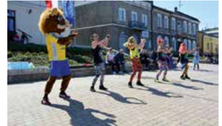
Flash Mob na Rynku w Chęcinach