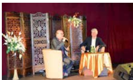
Spotkanie autorskie z Arturem Barcisiem