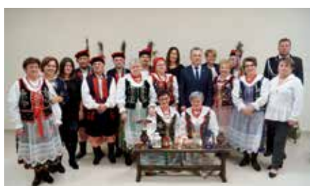
Widowisko Patriotyczne w Siedlcach