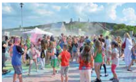
Gminny Dzień Dziecka