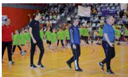
Igrzyska Sportowe dla klas I-III