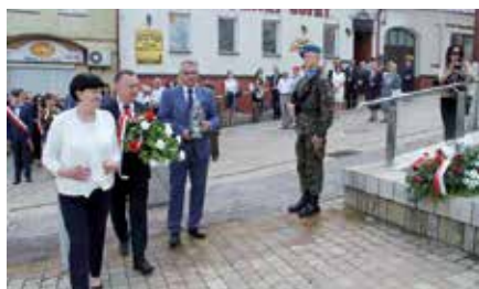
Uroczystość 2 Czerwca w Chęcinach