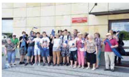
Seniorzy w działaniach proekologicznych