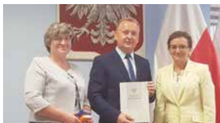
Podpisanie umowy z Wojewodą Świętokrzyskim na dodatkowe kursy autobusowe