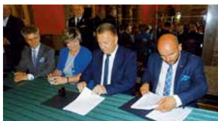
Podpisanie umowy na nowy sprzęt do straży