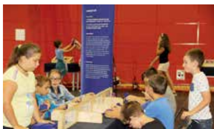
Naukobus w Chęcinach