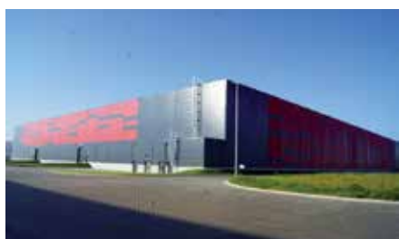
Powstanie Centrum Logistycznego w Chęcinach