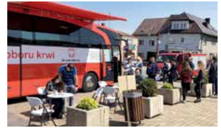
Charytatywna zbiórka krwi na Rynku w Chęcinach