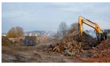
Rozpoczęcie prac przy budowie Parku Miejskiego w Chęcinach