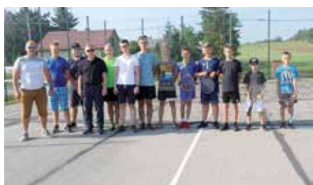
Turniej Tenisa Ziemnego w Polichnie