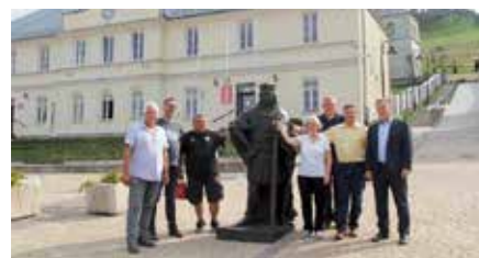
Wizyta samorządowców z Węgier i Gminy Koziegłowy