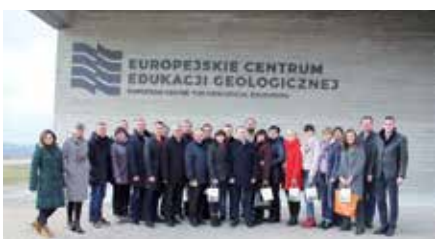
Ukraińskie jednostki samorządu terytorialnego uczyły się w Chęcinach dobrych praktyk