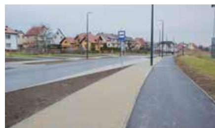
Budowa Alei Marszałka Józefa Piłsudskiego