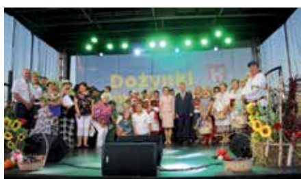
Dożynki Gminy Chęciny w Polichnie