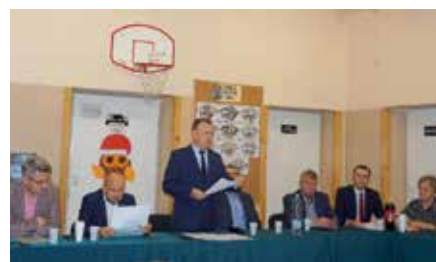
Zebrańie w sprawie budowy obwodnicy Radkowiec