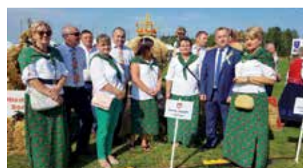
Przedstawiciele Siedlec na Dożynkach Powiatowych