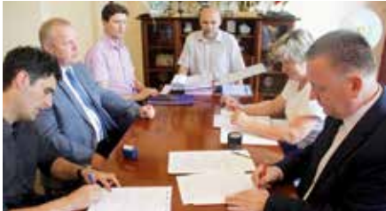
Podpisanie umowy na termomodernizację SP w Wolicy