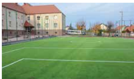
Nowo wybudowane boisko w Chęcinach