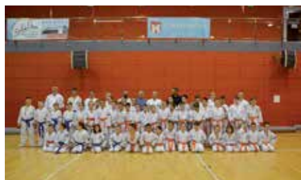
Egzamin Karate z Mistrzem Świata