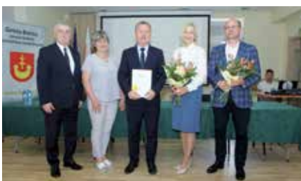
Pozyskanie środków na remont SP w Chęcinach