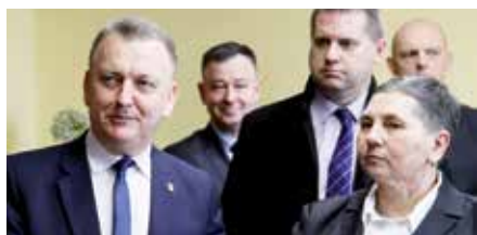
Burmistrz Gminy i Miasta Chęciny został Przewodniczącym Związku Miast i Gmin Regionu Świętokrzyskiego