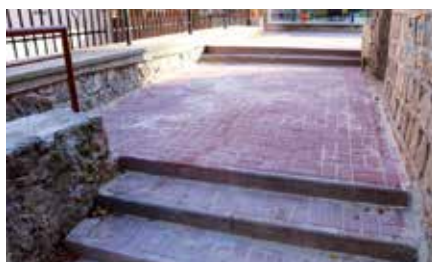
Remont schodów w Czerwonej Górze