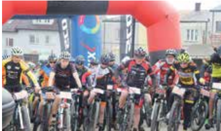
MTB CROSS w Chęcinach