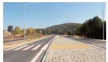
Wybudowanie drogi Chęciny-Małogoszcz