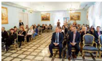
II Międzynarodowa Konferencja Naukowa