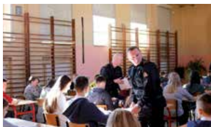
Turniej Wiedzy Pożarniczej