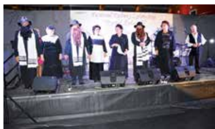
Festiwal Kultury Żydowskiej