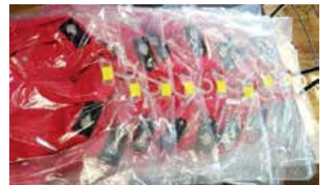
Mundury dla OSP Bolmin