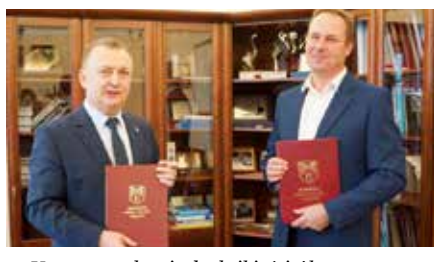
Umowa na drogi, chodniki, ścieżkę rowerową i sieć wodno-kanalizacyjną