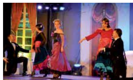
Rewia Operetkowa w Chęcinach