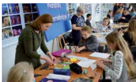
Festiwal Młodego Odkrywcę w Chęcinach