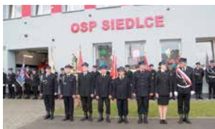
Otwarcie wyremontowanej remizy w Siedlcach