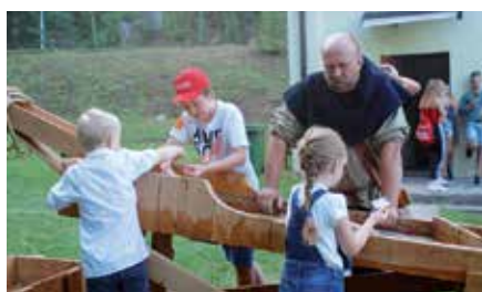
Piknik Górniczy w Chęcinach