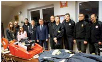
Sprzęt dla OSP Ostrów