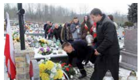
Rocznica wybuchu Powstania Styczniowego