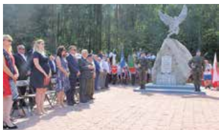
Uroczystość Święta Lotników w Polichnie