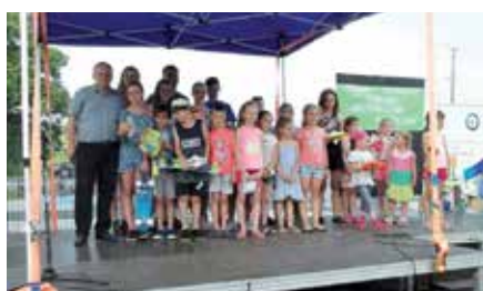
Festyn w Starohecinach