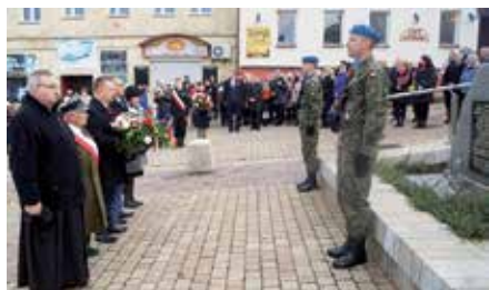
Uroczystość Święta Niepodległości