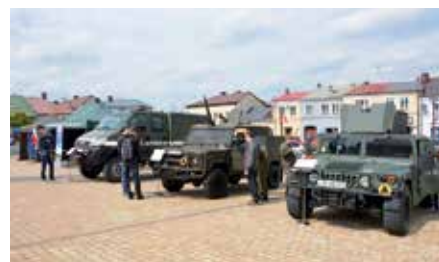
Piknik Wojskowy w Chęcinach