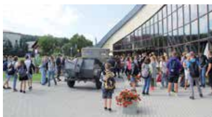
Wydarzenie upamiętniające 80tą rocznicę wybuchu II Wojny Światowej