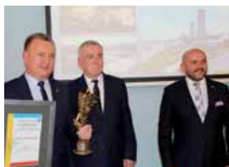
Nagroda „Super Wędrowca” dla Gminy Chęciny