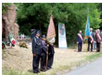
60. rocznica tragicznego wypadku rajdowców