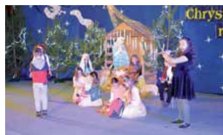
Przeгляд Widowisk Jasełkowych