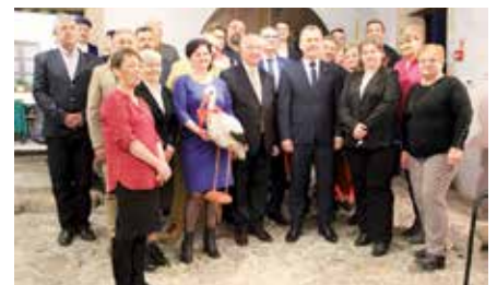
Zakończenie kadencji soltysów 2014-2018