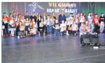
VII Gminny Mam Talent