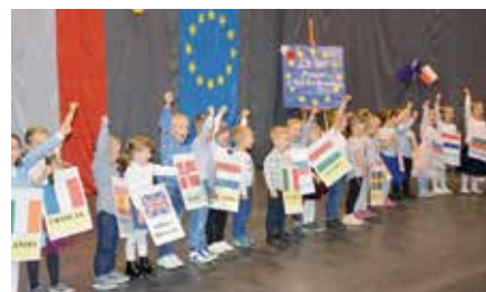
Dni Funduszy Europejskich