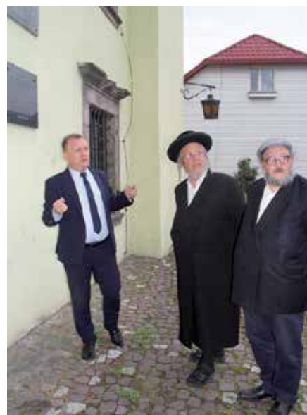
Wizyta Rabina Yossel'a Goldstein'a