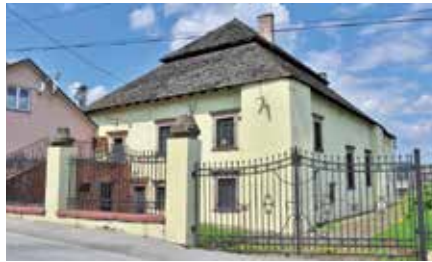
Pozyskane dofinansowanie na remont Synagogi