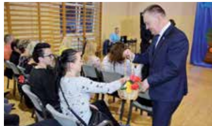
Dzień Kobiet w Miedziance