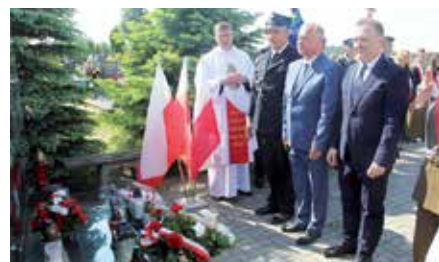
Rocznica Pacyfikacji Wolicy