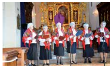
Koncert Pieśni Wielkopostnych