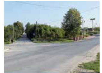
Zdobyte dofinansowanie na budowę dwóch rond w Chęcinach