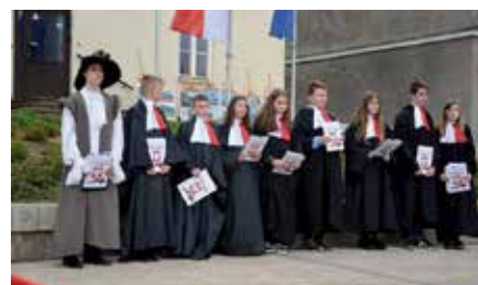
Uroczystość 3-go Maja