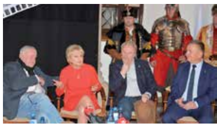
Jubileusz 50 - lecia premiery filmu „Pan Wołodyjowski”