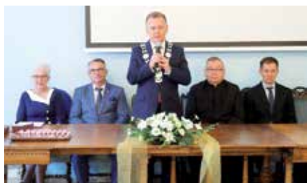
50- lecie pożycia małżeńskiego w Gminie Chęciny