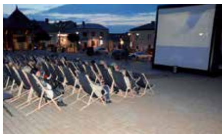
Kino Letnie na Rynku w Chęcinach