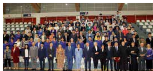
Uroczystość zakończenia roku akademickiego CHUTW