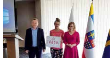
Dodatkowe dofinansowanie dla Klubu Znicz Chęciny