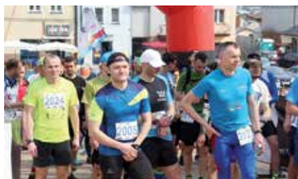
Cross Run w Chęcinach