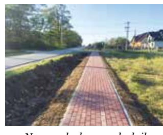
Nowo wybudowany chodnik z miejscowości Skiby do drogi 762