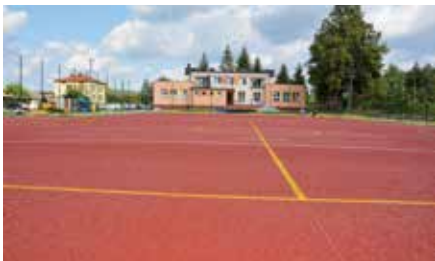
Budowa wielofunkcyjnego boiska w Korzecku