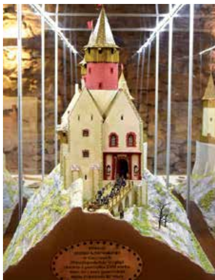
Odświeżenie nowej makiety Zamku Królewskiego w Chęcinach