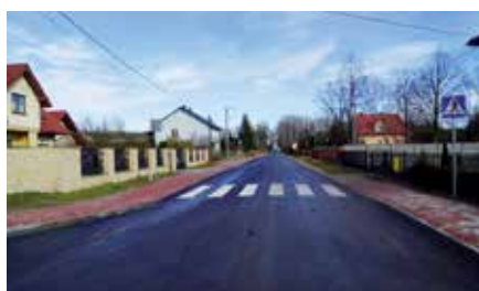
Droga i chodnik w Lipowicy