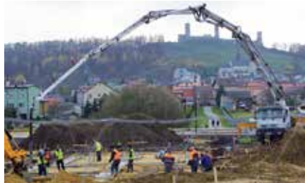
Prace przy budowie budynku komisariatu policji