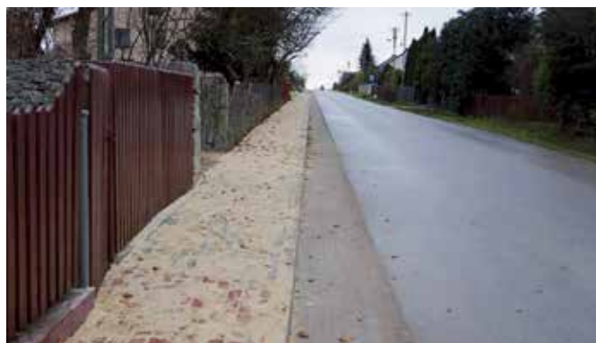
Nowy chodnik w Korzecku