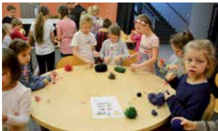
Ferie z CKiS