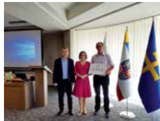
Dodatkowe dofinansowanie dla Piasta Chęciny