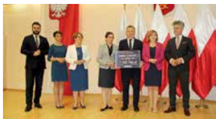
Zdobyte dofinansowanie do budowy Alei Marszałka Józefa Piłsudskiego