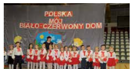
Gminny Dzień Przedszkolaka