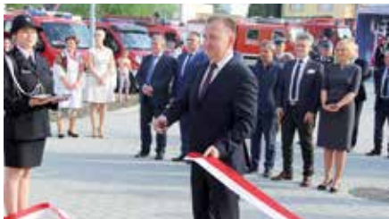
Otwarcie remizy w Radkowicach i Gminny Dzień Strażaka