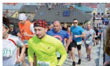
Cross Run w Chęcinach