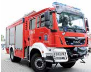
Nowy samochód dla OSP Wolica