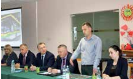
Spotkanie w sprawie gazu w Wolicy