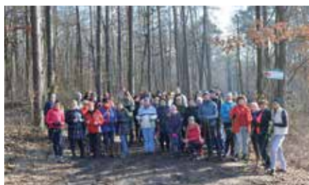
Zimowy spacer z kijkami