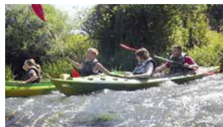
OSP Tokarnia przeprowadziła akcję sprzątania Nidy