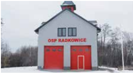
Nowo wybudowany budynek remizy w Radkowicach