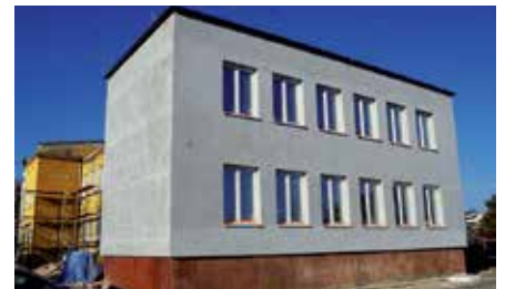
Trwa kompleksowy remont SP w Wolicy