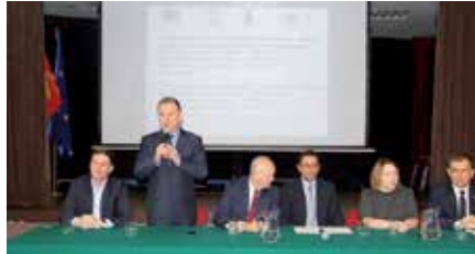
Podpisanie umów przez LGD ze Stowarzyszeniami na realizację wniosków