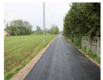
Budowa drogi w Lukowej