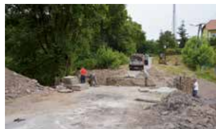
Budowa przepustu w Łukowej