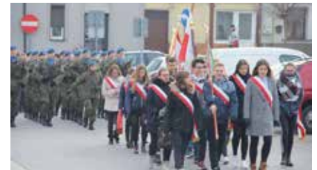
Uroczystość Dnia Żołnierzy Wyklętych w Chęcinach