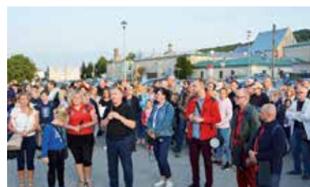
Nocne Zwiedzanie Zabytków Chęciny