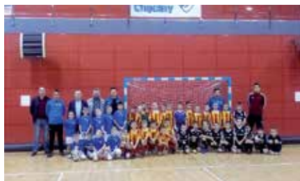
Turniej o Puchar Prezesa SZPN w Chęcinach