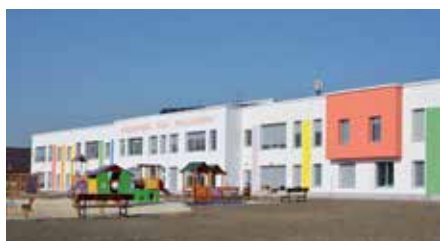
Budynek nowo wybudowanego przedszkola i żłobka