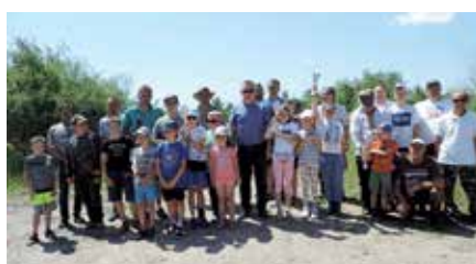
Wędkarski Dzień Dziecka w Lipowicy