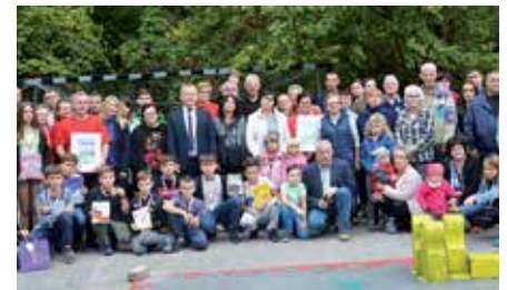
Turniej Gier Wielkoformatowych