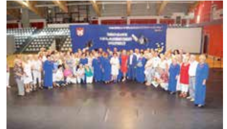
Zakończenie Roku Akademickiego CHUTW