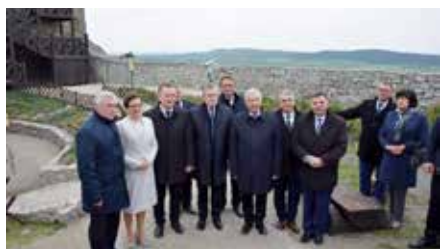
Wizyta Wicepremiera, Piotra Glińskiego w Chęcinach