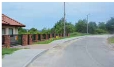
Nowy chodnik przy ul. Spacerowej w Chęcinach