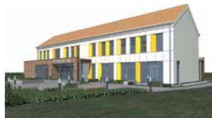
Projekt budowy Domu Seniora i Biblioteki Publicznej