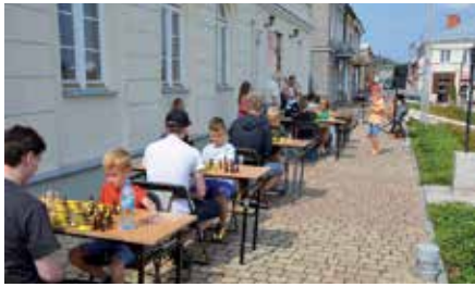
Amatorski Turniej Szachowy