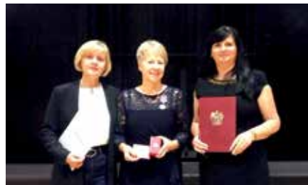
Nagrodzone nauczycielki z Gminy Chęciny