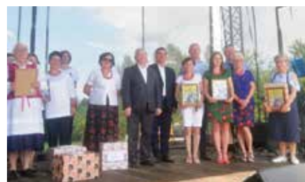
Nagroda dla KGW Zelezwianie