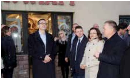
Premier, Mateusz Morawiecki w Chęcinach