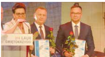
Nominacja Gminy Chęciny do nagrody Wojewody Świętokrzyskiego „Laur Świętokrzyski”