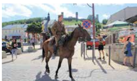
Szlak Marszem I Kompanii Kadrowej