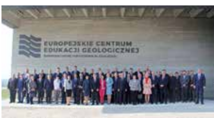
Konwent Prezydentów, Burmistrzów i Wójtów Regionu Świętokrzyskiego w Chęcinach