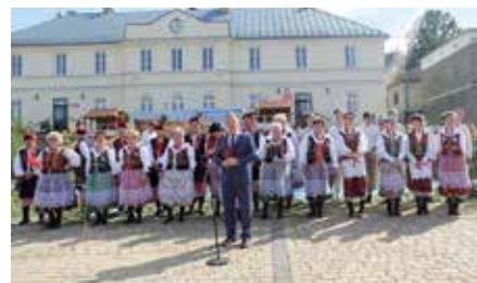
Jubileusz 35 lecia Zespołu Siedlecczanie