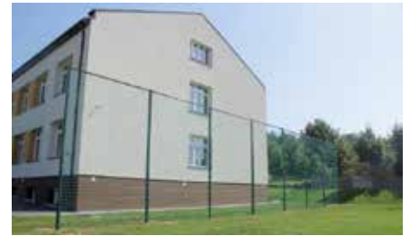
Nowe bramki i piłkochwyty przy SP w Polichnie