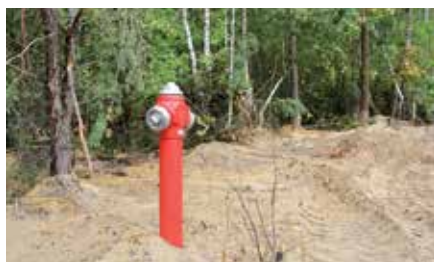
Budowa wodociągu w Miedziance