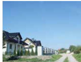
Trwa opracowanie dokumentacji na nowe drogi w Skibach