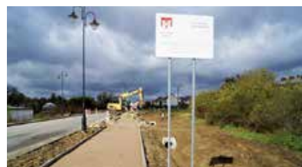
Budowa ścieżki rowerowej w Chęcinach