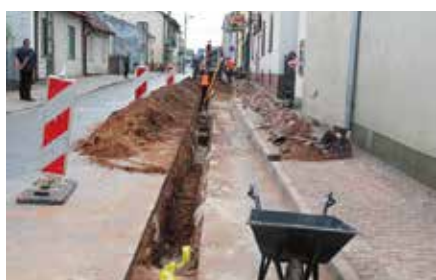
Budowa sieci gazowej w Chęcinach