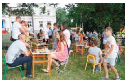
Piknik w Siedlcech