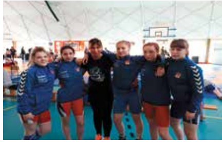
Sukcesy zapaśnicze klubu Znicz Chęciny