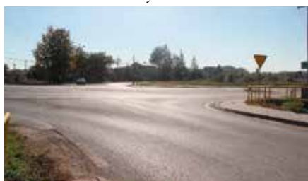
Opracowywanie projektu budowy ronda na skrzyżowaniu do Czerwonej Góry