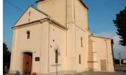
Wymiana okien w kościele w Bolminie