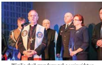
Wigilia służb mundurowych z województwa w Chęcinach