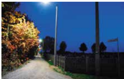
Budowa oświetlenia ulicznego na terenie gminy