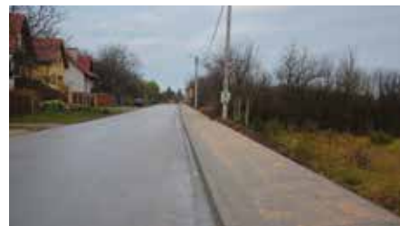
Budowa I etapu chodnika przy ul. Spacerowej w Chęcinach