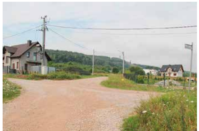
Opracowano dokumentację techniczną i uzyskano pozwolenie na budowę