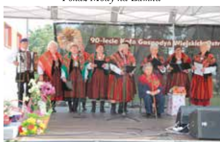
90-lecie KGW Ostrowianki