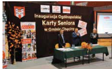
Wdrożenie w gminie Ogólnopolskiej Karty Seniora