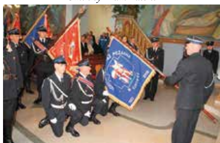
Poświęcenie Sztabdaru i 95-lecie OSP Łukowa