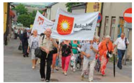
Weekend Seniora w Chęcinach