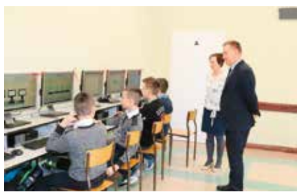
Powstanie pracowni komputerowej w SP w Bolminie