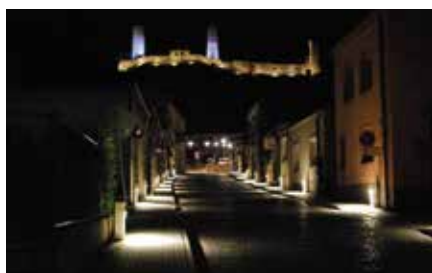
Budowa oświetlenia przy ul. Staszica w Chęcinach