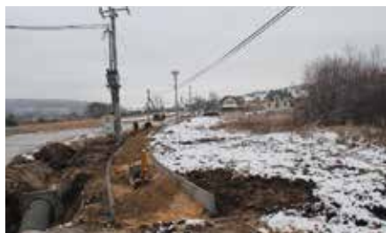
Budowa I etapu chodnika w Skibach