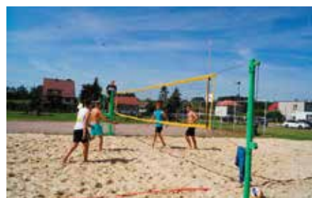
Turniej Piłki Plażowej