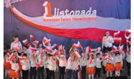
Obchody 100. Rocznicy Odzyskania Niepodległości