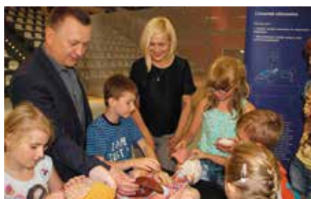
Naukibus w Chęcinach