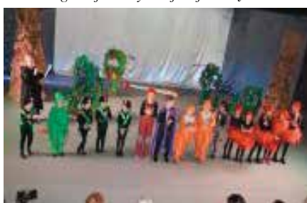
Spektakl „Na Jagody”