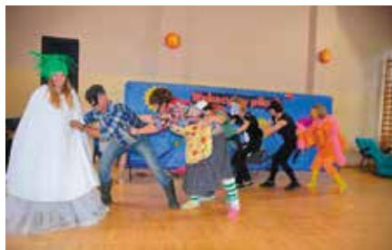
Wydarzenia artystyczne w Miedziance