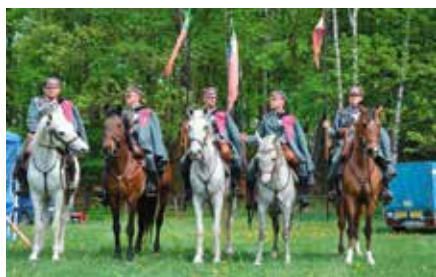
Piknik Historyczny pod Zamkiem