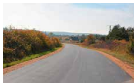
Droga Milechowy - Zajęczków