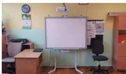
Zakup zestawów tablic interaktywnych dla placówek oświatowych w gminie