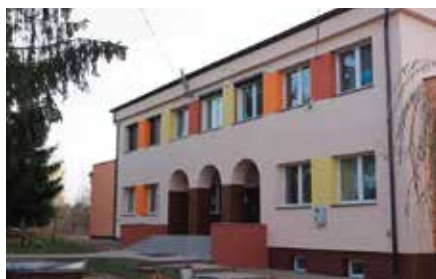
Remont SP w Korzecku