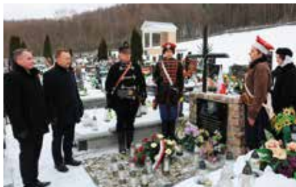
155. Rocznica Powstania Styczniowego