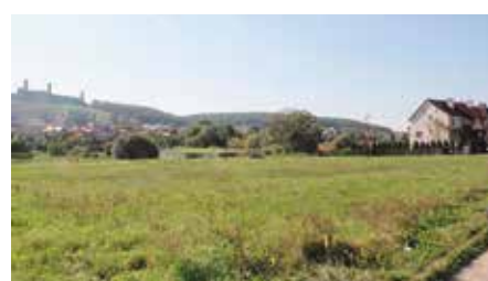
Podpisanie umowy na przekazanie działki pod budowę Komisariatu Policji w Chęcinach