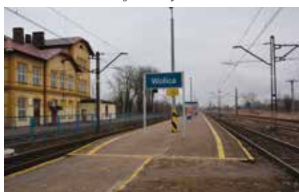
Decyzja o budowie kładki w Wolicy