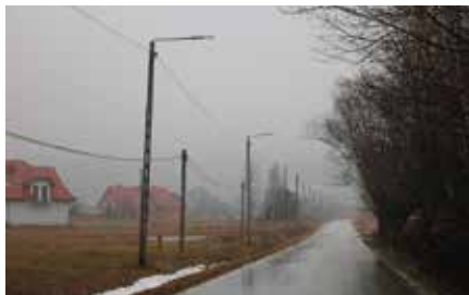
Wymiana oświetlenia ulicznego w gminie na ledowe