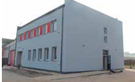
Modernizacja remizy w Siedlcach