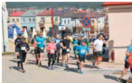
Cross Run w Chęcinach