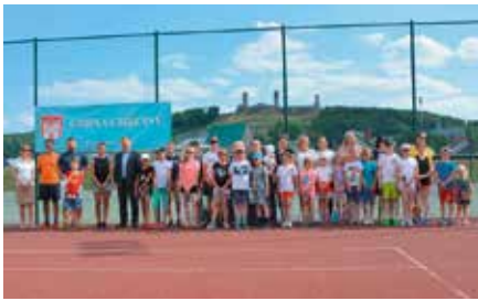
Turniej Tenisa Ziarnego