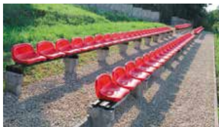
Wymiana trybun przy boisku w Bolminie