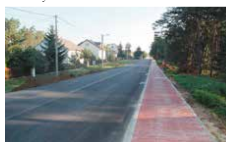
Chodnik i droga w Lipowicy