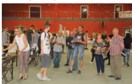
Targi Pracy w Chęcinach