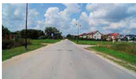
Pozwolenie na budowę Al. Marszałka J. Piłsudskiego