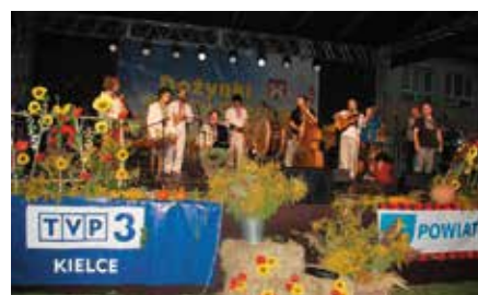
Dożynki Gminne w Łukowej