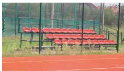
Remont boisk i trybun na kompleksie sportowym ORLIK