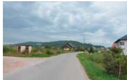
Opracowywanie projektu na kanalizację w Zelejowej