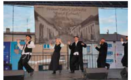
Festiwal Kultury Żydowskiej