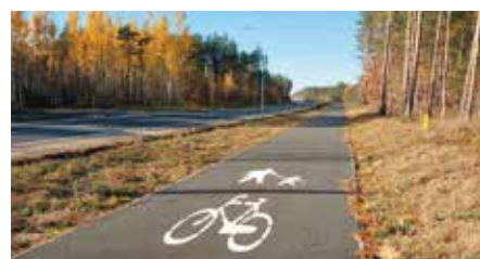
Powstanie prawie 11 km ścieżki rowerowej przy drodze 762