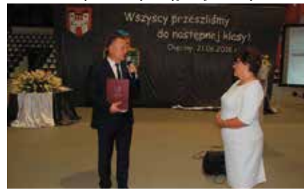
Zakończenie Roku Akademickiego CHUTW