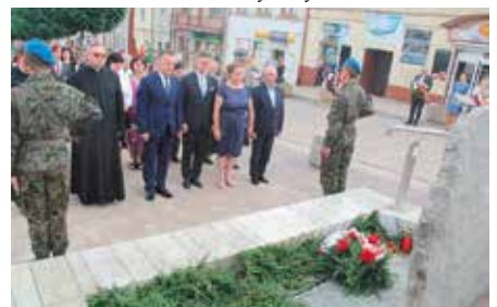
Obchody Rocznicy Pacyfikacji Chęciny