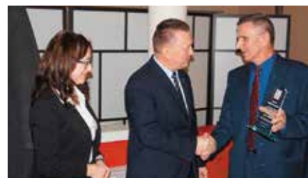
10-lecie Stowarzyszenia Rozwoju Kultury i Sportu w Tokarni