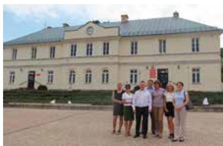
Wizyta Komisji Europejskiej