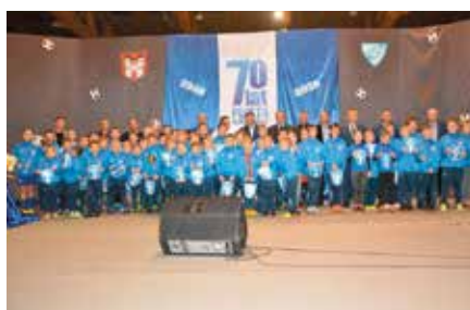
70lecie KS PIAST Chęciny