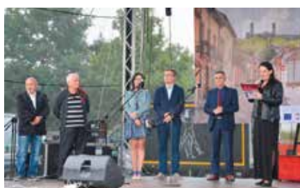
Gala Filmowa w Tokarni