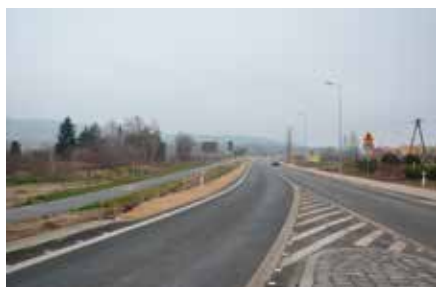
Przebudowa drogi Chęciny-Malogoszcz