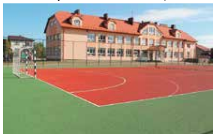
Powstanie boiska w Tokarni