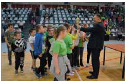
Igrzyska sportowe dla klas I-III