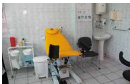
Doposażenie gabinetu ginekologicznego w Chęcinach