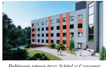
Podpisanie umowy przez Szpital w Czerwonej Górze na utworzenie Zakładu Opieki Leczniczej