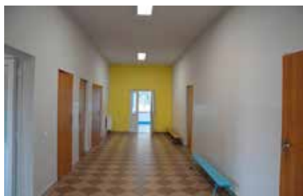
Remont świetlicy w Ostrowie