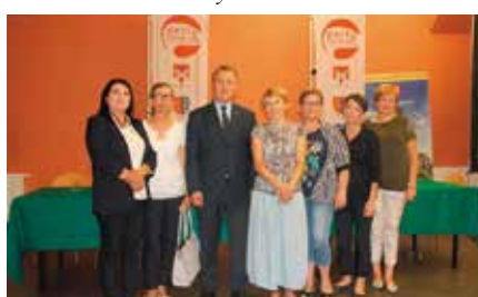
Pozyskanie środków z LGD dla stowarzyszeń