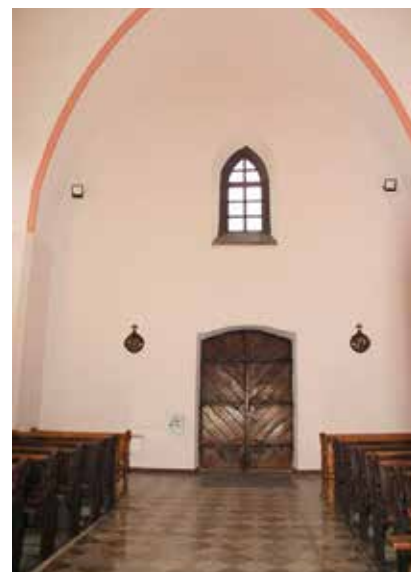
Wnętrza Klasztoru Ojców Franciszkanów zostały odnowione