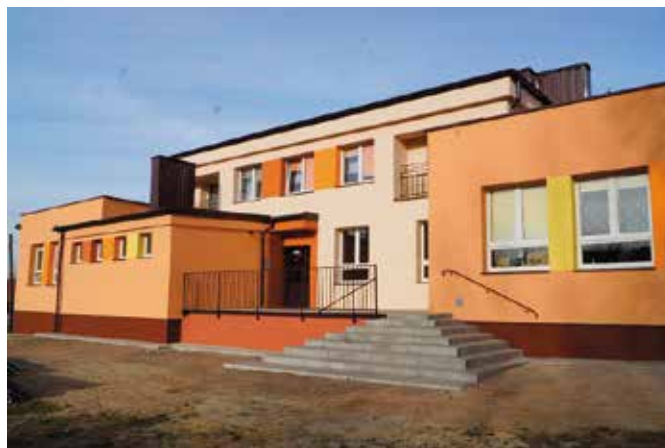
Odnowiona SP w Korzecku od strony południowej

Koszty prac termomodernizacyjnych przy szkołach w Radkowicach i Korzecku w całości zostały pokryte z budżetu Gminy i Miasta Chęciny. Inaczej jednak było w przypadku oddanych w ostatnim czasie do użytku szkół po kompleksowej