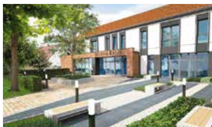
Pozyskanie środków na budowę Domu Seniora i Biblioteki