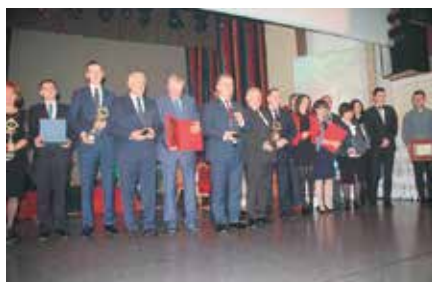
Nagroda „Innowacyjna Gmina”