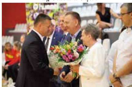
Memorial Mariana Budziosza