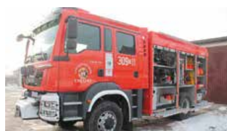
Zakup nowego samochodu dla OSP w Chęcinach