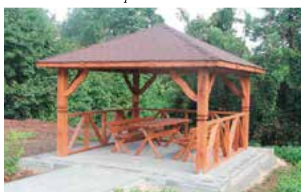
Budowa wiaty turystycznej przy ul. Zelejowa