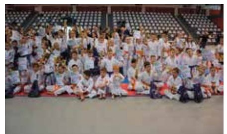
Wojewódzki Turniej Karate