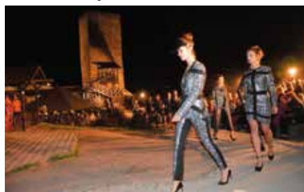
Pokaz Mody na Zamku