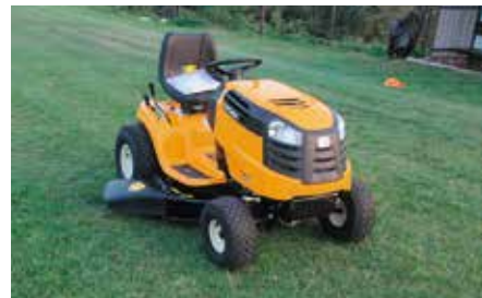
Zakup traktorów do koszenia dla Łukowej i Bolmina