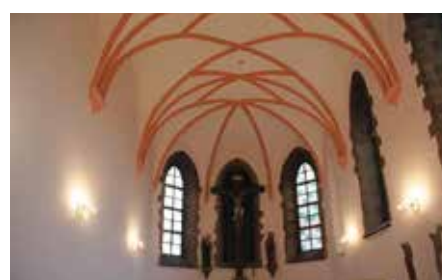
Remont Klasztoru Ojców Franciszkanów