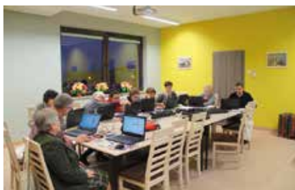
Wdrożenie Latającej Akademii Edukacyjnej