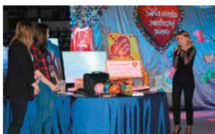
Wielka Orkiestra Świątecznej Pomocy