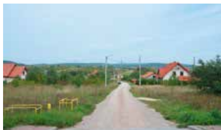
Wykonanie dokumentacji na drogi przy ul. Branickiego i Wołodyjowskiego