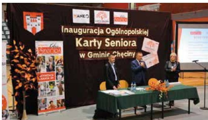
Gmina Chęciny przystąpiła do ogólnopolskiego programu uprawniającego do zniżek dla seniorów