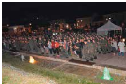
Marsz Szlakiem I Kompanii Kadrowej