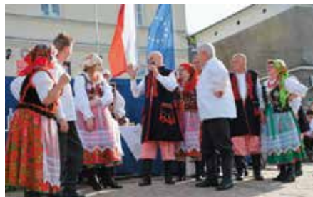
Spotkanie z Folklorem