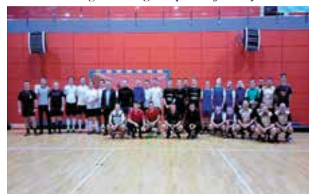
Noworoczny Futsal o Puchar Burmistrza