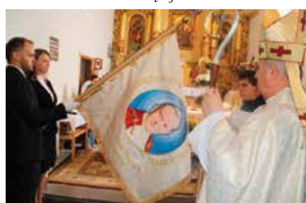
Nadanie SP w Bolminie im. Św. Jana Pawła II