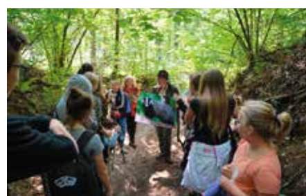
Przygoda chęcińska w Mostach