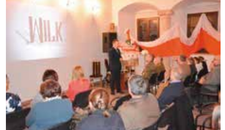
Obchody Dnia Żołnierzy Wyklętych