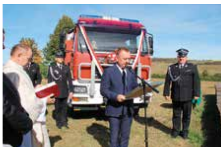
Przekazanie samochodu dla OSP w Bolminie