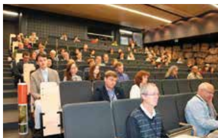
Liczne konferencje międzynarodowe w ECEG