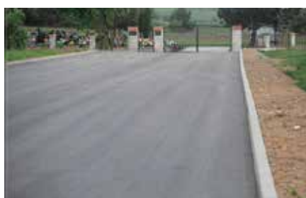
Budowa drogi do cmentarza w Lipowicy