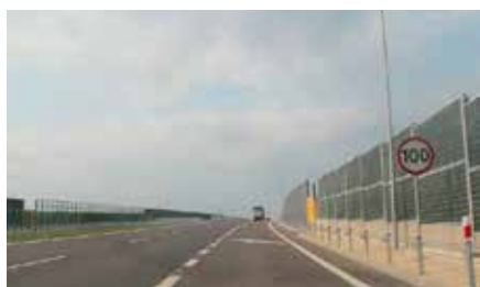
Zakończenie I etapu budowy drogi ekspresowej S7