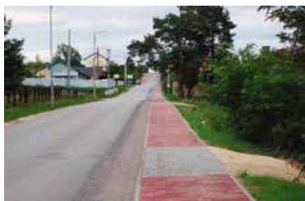
Budowa chodnika w Radkowicach