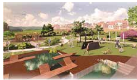
Pozyskanie środków na utworzenie Parku Miejskiego w Chęcinach