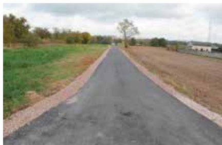
Budowa drogi w Radkowicach