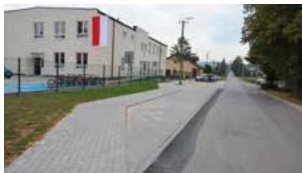
Kapitalny remont i termomodernizacja szkoły w Starohecinach