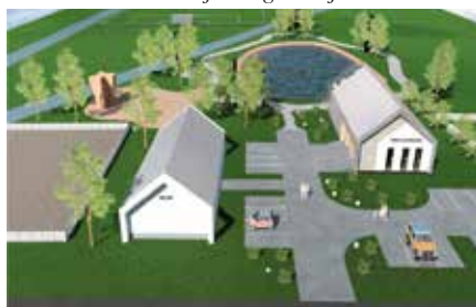
Projekt budowy świetlicy w Lipowicy