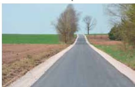
Droga Łukowa – Gajówka