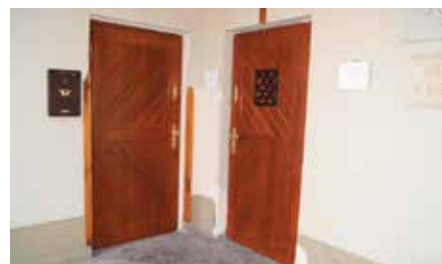
Wymiana stolarki okiennej i drzwi w Klasztorze Sióstr Bernardynek