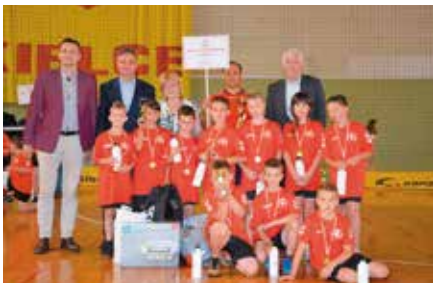
Projekt „Gramy w Ręczną”