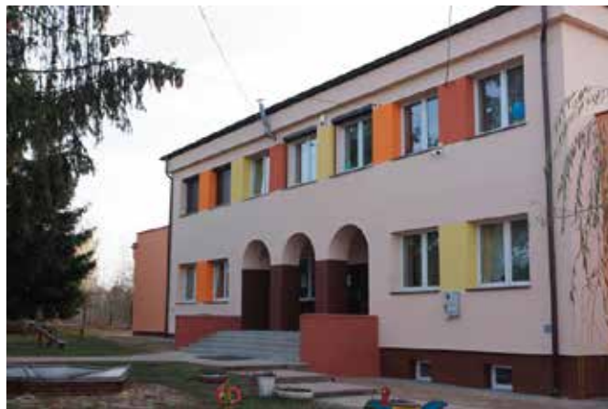
Szkoła w Korzecku po remoncie

termomodernizacji w Bolminie, Starochęcinach i Polichnie. Koszty prac przy tych obiektach w 85 procentach zostały pokryte dzięki pozyskanemu dofinansowaniu z Regionalnego Programu Operacyjnego Województwa Świętokrzyskiego na lata 2014-2020 w ramach Zintegrowanych Inwestycji Terytorialnych Kieleckiego Obszaru Funkcjonalnego. Za kolejne pozyskane pieniądze w ramach ZIT KOF kompleksową termomodernizację w przyszłym roku przejdzie także szkoła w Wolicy.