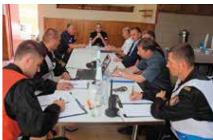
Szkolenia dot. Spraw bezpieczeństwa