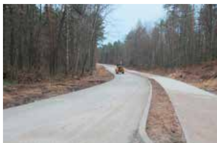
Rozbudowa ul. Dobrzączka