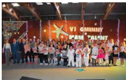
Gminny Mam Talent