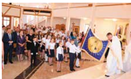
Nadanie SP w Tokarni im. Janusza Korczaka