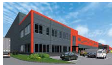
Podpisana umowa na budowę Centrum Logistycznego w Chęcinach