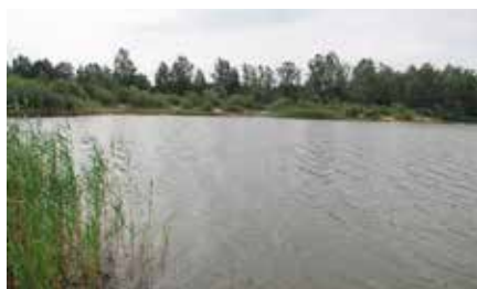
Pozyskanie środków na zagospodarowanie Zalewu w Lipowicy