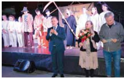
Spektakl „O Medyku Feliksie”