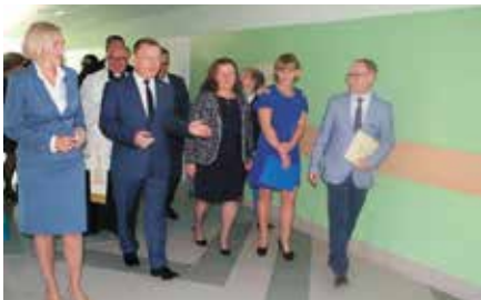
Otwarcie szkoły w Polichnie