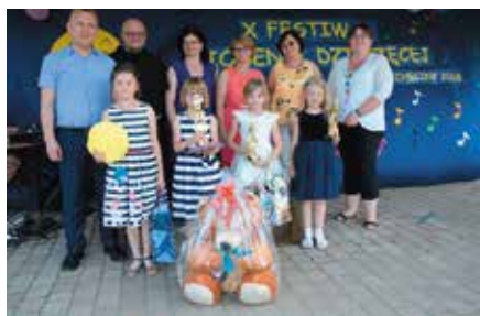
Festiwal Piosenki Dziecięcej