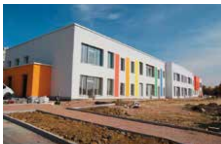
Budowa przedszkola i żłobka w Chęcinach