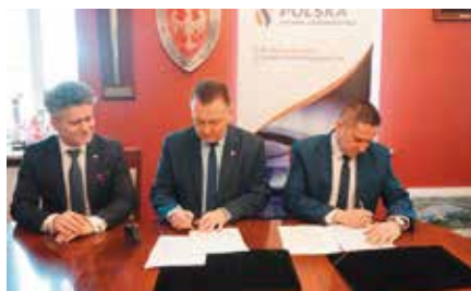
Podpisanie listu intencyjnego na rozbudowę dalszej sieci gazowej