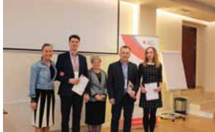
Nagroda dla gminy za rozwój oświaty w gminie