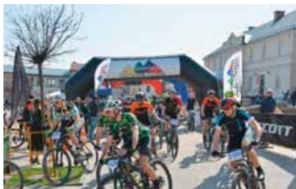
MTB CROSS Maraton Chęciny