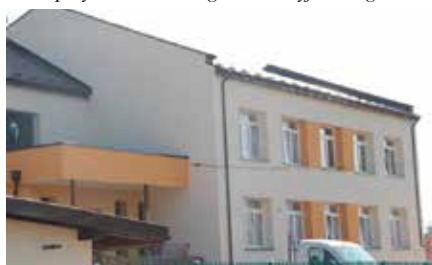
Termomodernizacja i kapitalny remont szkoły w Polichnie