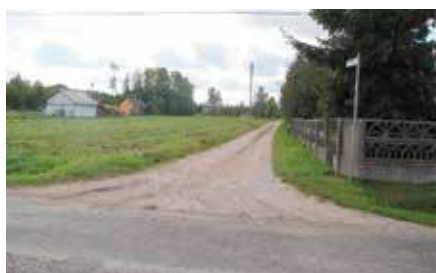
Budowa wodociągu przy ul. Chęcińskiej w Wolicy