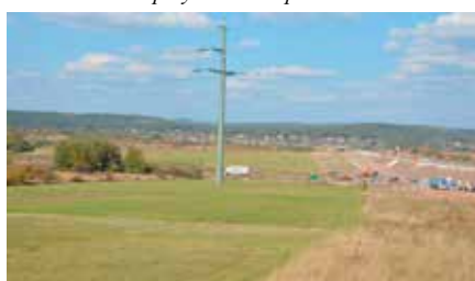
Pozyskanie środków na tworzenie terenów inwestycyjnych w Wolicy