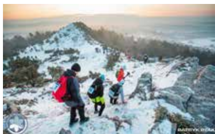
Rajd Zimowy PTTK w Chęcinach