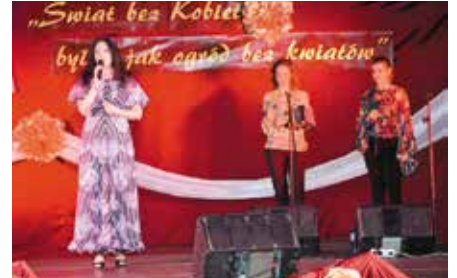
Gminny Dzień Kobiet