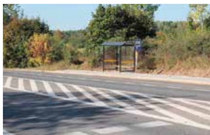
Nowe wiaty przystankowe w Podzamczu