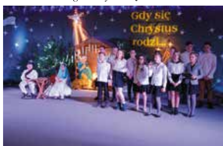
Przeгляд Widowisk Jasełkowych