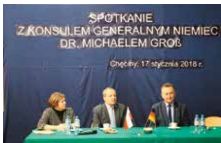
Wizyta Konsula Generalnego Niemiec w Chęcinach