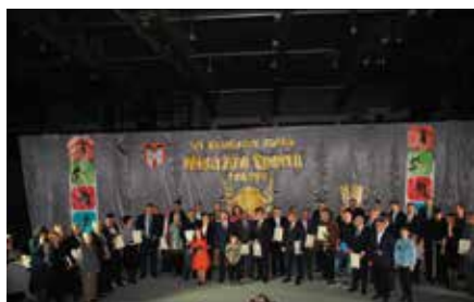
Gala Mistrzów Sportu