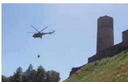
Szkolenia antyterrorystyczne w okolicach Zamku