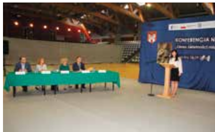
Konferencja poświęcona Królowi Władysławowi Łokietkowi