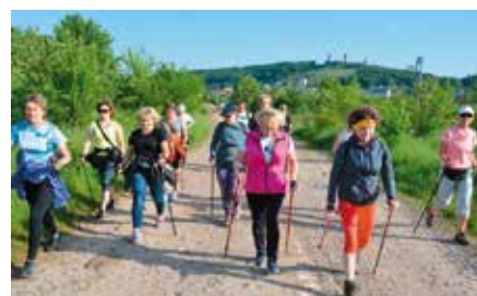
Rajd Nordic Walking