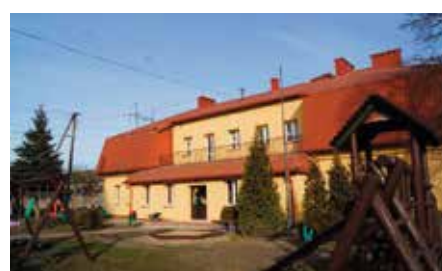
Remont Szkoły w Radkowicach