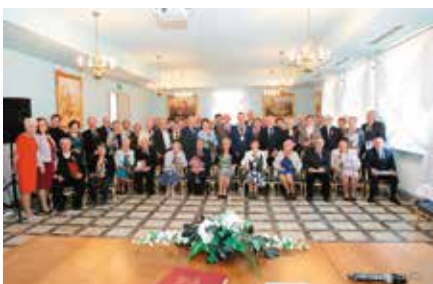
50lecie Pożycia Małżeńskiego