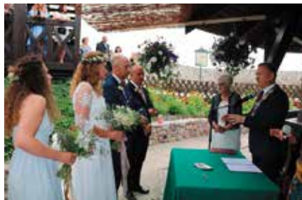
Ślub na Zamku