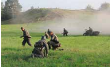
Piknik Historyczny II Wojna Światowa