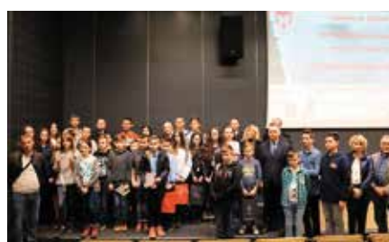
Gminny Turniej Wiedzy Pożarniczej