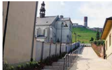
Utworzenie Szlaku Króla Władysława Łokietka