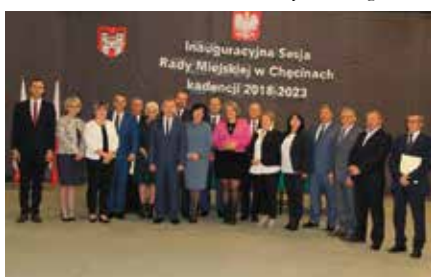
Inauguracja Rady Miejskiej w Chęcinach