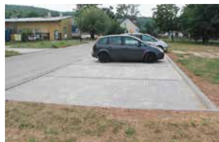
Miejsca postojowe na Os. Sosnówka