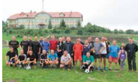
Turniej Oldbojów w Łukowej