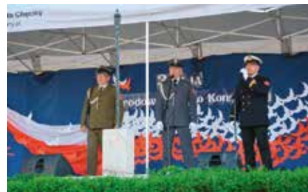
Obchody 3go Maja w Chęcinach