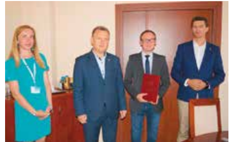
Mianowanie nowych dyrektorów