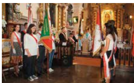
Obchody Rocznicy 17 września