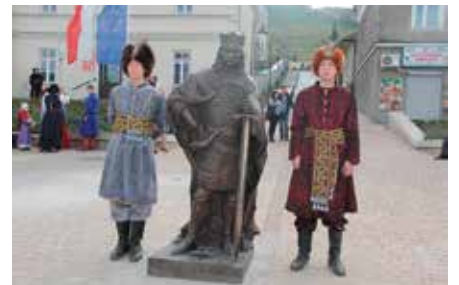
Otwarcie szlaku Króla Władysława Łokietka