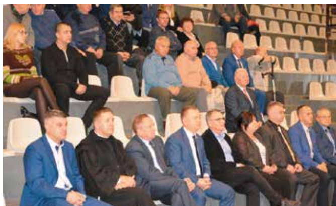
W Jubileuszu wzięło udział wielu działaczy sportowych i sympatyków KS Piast Chęciny