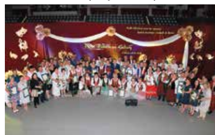
Dzień Działacza Kultury