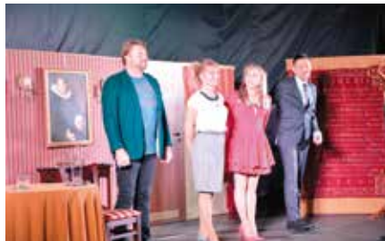
Spektakl „Przebój Sezonu”