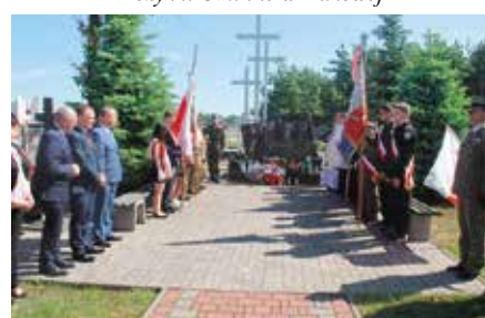
Obchody Rocznicy Pacyfikacji Wolicy