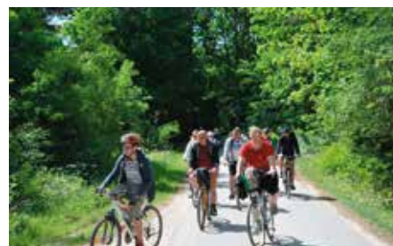
Gminny Rajd rowerowy