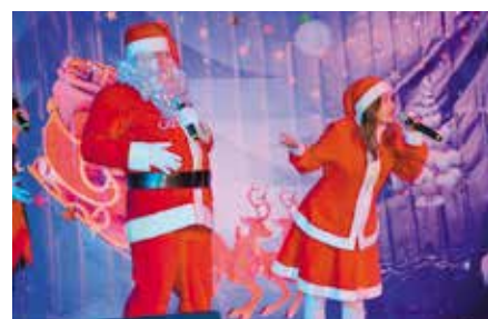
Mikołajki dla dzieci