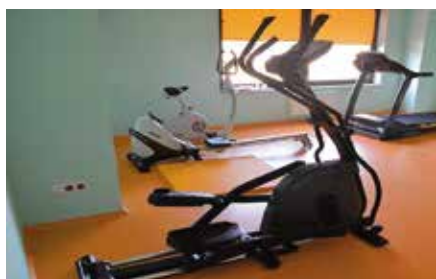
Doposażenie siłowni w hali w Chęcinach