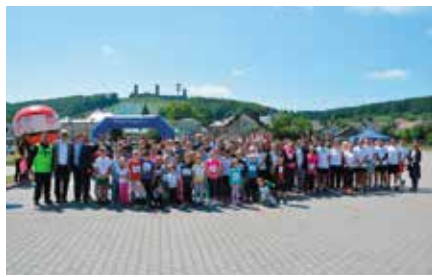
Bieg Uliczkami Chęcín