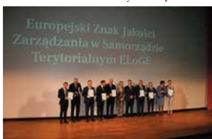
Nagroda Rady Europy