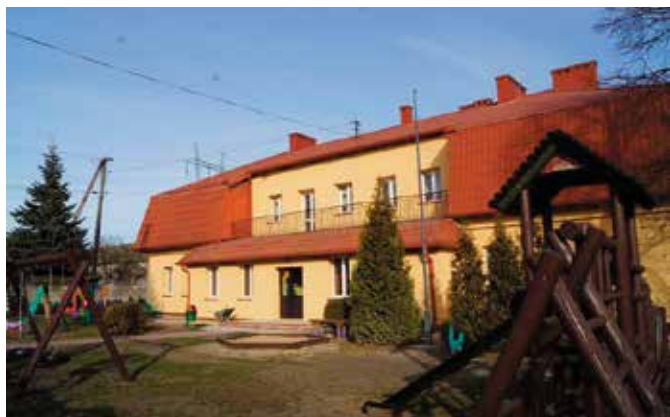
Wyremontowana SP w Radkowicach

Zdaniem władz Gminy i Miasta Chęciny kompleksowe termomodernizacje obiektów użyteczności publicznej, jakimi są szkoły, wpłyną na wzrost oszczędności względem ogrzewania budynków, w których przeprowadzono prace dociepleniowe i remontowe. - Szacujemy, że po wykonaniu termomodernizacji wszystkie szkoły powinny charakteryzować się znacząco, zmniejszonym zapotrzebowaniem na energię. To oznacza, że obiekty te nie tylko pięknieją, ale są też zdecydowanie bardziej oszczędne i ekologiczne – podkreśla Burmistrz Gminy i Miasta Chęciny, Robert Jaworski.