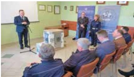
Nagroda dla gminy za organizację bezpiecznych wakacji