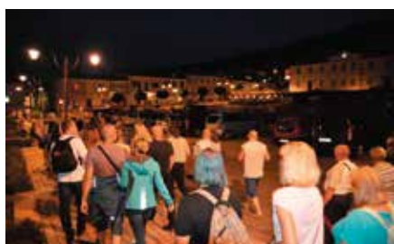
Nocne Zwiedzanie Zabytków Chęciny