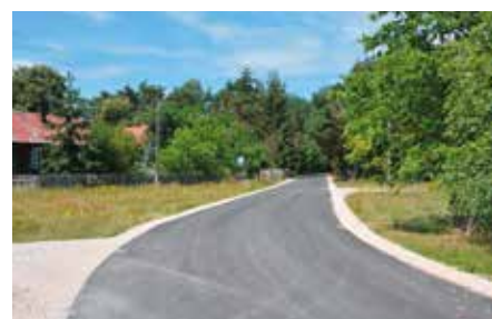
Budowa drogi w Podpolichnie