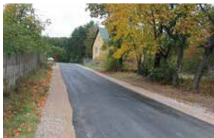
Budowa drogi Bolmin-Wymysłów