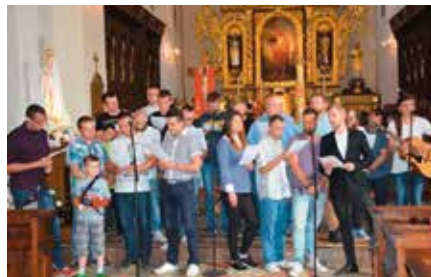
Koncert Pieśni Maryjnych