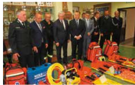
Sprzęt strażacki dla jednostek OSP