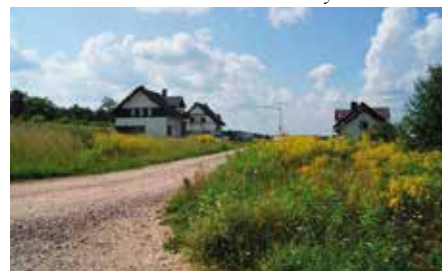
Prace projektowe nad siecią dróg na Os. Skiby