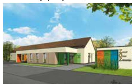
Projekt Ośrodka Zdrowia w Wolicy