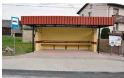
Remont przystanków np. w Ostrowie