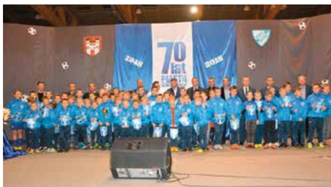
Ponad 70ciu członków liczy obecnie KS Piast Chęciny