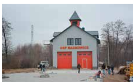
Budowa remizy w Radkowicach