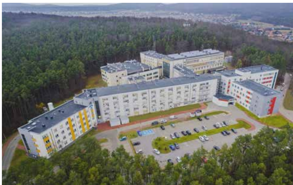
Szpital w Czerwonej Górze to jedna z najnowocześniejszych placówek medycznych w kraju