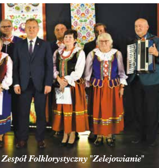
Zespół Folklorystyczny "Zelejowanie"