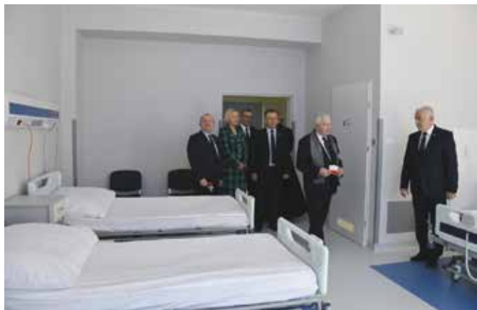
Nowo otwarte oddziały są doskonale wyposażone dla potrzeb pacjentów

Oddział II Chorób Płuc i Gruźlicy, Izba Przyjęć (Pulmonologiczna), Dział Badań Czynnościowych Układu Oddechowego i Laboratorium Prątka Gruźlicy, Oddział III Chorób Płuc oraz Dział Diagnostyki i Leczenia Zaburzeń Oddychania. Przypomnijmy, że w marcu bieżącego roku otwarto pierwszą część inwestycji.