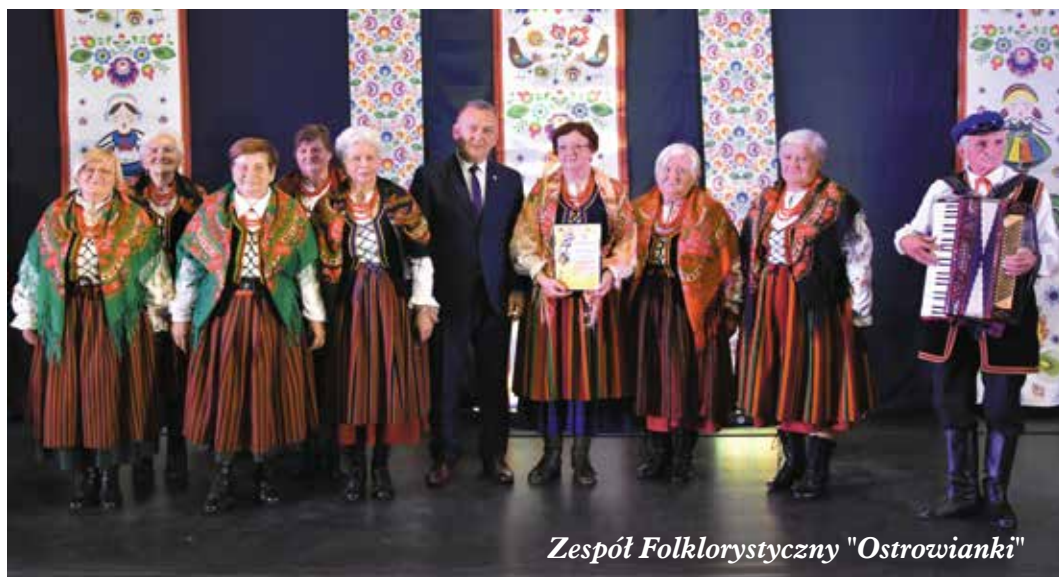
Zespół Folklorystyczny "Ostrowianki"