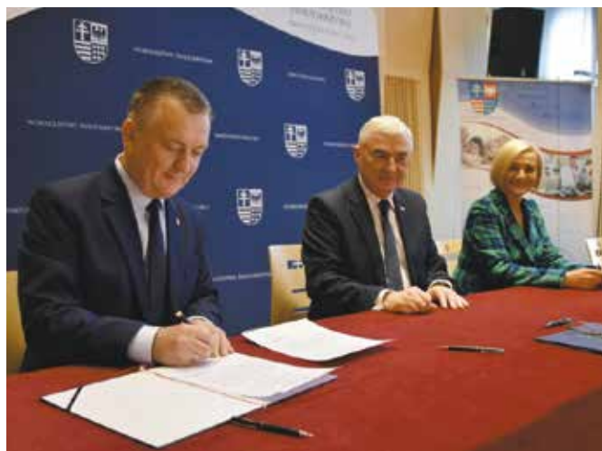
Dodatkowe środki na aktywizację seniorów

– Seniorzy stanowią ważną grupę naszej lokalnej społeczności, dlatego cieszę się, że dzięki przystąpieniu do tego projektu będziemy mogli objąć ich jeszcze lepszą opieką. Zależy nam na mobilizowaniu osób starszych w zakresie edukacji, twórczej działalności, aktywności fizycznej, ale także na utrzymaniu