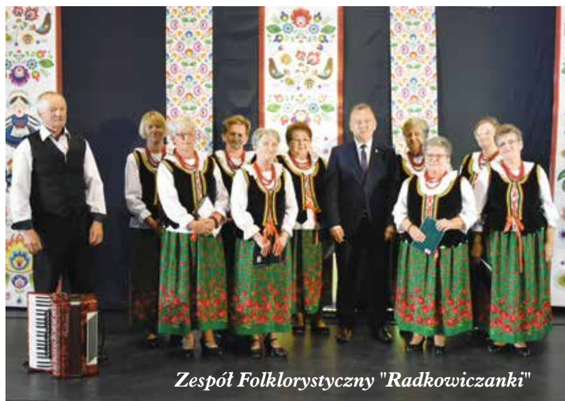
Zespół Folklorystyczny "Radkowiczanki"