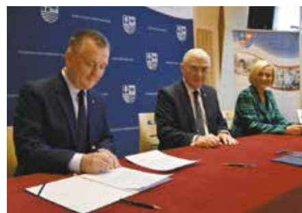
Gmina Chęciny w pilotażowym projekcie wspierającym seniorów