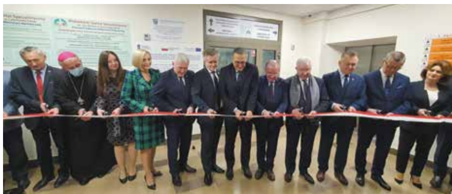
Uroczysty moment otwarcia nowych oddziałów

To kolejny, imponujący, krok w stronę kompleksowego leczenia pacjentów z nowotworami i chorobami płuc. 8 listopada w Wojewódzkim Szpitalu Specjalistycznym im. Św. Rafała w Czerwonej Górze odbyło się uroczyste otwarcie nowego Oddziału Chorób Płuc i Laboratorium Prątka Gruźlicy w strukturach Świętokrzyskiego Centrum Chorób Płuc oraz Oddziału Chemioterapii Diennej i Ambulatoryjnej wraz z Pracownią Leków Cytostatycznych.