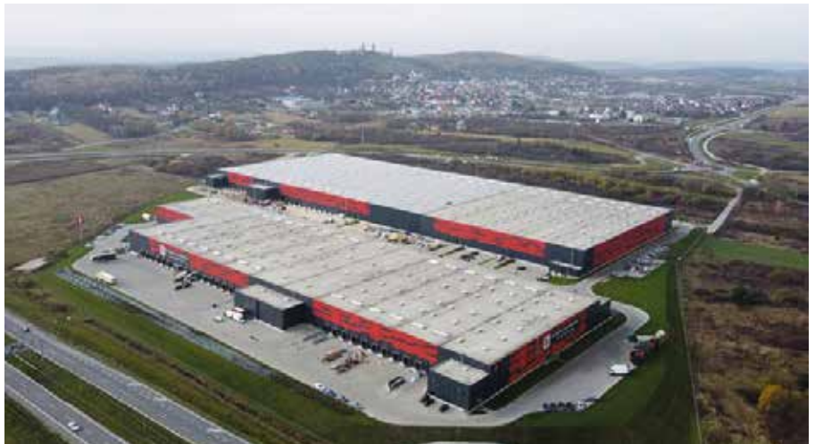
Rozbudowuje się nowoczesne Centrum Logistyczne w Chęcinach

Na tym jednak nie koniec. Wiosną ruszyła rozbudowa jednej z istniejących już tutaj hal magazynowych, która powiększyła swoją powierzchnię z 15 tysięcy metrów kwadratowych o kolejne 30 tysięcy metrów kwadratowych. - Jak zapewne widać jesteśmy już na końcowym etapie prac związanych