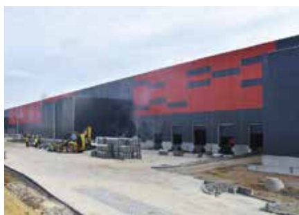
Końca dobiega rozbudowa Centrum Logistycznego 7R Park Kielce w Chęcinach