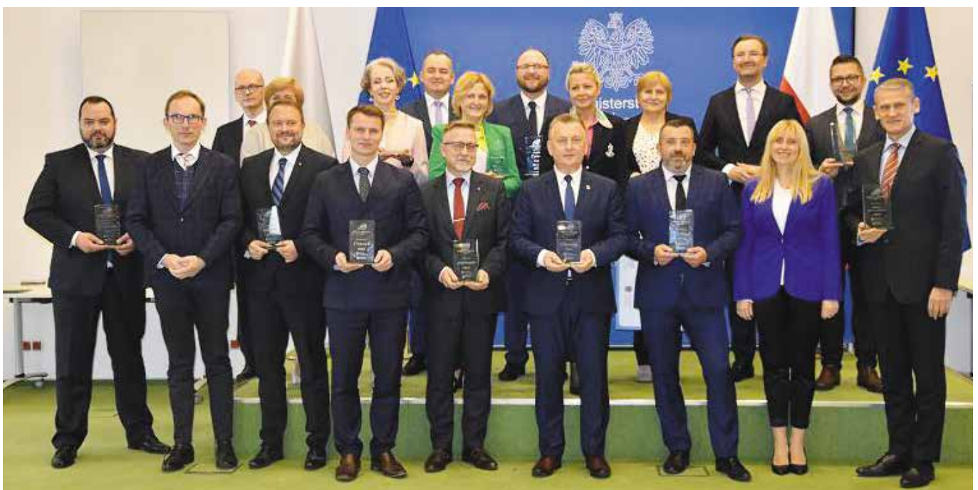
Chęciny z ważną nagrodą "Miasto z Klimatem"