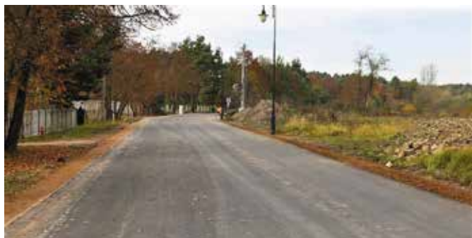
Nowy dywanik asfaltowy w kierunku Jaskini Raj

Raj była już mocno zniszczona. Były tam dziury, wyrwy. Wszystko oczywiście niejednokrotnie naprawiane. Łatwiej jednak ani nie wygląda estetycznie w oczach odwiedzających to miejsce, ani nie przynosi na dłuższą metę dobrego efektu, co staje się także uciążliwe dla mieszkańców tej części gminy. Zależało nam na tym, aby ta droga została porządnie wyremontowana. Dzięki rządowemu dofinansowaniu tak się nareszcie stało. To miejsce zy-