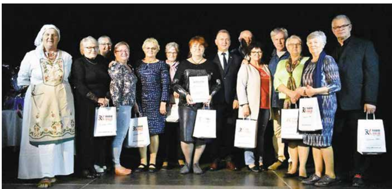
Nasi aktorzy docenieni podczas Festiwalu Teatralnego "OTE"