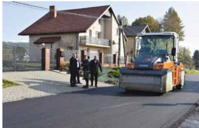
Nowy dywanik asfaltowy położony zostanie na długości 1,7 km.

Prace związane z remontem konstrukcji jezdni na odcinku Jedlnia-Bolmin już są na finiszu. Wymieniono warstwę bitumiczną wraz z położeniem nowego asfaltu na długości 1,7 km aż do skrzyżowania z drogą powiatową oraz umocniono pobocza kruszywem o szerokości 0,50 m. Oprócz remontu konstrukcji jezdni i odtworzenia poboczy odmulono także rowy.