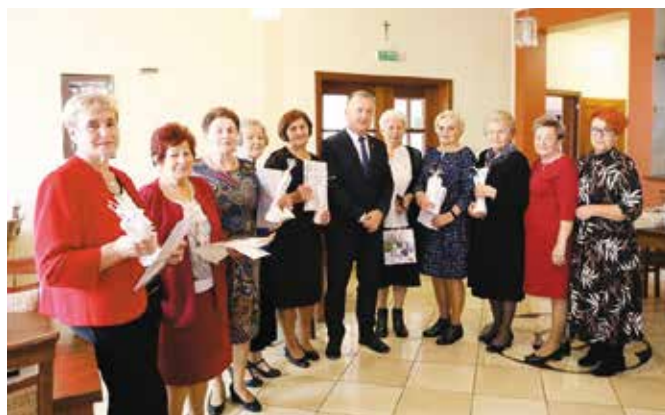
W Chęcinach Dzień Edukacji Narodowej świętowali emerytowani nauczyciele – członkowie ZNP