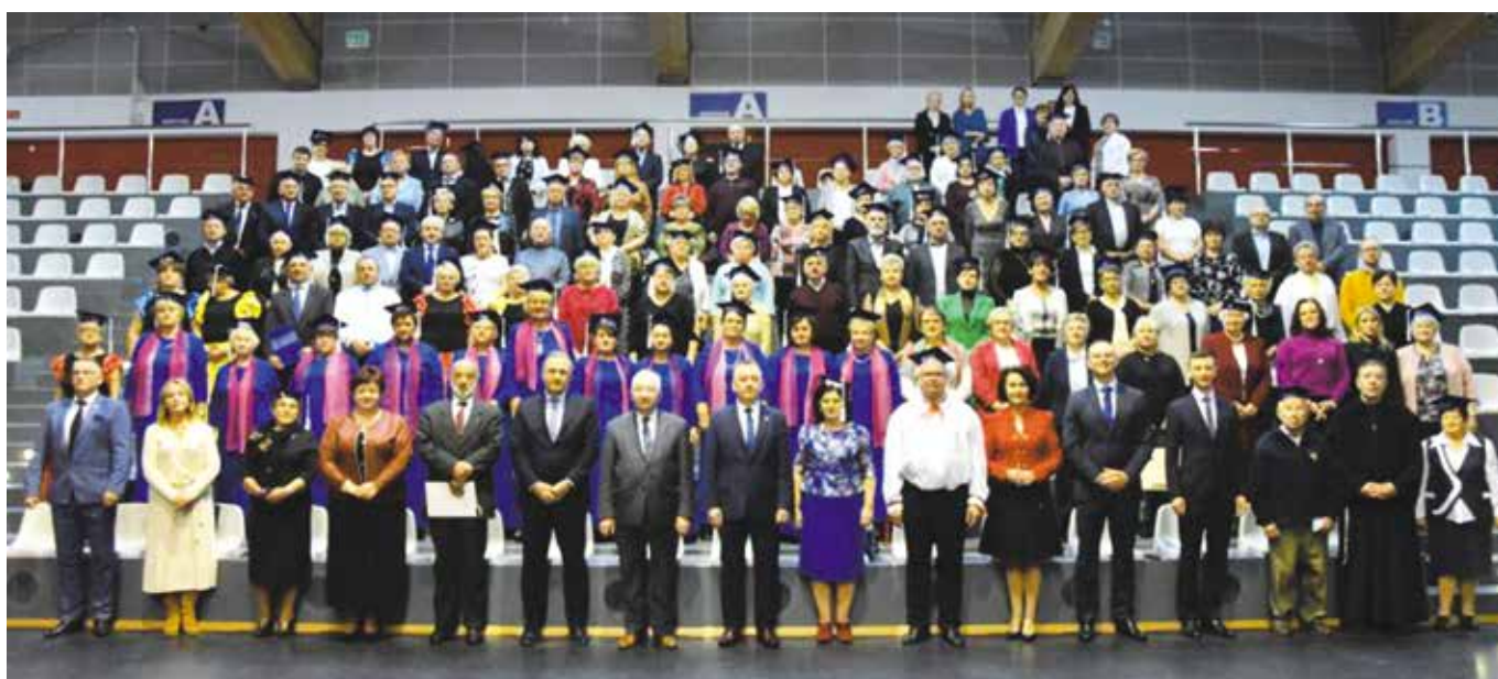
Uroczyste rozpoczęcie roku akademickiego Chęcińskiego Uniwersytetu Trzeciego Wieku