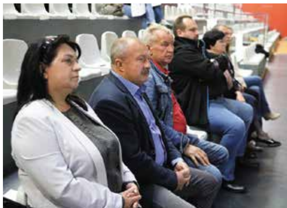
Radni, dyrektorzy jednostek i przedstawiciele instytucji wzięli udział w debacie nt. bezpieczeństwa

Prezentacja do obejrzenia na www.checiny.pl