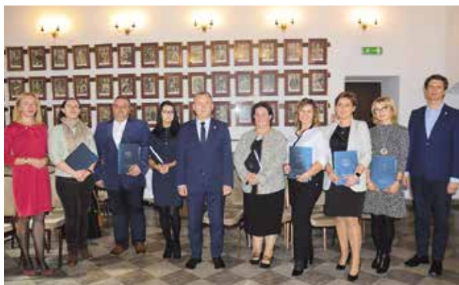
Nauczyciele otrzymali akty nadania stopnia nauczyciela mianowanego