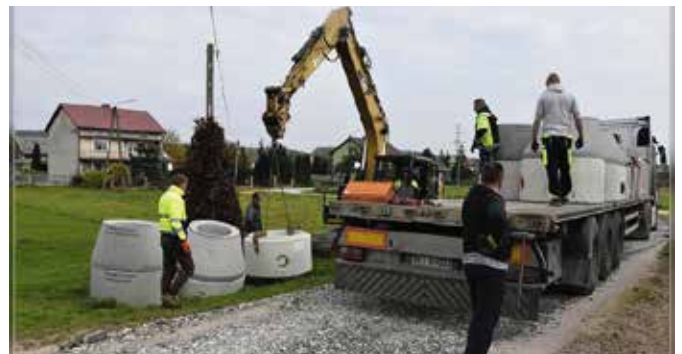
Trwają prace przy budowie kanalizacji - ul. Zelejowa

Jak podkreśla, dzięki tak wysokiemu rządowemu wsparciu gmina mogła szybciej ogłosić przetarg na wyłonienie wykonawcy zadania i sprawnie ruszyć z pracami. - Termin rozpoczęcia prac uzależniony był od pozyskanych środków. Przypomnę, że opracowanie dokumentacji technicznej budowy kanalizacji na ulicy i osiedlu Zelejowa oraz terenach przyległych ruszyło w 2016 roku. W międzyczasie pozyskaliśmy środki unijne z Programu Rozwoju Obszarów Wie-