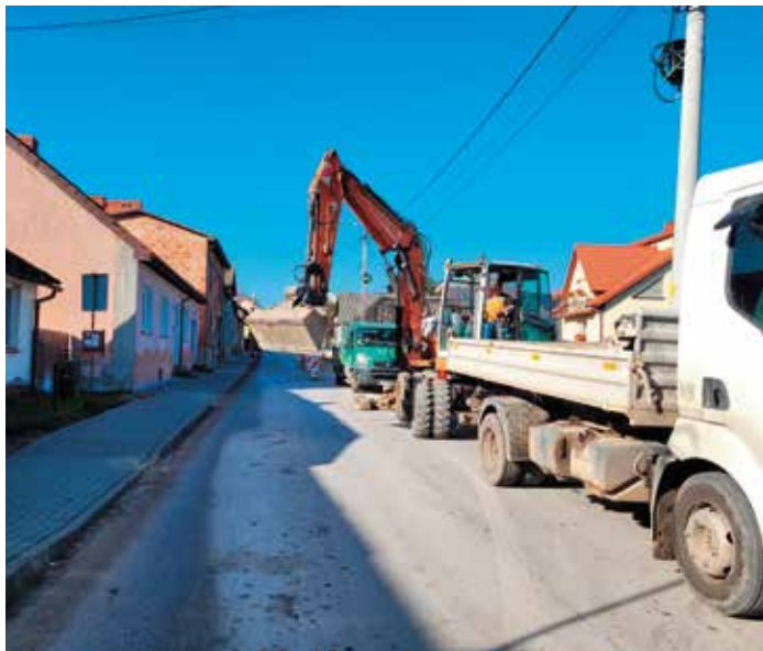
Pod koniec listopada prace zostaną zakończone

Katarzyna Kazusek