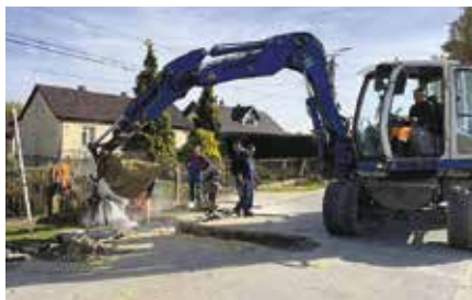
Trwają prace remontowe

Jedną z najdroższych inwestycji drogowych, realizowanych dzięki milionowemu dofinansowaniu pozyskanemu jeszcze w poprzednim rozdaniu, jest rozbudowa drogi Siedlce-Łukowa. Roboty drogowe właśnie tu ruszyły, a mogły się one rozpocząć po zakończeniu projektowania. To oznacza, że mieszkańcy Łukowej już niebawem będą mogli zapomnieć o wąskiej, zniszczonej drodze w kierunku Siedlec. 2,5-kilometrowy odcinek zostanie kompleksowo rozbudowany. Poza nową nawierzchnią, wzdłuż 850 metrowego odcinka drogi powsta-