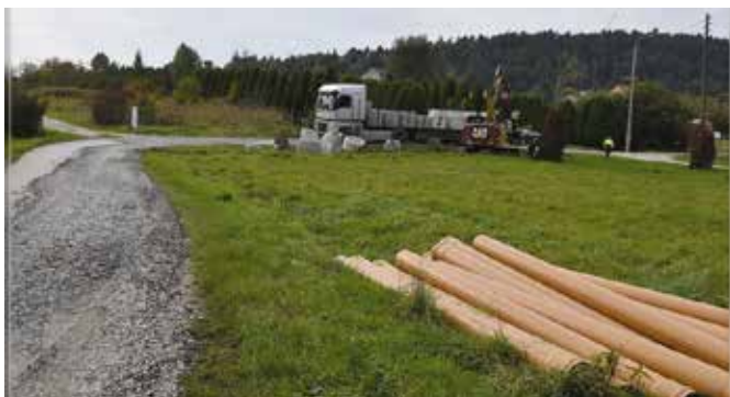
Zakończenie prac planowane jest jesienią 2023 r.