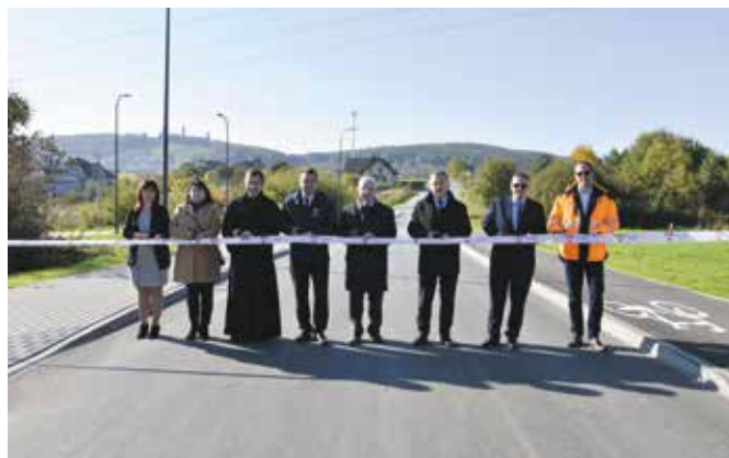
Symboliczne otwarcie czterech dróg na Osiedlu Zelejowa

Kolejnymi z oddanych właśnie oficjalnie do użytku mieszkańców dróg są ulica Henryka Dąbrowskiego i Mikołaja Kopernika, które połączyły ulicę Zelejową z rondem w drodze wojewódzkiej numer 762. Wybudowany został tu także ciąg pieszo-rowerowy. Inwestycja opiewała na kwotę prawie 3,5 miliona złotych, z czego blisko połowę kosztów pokryło rządowe dofinansowanie. - To kolejne drogi, które mogliśmy wybudować dzięki pozyskanym rządowym środkom. Realizacja tej inwestycji z pewnością poprawi jakość życia mieszkańców, ale daje także możliwość powstania kolejnych terenów pod budownictwo mieszkaniowe. Powstałe tu nowe ulice wraz z chodnikami i ścieżką rowerową stały się także alternatywą dla drogi wojewódzkiej biegnącej od