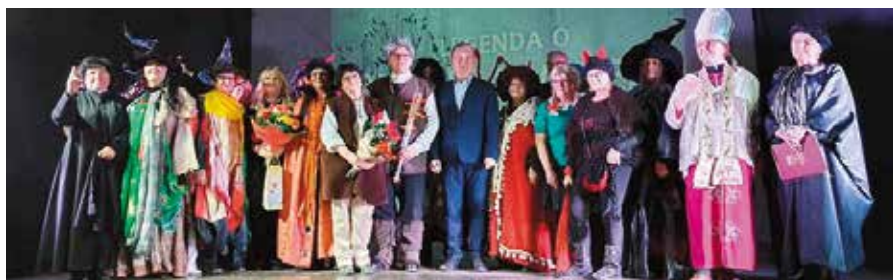
CHUTW w spektaklu „O Zbójcu Madeju”