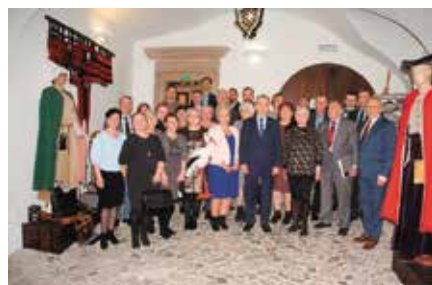
Obchody Dnia Soltysa