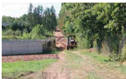
Budowa wodociągu w Tokarni