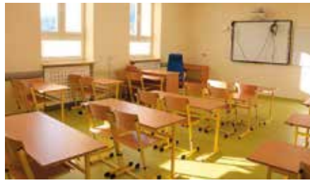
I etap remontu SP w Chęcinach