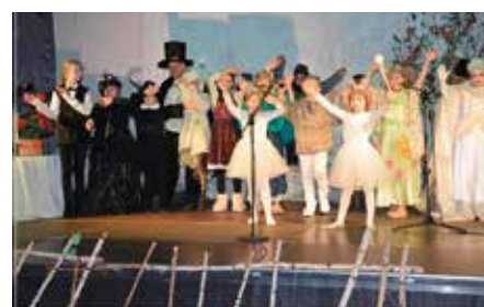
Spektakl teatralny: „Królowa Śniegu”