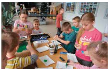
Ferie w Mieście z CKiS