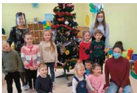
Utworzenie oddziału przedszkolnego w Wolicy