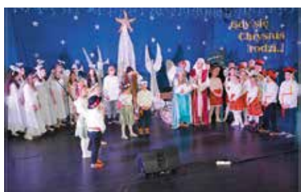
Przeгляд Widowisk Jasełkowych