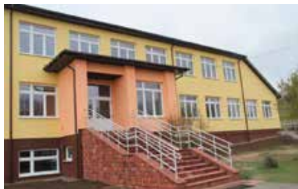
Ruszył projekt budowy hali sportowej w Bolminie