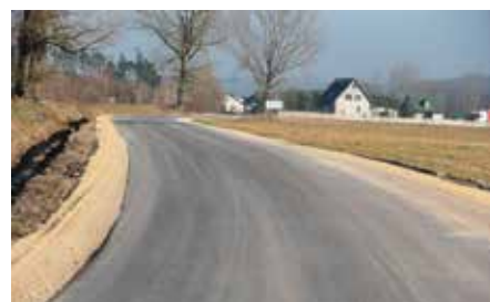
Budowa drogi Łukowa-Wierzbica