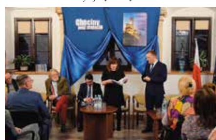
Premiera książki „Chęciny przez stulecia”