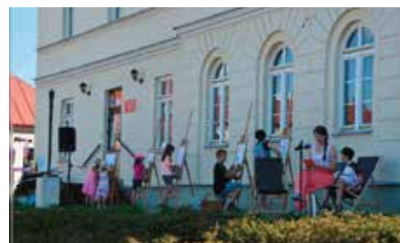
Zacztyj się w Chęcinach