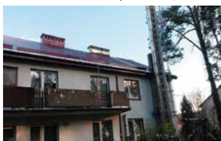
Nowy dach na tzw. hotelowcu w Czerwonej Górze