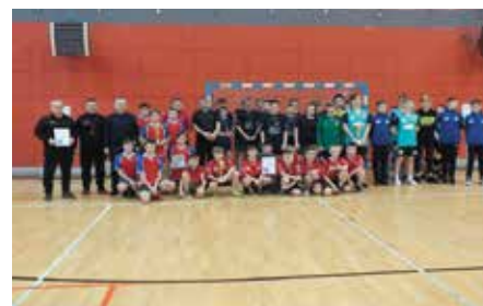
Turniej Piłki Ręcznej