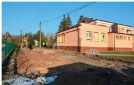
Budowa parkingu przy SP w Korzecku