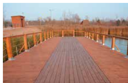
Kładki i pomosty pozwalają na podziwianie otaczającej przyrody

spacerowy, a także ścieżka dydaktyczna. Trasa zostanie oznakowana tablicami edukacyjnymi opisującymi okoliczną roślinność i zwierzęta. Już powstały też punkty widokowe i kładka z tarasem widokowym pozwalające na obserwację gatunków roślin i zwierząt. Są też stanowiska dla wędkarzy i moło, z którego będzie można podziwiać piękno przyrody.