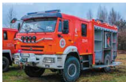
Samochód dla OSP Tokarnia