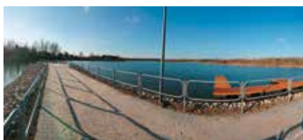
Zagospodarowanie zbiornika w Lipowicy