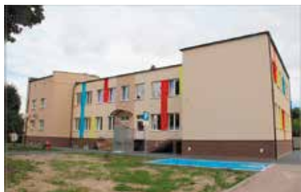
Kompleksowy remont SP w Wolicy