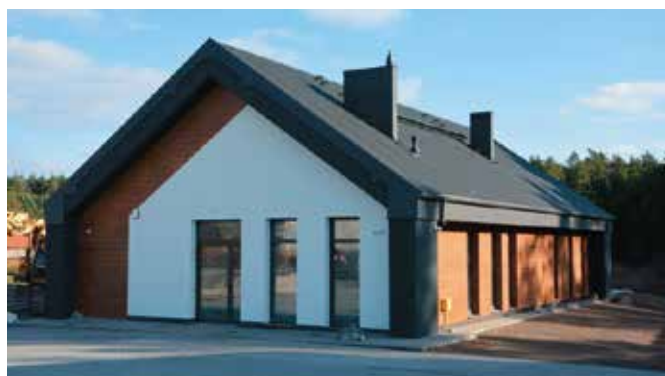
Świetlica w Lipowicy nowoczesna i funkcjonalna

Trzeba przyznać, że budynek świetlicy w Lipowicy jest nowoczesny i spełniający najwyższe standardy. Zgodnie z projektem jest to nowoczesny, parterowy obiekt z dwuspadowym dachem, dostępny dla osób niepełnosprawnych o całkowitej powierzchni użytkowej 160 metrów kwadratowych. Wewnątrz znajduje się wielofunkcyjna sala o powierzchni 60 metrów kwadratowych, która doskonale sprawdzi się na spo-