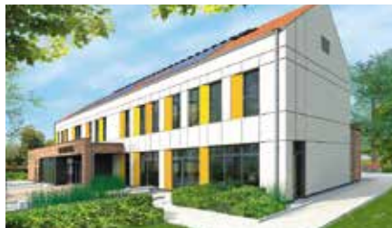
Opracowanie dokumentacji na budowę Biblioteki z Domem Seniora