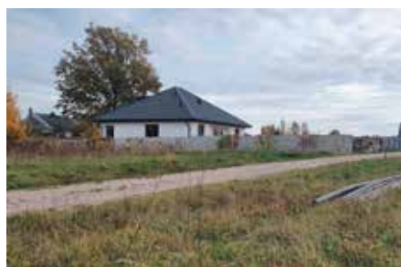
Budowa wodociągu w Łukowej