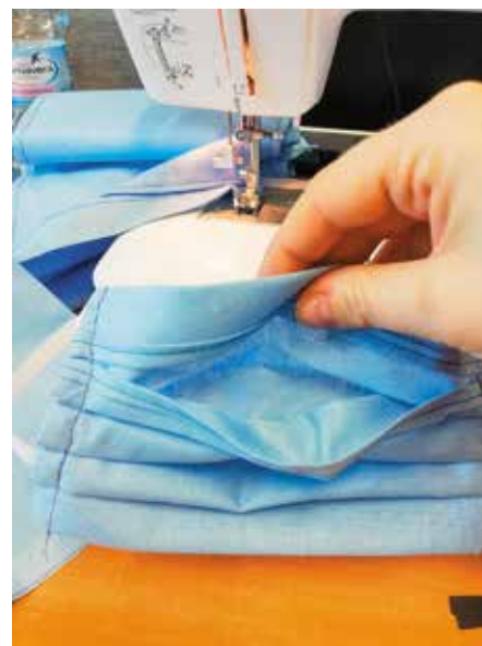
Akcja szycia maseczek