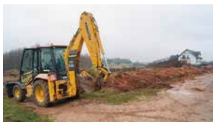
Budowa wodociągu w Polichnie