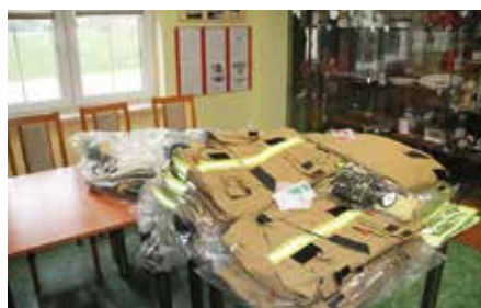
Sprzęt strażacki dla 4 jednostek OSP