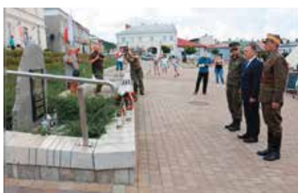
Marsz Szlakiem 1-szej Kompanii Kadrowej