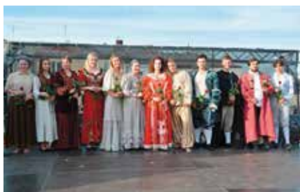
Letnia Scena Teatralna