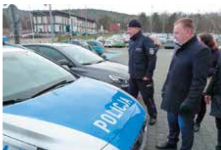
Nowy samochód dla Komisariatu Policji w Chęcinach