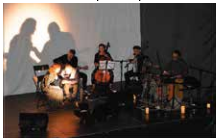
Spektakl „Pieśń nad Pieśniami”