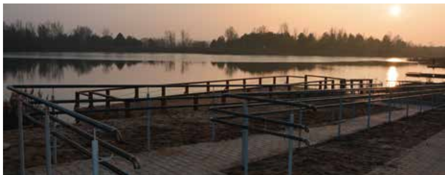
Zbiornik robi niesamowite wrażenie o każdej porze dnia i roku