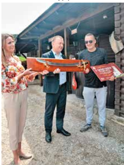
Milionowy turysta na Zamku w Chęcinach