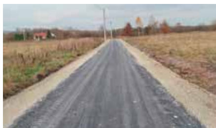
Budowa drogi w Małej Tokarni