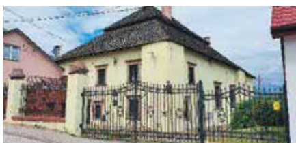
Opracowanie dokumentacji na Synagogę