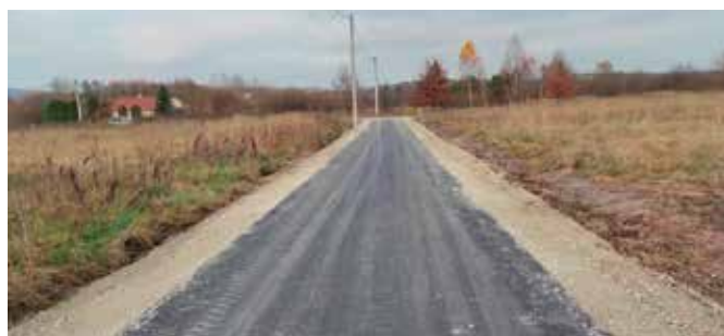
Nowy odcinek drogi w Małej Tokarni

Pierwszy etap budowy ponad ośmiuset metrowego odcinka drogi łączącej Małą Tokarnię z Tokarnią właśnie się zakończył. Wybudowano tu drogę na długości blisko 140 metrów, na którą gmina Chęciny pozyskała dofinansowanie z Urzędu Marszałkowskiego Województwa Świętokrzyskiego. Na dalszy etap budowy drogi gmina ogłosiła właśnie przetarg celem wyłonienia wykonawcy inwestycji. Zgodnie z założeniami zakończenie prac przewidziano na koniec lipca 2021 roku.