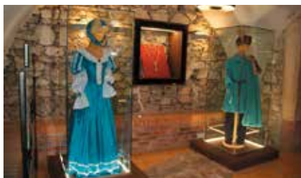
Powstanie Muzealnej Izby Pana Wołodyjowskiego w Chęcinach