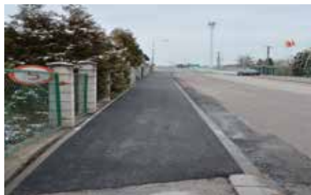
Ścieżka rowerowa ul. Partyzantów w Chęcinach