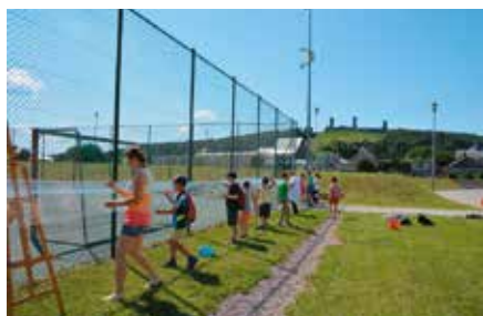
Wakacje w mieście z CKiS