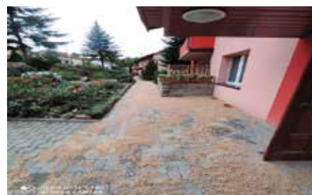
Nowy chodnik w Czerwonej Górze