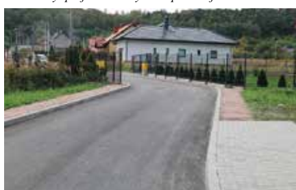
Ulica Wołodyjowskiego w Chęcinach