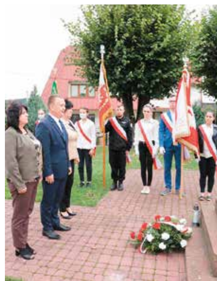
Obchody rocznicy agresji Rosji na Polskę