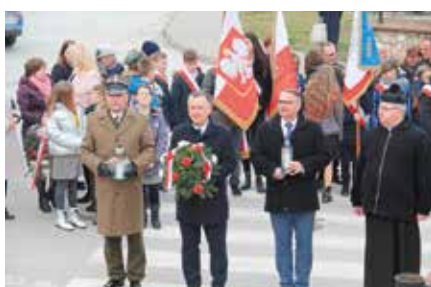
Obchody Dnia Żołnierzy Wyklętych