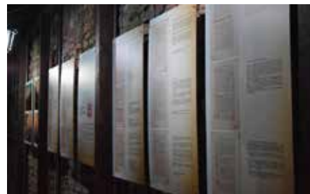
Repliki dokumentów na zamku w Chęcinach