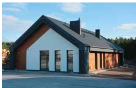
Świellica w Lipowicy