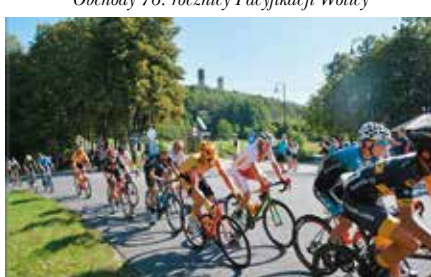
31. Międzynarodowy Wyścig Kolarski Solidarności i Olimpijczyków