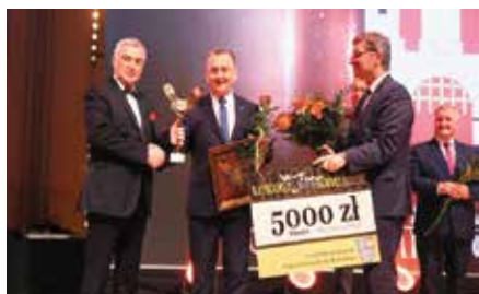
Gmina Chęciny zdobyła po raz drugi Victorię Świętokrzyską