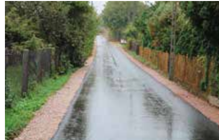
Droga w Siedlcach