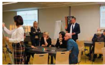
„Lunch” edukacyjny w Chęcinach