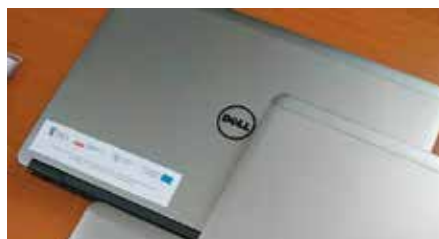
Laptopy dla szkół