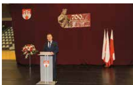
700 - lecie koronacji Króla Władysława Łokietka