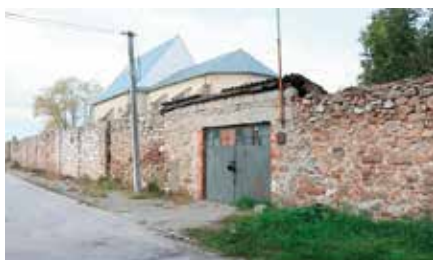
Zdobycie środków na remont muru w Klasztorze Franciszkanów