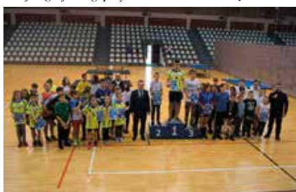
IX Turniej Tenisa Stołowego Dzieci i Młodzieży