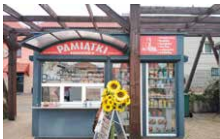
Gminny kiosk z pamiątkami