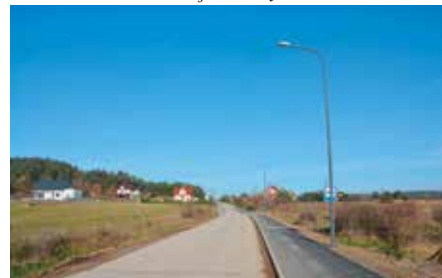
Ścieżka rowerowa w Zelejewie