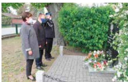
Obchody 76. rocznicy Pacyfikacji Wolicy