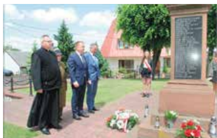
Rocznica Pacyfikacji Chęcin