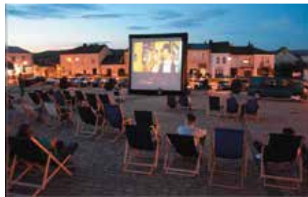
Kino Letnie na Rynku w Chęcinach