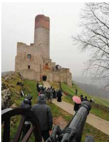
Ekipa TVP nagrywała Koronę Królów na Zamku w Chęcinach