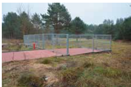
Przepompownia wody w Miedziance