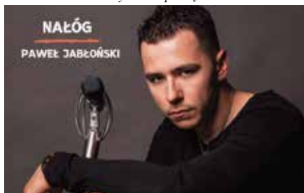
Nowy singiel Pawła Jabłońskiego