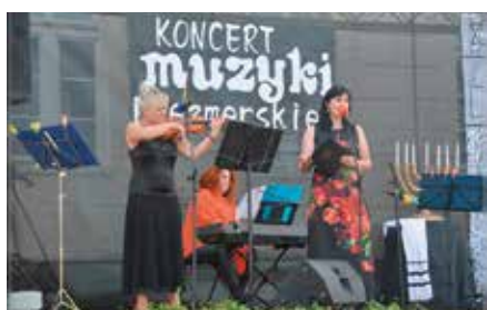
Koncert Muzyki Klezmerskiej