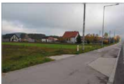
Budowa wodociągu w Korzecku