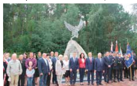
Święto Lotników w Gościńcu