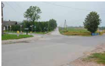
Trwa projekt budowy rond w Chęcinach