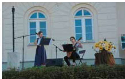
Zamkowe Spotkania z Muzyką