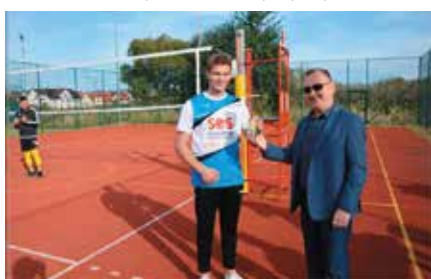
Turniej Piłki Siatkowej