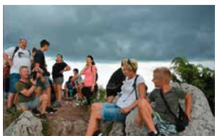
Rajd z kijkami do Miedzianki