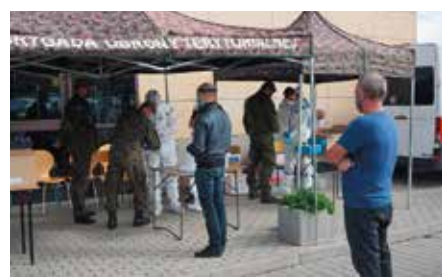
Bezpłatne testy na COVID-19 dla nauczycieli