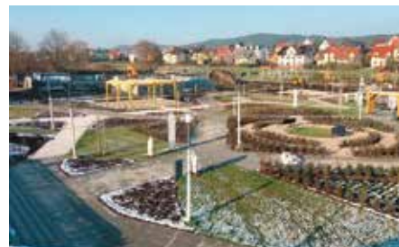
Park Miejski w Chęcinach