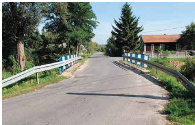
Kolejne drogi w gminie niebawem zostaną wyremontowane.