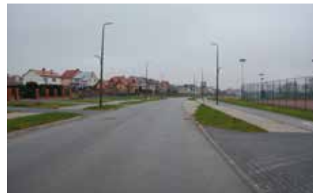
Aleja Piłsudskiego w Chęcinach