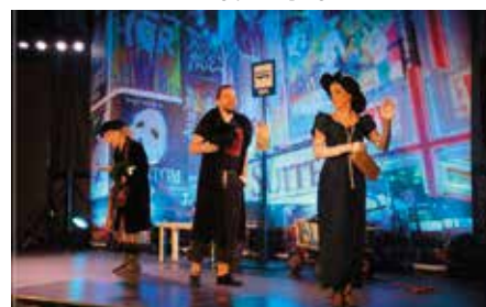
Operetka „Przystanek Hollywood”