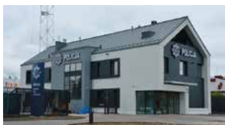
Nowy Komisariat Policji w Chęcinach