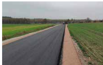
Budowa drogi Łukowa Gajówka