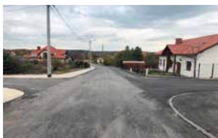
Budowa dróg na Osiedlu w Chęcinach