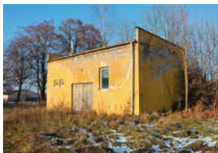
W Korzecku zostanie zmodernizowane ujęcie wody

Ujęcie wody w Korzecku zostało zamknięte kilkanaście lat temu w związku ze wzrostem zawartości azotanów w wodzie z tego ujęcia. Gmina postanowiła przeprowadzić analizy wody z tego źródła, a także wykonać operat wodno-prawny w celu uzyskania pozwolenia wodnoprawnego na pobór wód. - Od dawna już analizujemy zasoby wodne na terenie naszej gminy. W związku z widmem zwiększających się globalnie braków wodnych i wzrastającą z roku na rok suszą, chcemy uruchamiać kolejne nowe ujęcia, które będą alternatywą dla tych już istniejących. Staramy się robić wszystko, aby zapewnić mieszkańcom wodę o właściwych parametrach fizyko-chemicznych pod