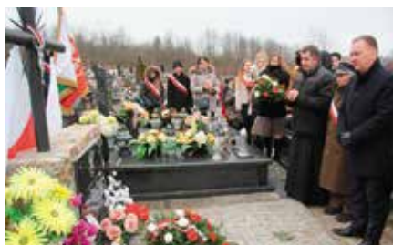
157. rocznica Powstania Styczniowego