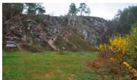
Podpisana umowa o dofinansowanie na Geopark