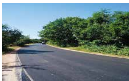
Droga w Podzamczu