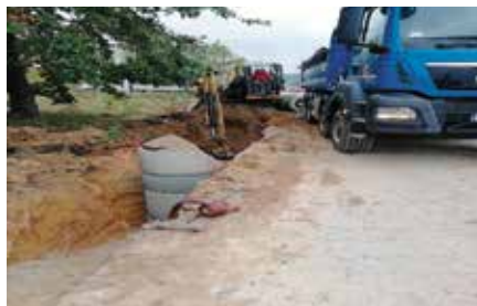
Budowa kanalizacji w Zelejewie