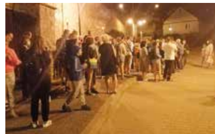
Weekendy z Trylogią i Noce na Zamku