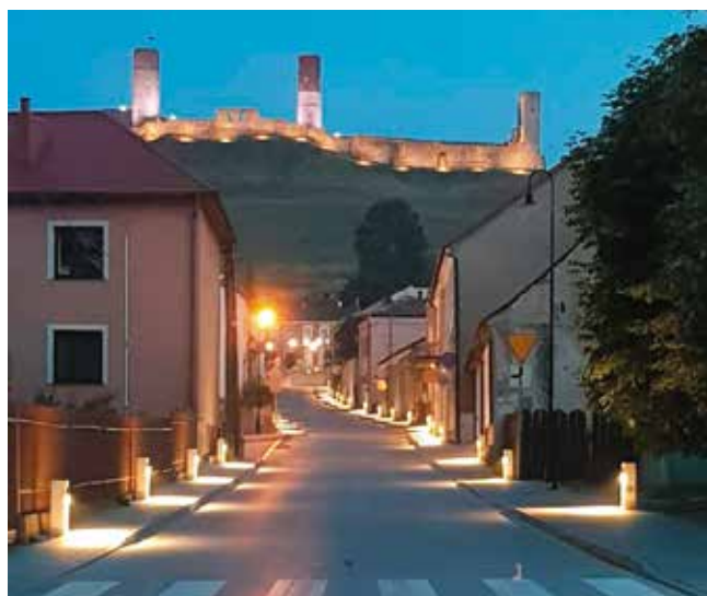
Nowe oświetlenie nadało klimatu ul. Staszica w Chęcinach

Niesamowite wrażenie robi nowe oświetlenie ulicy Staszica w Chęcinach. Dzięki niemu po zmroku nie tylko jest tu jaśniej, ale również stylowo i klimatycznie. Podobnie jak na równoległej ulicy Łokietka.