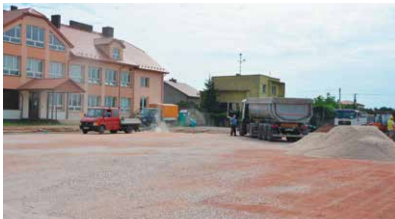
Prace przy budowie boiska w Tokarni