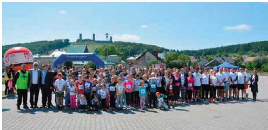
Coroczny Bieg Uliczkami Chęcín cieszy się dużym zainteresowaniem