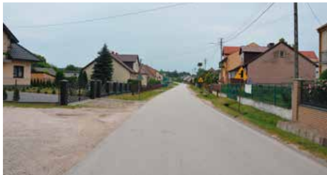
W Łukowej powstanie nowy chodnik

Chodnik ma powstać od cmentarza parafialnego w Łukowej aż do wysokości szkoły. - Nie jest to łatwa inwestycja – przyznaje Paweł