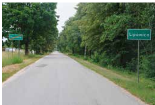
Planowane oświetlenie na odcinku Przymiarki-Lipowica