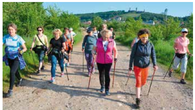
Spacerowicze podążyli w stronę Jaskini Piekło

Dynamiczne, pełne rozmachu chodzenie z kijkami pozwala zdobywać kondycję oraz rozwijać poszczególne grupy mięśni, które normalnie są zaniedbywane. Treningowi poddawane są jednocześnie nogi, biodra oraz górna część ciała: ręce, bark, ramiona, mięśnie klatki piersiowej i kręgosłup. Badania dowodzą, że podczas nordic walking zaangażowane w pracę jest ok. 90% mięśni ciała.