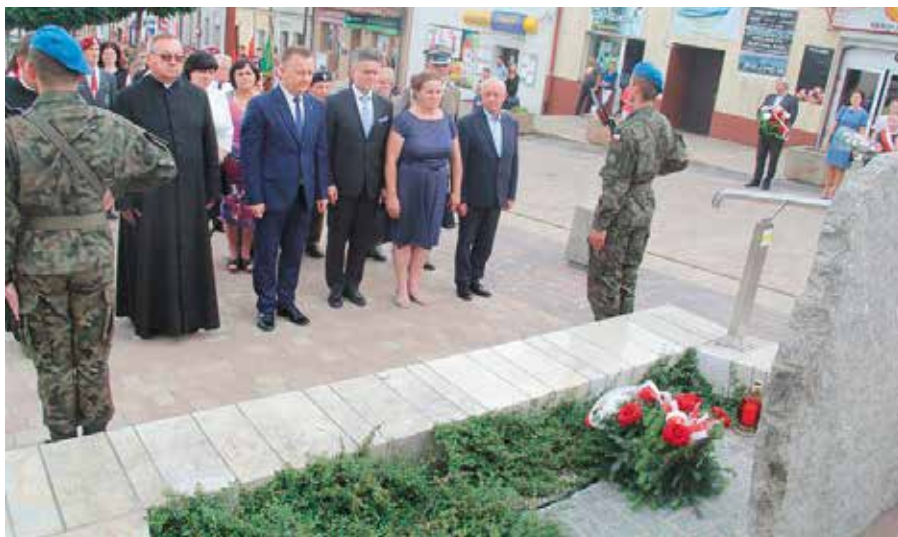
Złożenie wiązanek pod tablicą na Pl. 2 Czerwca