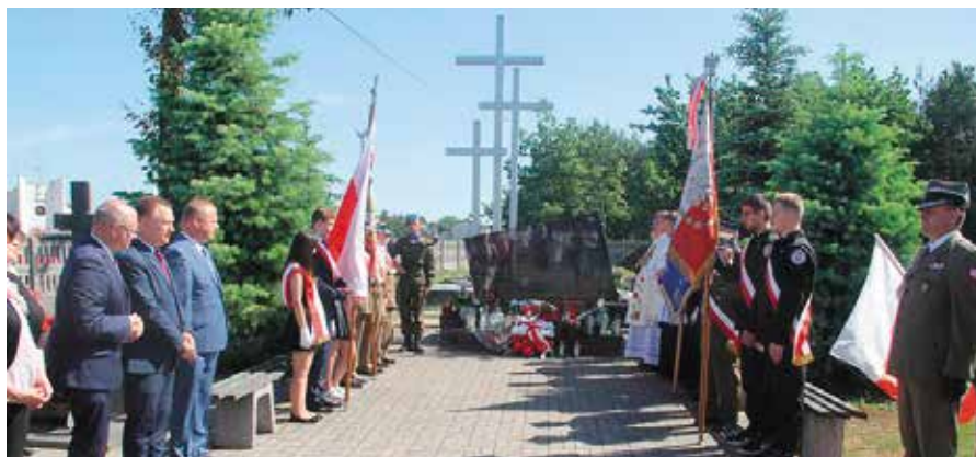
Złożenie wiązanek przy Pomniku w Wolicy

W dowód patriotyzmu, szacunku do naszej historii i do tych, którzy 2 czerwca 1944 roku przelali krew za wolność naszej Ojczyzny, w kościele parafialnym p.w. Św. Bartłomieja w Chęcinach spotkały się władze Gminy i Miasta Chęciny, rodziny ofiar pomordowanych, poczty sztandarowe Związku Kombatantów RP i BWP, żołnierze z Centrum Przygotowań do Misji Zagranicznych w Kielcach, przedstawiciele jednostek Ochotniczych Straży Pożarnych, dyrektorzy i nauczyciele szkół, sołtysi, pracownicy Urzędu, młodzież, zaproszeni goście, a także mieszkańcy gminy Chęciny, aby uczestniczyć w uroczystej mszy świętej. – 74 lata temu w Chęcinach był wielki piątek, chociaż nie był to wielki post. Nasi rodacy za wolność pokoleń oddali najcenniejszy dar, jakim jest życie.