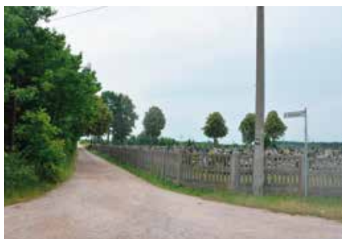
Przy ul. Spokojnej w Wolicy niebawem będzie jaśniej

metrów zaświecą aż 24 lampy. Na wykonanie tych zadań gmina już wysłała zapytania ofertowe do wykonawców. Wszystkie inwestycje zaplanowano do zrealizowania jeszcze w tym roku.