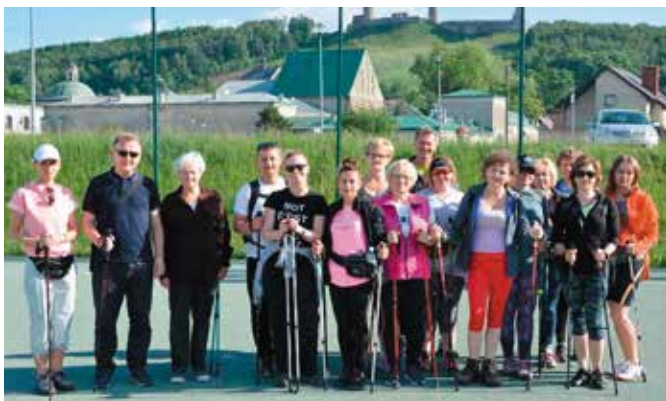
I Rajd z kijkami za nami

Trasa licząca ponad 9 km prowadziła przez piękne tereny naszej gminy, które w blasku promieni słonecznych i budzącej się do życia przyrody zachwyciły wszystkich jeszcze bardziej. Miło nam, iż podczas rajdu mogliśmy gościć osoby spoza naszej gminy.