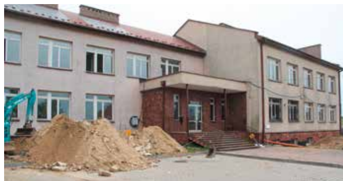
Prace w SP w Polichnie idą pełną parą

Wszystko w związku z rozpoczętym na początku czerwca kompleksowym remontem i termomodernizacją Szkoły Podstawowej w Polichnie. Uczniowie cieszą się z dłuższych wakacji, a prace przy realizacji inwestycji idą pełną parą. Po ich zakończeniu, placówka będzie nie do poznania.