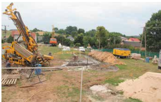
Ruszyły prace przy SP w Polichnie

Warto przypomnieć, że kompleksowy remont i termomodernizacja budynku Szkoły Podstawowej w Polichnie to zaledwie część dużego projektu, na który władze gminy pozyskały aż 8 milionów 676 tysięcy złotych unijnego dofinansowania. Do tej pory kompleksową termomodernizację przeszła już szkoła w Bolminie i Starochęcinach. W Polichnie prace idą właśnie pełną parą. Na tym jednak nie koniec. Kolejną szkołą szykowaną do przeprowadzenia prac termomodernizacyjnych jest Szkoła Podstawowa w Wolicy. Po zakończeniu inwestycji, utrzymanie budynków szkolnych ma być dużo tańsze.