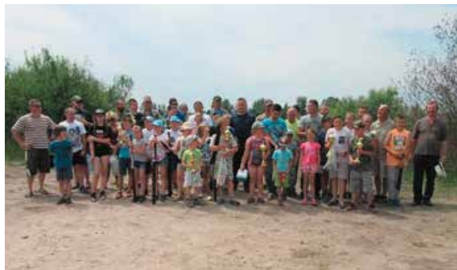
Najmłodszym w łowieniu towarzyszyli rodzice

Na zakończenie wszyscy uczestnicy zostali zaproszeni na pyszny poczęstunek. - Wędkowanie daje wiele przyjemności, a dzięki takim za-