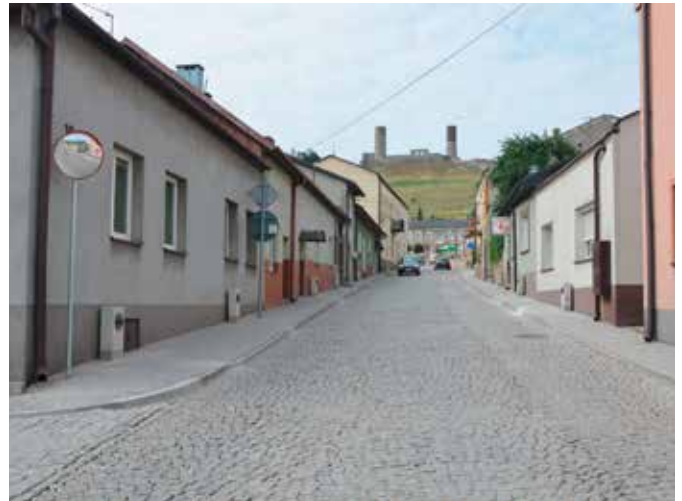
Ul. Staszica będzie kolejnym traktem pieszym prowadzącym na Zamek