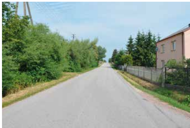
Pod koniec sierpnia mieszkańcy Korzecka będą już mogli przemieszczać się chodnikiem