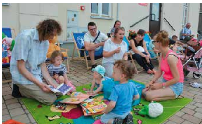
Radość i zabawa towarzyszyła najmłodszym podczas obchodów Dnia Dziecka w Chęcinach