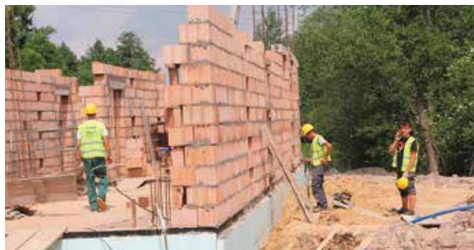
Postęp prac przy budowie remizy w Radkowicach