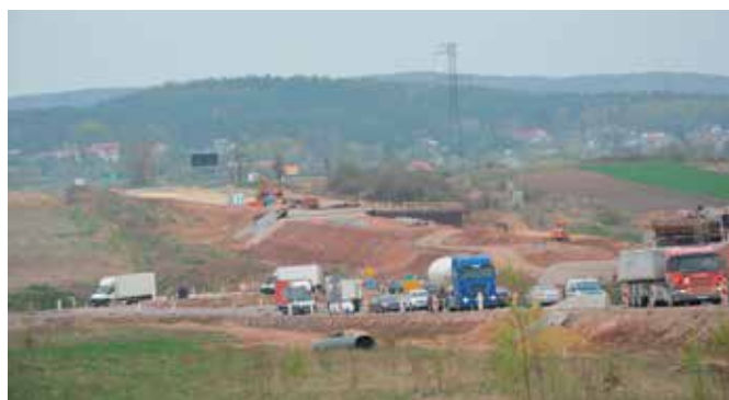
Budowa trasy ekspresowej S7 wokół Chęciny