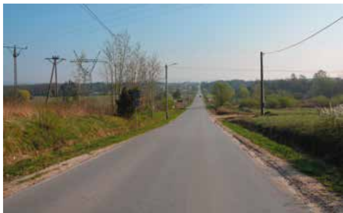
Wzdłuż drogi powiatowej powstanie chodnik