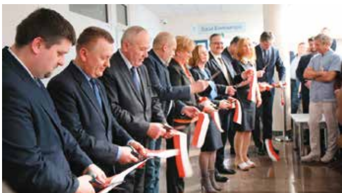
Dział Endoskopii w Czerwonej Górze zapewnia diagnostykę na poziomie XXI wieku

W dniu 09.03.2018 uroczystie otwarty został nowoczesny Dział Endoskopii. Dotychczasowa lokalizacja pracowni endoskopowych nie była komfortowa zarówno dla Pacjentów jak i Personelu szpitala, dlatego zdecydowano o adaptacji pomieszczeń w budynku C szpitala. Dział Endoskopii w nowej lokalizacji to 4 sale zabiegowe oraz sala wybudzeń, wyposażone w sprzęt najnowszej generacji. Wraz z pomieszczeniami socjalnymi i salą szkoleniową zajmują one prawie trzy razy większą powierzchnię niż dotychczas i zapewnią Pacjentom diagnostykę na poziomie XXI wieku.