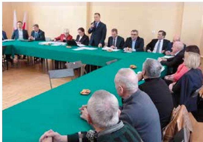
Ożywiona dyskusja podczas Sesji

- Muszę podkreślić, że w miejscowości Miedzianka, znajdującej się najbliższej planowanej inwestycji, funkcjonuje obecnie jedna z większych atrakcji turystycznych naszej gminy – Muzealna Izba Górnictwa Kruszcowego, a gmina otrzymała właśnie dofinansowanie w ramach Regionalnego Programu Operacyjnego Województwa Świętokrzyskiego na lata 2014-2020 na utworzenie przy niej Staropolskiego Ośrodka Górnictwa Kruszcowego z turystyczną trasą powierzchniową i - co istotne w związku z opiniowaną inwestycją – utworzeniem podziemnej trasy turystycznej wnętrzem Góry Miedzianka. Inwestycje te znacząco wpłyną na turystyczny i ekonomiczny rozwój tej części Województwa Świętokrzyskiego, przyciągając tłumy turystów –