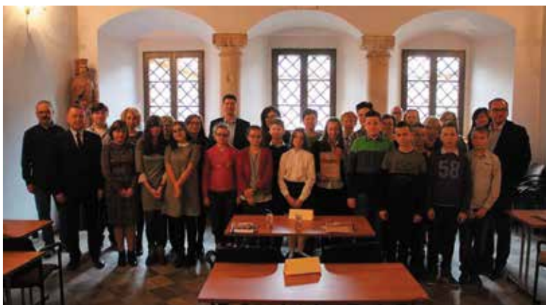
Pamiątkowe zdjęcie uczestników konkursu z organizatorami