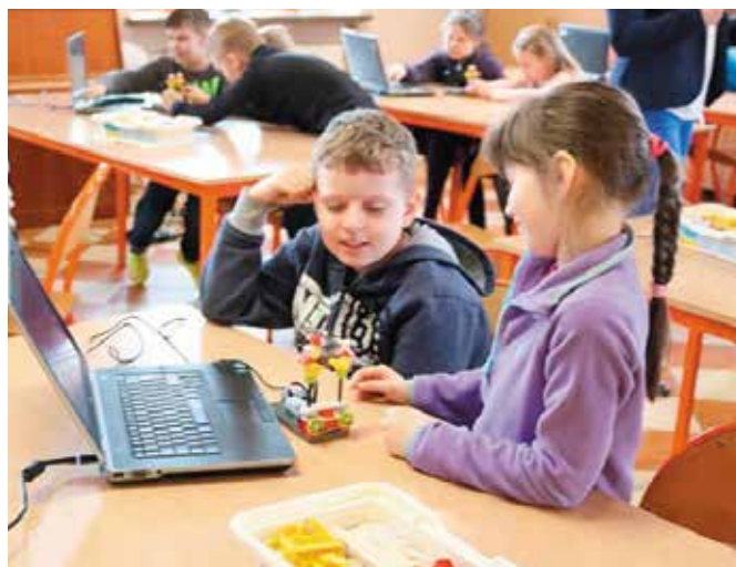
Nowy sprzęt komputerowy z pewnością uatrakcyjni zajęcia lekcyjne