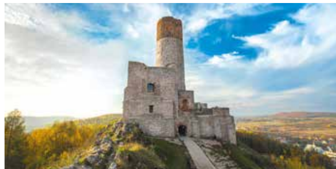
Warownia w Chęcinach walczy o tytuł „Zabytek Zadbane 2018”

Zamek Królewski z Chęciny znalazł się w ogólnopolskim konkursie „Zabytek Zadbane 2018” Ministra Kultury i Dziedzictwa Narodowego oraz Generalnego Konserwatora Zabytków. Procedurę konkursową prowadzi Narodowy Instytut Dziedzictwa. Stało się to możliwe dzięki złożonemu przez Gminę Chęciny w styczniu bieżącego roku zgłoszeniu Zamku Królewskiego do konkursu. Na liście zakwalifikowanych obiektów znalazło się zaledwie 45 zabytków z piętnastu województw z całego kraju.