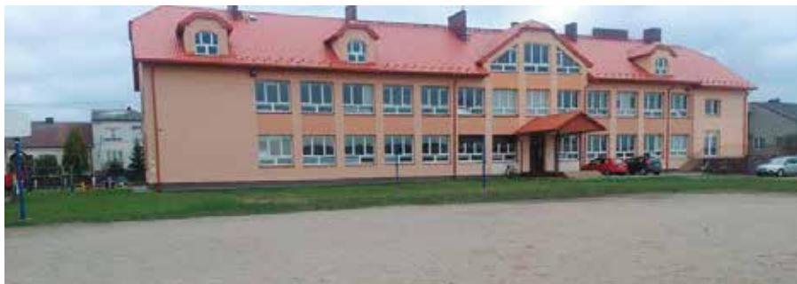
Niebawem przy SP w Tokarni powstanie nowe boisko i zaplecze parkingowe