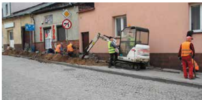
Nowe oświetlenie podkreśli urok ul. Staszica