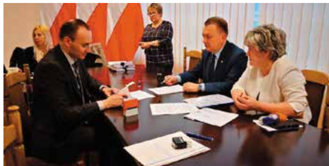
132 tys. 462 złote władze Gminy i Miasta Chęciny pozyskały na zakup sprzętu dla OSP