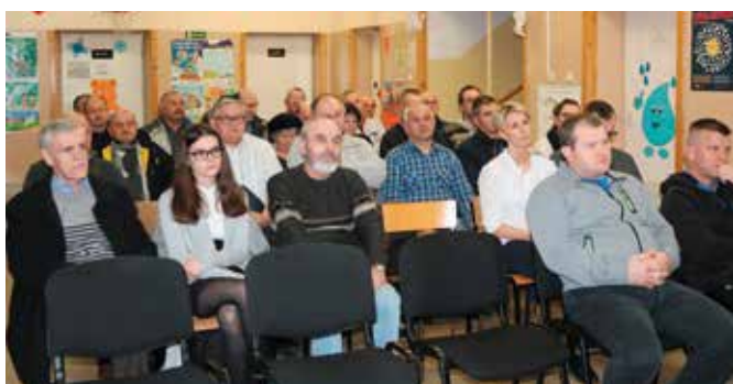
Spotkanie w Radkowicach