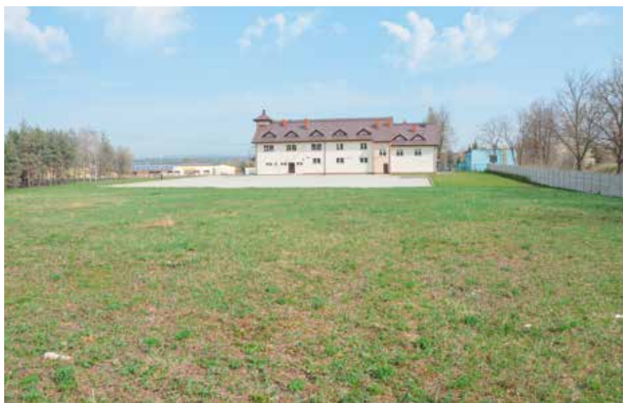
Przy świetlicy i strażnicy powstanie nowoczesny Ośrodek Zdrowia w Wolicy

Wszystko wskazuje na to, że pierwszy krok w kierunku wybudowania przychodni w Wolicy właśnie został zrobiony. Władze Gminy i Miasta Chęciny już podpisały umowę z wykonawcą na przygotowanie dokumentacji technicznej. Nowoczesny obiekt, na miarę dzisiejszych czasów, powstanie na działce przy budynku remizy. Teren wokół zostanie też zagospodarowany.