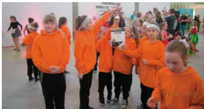
Lazur z Miedzianki stanął na najwyższym podium