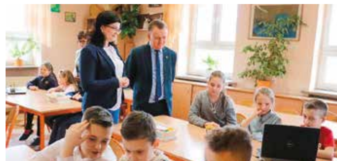
22 laptopy trafiły do uczniów ze SP w Chęcinach

12 marca w Szkole Podstawowej im. Jana Kochanowskiego w Chęcinach, nastąpiło uroczyste przekazanie sprzętu komputerowego, zakupionego na potrzeby szkoły przez Gminę Chęciny. Podczas lekcji otwartej w ramach projektu „ProgramujeMy”, Burmistrz Gminy i Miasta Chęciny, Robert Jaworski oficjalnie przekazał dla SP w Chęcinach 22 laptopy. Uczniowie na tę okoliczność przygotowali krótki, tematyczny występ artystyczny.