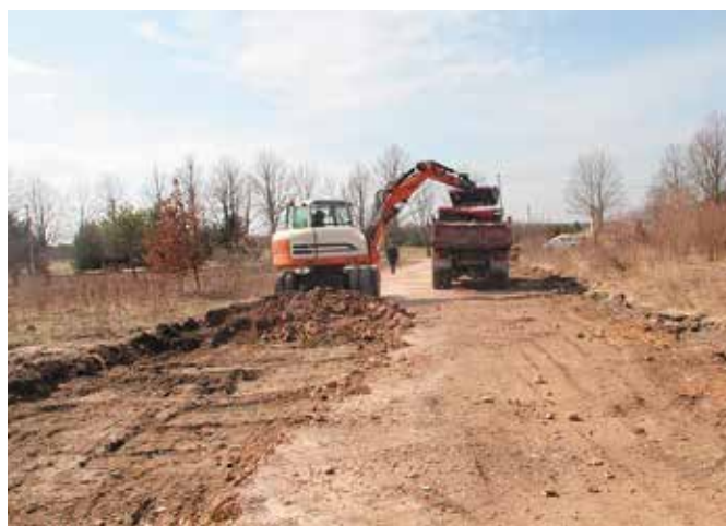
Droga do cmentarza w trakcie prac