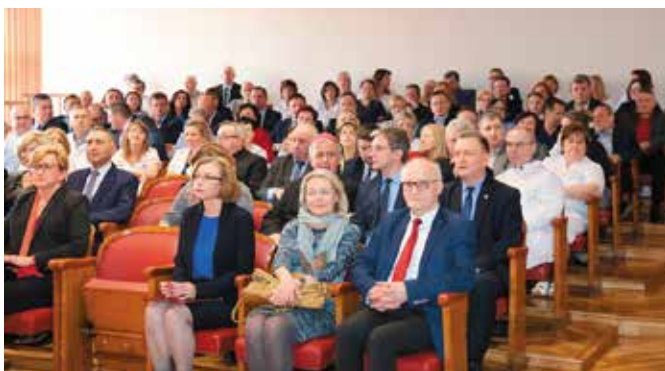
W uroczystym otwarciu Działu Endoskopii wzięło udział wielu gości