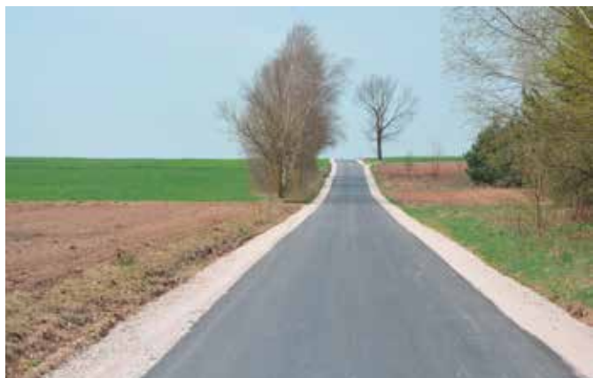
W stronę Gajówki pojedziemy już po nowej nawierzchni