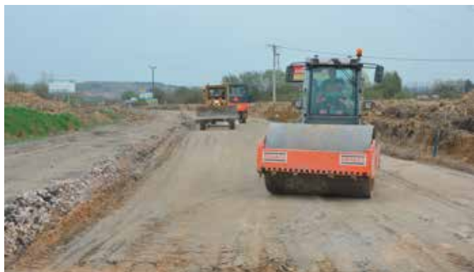
Prace na drodze wojewódzkiej 762