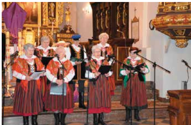
W koncercie wzięł udział m.in. zespół śpiewaczy „Ostrowianki”

że nasze życie ma sens. Podczas koncertu usłyszeliśmy pieśni podkreślające właśnie nadzieję wyrażoną w cierpieniu i ufności w Boże Miłosierdzie jak i pieśni na czas pokuty.