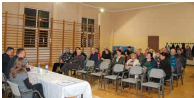
Spotkanie w Miedziance