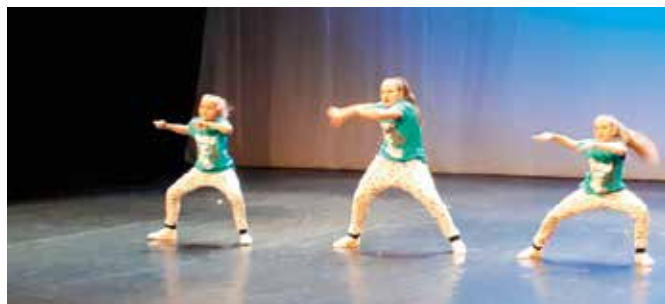
Dziewczyny wytańczyły udział w Finale w Hiszpanii