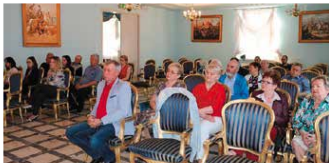
Spotkanie w Podzamczu