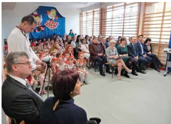
SP w Bolminie jest pierwszą placówką oświatową w województwie, która wprowadziła nauczanie dwujęzyczne