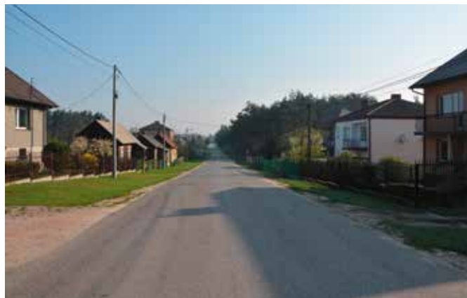
W Lipowicy będzie kontynuacja chodnika wzdłuż drogi

W ubiegłym roku w Lipowicy wybudowano pół kilometra chodnika z kostki brukowej wraz ze zjazdami do posesji, a także wybudowano pół kilometra nowego dywaniku asfaltowego. W ramach prac wykonano także odwodnienia drogi, remont przepustów drogowych i wymianę przepustów zjazdowych, a także renowację rowów wraz z umocnieniem skarpy za chodnikiem. - Dzięki tej inwestycji zdecydowanie zwiększyło się w tym miejscu bezpieczeństwo pieszych. Kontynuacja prac