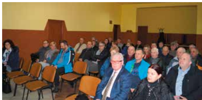
Spotkanie w Bolminie