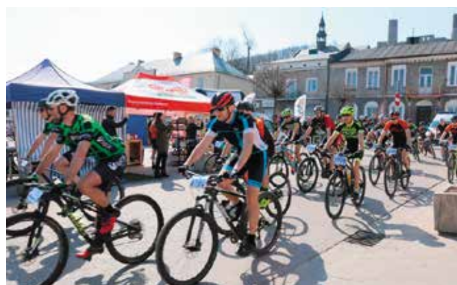
Ogólnopolska impreza sportowa ściągnęła tłumy zawodników do Chęciny