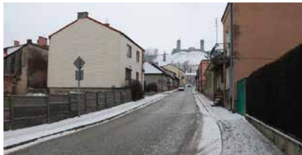
Stylowe oświetlenie niebawem pojawi się przy ul. Staszica w Chęcinach