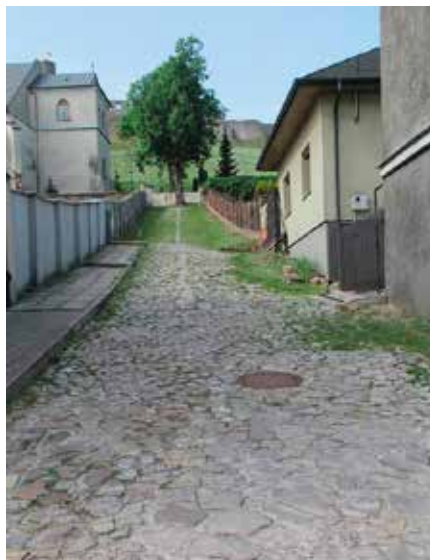
Obecny, zły stan drogi prowadzącej do kościoła i na zamek

Szlak kulturowy „Śladami Króla Łokietka” swój początek będzie miał na parkingu obok Klasztoru Franciszkanów, gdzie zaczyna się także trasa Ścieżki Mnicha oraz trasa Świętokrzyskiego Szlaku Archeo-Geologicznego. Turysta wybierając nowy Szlak Łokietkowy będzie mógł odwiedzić Klasztor Franciszkanów, Dolny i Górny Rynek, skąd wejdzie na wybruko-