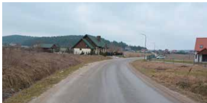
Wzdłuż ulicy Zelejowa powstanie ponad kilometr ścieżki rowerowej