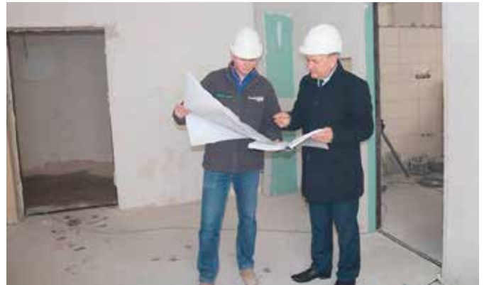
Burmistrz, Robert Jaworski podczas omawiania prac z kierownikiem remontu szkoły w Starochęcinach

Termomodernizacja Szkoły Podstawowej w Starochęcinach jest jednym z etapów dużego zadania, które otrzymało ponad 8,5 miliona złotych unijnego dofinansowania w ramach Zintegrowanych Inwestycji Terytorialnych. Zgodnie z projektem termomodernizację już przeszła Szkoła Podstawowa w Bolminie, w czerwcu ruszy termomodernizacja szkoły w Polichnie, zaś w przyszłym roku w Wolicy. Na realizację termomodernizacji zgłoszonych placówek gmina Chęciny pozyskała największe dofinansowanie ze wszystkich gmin należących do Kieleckiego Obszaru Funkcjonalnego. - To są bardzo duże, kompleksowe inwestycje i trudno byłoby zrealizować je z własnych środków, a na pewno nie w takim szerokim zakresie, jak obecnie zostały zaplanowane. Termomodernizacje trzech szkół są niezbędne, aby nie tylko podnieść komfort ich użytkowania, ale też zmniejszyć koszty utrzymania i wpłynąć tym samym na poprawę środowiska naturalnego znacznie ograniczając emisję zanieczyszczeń do powietrza - mówi Burmistrz Gminy i Miasta Chęciny, Robert Jaworski.