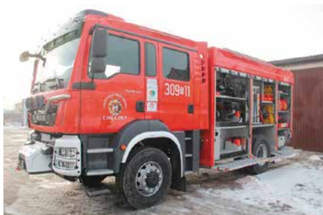
Nowy samochód otrzymała jednostka OSP z Chęciny

Jednostka na swoim wyposażeniu do tej pory miała dwa samochody bojowe, jeden lekki z 2009 roku i średni z 1986 roku. - Nowy sprzęt to nowe możliwości. Druhowie stoją na straży bezpieczeństwa wszystkich mieszkańców gminy. Ofiarnie jeżdżą do akcji narażając często nie tylko swoje zdrowie, ale i życie. W dzisiejszych czasach strażacy nie tylko gaszą pożary, ale na co dzień wzywani są również do wypadków drogowych, a tych niestety przy trasie S7 nie brakuje. Jesteśmy pełni uzna-