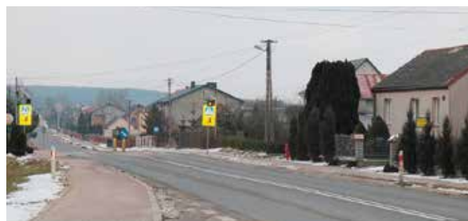
1450 opraw świetlnych zostanie wymienionych w Gminie Chęciny na ledowe

Lada dzień na terenie Gminy i Miasta Chęciny ruszą prace związane z wymianą aż 1450 istniejących opraw z sodowymi źródłami światła na energooszczędne oświetlenie LED. Umowa z wykonawcą już jest podpisana. Na realizację zadania władze gminy pozyskały aż 85 procent unijnego dofinansowania. Inwestycja pozwoli w przyszłości zaoszczędzić do 40% ponoszonych na energię elektryczną kosztów.