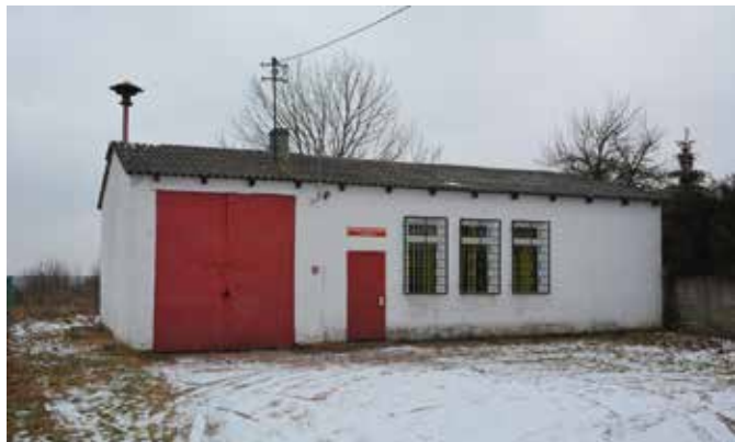
Stary, zniszczony budynek OSP w Radkowicach

Budynek wielofunkcyjny mieszczący remizę OSP w Radkowicach powstanie na działce należącej do gminy. Wolnostojący obiekt o powierzchni użytkowej 244 metrów kwadratowych będzie miał dwie kondygnacje. W części będzie on jednokondygnacyjny, niepodpiwniczony, z poddaszem nieużytkowym i dwuspadowym dachem. Dla potrzeb remizy na parterze prze-