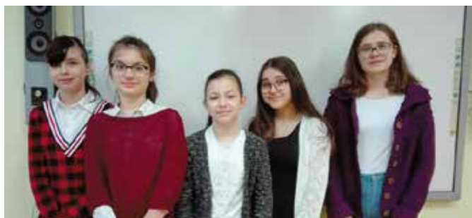
Pięć uczennic ze SP w Tokarni wzięło udział w I Wojewódzkim Konkursie Języka Polskiego dla szkół podstawowych

W listopadzie, w starym jeszcze roku odbył się pierwszy etap Konkursu Języka Polskiego organizowanego przez Świętokrzyskiego Kuratora Oświaty.