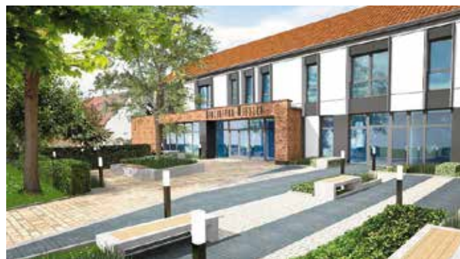
Jest już wizualizacja zagospodarowania budynku po byłym SKR na siedzibę domu seniora i bibliotekę

Opracowana została już koncepcja wizualna zagospodarowania dawnego budynku Spółdzielni Kółek Rolniczych w Chęcinach. Władze Gminy zamierzają przeznaczyć budynek między innymi pod bibliotekę i dom seniora. Powstanie nowoczesnego i energooszczędnego obiektu planowane jest w ramach realizacji etapu drugiego rewitalizacji zabytkowego centrum Chęciny. Koszt realizacji inwestycji oszacowano na około 3 miliony złotych.