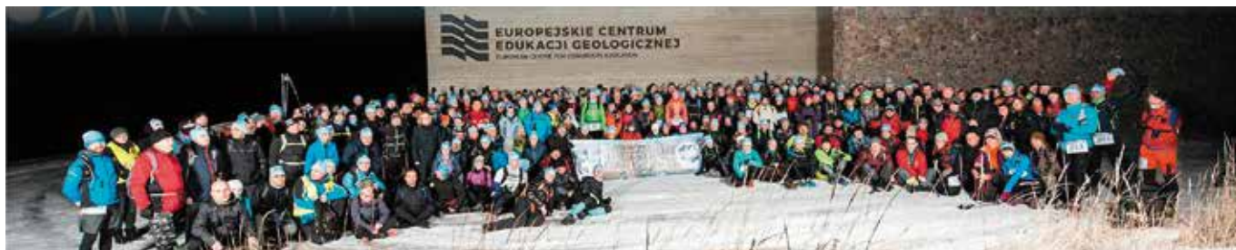
Czterystu zawodników, z czternastu województw wzięło udział w II Zimowym Maratonie Świętokrzyskim na terenie Gminy Chęciny