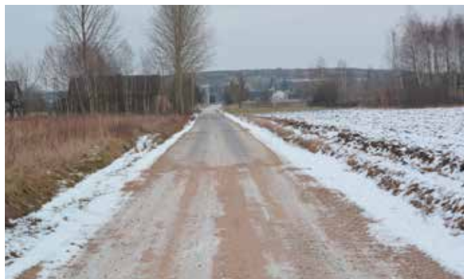
Drogę z Łukowej do Lelusina czeka remont