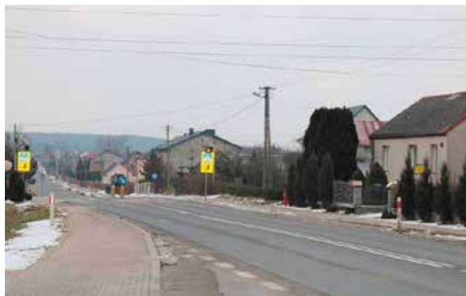
Nowe oświetlenie z systemem led będzie dawało nie tylko więcej światła, ale będzie również bardziej oszczędne

Podstawowa modernizacja systemu oświetlenia ulicznego w Gminie Chęciny będzie polegać na wymianie istniejących opraw z sodowymi źródłami światła na energooszczędne ledowe, dzięki czemu nastąpi istotne zmniejszenie emisji zanieczyszczeń, wynikających z produkcji energii elektrycznej oraz ograniczenie zużycia paliw pierwotnych. Oprawy tego typu pozwalają na uzyskanie znacznie większej ilości światła przy