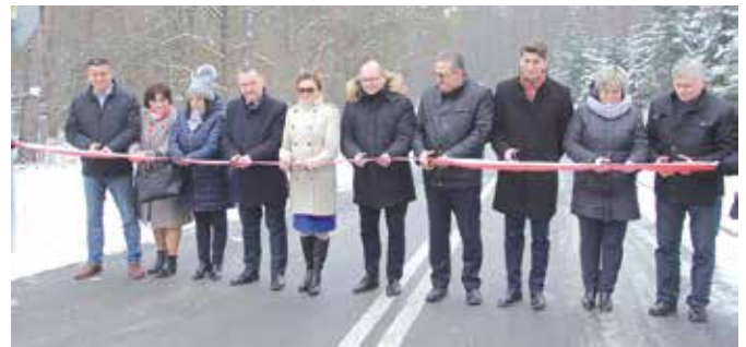
Uroczyste przecięcie wstęgi na drodze w kierunku ulicy Dobrzączka

Jest już nie tylko nowa droga, ale też chodniki i ścieżka rowerowa – właśnie oddano do użytku kompleksowo rozbudowaną ulicę Dobrzączka w Czerwonej Górze. Inwestycja za niebagatelną kwotę ponad 1,6 miliona złotych została zrealizowana przy 50% wkładzie Gminy Chęciny i rządowemu dofinansowaniu.