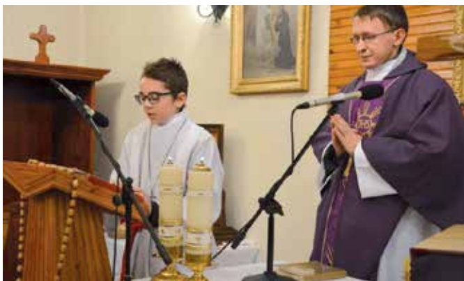
Msza Święta w intencji ludzi pracujących w branży górniczej