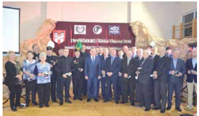
Pamiątkowe zdjęcie podczas uroczystości barbórkowej w Miedziance