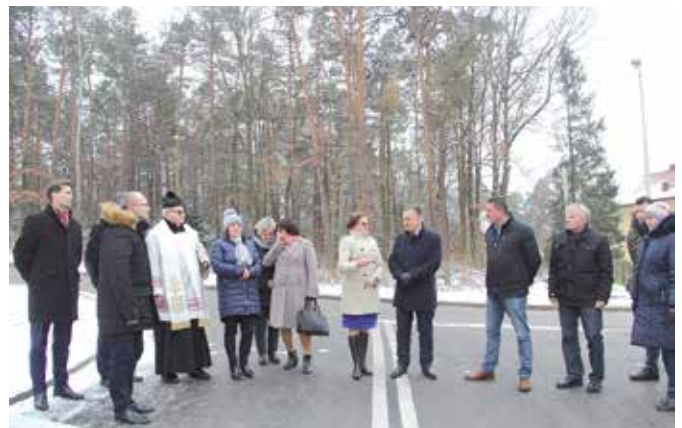
Droga łącząca ul. Czerwona Góra z ul. Dobrzączka została kompleksowo przebudowana