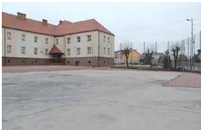
Szkoła w Chęcinach czeka na nowe boisko

Wszystko wskazuje na to, że już pod koniec roku uczniowie Szkoły Podstawowej w Chęcinach będą mogli korzystać z nowoczesnego boiska i bieżni do skoku w dal. Całkowita przebudowa obiektu będzie możliwa dzięki do-