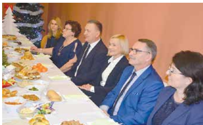
Spotkanie opłatkowe Chęcińskiego Uniwersytetu Trzeciego Wieku

Nie ma wigilijnego spotkania bez łamania się opłatkiem. Wszyscy wszystkim składali życzenia. Najczęściej padające słowa to: pomyślności, radości, za-