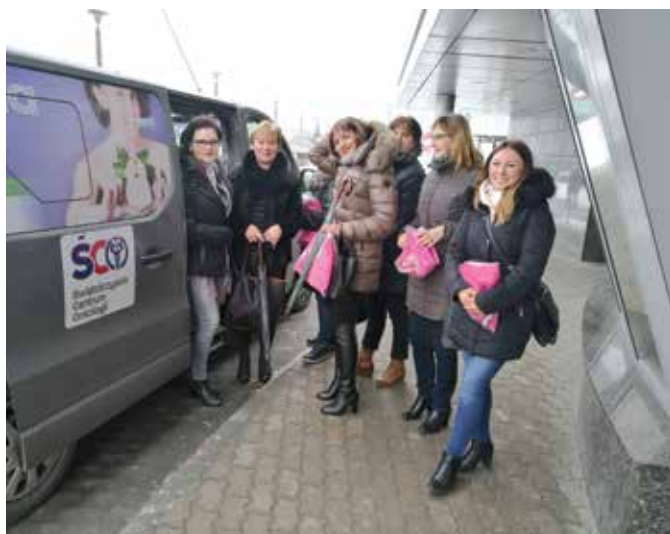
Świętokrzyskie Centrum Onkologii dysponuje własnym samochodem, którym bezpłatnie przywozi panie na badania profilaktyczne i odwozi do miejsca zamieszkania/pracy.

Cytologia zwana inaczej wymazem z szyjki macicy jest podstawowym i najczęściej wykonywanym u kobiet badaniem profilaktycznym – wyjaśnia doktor Leszek Smorąg.