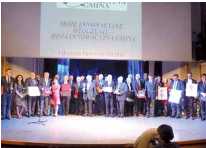
I miejsce i tytuł „Innowacyjnej Gminy” powędrował do Chęcin

W wojewódzkim konkursie „Moje Innowacyjne Otoczenie – Moja Innowacyjna Gmina” pierwsze miejsce i tytuł „Innowacyjna Gmina Województwa Świętokrzyskiego 2018” otrzymała Gmina i Miasta Chęciny za całokształt działań w obszarze rozwoju oświaty. Tym samym chęciński samorząd uznany został „Gminą kształtującą kluczowe kompetencje”. Natomiast laureatem Świętokrzyskiej Nagrody Jakości w kategorii „Organizacje publiczne ochrona zdrowia” został szpital w Czerwonej Górze.