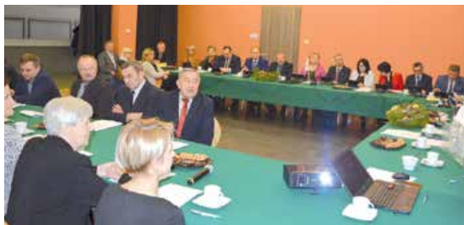
Radni przyjęli budżet na 2019 rok

- Konstruując budżet skupialiśmy się na potrzebach mieszkańców, których głos przekazany został za pośrednictwem sołtysów i radnych. Wspólnie przyjęliśmy dalsze kierunki rozwoju. Zależało nam na tym, aby budżet był zrównoważony. Znalazły się w nim nie tylko te duże zadania realizowane z pomocą pozyskanych środków zewnętrznych, ale również mniejsze inwestycje. Wodociąg powstanie między innymi w miejscowości Miedzianka, co pozwoli na korzystanie mieszkańców tej części gminy z wody z innego ujęcia – wymienia burmistrz, Robert Jaworski i dodaje, że sporo zmian czeka także placówki oświatowe. - Planujemy kapitalną termomodernizację szkoły w Wolicy. Chcemy też wybudować świetlicę w Lipowicy. Powstaną również nowe obiekty sportowe przy szkołach w Chęcinach i Korzecku. Będziemy także projektować nowe sale sportowe w szkołach, kolejne odcinki kanalizacji oraz budować nowe drogi i chodniki. - Od lat podchodzimy do rozwoju naszej gminy stawiając duży nacisk na wsparcie środków zewnętrznych. Tak będzie i tym razem. Na szereg inwestycji, albo już mamy, albo będziemy chcieli pozyskać kolejne dofinansowania unijne i rządowe – mówi burmistrz, Robert Jaworski, dziękując wszystkim radnym za roztropność i mądrość w podejmowaniu ważnych dla gminy decyzji. - Ten budżet ma służyć przede wszystkim mieszkańcom naszej gminy – zaznacza.