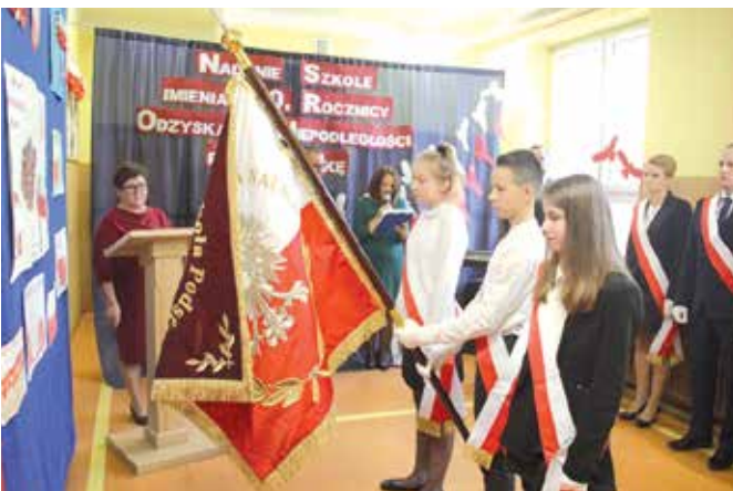
Szkoła w Korzecku ma już nowy sztandar

Szkoła Podstawowa w Korzecku ma już swojego patrona. Społeczność szkolna wzięła udział w uroczystościach nadania imienia placówce, a także poświęcenia i przekazania sztandaru. Teraz będzie nosić imię 100 Rocznicy Odzyskania Niepodległości przez Polskę.