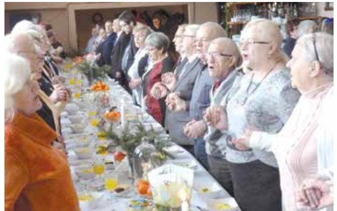
Wspólne kolędowanie podczas spotkania opłatkowego