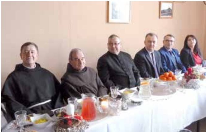
Duchowni, Burmistrz oraz Radni podczas spotkania z osobami starszymi i samotnymi