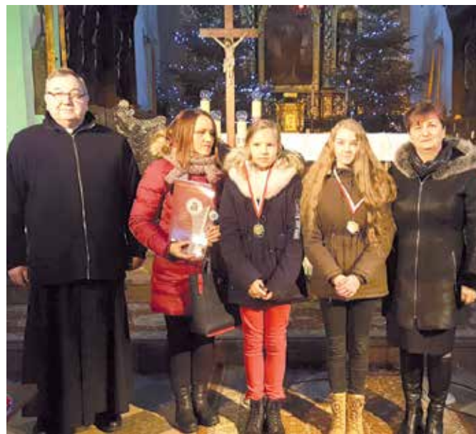
W kościele parafialnym w Chęcinach odbył się coroczny koncert kołęd