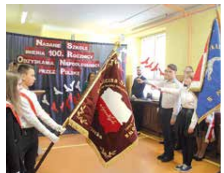
Uroczystość nadania Szkole w Korzecku imienia i sztandaru