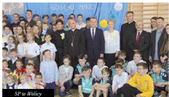
SP w Wolicy