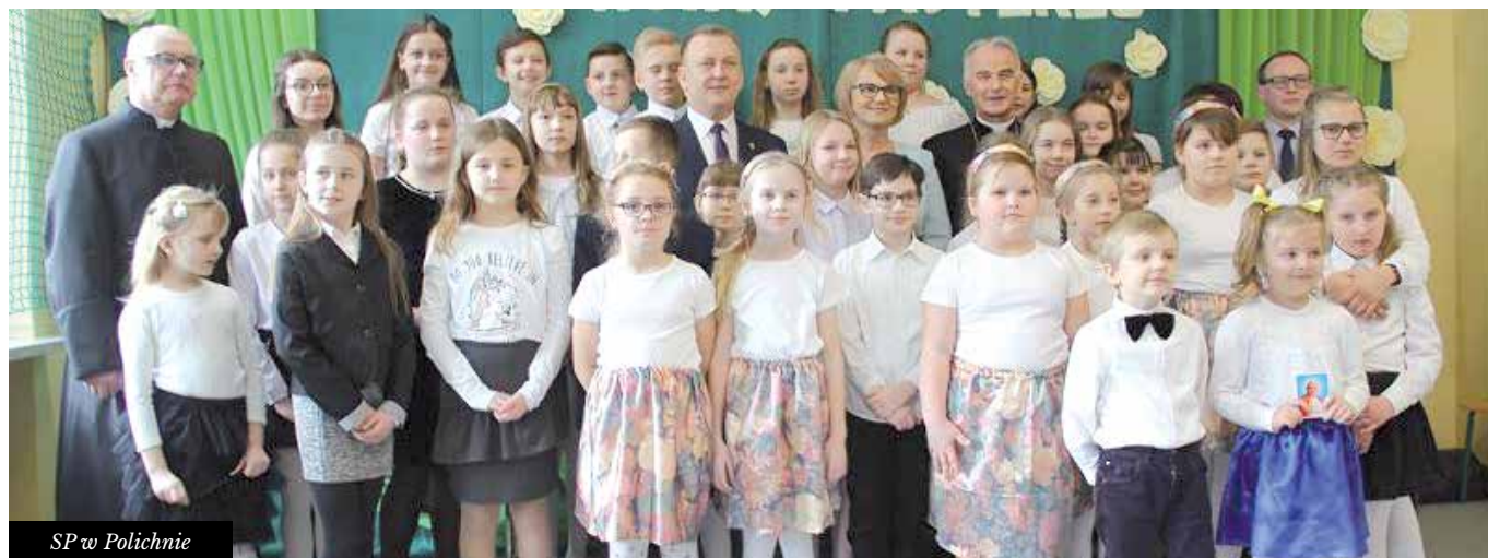
SP w Polichnie