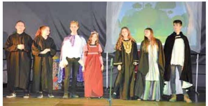
Najstarsza grupa przedstawiła pełen humoru spektakl „Eliksir starości”