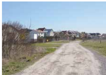
Przy nowej drodze powstanie chodnik i ścieżka rowerowa