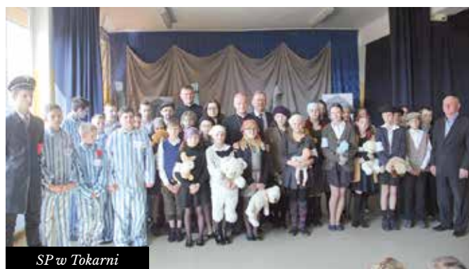
SP w Tokarni