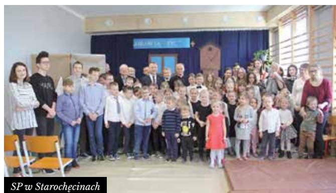
SP w Starochęcinach