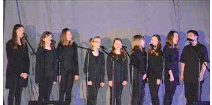
Oprawę muzyczną w sztuce „Eliksir Starości” zapewniło Studio Piosenki z Chęcini