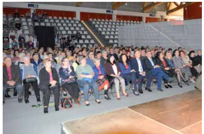
Na spotkanie z aktorem przybyło wielu mieszkańców i gości