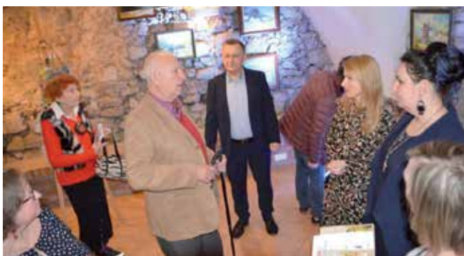
Artysta chętnie dzielił się z uczestnikami opowieściami o swoim malarstwie