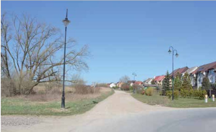
Niebawem Al. Marszałka J. Piłsudskiego zyska nową nawierzchnię

Ogłoszono przetarg na budowę Alei Marszałka Piłsudskiego w Chęcinach. Droga łącząca Aleję Partyzantów ze skrzyżowaniem ulicy Kieleckiej i Białego Zagłębia zyska nie tylko nową nawierzchnię. Będzie też chodnik, ścieżka rowerowa i zatoki autobusowe, a wszystko to oczywiście oświetlone. Na realizację inwestycji władze gminy złożyły wniosek o rządowe dofinansowanie. Wszystkie prace mają zakończyć się jeszcze pod koniec bieżącego roku.