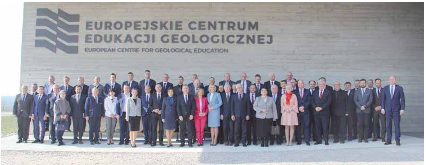
Prezydenci miast, burmistrzowie i wójtowie obradowali w Chęcinach