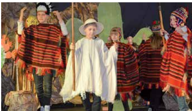
„Dzieci Sanczeza” to sztuka, która ukazała walkę dobra ze złem