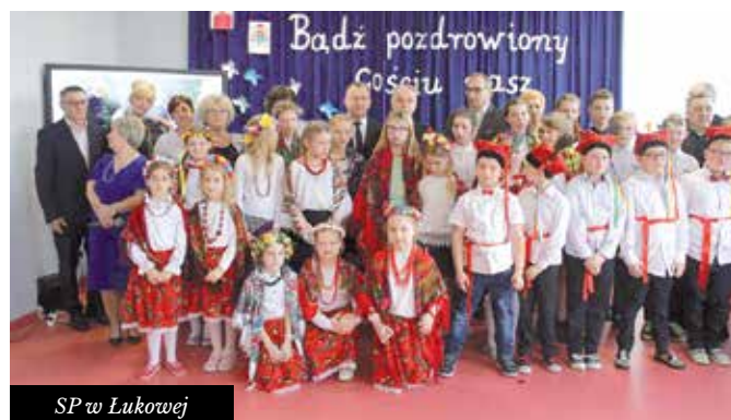
SP w Łukowej