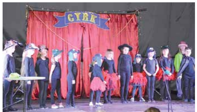
Najmłodsi przedstawili sztukę „Cyrk”