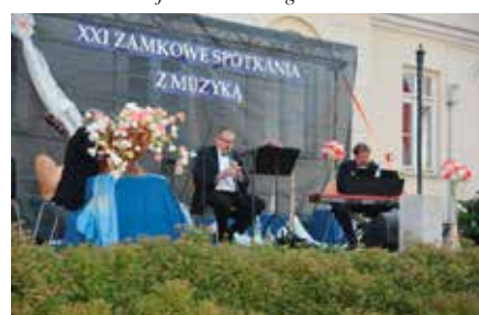
XXI Zamkowe Spotkania z Muzyką