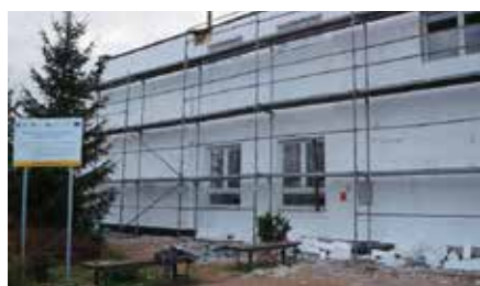
Remont Szkoły w Starohecinach