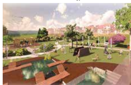
Wizualizacja Parku Miejskiego