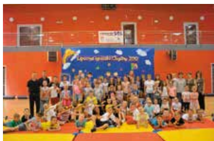
Wakacje z CKiS