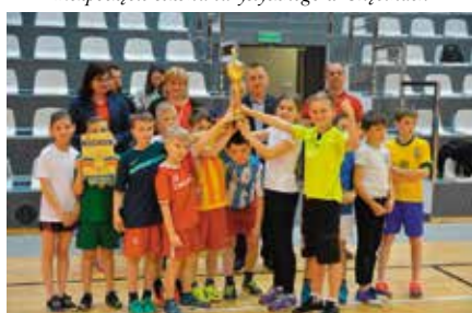
Turniej dziecięcej piłki ręcznej