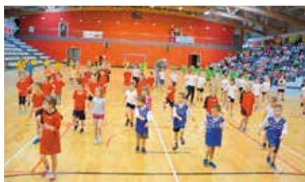
Chęcińskie Igrzyska Gier i Zabaw Ruchowych dla Dzieci Puchar Burmistrza Gminy i Miasta Chęciny