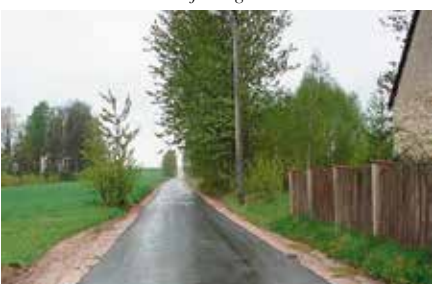
Nowy odcinek drogi w Łukowej