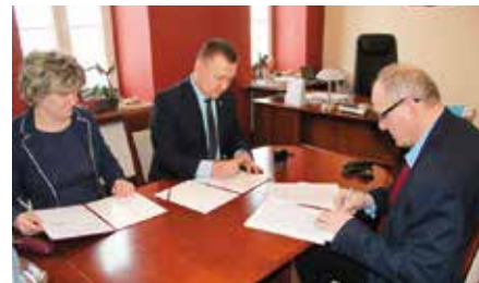
Umowa na kanalizację w Skibach