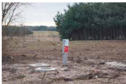
Budowa wodociągu w Łukowej