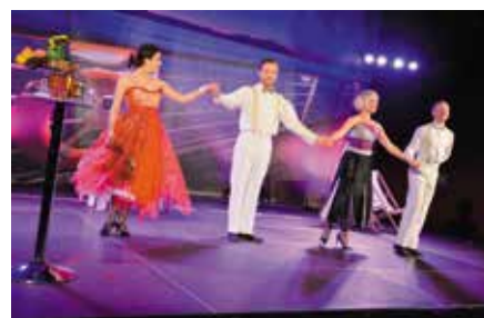
Operetka Statek Casablanca