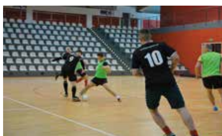
Noworoczny Turniej Futsalu