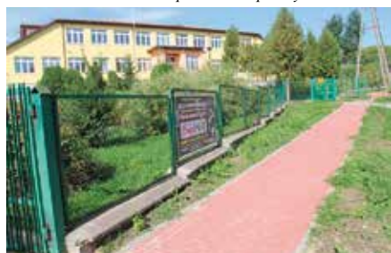
Budowa chodnika w Bolminie