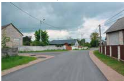
Modernizacja drogi w Ostrowie