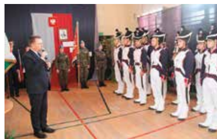
150. Rocznica urodzin Józefa Piłsudskiego