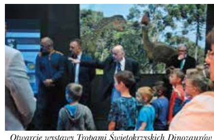
Otwarcie wystawy Tropami Świętokrzyskich Dinozaurów w Miedziance