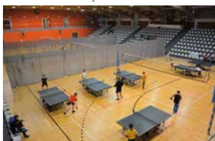
Turnieje Tenisa Stołowego