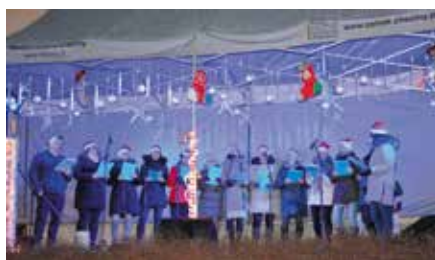
Wspólne Koładowanie na Rynku