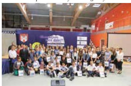
Projekt gimnazjum i co dalej