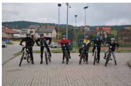
Utworzenie Szkołki Kolarskiej