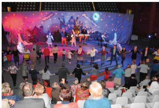
Zespół „Wesoła Biesiada” porwał publiczność do tańca