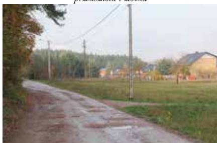
Pozyskane dofinansowanie na budowę ul. Dobrzyczka