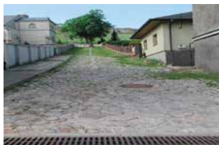
Zdobyte środki na szlak śladami Króla Łokietka