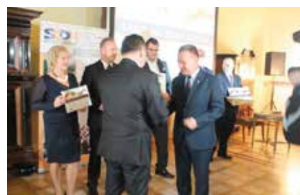
Laur Michała Anioła