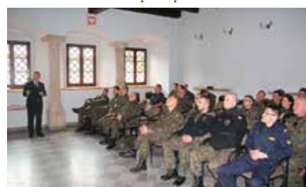
XXXIV międzynarodowy kurs obserwatorów wojskowych ONZ w Niemczówce