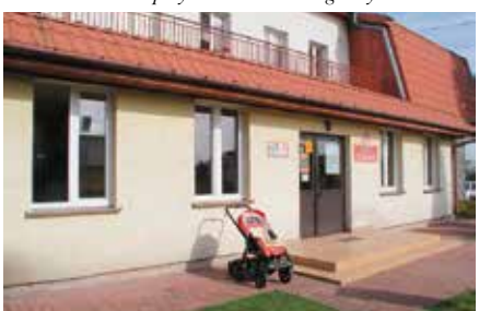
Wymiana okien w Radkowicach