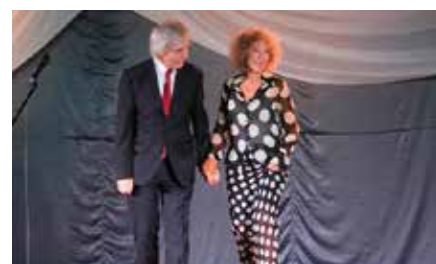
Koncert Alicji Majewskiej i Włodzimierza Korcza