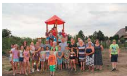
Plac Zabaw w Malej Tokarni