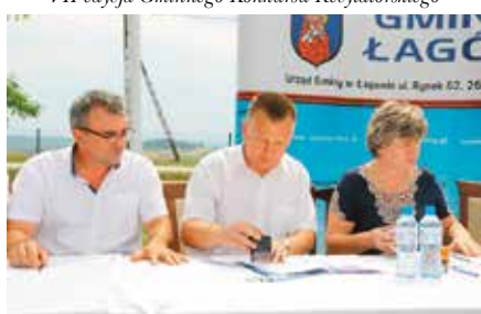
Podpisanie Umowy na małe granty