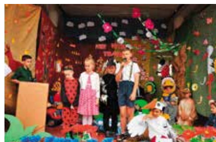
Dni Otwarte w Wolicy