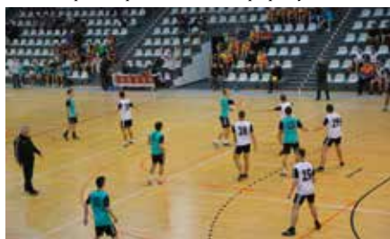
Vive Serce Dzieciom