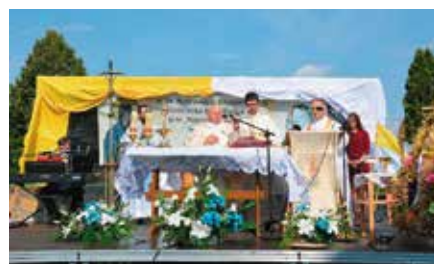
400-lecie Parafii i Odsłonięcie tablicy upamiętniającej pobyt Karola Wojtyły w Bolminie