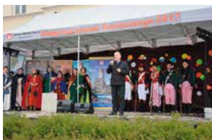
Rozpoczęcie sezonu turystycznego w Chęcinach