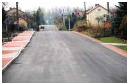
Budowa chodnika w Lipowicy