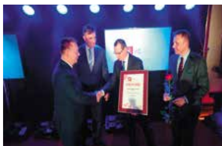
Certyfikat dla Zamku w Chęcinach