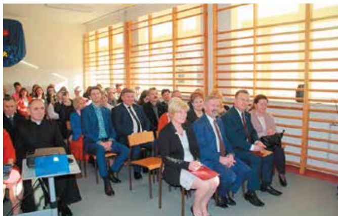
W uroczystości wzięło udział wielu gości, a młodzież przygotowała specjalny program artystyczny