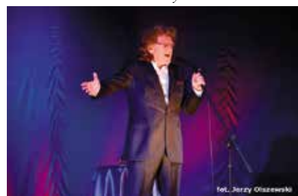
Koncert Zbigniewa Wodeckiego