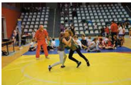
Pierwszy krok w zapasach