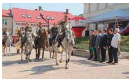
Marsz Szlakiem I Kompanii Kadrowej