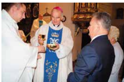
40-lecie Cukirni Państwa Ramiączek