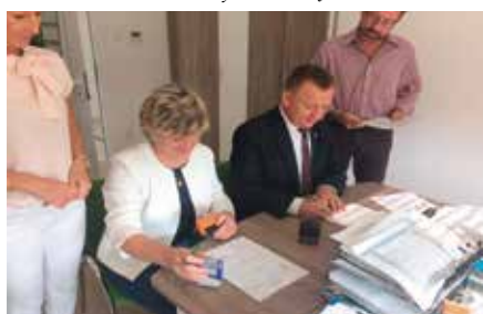
Podpisanie umowy na odbiór azbestu z terenu gminy