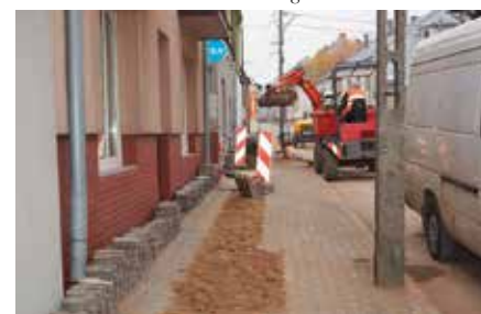
Gazyfikacja Gminy Chęciny