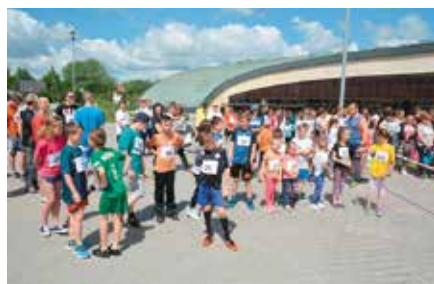
Bieg Uliczkami Chęciny