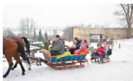
Ferie Zimowe z CKiS