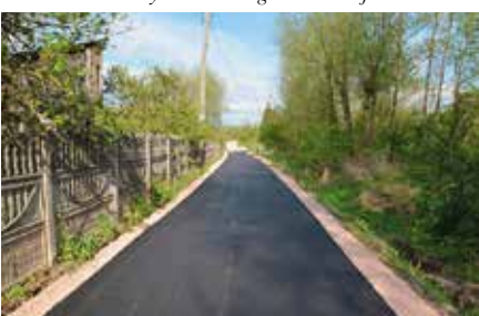
Remont ulicy Kieleckiej