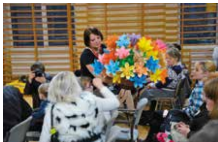
Dzień Kobiet w Miedziance