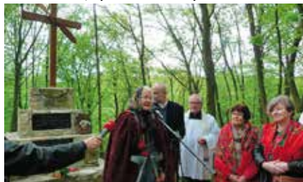
Poświęcono pomnik upamiętniający Śp. por. Kazimierza Brauna