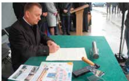
Podpisanie Aktu Erekcyjnego pod budowę przedszkola i żłobka