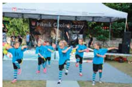
Piknik Górnicy w Miedziance