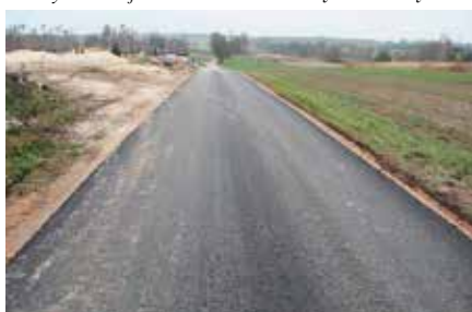
Remont drogi w Radkowicach