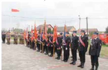
Gminny Dzień Strazaka