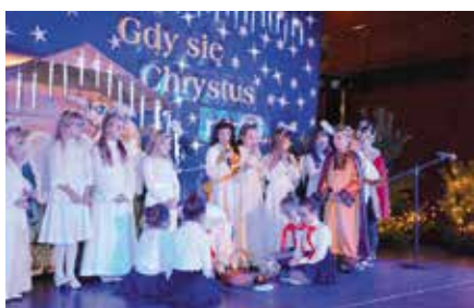
XXII Gminny Przegląd Widowisk Jasełkowych