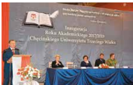
Inauguracja II-go Roku Akademickiego CHUTW