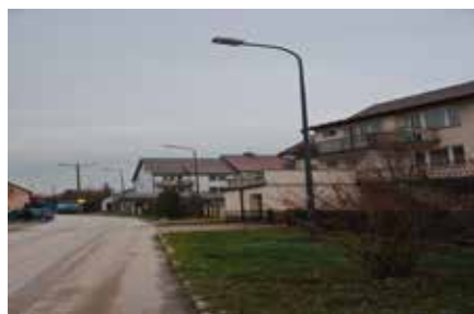
Budowa Oświetlenia na Os. Północ I etap