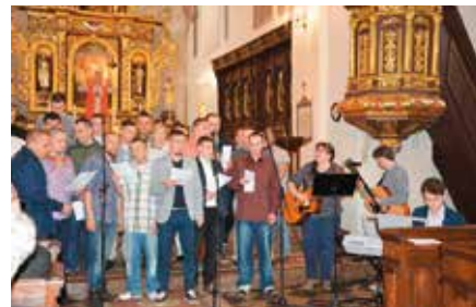
Koncert Pieśni Maryjnych