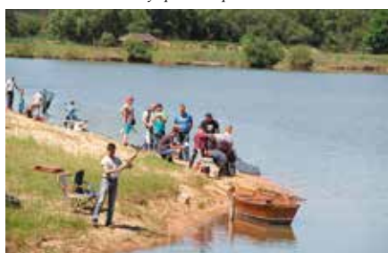
Zawody wędkarskie dla dzieci z okazji DNIA DZIECKA