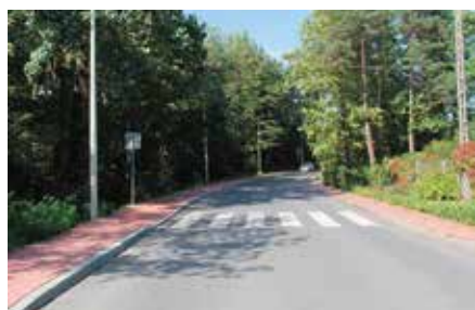
Remont drogi w Czerwonej Górze