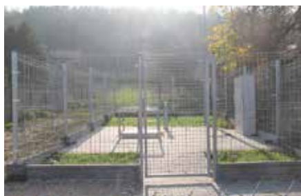
Przepompownia wody w Chęcinach