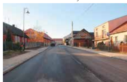
Kompleksowy remont ulicy Kieleckiej