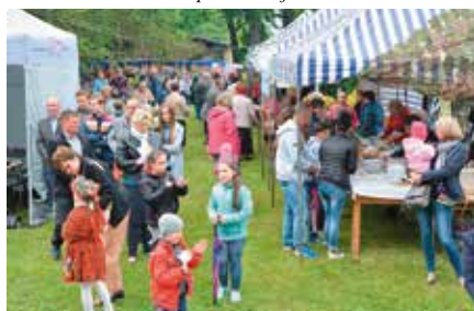
Festyn w Siedlcach