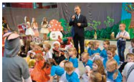
Gminny Dzień Przedszkolaka