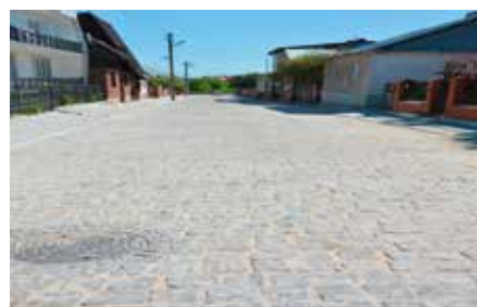
Przebudowa ulicy 14 Stycznia