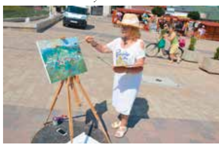
II Międzynarodowe Plenery Malarskie