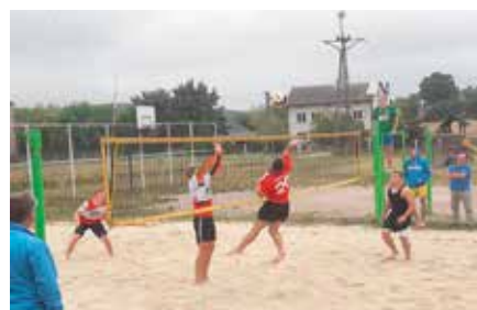
Turniej Piłkowej Siatkowej