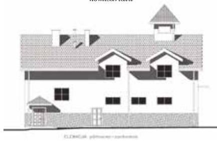
Opracowanie projektu remizy w Radkowicach i uzyskanie pozwolenia na budowę