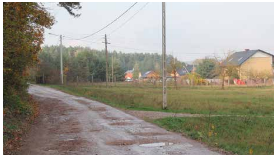
Planowana jest budowa ulicy Dobrzączka