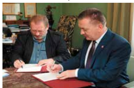
Podpisanie porozumienia o współpracy z ASP