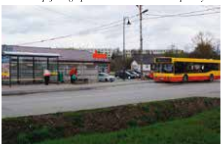
Nowe przystanki na terenie gminy