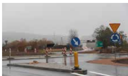
Nowe rondo w Chęcinach