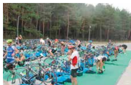
Zawody Triathlonowe w Chęcinach