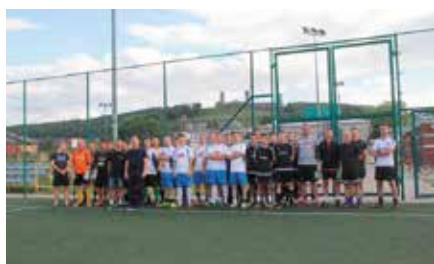
Nocny Turniej Piłki Nożnej