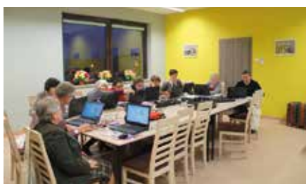
Zajęcia Latającej Akademii Cyfrowej