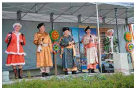
Koncert Biesiada Sarmacka