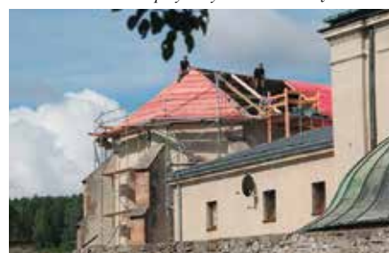
Remont dachu na Klasztorze Ojców Franciszkanów