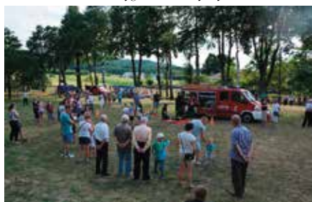
Festyn w Korzecku