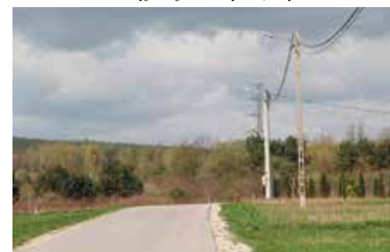
Nowe oświetlenie przy ulicy Sitkówka w Chęcinach