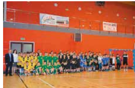
Mini Volley Cup1