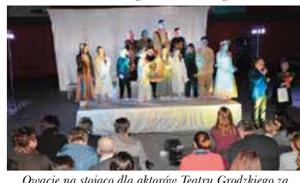
Owacje na stojąco dla aktorów Teatru Grodzkiego za Balladynę