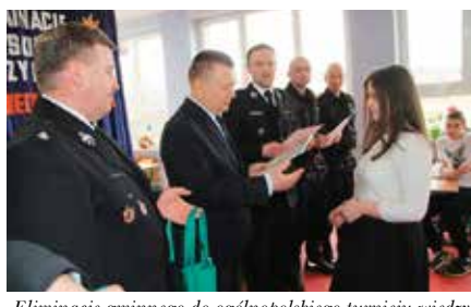
Eliminacje gminnego do ogólnopolskiego turnieju wiedzy pożarniczej