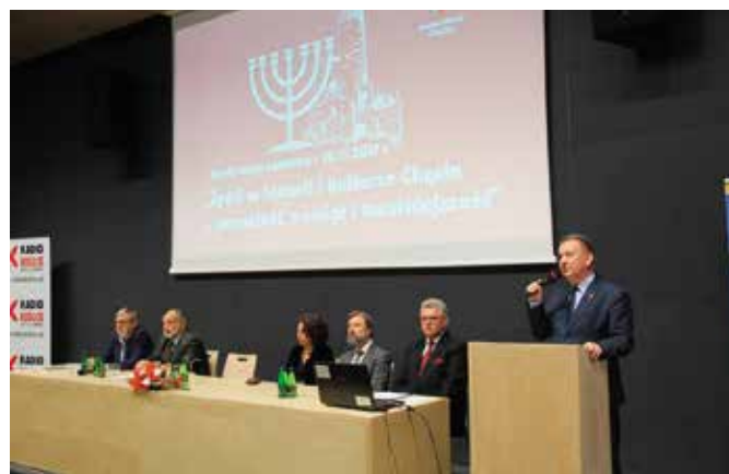
Konferencja naukowa rozpoczęła wydarzenie „Nasi sąsiedzi Żydzi”