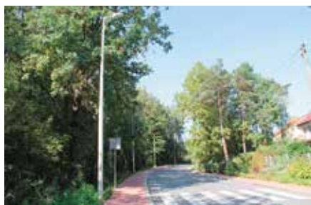
Budowa oświetlenia przy ul. Czerwona Góra