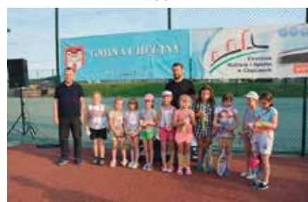
Turniej Tenisa Ziarnego dla Dzieci