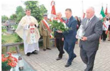
73. rocznica pacyfikacji Wolicy