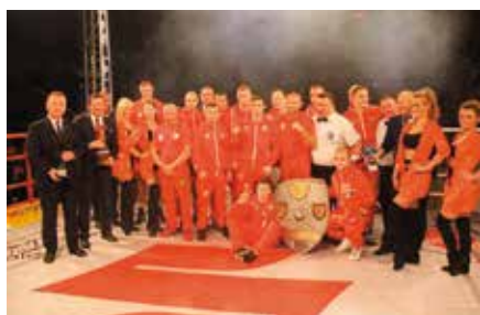
Mecz bokserski Polska - Irlandia w Chęcinach