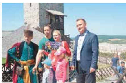
Półmilionowa turystyka na Zamku w Chęcinach