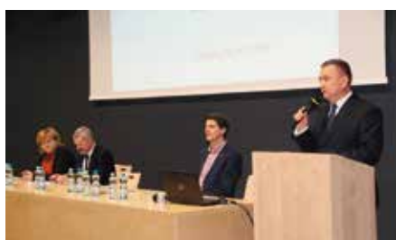
IV Forum Oświaty Gminy Chęciny