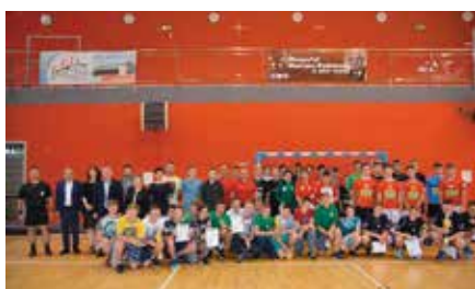
II Memoriał Mariana Budziosa w piłce ręcznej