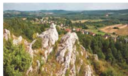
Pozyskane środki na trasy turystyczne w Miedziance