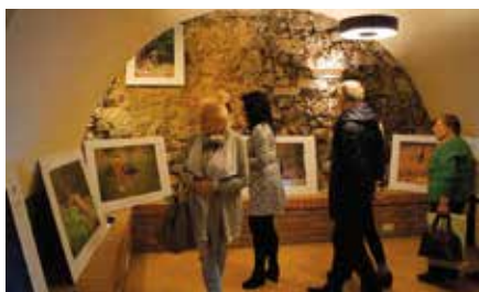
Wystawa fotografii przyrodniczej w Niemczówce