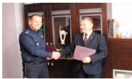
Podpisanie umowy na przekazanie działki pod budowę komisariatu