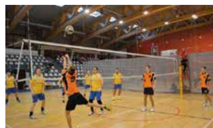
Andrzejkowy Turniej Siatkowy