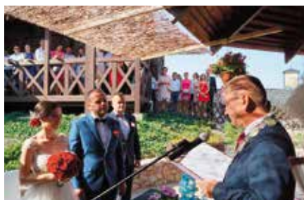
Pierwszy Ślub na Zamku