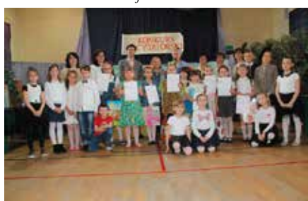
VII edycja Gminnego Konkursu Recytatorskiego