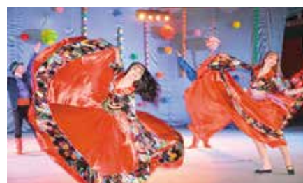
Zespół Folkowy Czeremszyna z Ukrainy