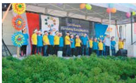
Dni Otwarte Funduszy Europejskich