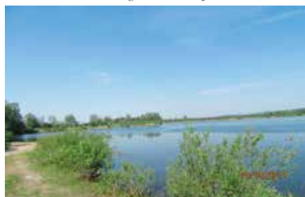
Koncepcja zagospodarowania Zalewu w Lipowicy