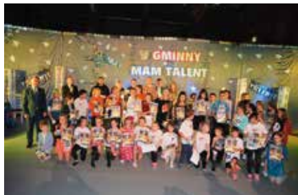
V Gminny Mam Talent