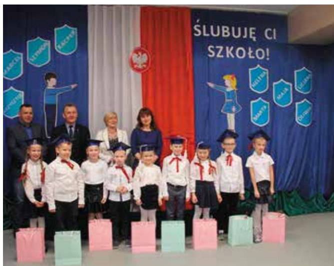
Pierwszaki z Bolmina ślubowały w nowo wyremontowanej szkole

Grono pedagogiczne wraz z Dyrekcją Szkoły oraz Radą Rodziców, aby stworzyć uczniom większe możliwości rozwoju, utworzyła klasę dwujęzyczną z językiem angielskim. Oddział ten pozwoli uczniom doskonale przygotować się do aktualnych potrzeb rynku pracy i współpracy międzynarodowej. Nauka