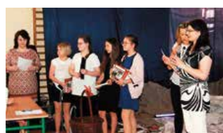
Magiczne Podróże po Literaturze