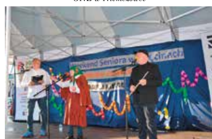
Weekend Seniora w Chęcinach