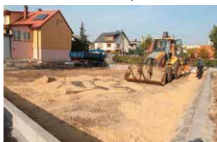
Utwardzenie placu przy szkole w Chęcinach