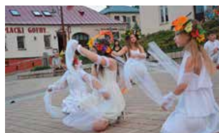
Noc Świętojańska - powitanie lata