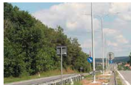
Oświetlenie przy drodze na Panku