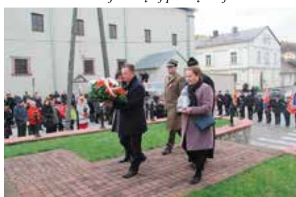
Uroczystości 11-go Listopada