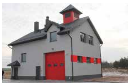
Wybudowanie remizy w Ostrowie