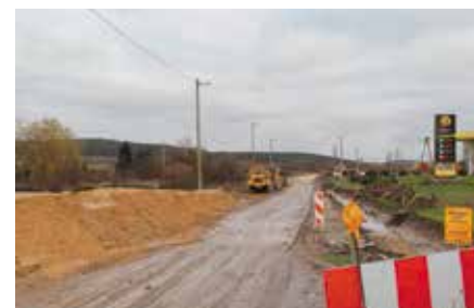
Przebudowa drogi 762