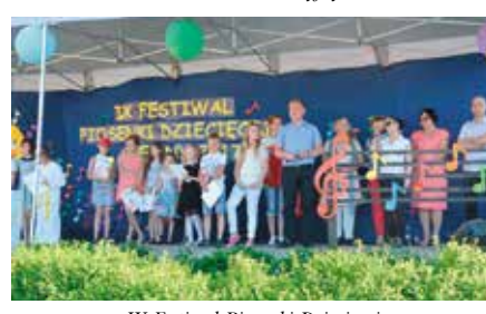
IX Festiwal Piosenki Dziecięcej