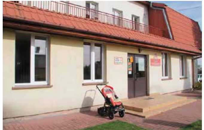
Nowe okna z pewnością zabezpieczą przed utratą ciepła w budynku