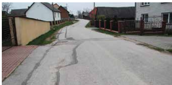
Droga w Skibach wymaga już remontu