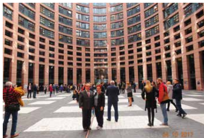
Strasburg. Dzielnica Parlamentu Europejskiego

ś drobiazgowej kontroli. Chcąc pokreślić nasze pochodzenie, na terenie Europarlamentu prezentowaliśmy chustę z logo Chęcińskiego Uniwersytetu Trzeciego Wieku.