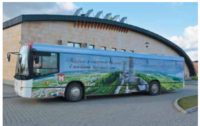
Efektowna reklama Zamku skupia uwagę podróżnych

ale i Zamku. Adres strony został zamieszczony na autobusie reklamującym Zamek. Warto tu zaglądać i czytać o wprowadzonych najnowszych atrakcjach, czy nadchodzących wydarzeniach. Myślę, że „jeżdżąca” reklama będzie o tym doskonale przypominać – przekonuje Burmistrz, Robert Jaworski.