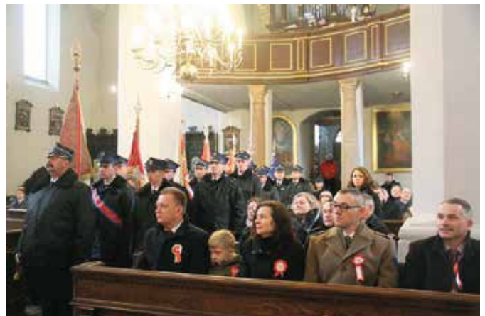
W uroczystości wzięli udział samorządowcy, przedstawiciele CIMIC, poczty sztandarowe OSP, szkół z terenu gminy, Byłych Żołnierzy i Wojsk Powietrzno-Desantowych, zaproszeni goście oraz mieszkańcy