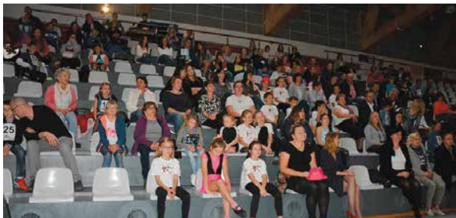
Publiczność dopingowała artystów z terenu naszej gminy