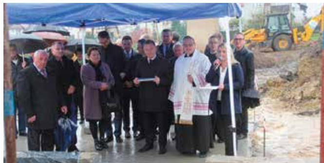
W uroczystości wzięli udział duchowni, samorządowcy z województwa, powiatu, gminy, przedstawiciele oświaty oraz mieszkańcy