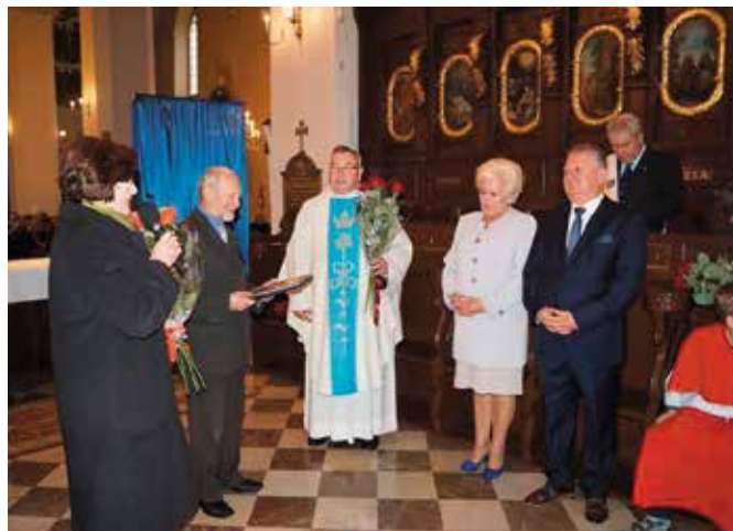
40-lecie działalności było doskonałą okazją do złożenia życzeń i gratulacji