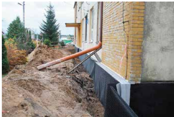
Szkoła w Starochęcinach podczas remontu

W ramach kompleksowej termomodernizacji budynku ocieplone zostaną ściany i stropodach wraz z wymianą pokry-