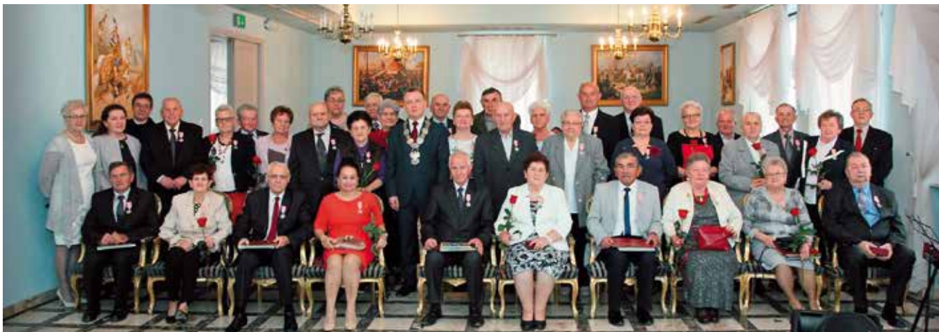
Pamiątkowe zdjęcie z Jubileuszu 50-lecia pożycia małżeńskiego