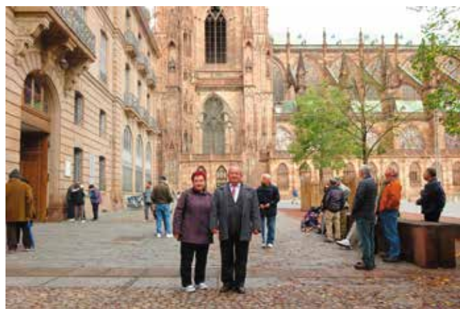
Strasburg. Katedra Notre Dame

tych budynków (szkło, aluminium, flagi państw członkowskich UE) zrobiły na wszystkich ogromne wrażenie. Aby dostać się do wnętrza, ze względów bezpieczeństwa wszyscy poddawani