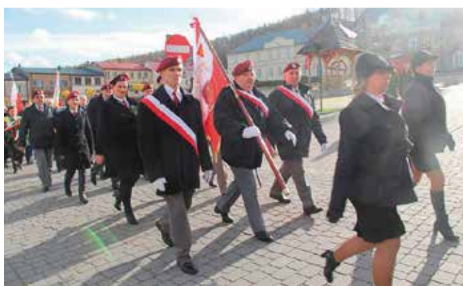
Po Mszy Św. odbył się przemarsz pod Pomniki upamiętniające bohaterów II Wojny Światowej