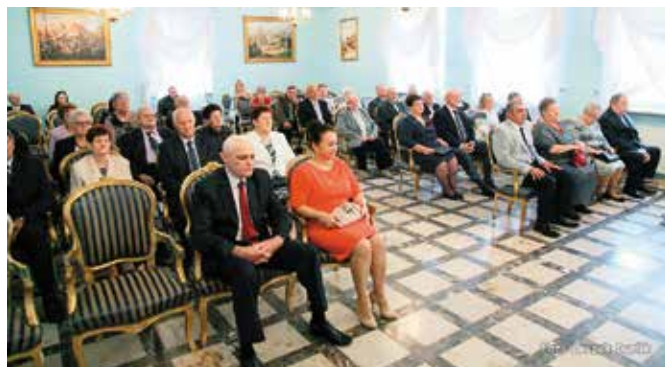
W tym roku „Złote Gody” świętowało w naszej gminie 21 par