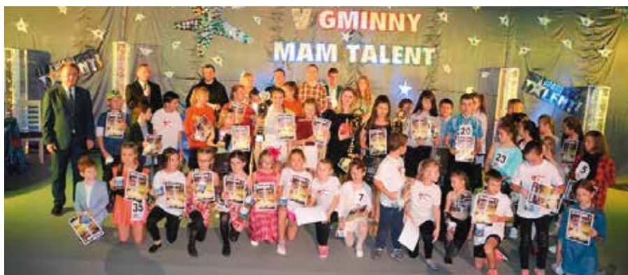
Tegoroczna edycja „Gminnego Mam Talent” była prawdziwą kuźnią talentów

zaprezentować swoje umiejętności taneczne, wokalne, aktorskie, czy każde inne, które można nazwać talentem.