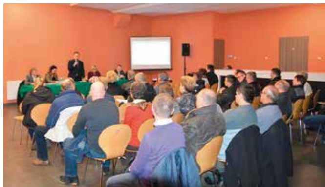
Spotkanie skupiło wielu zainteresowanych inwestycją kanalizacyjną

Projektanci chodzą od domu do domu i ustalają wszystko dokładnie z właścicielami posesji. Jak poinformowali projektanci, każdy z mieszkańców, który podczas ich pierwszej wizyty nie będzie obecny w domu otrzyma informację z kontaktem do biura projektowego. - Wtedy będziemy umawiać się indywidualnie jeszcze raz – zapewniali podczas spotkania projek-