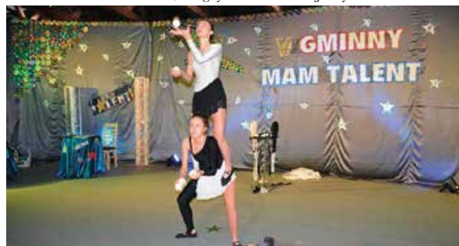
Podczas wydarzenia, poza konkursem, zaprezentowali się również uczniowie ze SP w Tokarni oraz duet żonglerski z MDK w Kielcach