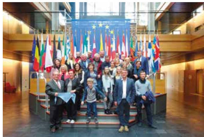
Strasburg. Pamiątkowe zdjęcie z Panem Europosłem Bogdanem Wentą