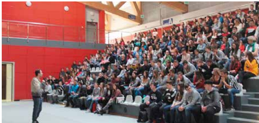
Młodzież z zainteresowaniem słuchała hip-hopowego programu profilaktycznego