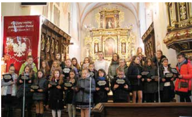
Chór Cantata ze SP w Chęcinach

Po Mszy Świętej, uczestnicy obchodów Święta Niepodległości na czele z władzami Gminy i Miasta Chęciny udali się pod tablicę pamiątkową przy Ratuszu oraz pod pomnik przy ul. Małogoskiej,