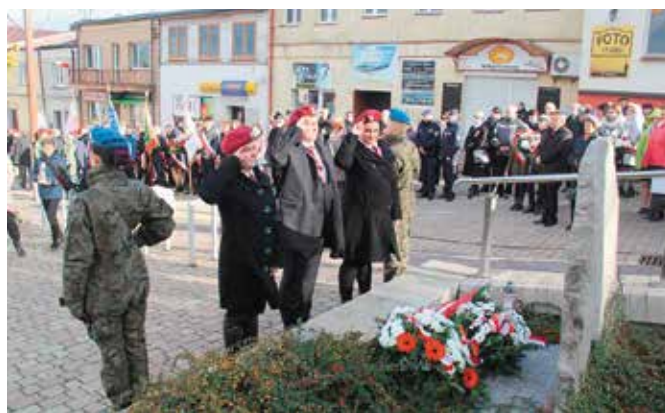
Wiązanki kwiatów złożono również przy Tablicy Pamiątkowej na Placu 2-go Czerwca