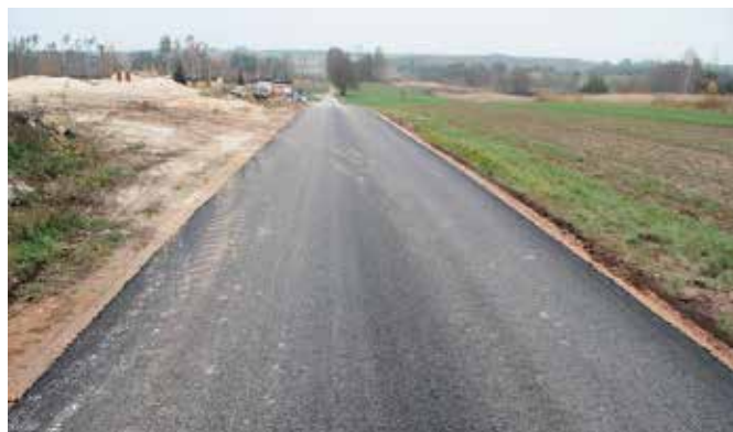
W Radkowicach powstała nowa droga w ramach programu „Drogi do pól”