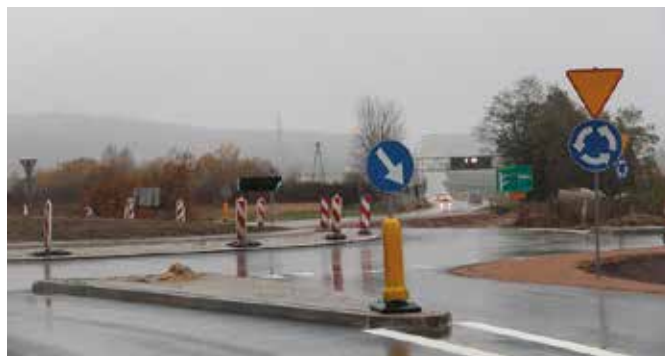
Nowa organizacja ruchu przy wjeździe do Chęcın nie tylko poprawiła estetykę, ale przede wszystkim zwiększyła bezpieczeństwo na drodze

W ramach budowy drogi ekspresowej S7 przy wjeździe do Chęcın właśnie powstało nowe rondo z bezpiecznymi zjazdami. Zgodnie z planami, niebawem powstanie tu także nowe oświetlenie. Przypomnijmy, że inwestycja budowy ronda została wciągnięta do budowy drogi ekspresowej S7 po długich pertraktacjach chęcńskich władz samorządowych z Generalną Dyrekcją Dróg Krajowych i Autostrad. – Jesteśmy dumni, że udało się wciągnąć budowę nowego wjazdu do królewskiego