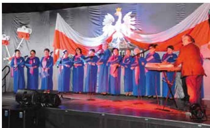
Chór CHUTW w Chęcinach