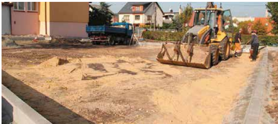
Nowy plac ułatwi parkowanie przy szkole