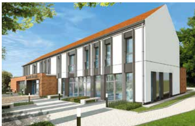
Wizualizacja biblioteki i Domu Seniora

Projekt rewitalizacji Chęciny został podzielony na kilka części. W ramach jednej z nich konstrukcja hali budynku po