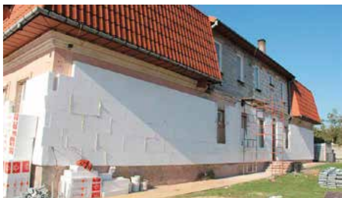
Prace remontowe przy szkole w Radkowicach idą pełną parą

W ramach inwestycji budynek zostanie ocieplony, a ściany fundamentowe zostaną zaizolowane przeciwwilgociowo. Po-