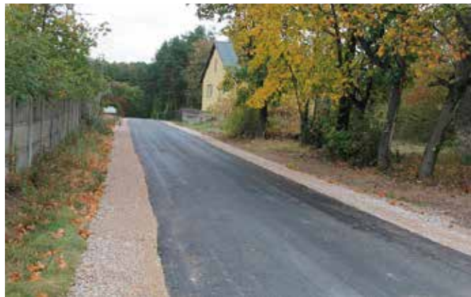
Nowa nawierzchnia i pobocza