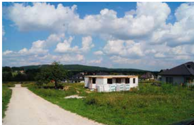
Na terenie gminy przybywa domów i mieszkańców