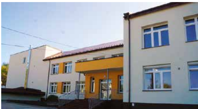
Szkoła w Polichnie po termomodernizacji i kompleksowym remoncie

Po szkole w Bolminie i Starochęcinach przyszedł czas na oddanie do użytku zmodernizowanej szkoły w Polichnie. Modernizacja placówki oświatowej w Polichnie kosztowała prawie 3,5 mln złotych, z czego aż 85 procent dotacji na prace termomodernizacyjne władze Gminy i Miasta Chęciny pozyskały z unijnego dofinansowania.