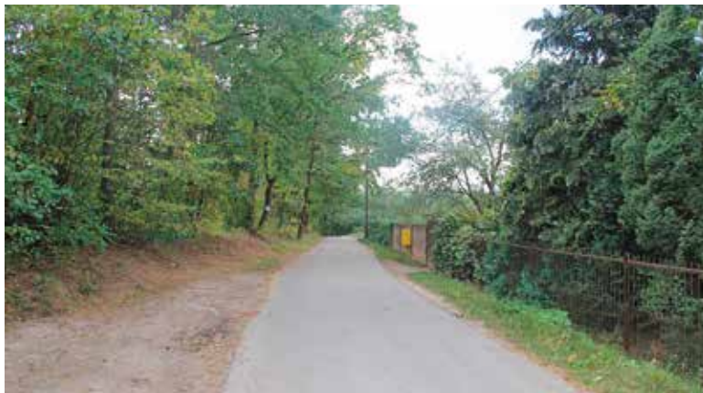
Przy ul. Sitkówka powstanie nowe energooszczędne oświetlenie