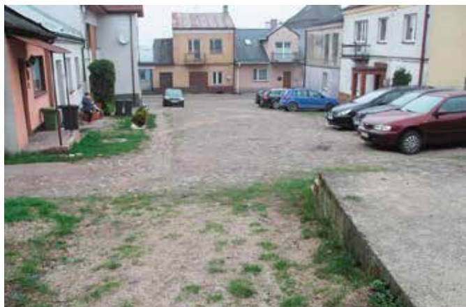
Po rewitalizacji kolejne zakątki miasta będą funkcjonalne i estetyczne

W Chęcínach niemalże każdy zakamarek i każdy kamień ma swoją historię. Podobnie jak wszystkie, nawet te najmniejsze, uliczki i kamienice, pomiędzy którymi są wąskie przejścia. To właśnie ta część miasta niebawem nabierze zupełnie nowego blasku. Na kolejny etap rewitalizacji miasta władze gminy pozyskały blisko 4 miliony 200 tysięcy złotych unijnego dofinansowania. Jednym z wielu elementów projektu jest rewitalizacja chęcínskich uliczek.