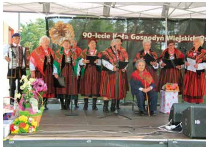
90-lecie KGW i 40-lecie zespołu śpiewaczego „Ostrowianki”

We wrześniu Ostrowianki świętowały aż dwa okrągłe jubileusze – 90-lecie Koła Gospodyń Wiejskich w Ostrowie i 40-lecie Zespołu Ludowego „Ostrowianki”. Z tej okazji Zespół dał wspaniały popis swoich umiejętności wokalnych i muzycznych. Tego dnia wspólnie świętowano także otwarcie zmodernizowanej świetlicy wiejskiej. Przy dużej dawce dobrego humoru i przy dźwiękach ludowej muzyki mieszkańcy bawili się, świętując razem z „Ostrowiankami”.