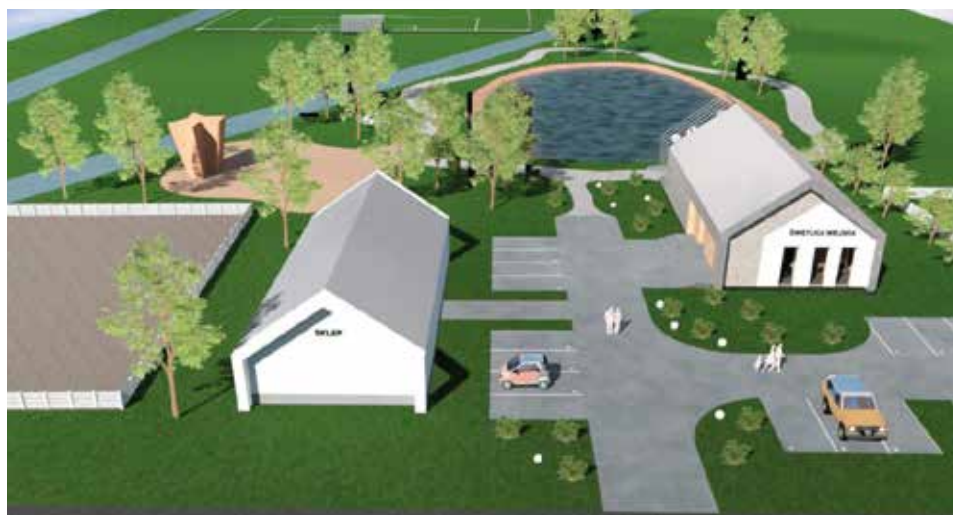
Wizualizacja świetlicy wiejskiej w Lipowicy w gminie Chęciny

aneks kuchenny i pomieszczenie socjalne. Będzie też miejsce na kotłownię. Budynek będzie ogrzewany ekologicznym kondensacyjnym kotłem gazowym. Standard energetyczny budynku będzie spełniał bardzo rygorystyczne normy, które będą obowiązywały od 2021 r. Ocieplenie ścian zewnętrznych, podłogi, stropu i właściwości okien i drzwi będą energooszczędne.