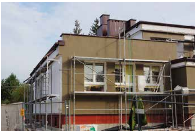
Prace remontowe w szkole w Korzecku