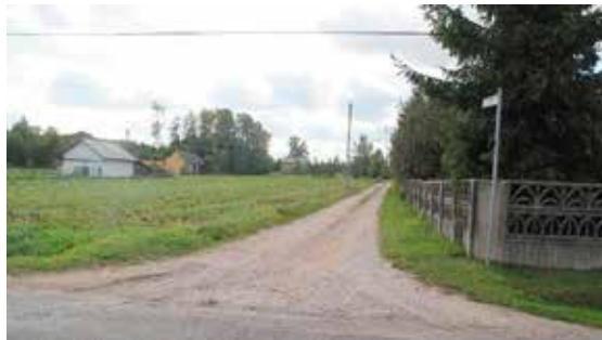
Jest już projekt na budowę tej drogi