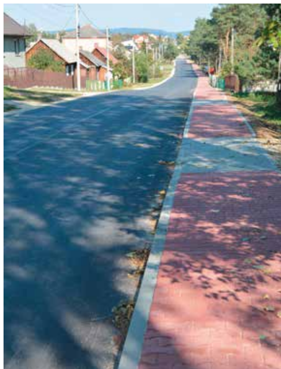
Wraz z nowym chodnikiem położono nowy dywanik asfaltowy na drodze w Lipowicy