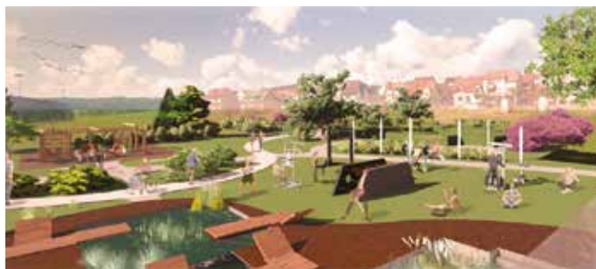
Wizualizacja części Parku Miejskiego w Chęcinach

Park miejski powstanie na blisko dwóch hektarach, zdegradowanego, szpetnego obecnie terenu, usytuowanego w samym centrum Chęciny, będącego jednocześnie łącznikiem pomiędzy Osiedlem Północ a Starym Miastem. Będzie to wyjątkowe miejsce do wypoczynku i rekreacji w otoczeniu pełnym zieleni,