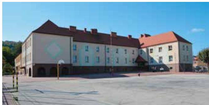
Szkołę w Chęcinach czeka duża metamorfoza

Trwają ostatnie uzgodnienia dotyczące funkcjonalności zakładanych rozwiązań i lada dzień zostanie rozpoczęta procedura wyłonienia wykonawcy prac projektowych. W pierwszej kolejności remont obejmie pierwsze piętro budynku. Zostaną odnowione i przebudowane pomieszczenia istniejące, nastąpi wymiana instalacji elektrycznej, wodno-kanalizacyjnej itp. W kolejnym etapie samorządowcy przewidują rozbudowę budynku szkoły o nowe skrzydło, w którym znajdą się sale dydaktyczne, biblioteka, kuchnia, stolówka, sanitariaty i szatnie. Nowe skrzydło połączy komunikacyjnie istniejący budynek. Ponadto zostanie przebudowana i wyremontowana pozostała część istniejącego budynku. Całość założenia inwestycyjnego ma na celu dostosowanie budynku do oczekiwań i potrzeb społeczności szkolnej.