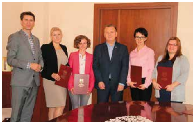
Wręczono akty mianowania dla nauczycieli