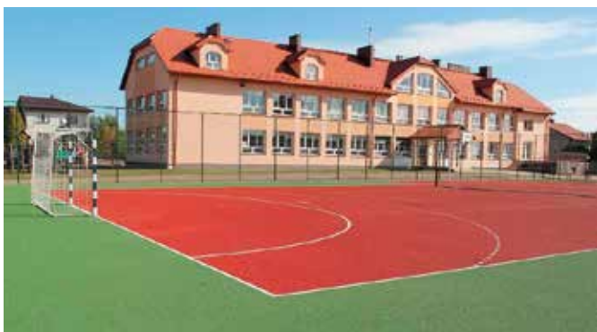
Nowe boisko już cieszy uczniów i mieszkańców w Tokarni

Nowoczesne wielofunkcyjne boisko, które powstało przy Szkole Podstawowej im. Janusza Korczaka w Tokarni zostało uroczystie oddane do użytku w ostatnią sobotę września. Z inwestycji zrealizowanej przez chęciński samorząd mogą cieszyć nie tylko uczniowie placówki, albowiem ma ona służyć również okolicznym mieszkańcom.