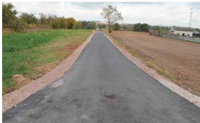
Jest już położony nowy dywanik asfaltowy