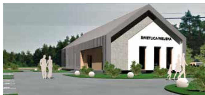
Wizualizacja nowej świetlicy w Lipowicy

To kolejny krok w kierunku rozpoczęcia budowy nowoczesnej świetlicy wiejskiej w Lipowicy w gminie Chęciny. Jednocześnie złożony został wniosek o pół miliona unijnego dofinansowania inwestycji. Aplikowany wniosek zakłada, że prace ruszą w 2019 r.