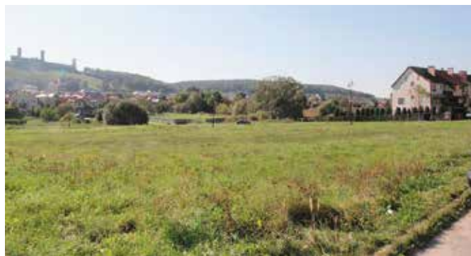
Teren pod budowę Komisariatu Policji w Chęcinach

Zgodnie z założeniami nowy Komisariat ma być nowoczesny i funkcjonalny. Dostosowany nie tylko do liczby pracujących tam funkcjonariuszy i pracowników policji, ale także do potrzeb petentów. Dodatkowo będzie w pełni dostosowany do obsługi osób niepełnosprawnych, a w jego obrębie zostaną wyznaczone miejsca parkingowe przeznaczone dla interesantów.