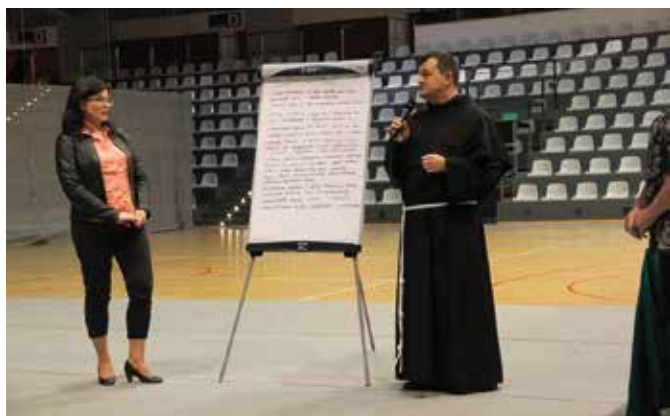
W prace nad zdefiniowaniem konkretnych problemów i propozycji działań w zakresie oświaty były zaangażowane różne grupy społeczne