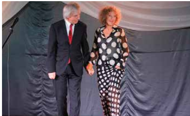
Alicja Majewska i Włodzimierz Korcz

Jest doskonale znana z takich przebojów jak: „Jeszcze się tam żagiel bieli”, „Odkryjemy miłość nieznaną”, „Być kobietą”, „To nie sztuka wybudować nowy dom”. Jej repertuar obfituje w piosenki znakomitych autorów, jak między innymi Wojciech Młynarski. Stałym współpracownikiem artystki jest Włodzimierz Korcz, doskonały pianista oraz jeden z najbardziej znanych kompozytorów piosenki polskiej, będący autorem wielu