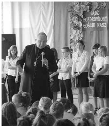
Zdjęcia wspomnieniowe z pobytu Śp. Biskupa Kazimierza Ryczana w gminie Chęciny