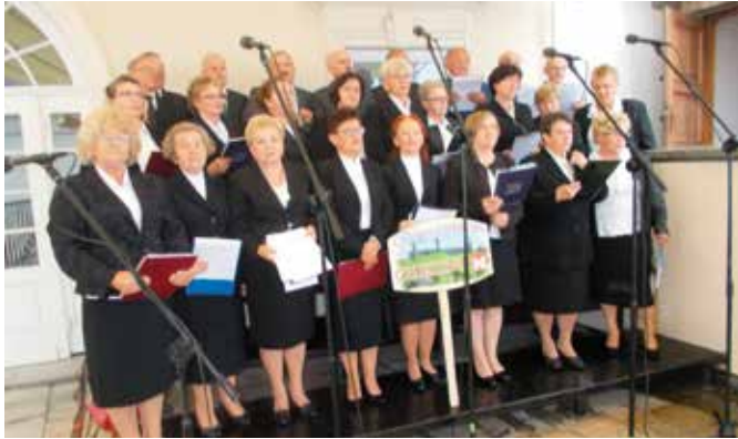
Grupa śpiewaczka z Chęciny zachwyciła swoim występem uczestników Dożynek na Jasnej Górze

ści. Ogromne zaangażowanie, jakie wykonawcy włożyli w występ, zaowocowało wieloma pozytywnymi opiniami i zachwyta- mi uczestników wydarzenia. Cała delegacja nie kryła radości i dumy z udziału w tak podniosłej uroczystości. Była to nie tylko wspaniała okazja do dziękowania za tegoroczne plony, ale także wyjątkowe doświadczenie wspólnoty jednoczącej się w modlitwie i dziękczynieniu.