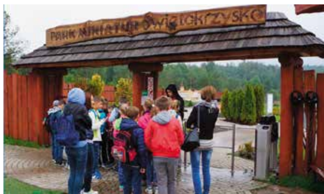
Uczestnicy wyjazdu zwiedzili m.in.: Park Miniatur

- zakup e-przewodników ze słuchawkami, umożliwiające samodzielne zwiedzanie, z treściami dostosowanymi do wieku,