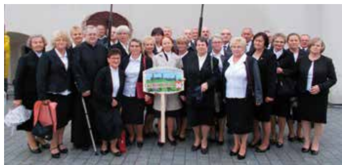
Wspólne zdjęcie grupy 27 śpiewaczy emerytów na Jasnej Górze

W tradycyjnych Dożynkach pod jasnogórskim szczytem udział wzięło około 50 tys. rolników z całego kraju, którzy przy-