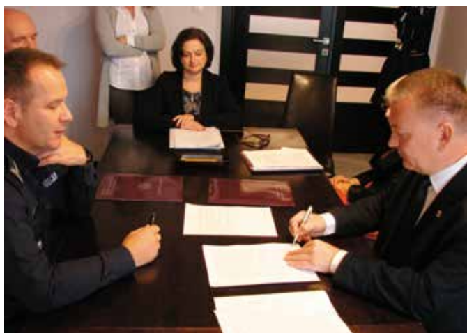
Podpisanie aktu notarialnego w sprawie przekazania działki pod budowę nowego Komisariatu Policji w Chęcinach