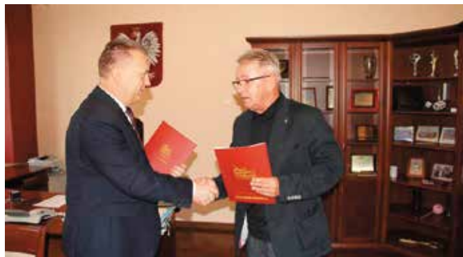
Wykonawcą remontu w Starochęcinach jest firma Usługi Instalacyjno-Budowlane „Kompens”

datkowo zostanie przebudowany budynek szkoły, a teren wokół niego będzie zagospodarowany. W ramach prac wydzielony zostanie punkt przedszkolny, a pomieszczenia części szkolnej zostaną przebudowane. Wymiany doczekają się też drzwi wewnętrzne i sanitariaty, a pomieszczenia sal lekcyjnych, klatki schodowej i piwnic zostaną całkowicie wyremontowane. Wydzielona będzie także kotłownia i wentylatorownia. Budynek szkoły zostanie dostosowany do wymogów przeciwpożarowych i sanitarno-epidemiologicznych. Przewidziano też rozbiórkę budynku gospodarczego i zbiornika na nieczystości ciekłe. Wybudowany będzie także zjazd z drogi wraz z chodnikiem. Wydzielone zostaną też miejsca parkingowe.