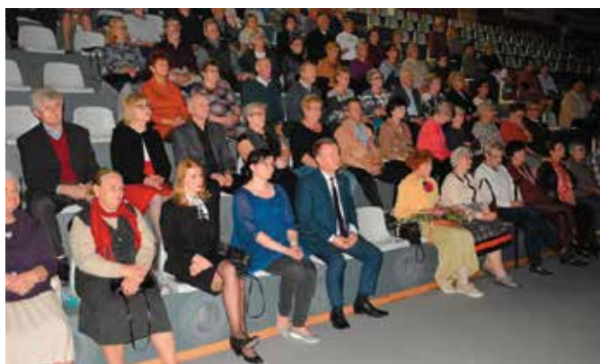
Publiczność zastuchana chłonęła piękne melodie

Zbiegieł, związany jest z krakowskim Teatrem Piosenki Francuskiej oraz z paryskim teatrem muzycznym "Essaion", występuje z dużym powodzeniem na scenach Polski, Francji, Niemiec. Jest laureatem nagród "Grand Prix de Colombe" - Francja, "Bursztynowy Słowik" - Sopot Festiwal. Zebrani mogli usłyszeć najpiękniejsze francuskie melodie. Były utwory mniej znane, ale też i te częściej słuchane z repertuaru znakomych wykonawców, takich jak Jaques Brel, Gilbert Becaud, Serge Reggiani, Serge Lama oraz Lara Fabian. Publiczność po niezapomnianym koncercie nagrodziła artystę gromkimi brawami. Po koncercie można było zwiedzić wystawę fotograficzną Małgorzaty Sajkiewicz-Kręt, która w mistrzowski sposób uchwyciła w swoich dziełach ulotne chwile.