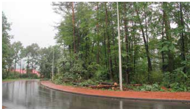
Po przycięciu drzew poprawiła się widoczność i bezpieczeństwo