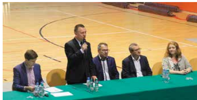
Gmina Chęciny jedyną z województwa świętokrzyskiego w pilotażowym projekcie oświatowym wspieranym przez ministerstwo

Miasto i Gmina Chęciny, jako jedna z zaledwie ośmiu gmin miejsko-wiejskich w kraju i jedyna gmina z województwa świętokrzyskiego zakwalifikowała się do pilotażowego projektu pn. „Wsparcie kadry jednostek samorządu terytorialnego w zarządzaniu oświatą ukierunkowanym na rozwój szkół i kompetencji kluczowych uczniów” realizowanego przez Ośrodek Rozwoju Edukacji w Warszawie na zlecenie Ministerstwa Edukacji Narodowej. To pierwszy krok w procesie tworzenia lokalnych planów podnoszenia jakości usług edukacyjnych na terenie kraju.