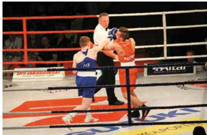
Niezapomniany, na światowym poziomie mecz bokserski Polska - Irlandia

Trzeba przyznać, że to była niezapomniana uczta dla wszystkich fanów boksu. W hali widowiskowo-sportowej „Pod Basztami” w Chęcinach odbyła się Światowa Konfrontacja Boks Olimpijskiego, którą przyszyły oglądać prawdziwe tłumy. Bokserskie widowisko w iście rycerskiej oprawie było transmitowane na żywo przez TVP Sport.