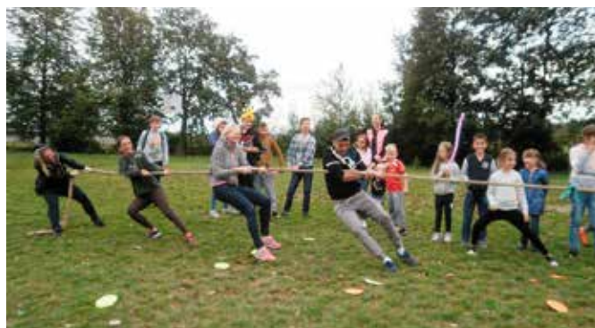
Radości i zabawy nie było końca podczas Święta Pieczonego Ziemniaka