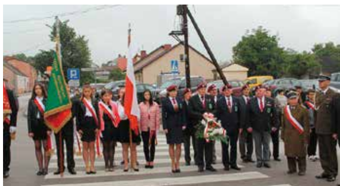
W uroczystości wzięli udział również samorządowcy, kombatanci, przedstawiciele Świętokrzyskiego Stowarzyszenia Byłych Żołnierzy Wojsk Powietrzno-Desantowych „Czerwone Berety” oraz młodzież szkolna