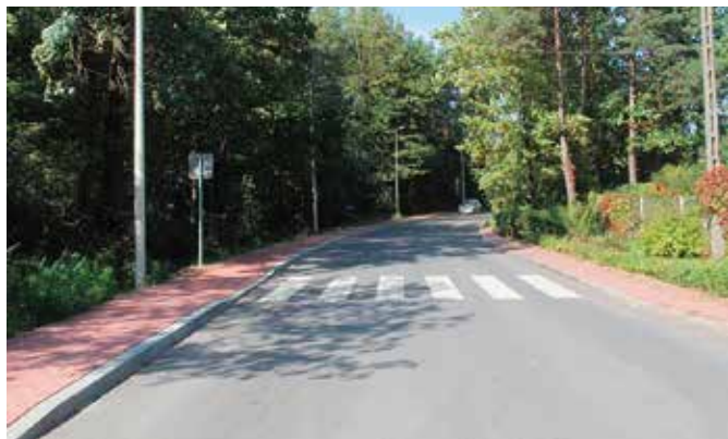
Droga w Czerwonej Górze po modernizacji z nowymi chodnikami