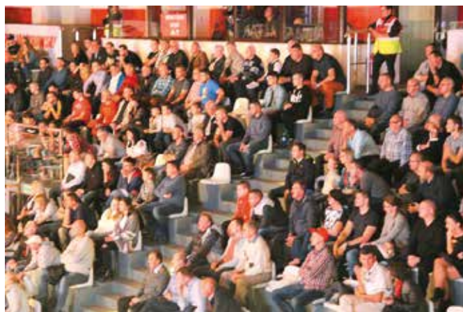
Mecz bokserski z Chęciny na żywo transmitowany był w TVP Sport