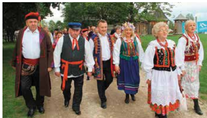
W Narodowym czytaniu w Skansenie wzięło udział wielu znanych osobistości ze świata kultury i samorządu

uwagi. W tym roku drogą internetowego głosowania wybrano do czytania ponadczasowy dramat Stanisława Wyspiańskiego „Wesele”.