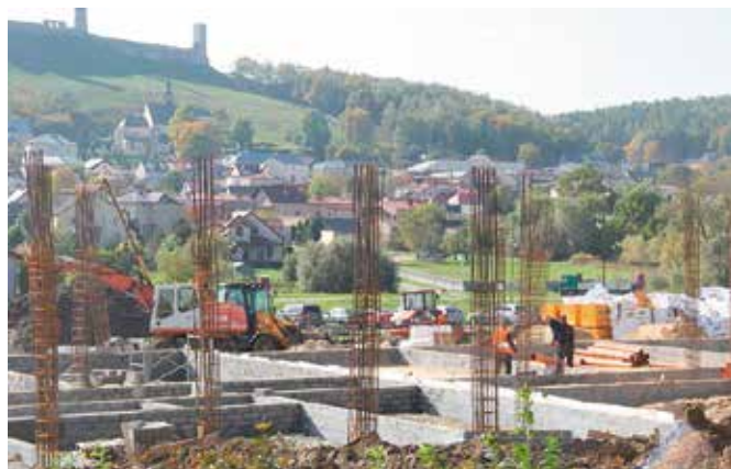
Trwają intensywne prace przy budowie przedszkola i żłobka w Chęcinach

Warto przypomnieć, że przedszkole i żłobek będą się mieścić w jednym nowoczesnym i energooszczędnym budynku, który ma być wybudowany na działce należącej do gminy, pomiędzy Ośrodkiem Zdrowia w Chęcinach a Schroniskiem Młodzieżowym. Na unijne dofinansowanie tej inwestycji władze Gminy i Miasta Chęciny złożyły dwa wnioski. Pierwszy z nich to wniosek o wsparcie budowy żłobka w Chęcinach z Regionalnego Programu Operacyjnego Województwa Świętokrzyskiego