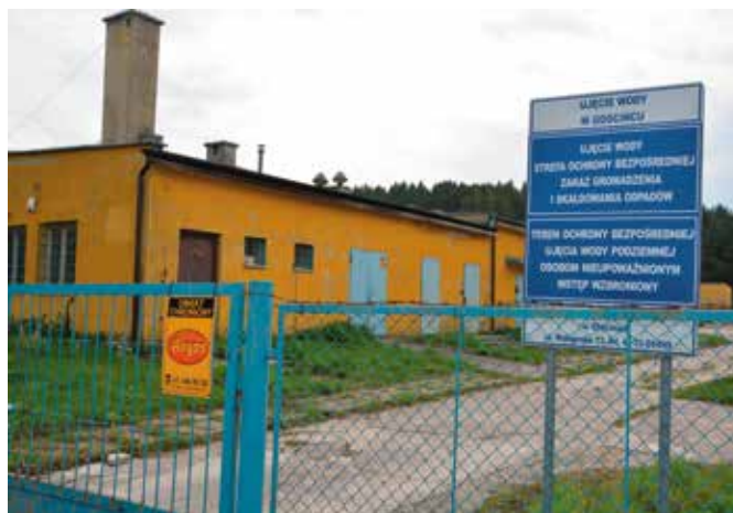
Miedzianka zostanie przyłączona do ujęcia w Gościńcu

Według projektu ma tu powstać ok. 1300 metrów nowego wodociągu i pompownia wody. Koszt inwestycji oszacowano na około dwa miliony złotych.