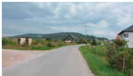
Trwa opracowanie dokumentacji na sieć kanalizacyjną ul. Zelejowa i Os. Zelejowa