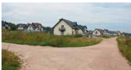
Osiedle w Skibach będzie miało nowe drogi

Wszystko wskazuje na to, że osiedle w Skibach stanie się jednym z atrakcyjnych miejsc do zamieszkania na terenie naszej Gminy. Nie tak dawno zakończono tu budowę wodociągu i kanalizacji. Teraz rozpoczęły się już kompleksowe prace projektowe opracowania dokumentacji technicznej. - Osiedle w Skibach jest jednym z większych osiedli powstających na terenie Gminy. Zakończyliśmy już obszerny zakres prac związanych z budową w tym miejscu sieci wodociągowej i kanalizacyjnej. Zależa-