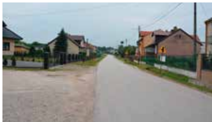
Chodnik od kościoła w kierunku świetlicy poprawi bezpieczeństwo w miejscowości Łukowa