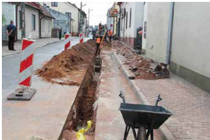
Kolejne odcinki sieci gazowej w Chęcinach