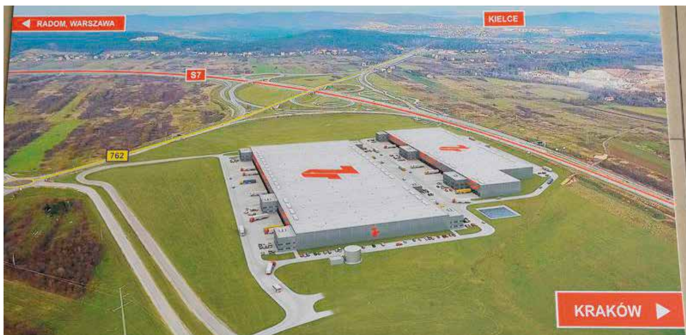
Wizualizacja powstającego Centrum Logistycznego w Chęcinach

Nareszcie jest ostateczne pozwolenie na budowę Centrum Logistycznego, jakie ma powstać na ponad 15-hektarowej działce przy trasie szybkiego ruchu i węźle Chęciny. Inwestycja, jak zapowiada inwestor będzie kosztować około 100 milionów złotych, da zatrudnienie setkom osób i wpływy z podatków do gminnego budżetu.