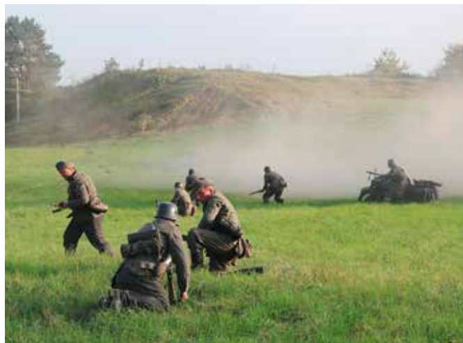
Rekonstrukcja walk z okresu II Wojny Światowej