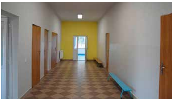
Odnowiona świetlica w Ostrowie

Jest kolorowa, funkcjonalna i przestronna – mowa o świetlicy w Ostrowie, która właśnie przeszła remont wewnątrz. Wymieniono tu posadzkę w sali sportowej, i instalację elektryczną, a pomieszczenia zostały odmalowane.