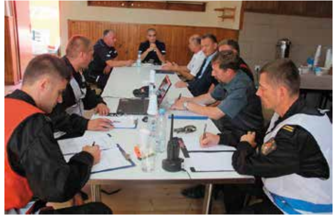
Spotkanie w ramach akcji Kryptonim „Droga Ekspresowa 2018”

Głównym celem ćwiczeń było określenie stanu przygotowania sił i środków Komendy Miejskiej PSP w Kielcach, Wojewódzkiego Odwołu Operacyjnego, Kieleckiej Kompanii Odwodowej oraz krajowego systemu ratowniczo - gaśniczego do działań ratowniczych podczas zdarzeń związanych z wypadkami w komunikacji drogowej, ratownictwem technicznym na drogach, ratownictwem chemicznym na drogach, ratownictwem medycznym, w ramach przygotowań do zabezpieczenia opera-