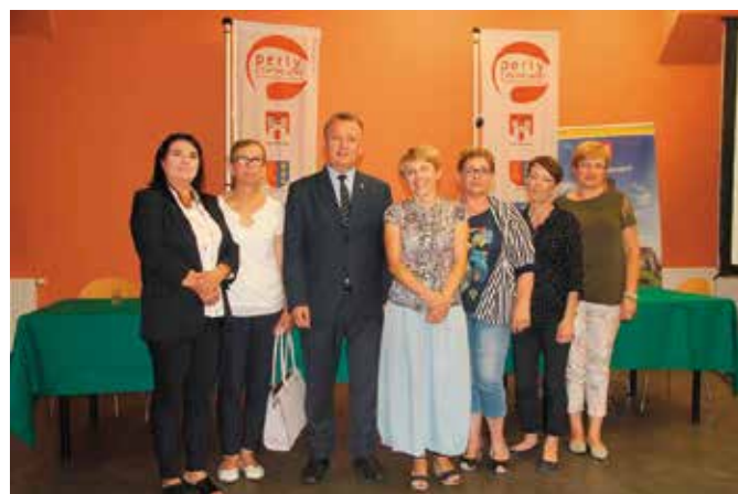
Stowarzyszenia i kościoły otrzymały wsparcie z LGD „Perły Czarnej Nidy”