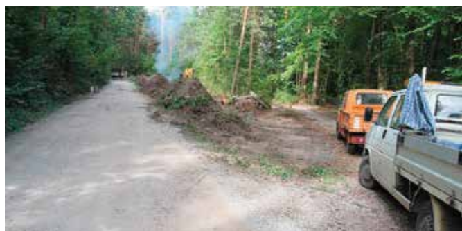
Prace przy przebudowie drogi już ruszyły

Rozpoczęły się prace przy rozbudowie ulicy Dobrzączka w Chęcinach. Powstająca droga ma połączyć Czerwoną Górę z miejscowością Szewce w gminie Sitkówka-Nowiny. Powstanie tu także nowy ciąg pieszo-rowerowy. Droga będzie miała długość ponad 600 metrów i będzie dofinansowana w ramach pozyskanego przez władze gminy Chęciny rządowego dofinansowania.