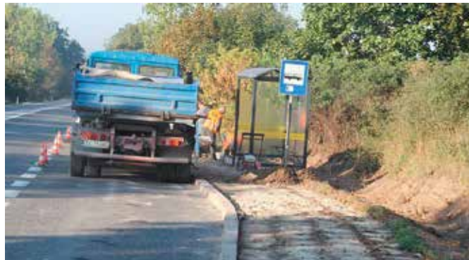
Wiaty przystankowe w Podzamczu Chęcińskim