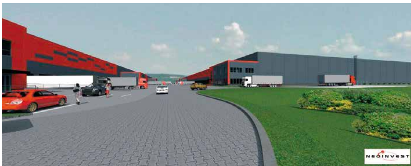
Wizualizacja powstającego Centrum Logistycznego w Chęcinach