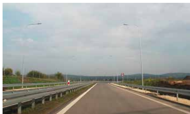
Oddano do korzystania z ruchu odcinek S7 Chęciny-Brzegi