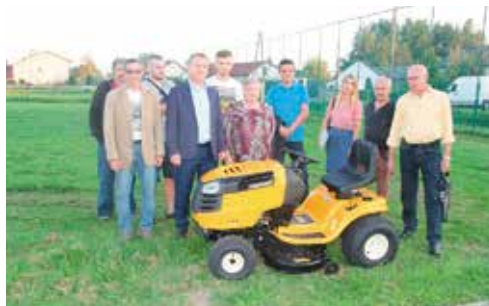
Nowe traktorki pomogą w utrzymaniu zieleni w Łukowej i Bolminie

Celem zakupu traktorków ma być poprawienie estetyki sołectwa Bolmin i sołectwa Łukowa poprzez dbanie o rozległe tereny zielone. - Traktorki z powodzeniem będą wykorzystywane do utrzymania porządku na terenach zielonych położonych przy