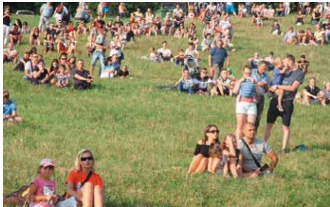
Piknik historyczny cieszy się dużym zainteresowaniem mieszkańców i turystów

Liczenie przybyła publiczność mogła zobaczyć widowiskowe potyczki wsparte efektami pirotechnicznymi. Ponadto, uczestnicy 11. Pikniku Historycznego mogli też porozmawiać z członkami grup rekonstrukcyjnych i zrobić pamiątkowe zdjęcie.