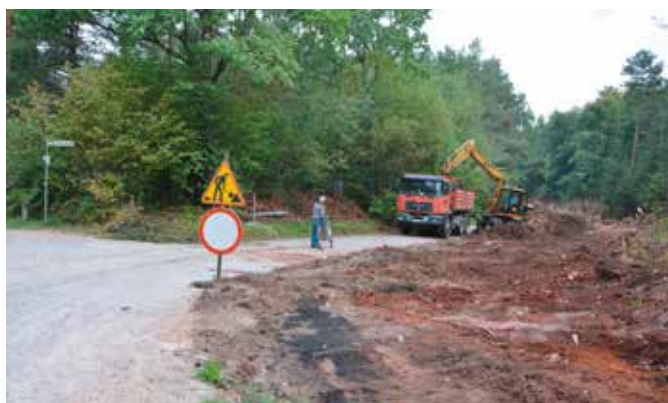
Trwają prace przy przebudowie ul. Dobrzączka

Wykonawcą generalnym inwestycji jest firma DUKT. Koszt zadania opiewa na kwotę 1 miliona 676 tysięcy złotych. Blisko 600 tysięcy złotych władze Gminy i Miasta Chęciny pozyskały z rządowego «Programu rozwoju gminnej i powiatowej infrastruktury drogowej na lata 2016 – 2019».