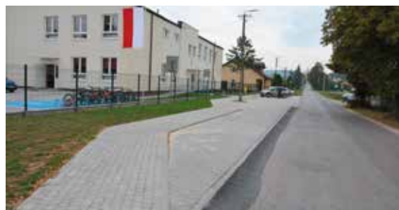
Przy SP w Starochęcinach powstała zatoka autobusowa