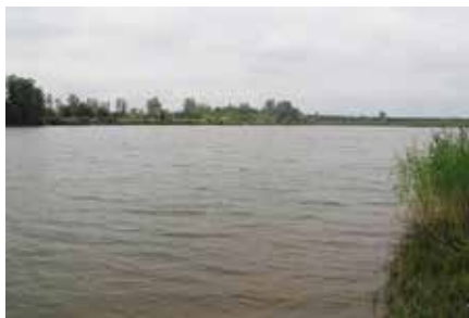
Zbiornik wodny w Lipowicy zostanie zagospodarowany na cele turystyczno-edukacyjne

Nie da się ukryć, że zalew w Lipowicy zachwyca swą niezwykłością przyrody i wielkim potencjałem edukacyjnym z tym związanym. Wyjątkowość tego miejsca sprawia, że coraz chętniej ludzie chcą tu już nie tylko wypoczywać na łonie natury, ale też inwestować i budować nieopodal zbiornika w Lipowicy swoje domy. - W ostatnim