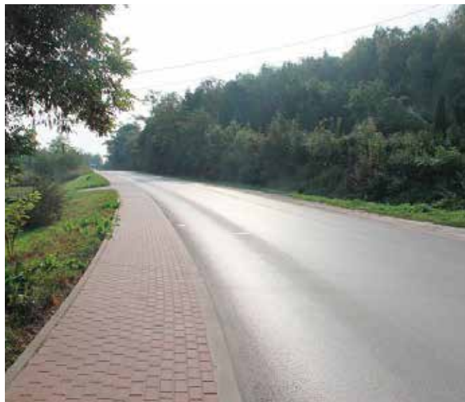
Wjazd do Chęci ulicą Radkowską rozwidni się i wypięknieje dzięki nowemu oświetleniu