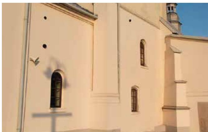
Nowe okna w kościele w Bolminie

Ruszyły prace związane z wymianą okien w kościele Parafii pw. Narodzenia N.M.P. w Bolminie. Przypomnijmy, że Parafia otrzymała na ten cel dofinansowanie za pośrednictwem Lokalnej Grupy Działania „Perły Czarnej Nidy” w ramach przedsięwzięć: „2.1.3 Zachowanie materialnego dziedzictwa lokalnego”, poddziałanie „Wsparcie na wdrażanie operacji w ramach strategii rozwoju lokalnego kierowanego przez społeczność”