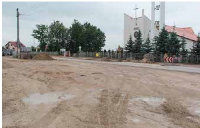
Nowy parking nie tylko poprawi bezpieczeństwo, ale także zmieni wizerunek Wolicy

- W lipcu tego roku otrzymaliśmy odpowiedź od PKP S.A. o możliwości zbycia nieruchomości na rzecz naszej gminy. To dobra wiadomość. PKP jest spółką handlową i działa na podstawie przepisów prawa handlowego. W praktyce oznacza to, że nie może przekazać działki za darmo. Po przeprowadzonym postępowaniu będziemy mieli możliwość nabycia gruntów pod