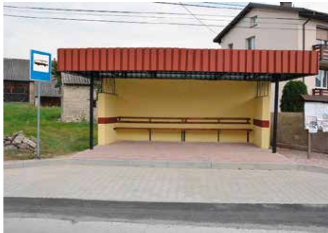
Zmodernizowana wiata przystankowa w Ostrowie