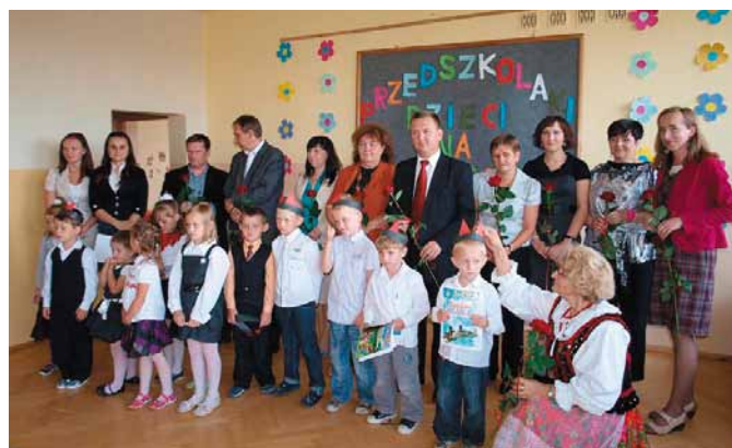
Oddział Przedszkolny w Łukowej