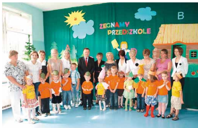
Oddział Przedszkolny w Polichnie