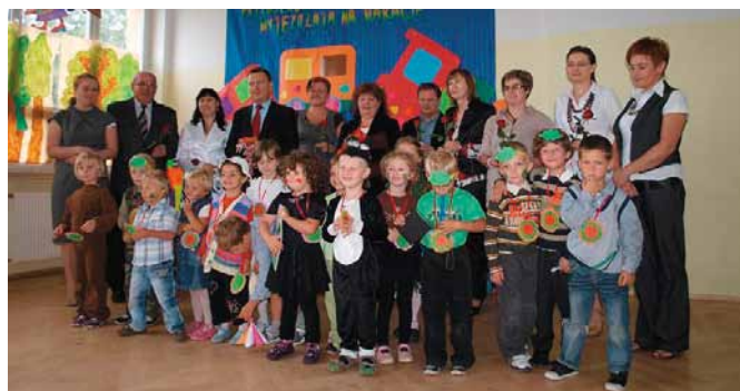
Oddział Przedszkolny w Tokarni