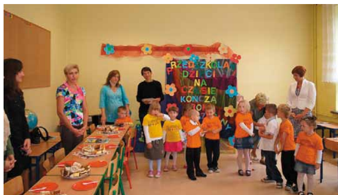
Oddział Przedszkolny w Starościanach