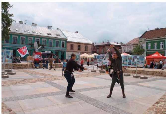
Rycerze podczas walki