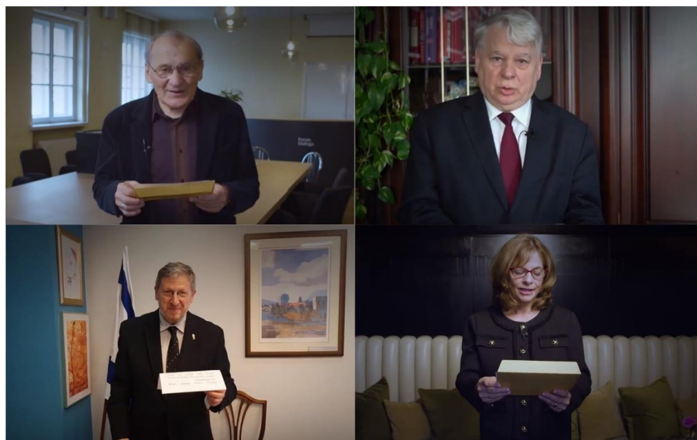
Mówcy podczas Gali Online Szkoły Dialogu 2019.

Forum Dialogu już od 12 lat wspiera uczniów szkół podstawowych i ponadpodstawowych w poszukiwaniu osobistych losów członków dawnych społeczności żydowskich w ich miejscowościach. Grupy projektowe uczestniczące w programie Szkoła Dialogu odkrywają często zapomnianą lokalną historię i kulturę żydowską, a następnie poprzez różnorodne działania prezentują zdobytą wiedzę innym mieszkańcom. W związku z zagrożeniem epidemiologicznym chorobą COVID-19 uroczyste podsumowanie realizacji programu w 2019 roku, a zarazem uhonorowanie uczestników i uczestniczek oraz podziękowanie za ich ciężką pracę, odbyło się w formie online 17 kwietnia 2020 roku.